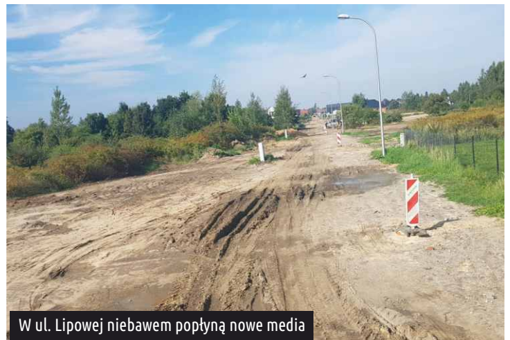
W ul. Lipowej niebawem popłyną nowe media

W ulicach: Lipowej, Uroczej i Wiosennej dobiega końca inwestycja dotycząca budowy sieci wodno-kanalizacyjnej.