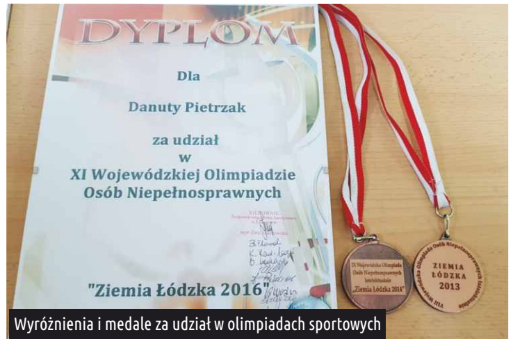
Wyróżnienia i medale za udział w olimpiadach sportowych

Jeszcze kilka lat temu brałam udział w corocznych Olimpiadach Osób Niepełnosprawnych. Pchałam kulą i rzucałam piłką palantową. Byłam nawet na podium! Niestety, lat przybywa dlatego musiałam zrezygnować z uczestnictwa w zawodach.