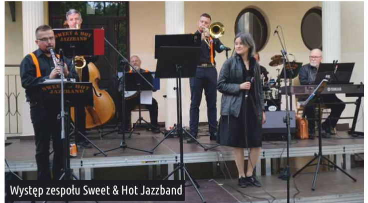
Występ zespołu Sweet &amp; Hot Jazzband