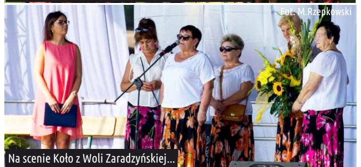
Na scenie Koło z Woli Zaradzyńskiej...