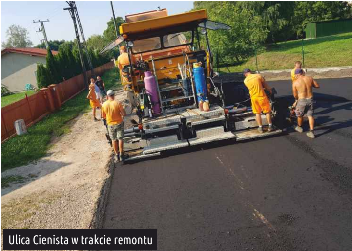
Ulica Cienista w trakcie remontu

W ulicach: Cienistej, Spacerowej, Mickiewicza, Jęczmiennej oraz na odcinku ul. Uroczej położono nowe nawierzchnie asfaltowe. Kolejnym miejscem "pod nakładkę" będzie plac przy cmentarzu w Ksawerowie. Jeszcze w tym roku wyremontowane zostaną kolejne drogi: Skromna, Krótka, Północna, Poziomkowa oraz Malinowa (w której położone zostaną płyty typu JOMB).