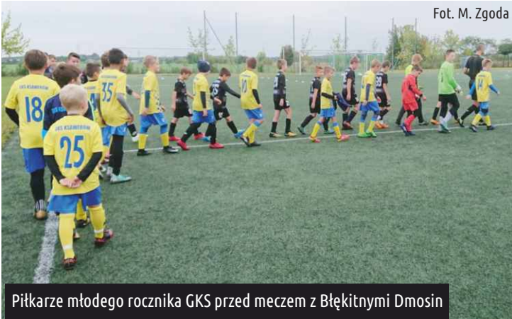
Piłkarze młodego rocznika GKS przed meczem z Błękitnymi Dmosin