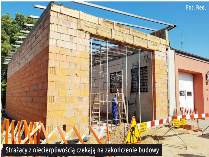
Strażacy z niecierpliwością czekają na zakończenie budowy