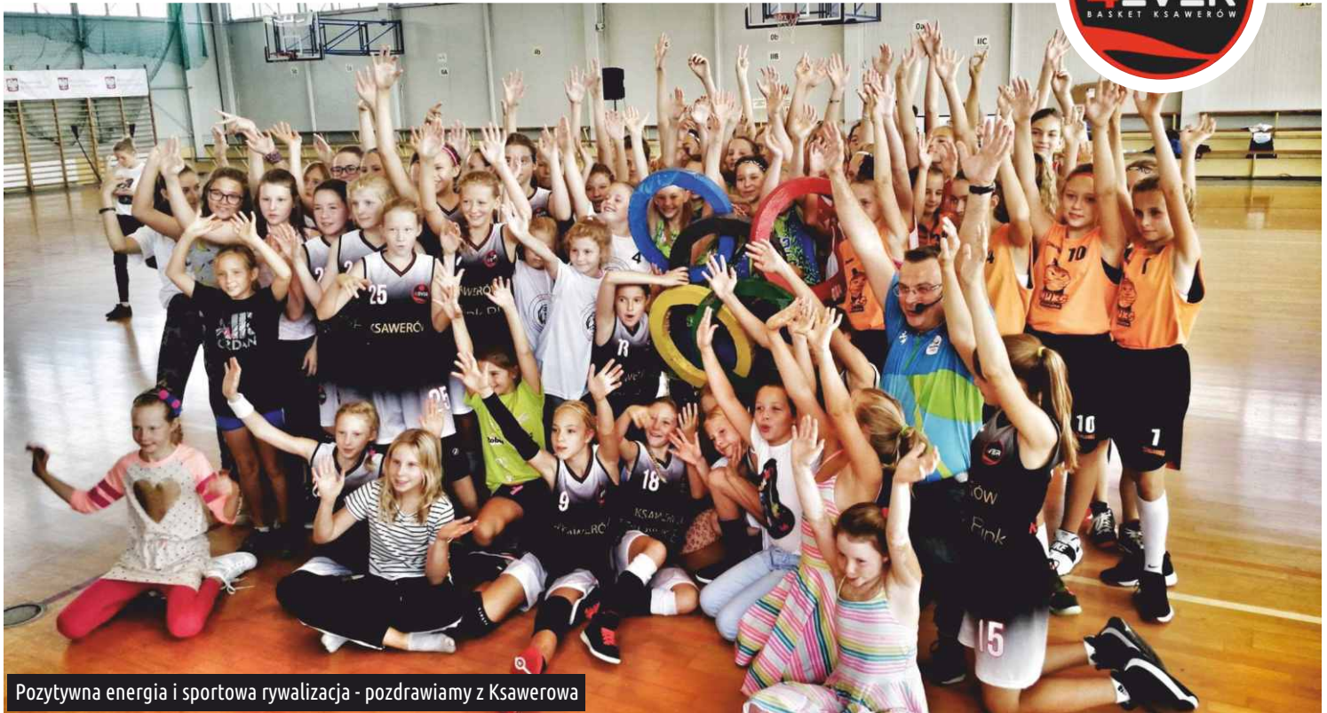
Pozytywna energia i sportowa rywalizacja - pozdrawiamy z Ksawerowa

W dniach 14-16 września w hali sportowej ksawerowskiej podstawówki, odbył się I Festiwal Mistrzów Koszykówki. Imprezę, przy wsparciu Ministerstwa Sportu i Turystyki oraz gminy Ksawerów, zorganizował klub Atlas Ksawerów we współpracy z Basket4EVER Ksawerów.