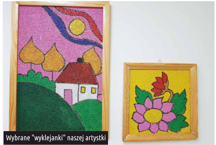
Wybrane "wyklejanki" naszej artystki

Najczęściej kilka tygodni. Wszystko zależy od tego jak duży ma być obraz, ile kolorów bibuły będzie użytych w pracy oraz jak bardzo złożony jest szkic. Tak jak mówiłam, przygotowanie obrazka wymaga dużo staranności. Kiedyś przypadkiem spróbowałam "wyklejanek" z bibuły i tak już zostało. Uwielbiam to robić, to moja pasja. W przerwach między wyklejaniem koloruję także malowanki - oczywiście te bardziej skomplikowane, dla osób dorosłych. Takie prace manualne bardzo odprężają i są niezłą gimnastyką dla rąk.