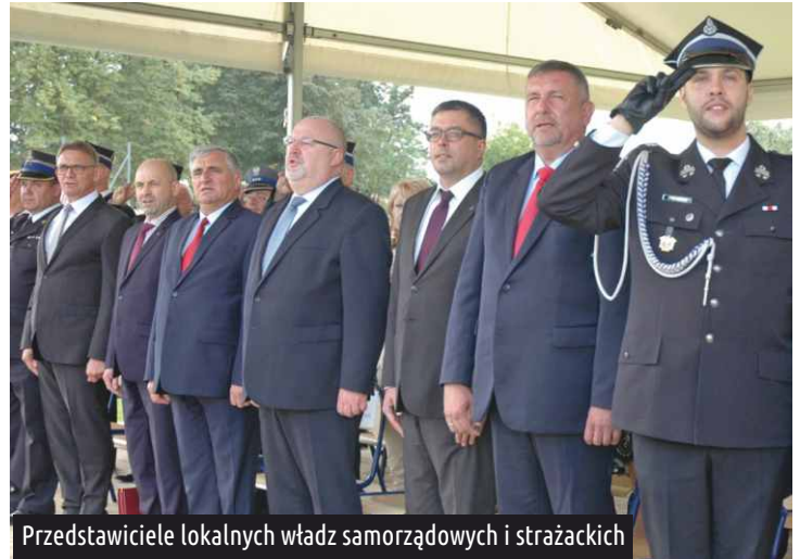
Przedstawiciele lokalnych władz samorządowych i strażackich