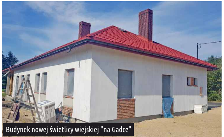
Budynek nowej świetlicy wiejskiej "na Gadce"

Na budowie świetlicy wiejskiej w Nowej Gadce ocieplono zewnętrzną elewację. Aktualnie trwają prace wykończeniowe wewnątrz budynku. Świetlica która powstaje w miejscu dawnego Domu Rolnika będzie budynkiem parterowym, z wydzieloną salą główną w której tak jak przed laty, będą organizowane spotkania mieszkańców. Wykonany zostanie funkcjonalny aneks kuchenny, pomieszczenie socjalne, pomieszczenie higieniczno-sanitarne (WC oraz WC dla osób niepełnosprawnych), a także pomieszczenie techniczne. Nowy budynek będzie dostosowany do potrzeb osób niepełnosprawnych poprzez pochylnię zlokalizowaną przy wejściu głównym. Gotowa inwestycja powinna zostać oddana już w przyszłym miesiącu.