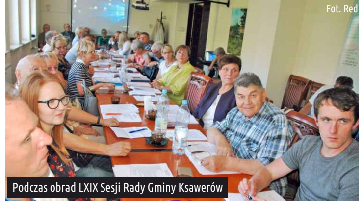
Podczas obrad LXIX Sesji Rady Gminy Ksawerów