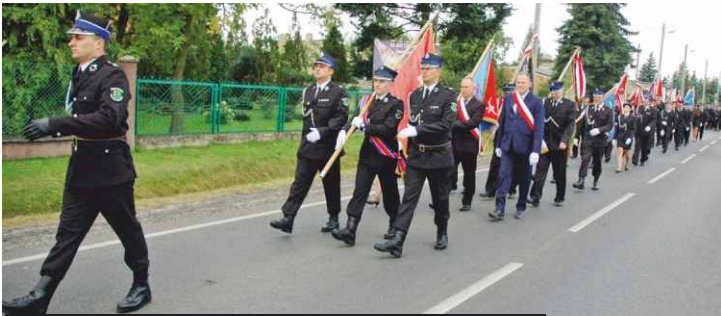
Przemarsz strażaków i pocztów sztandarowych do kościoła

Podczas oficjalnej części ceremonii radni gminy Ksawerów uhonorowali jednostkę OSP tytułem "Zasłużony dla gminy", a Zakłady Lotnicze nr 1 w Łodzi przekazały odrestaurowany ok. 100-letni zabytkowy, parowy wóz strażacki.