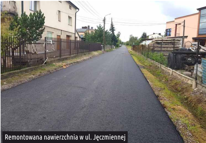
Remontowana nawierzchnia w ul. Jęczmiennej

Udało się wyremontować drugi odcinek powiatowej części ul. Wschodniej , (od ul. Bednarskiej do ul. Żeromskiego). Równa nawierzchnia, chodnik i ścieżka rowerowa cieszą oko mieszkańców. W ulicy założony został również próg zwalniający.