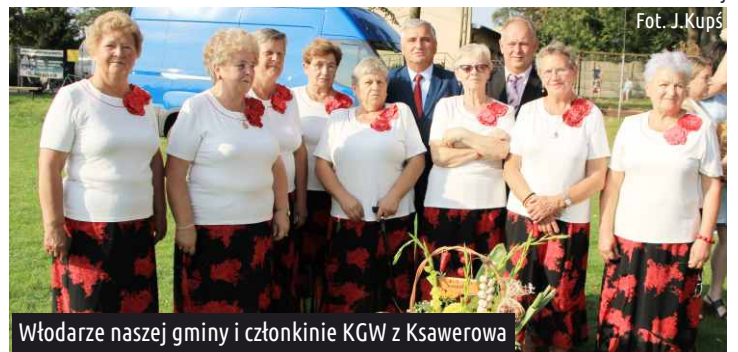
Władarze naszej gminy i członkinie KGW z Ksawerowa