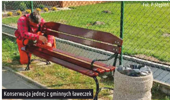
Konserwacja jednej z gminnych ławeczek