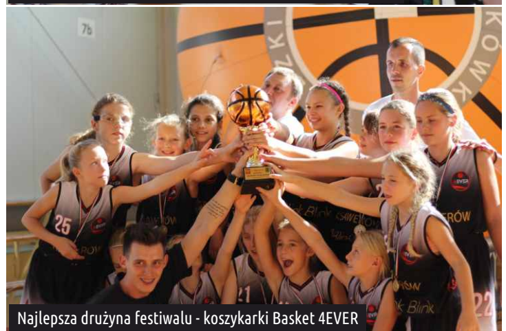
Najlepsza drużyna festiwalu - koszykarki Basket 4EVER