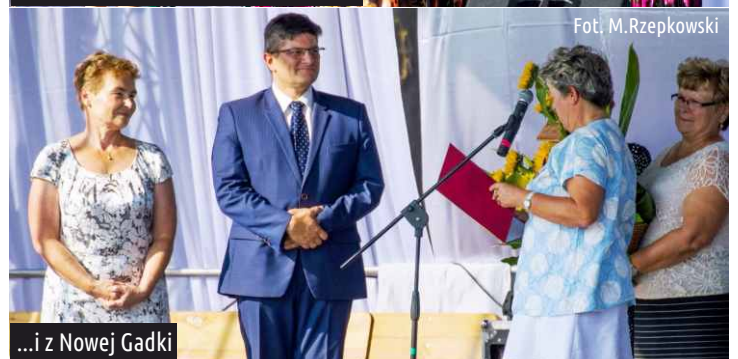
...i z Nowej Gadki