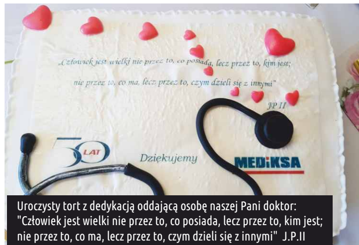
Uroczysty tort z dedykacją oddającą osobę naszej Pani doktor: "Człowiek jest wielki nie przez to, co posiada, lecz przez to, kim jest; nie przez to, co ma, lecz przez to, czym dzieli się z innymi" J.P.II