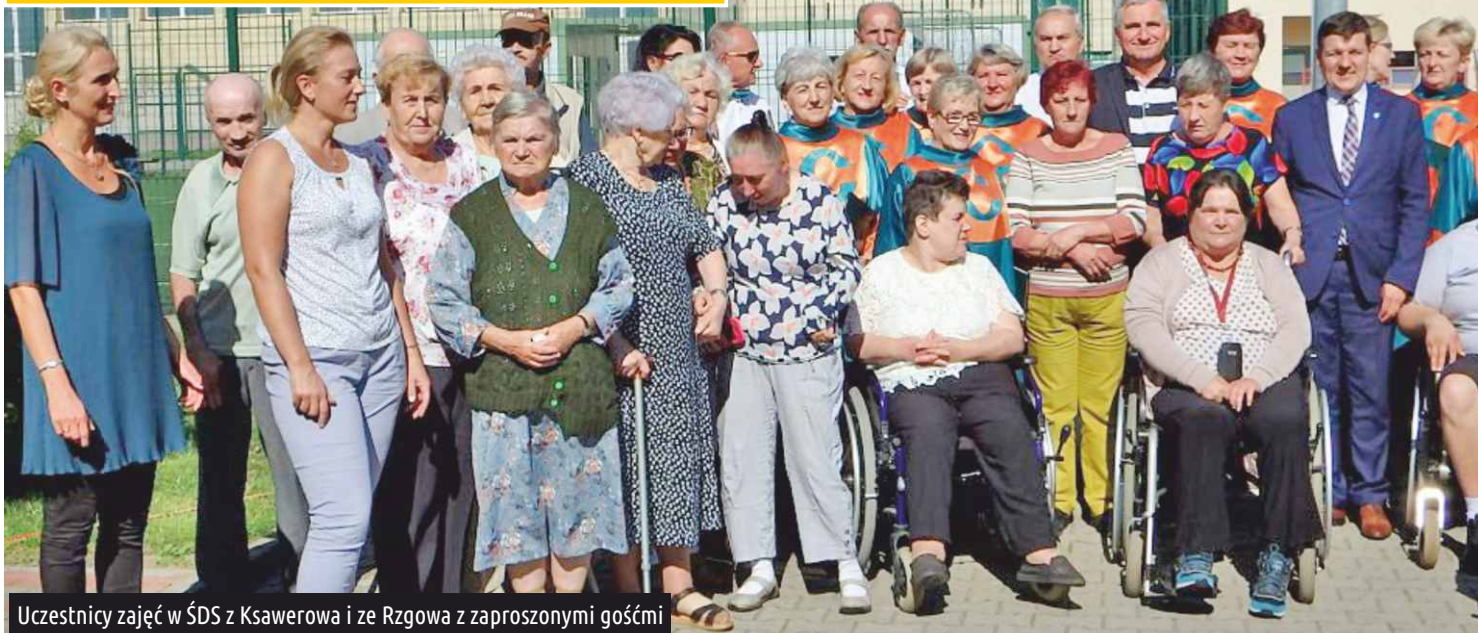
Uczestnicy zajęć w ŚDS z Ksawerowa i ze Rzgowa z zaproszonymi gośćmi

W środę 19 września, uczestnicy Środowiskowego Domu Samopomocy w Ksawerowie i mieszkańcy Rzgowa, bawili się na integracyjnym pikniku zorganizowanym pod patronatem burmistrza Rzgowa Mateusza Kamińskiego.