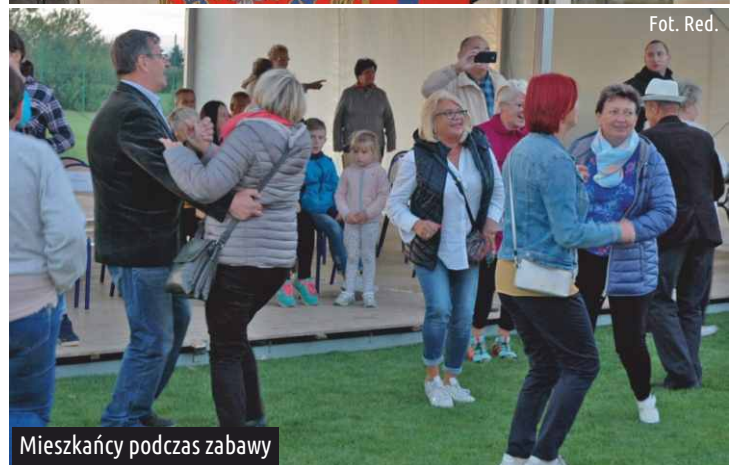
Mieszkańcy podczas zabawy