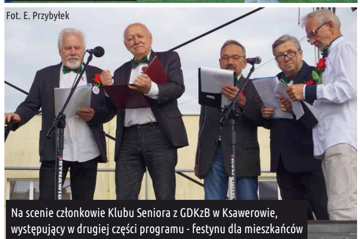
Na scenie członkowie Klubu Seniora z GDKzB w Ksawerowie, występujący w drugiej części programu - festynu dla mieszkańców