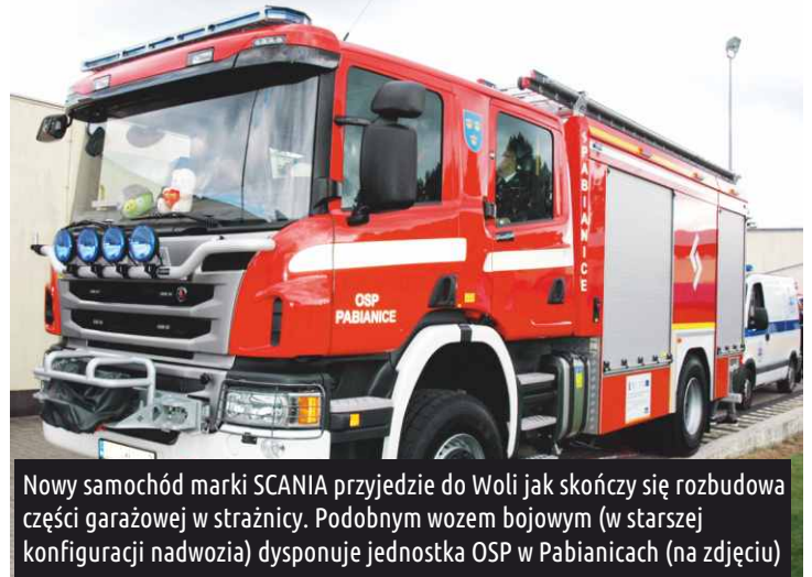
Nowy samochód marki SCANIA przyjedzie do Woli jak skończy się rozbudowa części garażowej w strażnicy. Podobnym wozem bojowym (w starszej konfiguracji nadwozia) dysponuje jednostka OSP w Pabianicach (na zdjęciu)