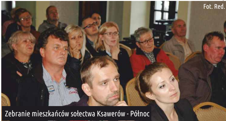
Zebranie mieszkańców sołectwa Ksawerów - Północ