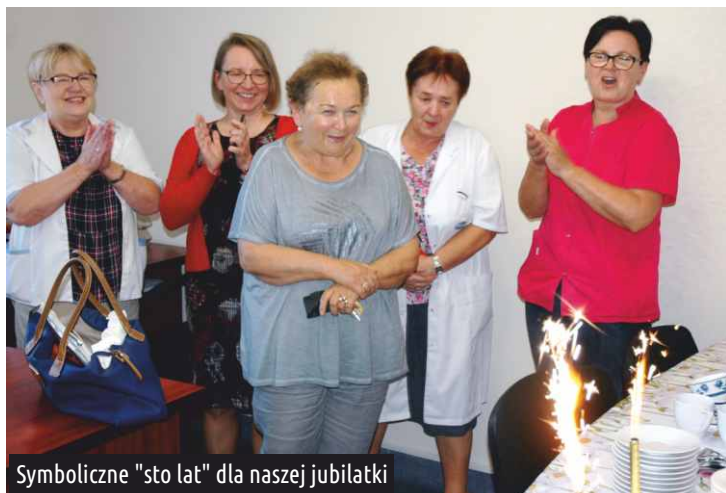
Symboliczne "sto lat" dla naszej jubilatki