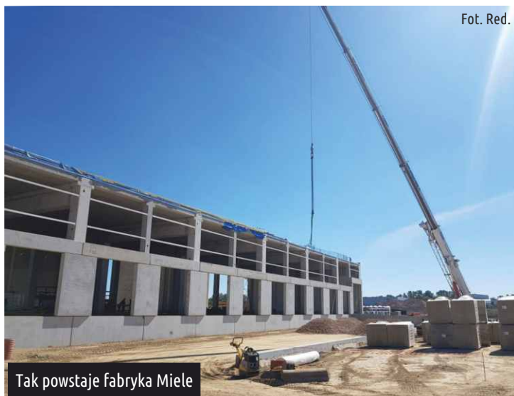
Tak powstaje fabryka Miele

Ruszyła rekrutacja pracowników na tzw. "wyższe szczeble", którzy znajdą zatrudnienie w nowoczesnej fabryce pralek. Jeszcze jesienią tego roku rozpocznie się nabór na stanowiska produkcyjne. Z otrzymanej podczas sesji informacji wynika, że pierwsze rozmowy kwalifikacyjne mogą być przeprowadzane już w nowym budynku fabryki przy ul. Miele. Ogłoszenia rekrutacyjne można śledzić na stronie www.miele.dricon.pl