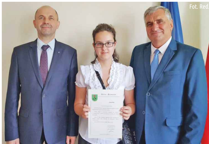
Nasi stypendyści z władzami gminy oraz najbliższymi