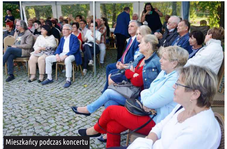
Mieszkańcy podczas koncertu