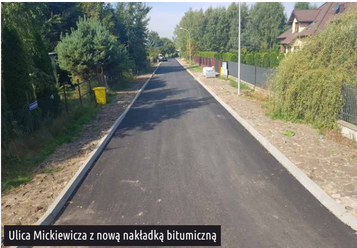
Ulica Mickiewicza z nową nakładką bitumiczną