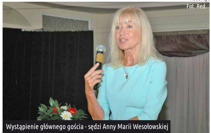
Wystąpienie głównego gościa - sędzi Anny Marii Wesołowskiej