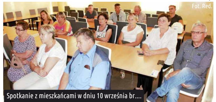
Spotkanie z mieszkańcami w dniu 10 września br....