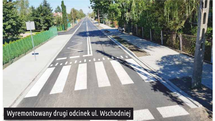
Wyremontowany drugi odcinek ul. Wschodniej

Udało się wyremontować drugi odcinek powiatowej części ul. Wschodniej , (od ul. Bednarskiej do ul. Żeromskiego). Równa nawierzchnia, chodnik i ścieżka rowerowa cieszą oko mieszkańców. W ulicy założony został również próg zwalniający.