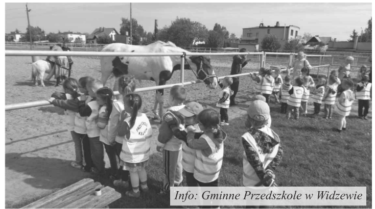
Info: Gminne Przedszkole w Widzewie

Dzieci otrzymały symboliczne upominki a Przedszkole Sióstr Karmelitanek obdarowało wszystkie dzieci słodyczkami.