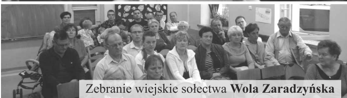
Zebranie wiejskie sołectwa Wola Zaradzyńska