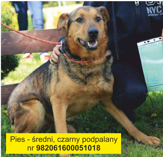
Pies - średni, czarny podpalany nr 982061600051018