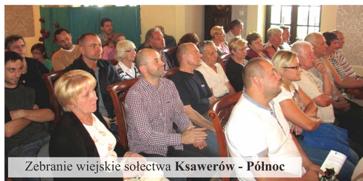
Zebrań wiejskie sołectwa Ksawerów - Północ