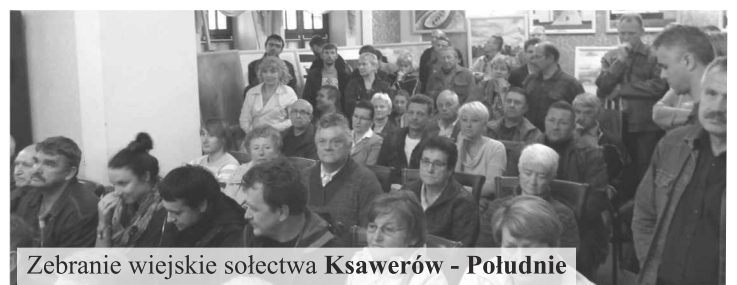
Zebranie wiejskie sołectwa Ksawerów - Południe