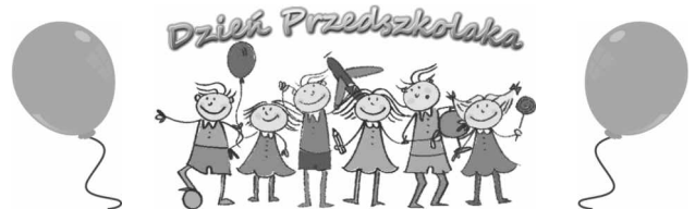
Info: Szkoła Podstawowa z oddziałami przedszkolnymi w Woli Zaradzyńskiej

Pani dyrektor w imieniu wszystkich dorosłych złożyła dzieciom gorące życzenia, nie zapominając o słodkim upominku dla każdego przedszkolaka. Były tańce i zabawy w rytm dziecięcych hitów. Na pożegnanie każdy uczestnik otrzymał kolorowy balonik.