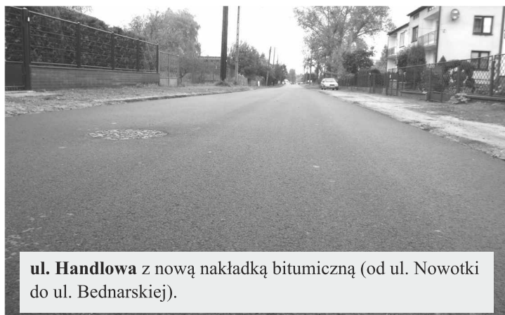
ul. Handlowa z nową nakładką bitumiczną (od ul. Nowotki do ul. Bednarskiej).

W tym roku planowane jest wykonanie ekologicznego placu zabaw dla najmłodszych mieszkańców przy Szkole Podstawowej w Ksawerowie, montaż oświetlenia w ulicy Orzechowej i Chmielnej, oraz ogłoszenie przetargu nieograniczonego na