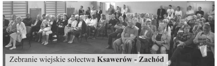
Zebranie wiejskie sołectwa Ksawerów - Zachód