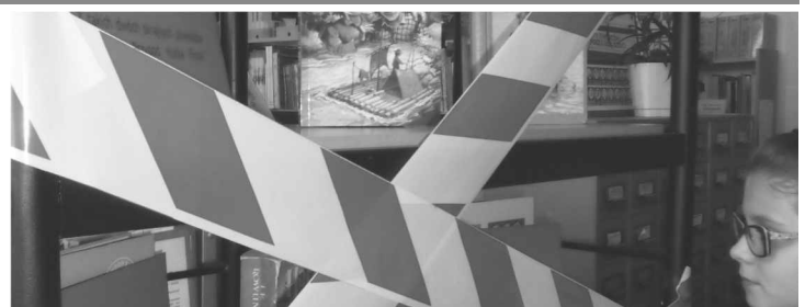
Info: Szkoła Podstawowa z oddziałami przedszkolnymi w Woli Zaradzyńskiej

Na specjalnym regale pojawiły się książki, które z różnych przyczyn były zabronione i nie można było ich czytać. Na oznaczonych czerwoną taśmą półkach stał Czerwony Kapturek zakazany w kiedyś w Kalifornii, z powodu butelki wina w koszyczku oraz Przygody Hucka Finna, uznane za zbyt rasistowskie i zbyt tolerancyjne jednocześnie.