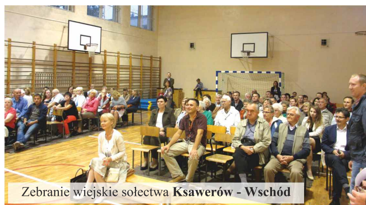
Zebrań wiejskie sołectwa Ksawerów - Wschód