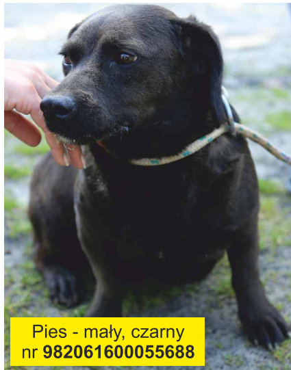
Pies - mały, czarny nr 982061600055688