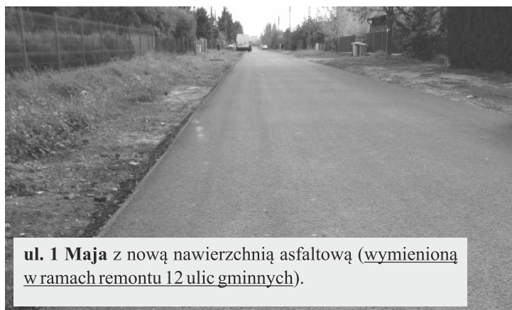
ul. 1 Maja z nową nawierzchnią asfaltową ( wymienioną w ramach remontu 12 ulic gminnych ).