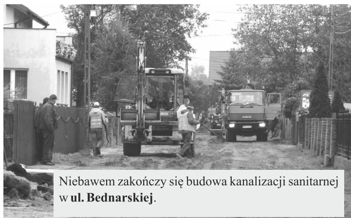
Niebawem zakończy się budowa kanalizacji sanitarnej w ul. Bednarskiej .