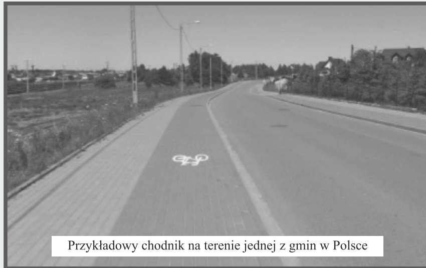
Przykładowy chodnik na terenie jednej z gmin w Polsce

Np. budowa bezpiecznego chodnika ze ścieżką rowerową w ul. Wschodniej