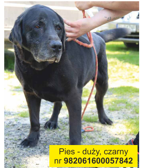
Pies - duży, czarny nr 982061600057842