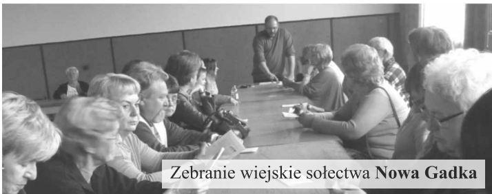
Zebranie wiejskie sołectwa Nowa Gadka