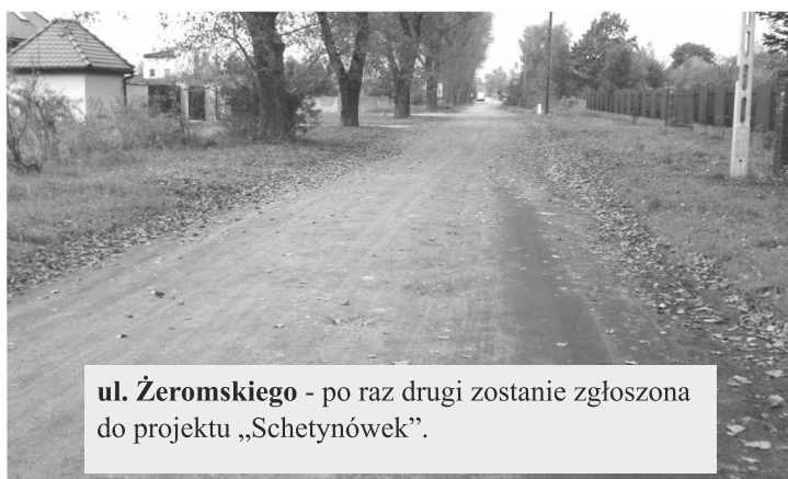
ul. Żeromskiego - po raz drugi zostanie zgłoszona do projektu „Schetynówek”.