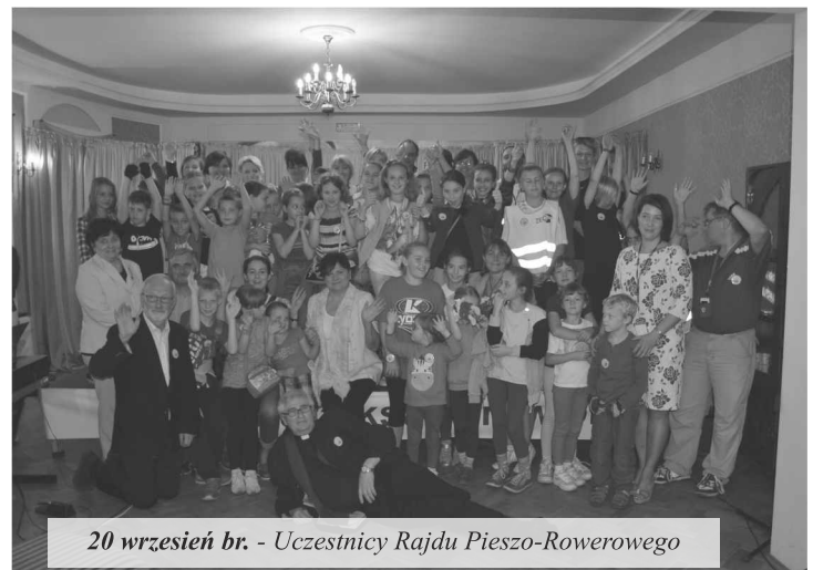
20 wrzesień br. - Uczestnicy Rajdu Pieszno-Rowerowego

Zapraszamy na naszą stronę internetową www.kultura-ksawerow.pl