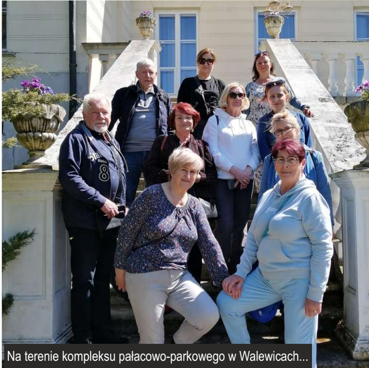
Na terenie kompleksu pałacowo-parkowego w Walewicach...

W maju br. na terenie kompleksu pałacowo-parkowego w Walewicach seniorzy z województwa łódzkiego ustanowili nowy rekord Polski w jednoczesnym sianiu łąki kwietnej. W rekordowej grupie 393 osób byli również seniorzy z Gminnego Klubu Seniora w Ksawerowie. Gratulujemy!