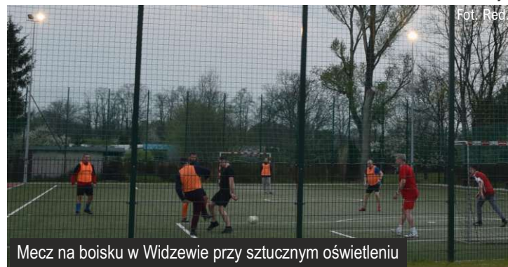
Mecz na boisku w Widzewie przy sztuczным oświetleniu