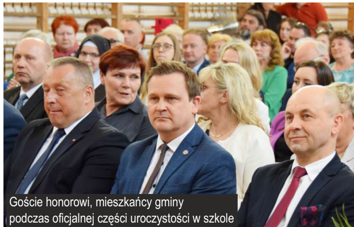
Goście honorowi, mieszkańcy gminy podczas oficjalnej części uroczystości w szkole