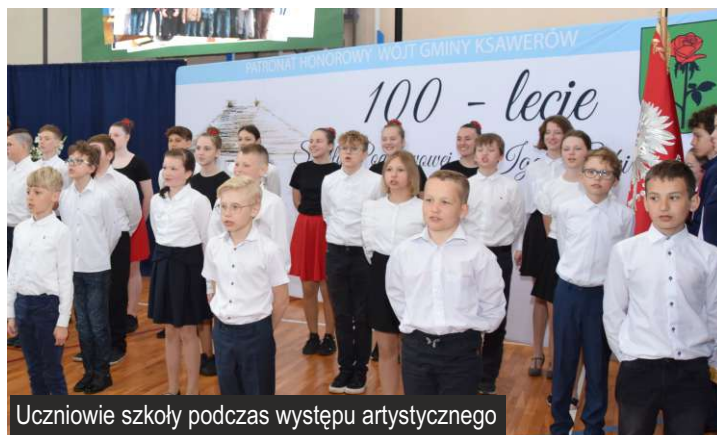
Uczniowie szkoły podczas występu artystycznego