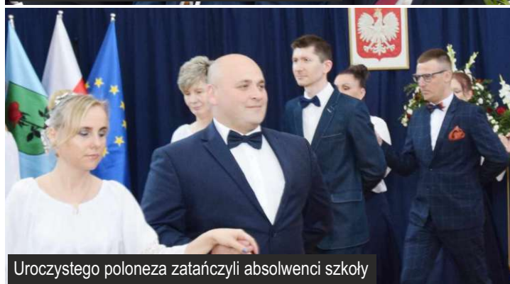
Uroczystego poloneza zatańczyli absolwenci szkoły