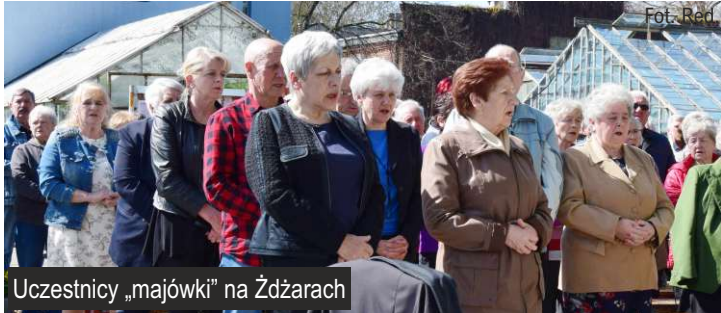
Uczestnicy „majówki” na Żdżarach

Parafia Matki Boskiej Częstochowskiej w Ksawerowie / Redakcja