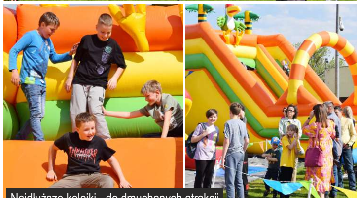
Najdłuższe kolejki - do dmuchanych atrakcji