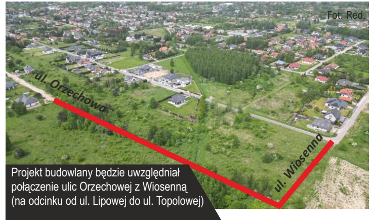
Projekt budowlany będzie uwzględniał połączenie ulic Orzechowej z Wiosenną (na odcinku od ul. Lipowej do ul. Topolowej)