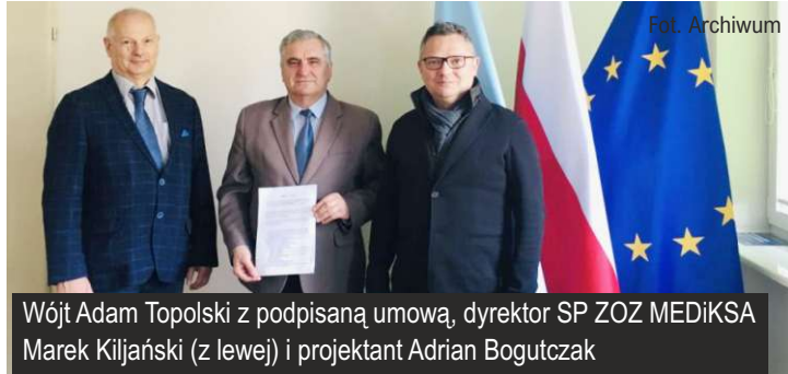
Referat Zamówień Publicznych i Środków Zewnętrznych

Na sporządzenie dokumentacji oraz uzyskanie ostatecznych decyzji administracyjnych niezbędnych do uzyskania pozwolenia na budowę, uzyskanie ostatecznej decyzji pozwolenia na budowę, wykonawca będzie miał 8 miesięcy od dnia podpisania umowy.