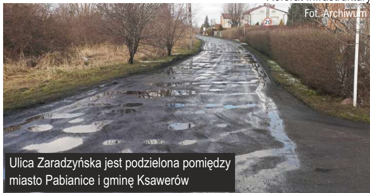
Ulica Zaradzyńska jest podzielona pomiędzy miasto Pabianice i gminę Ksawerów