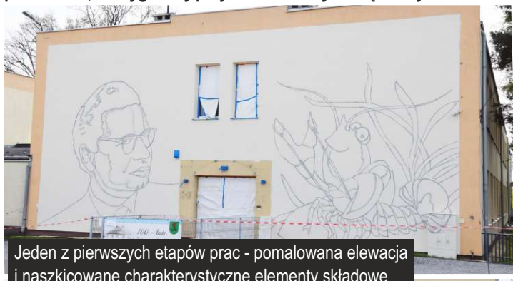
Jeden z pierwszych etapów prac - pomalowana elewacja i naszkicowane charakterystyczne elementy składowe