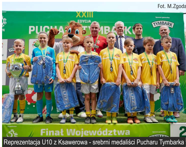
Reprezentacja U10 z Ksawerowa - srebrni medaliści Pucharu Tymbarka

Oba zespoły wygrały swoje eliminacje powiatowe i awansowały do finałów Wojewódzkich. Starsi chłopcy zakończyli finały na etapie rozgrywek grupowych, natomiast młodszy piłkarze - nie dość, że wyszli z grupy - to jeszcze zagraли w wielkim finale swojej kategorii wiekowej na głównej płycie Stadionu Łódzkiego Klubu Sportowego. Niestety, w finałowym meczu musieli uznać wyższość rówieśników ze Szkoły Sportowej Marcina Gortata, która zrewanżowała się za ubiegłoroczną porażkę z drużyną rocznika 2010 z Ksawerowa.