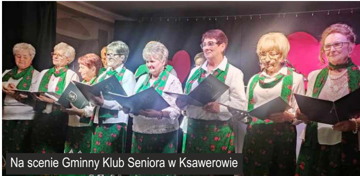
Na scenie Gminny Klub Seniora w Ksawerowie