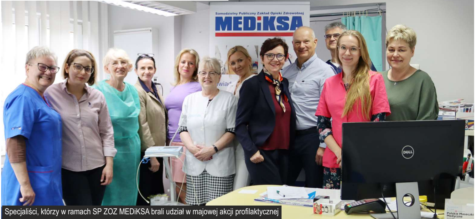
Specjaliści, którzy w ramach SP ZOZ MEDiKSA brali udział w majowej akcji profilaktycznej

20 maja br. mieszkańcy gminy wzięli udział w akcji profilaktycznej „Biała Sobota” organizowanej cyklicznie na naszym terenie. Chętnych, którzy mogli wykonać bezpłatne badania, jak zwykle nie brakowało.