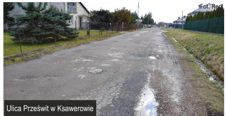
Ulica Prześwit w Ksawerowie