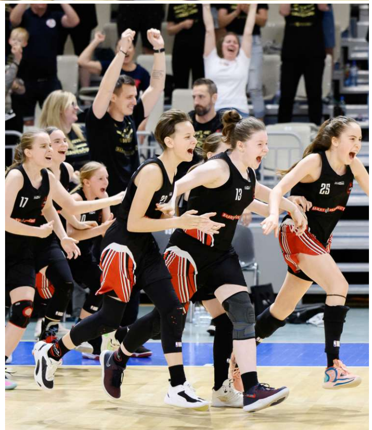
Radość koszykarek Basket 4EVER Ksawerów po ostatnim gwizdku sędziego w meczu o brązowy medal Młodzieżowych Mistrzostw Polski 2023