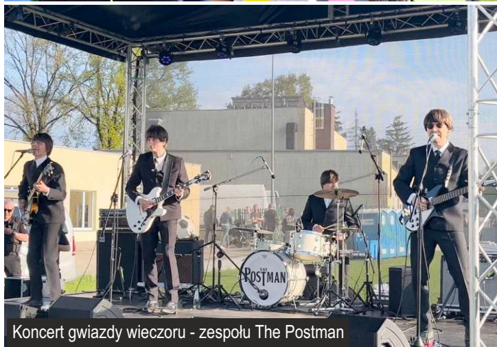
Koncert gwiazdy wieczoru - zespołu The Postman