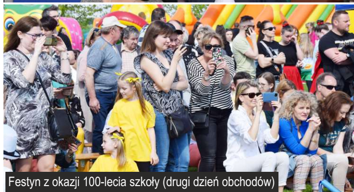
Festyn z okazji 100-lecia szkoły (drugi dzień obchodów)