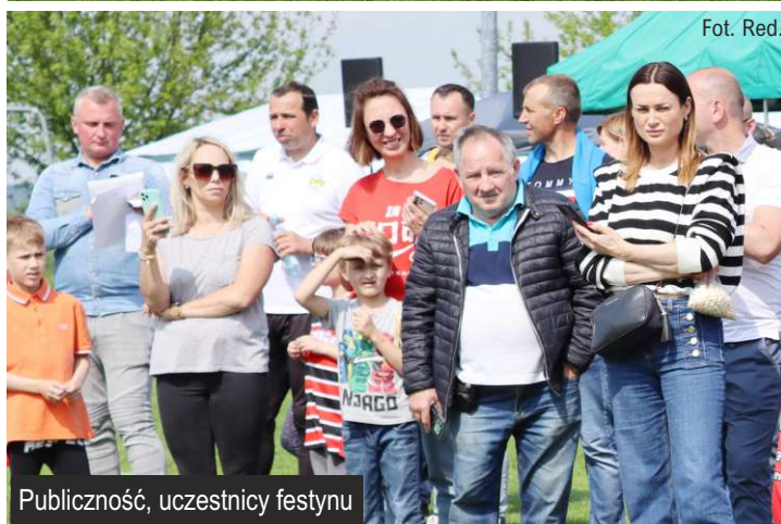
Publiczność, uczestnicy festynu