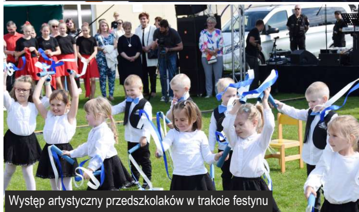
Występ artystyczny przedszkolaków w trakcie festynu