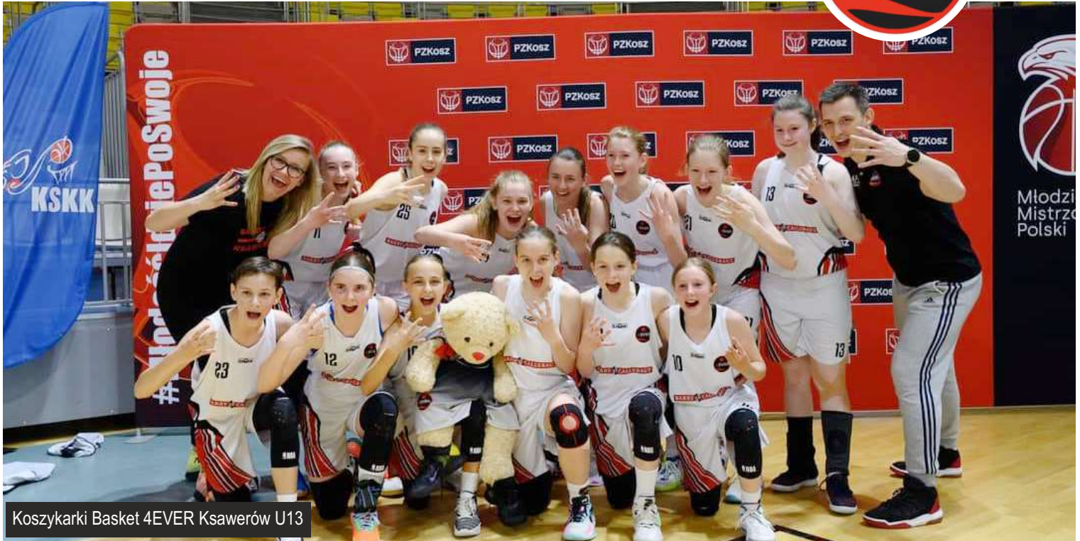
Koszykarki Basket 4EVER Ksawerów U13