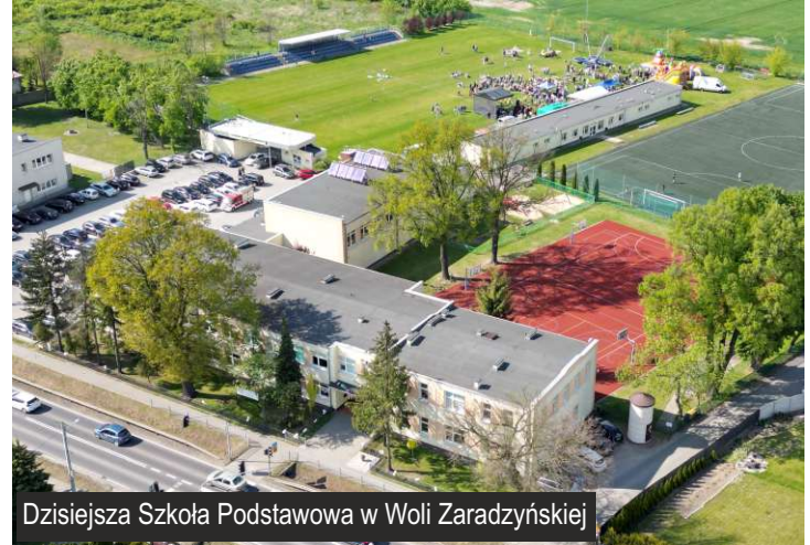
Dzisiejsza Szkoła Podstawowa w Woli Zaradzyńskiej

Początki Szkoły w Woli Zaradzyńskiej sięgają 1921 roku, kiedy to z inicjatywy mieszkańców wsi w prywatnym domu wynajęto izbę, która pełniła rolę sali lekcyjnej. Budynek szkoły powstał dziewięć lat później. Wybuch II wojny światowej zakłócił prowadzenie tradycyjnych lekcji, ale nie przerwano pracy edukacyjnej. Po wojnie wznowiono zajęcia, szkoła rozwijała się, rozbudowywała, unowocześniała i tak jest do dziś. Uczniowie korzystają z nowoczesnego sprzętu i pomocy dydaktycznych, dzięki którym rozwijają kompetencje przyszłości.