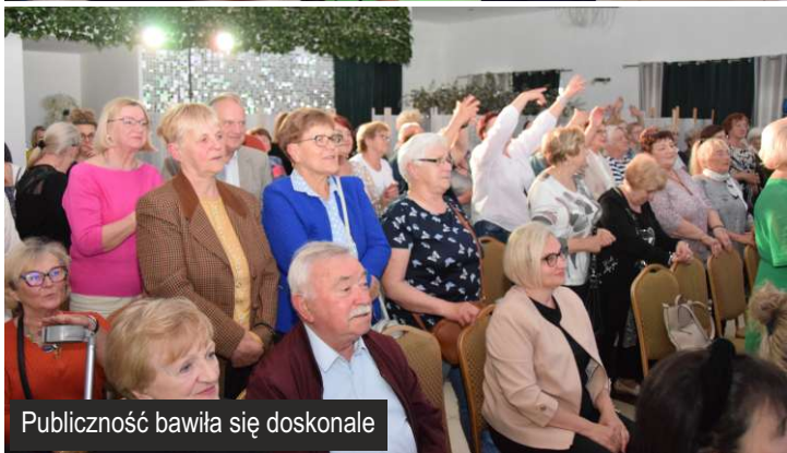
Publiczność bawiła się doskonale