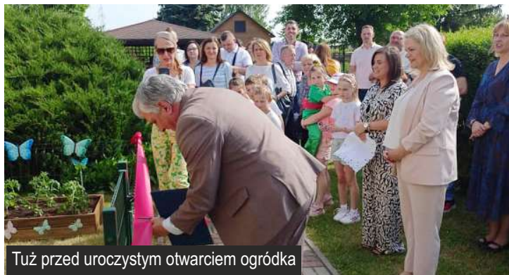
Tuż przed uroczystym otwarciem ogródka