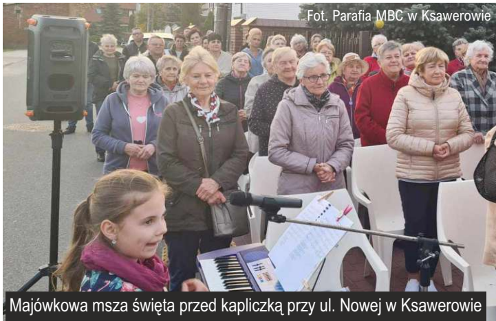
Majówkowa msza święta przed kapliczką przy ul. Nowej w Ksawerowie