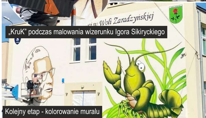
Kolejny etap - kolorowanie muralu