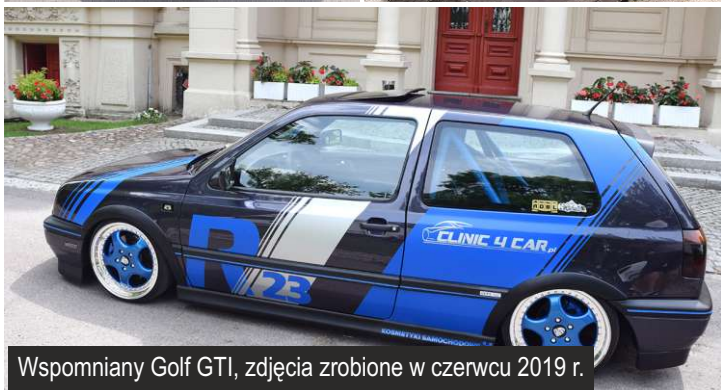
Wspomniany Golf GTI, zdjęcia zrobione w czerwcu 2019 r.