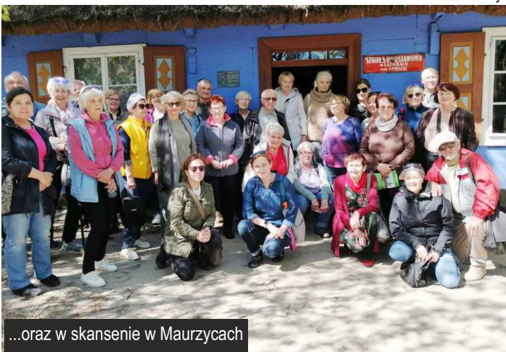
...oraz w skansenie w Maurzycach

Echo Gminy Ksawerów - gazeta samorządu terytorialnego.