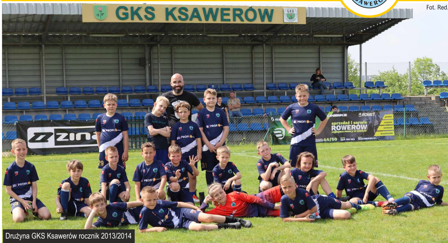
Drużyna GKS Ksawerów rocznik 2013/2014

20 maja na Stadionie Gminy Ksawerów w Woli Zaradzyńskiej odbył się festyn sportowy w ramach którego rozegrano Turniej o Puchar Wójta Gminy Ksawerów dla rocznika 2013/2014.