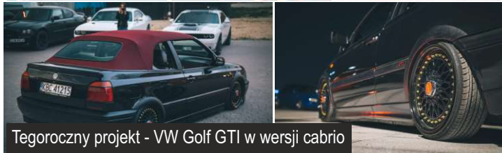
Tegoroczny projekt - VW Golf GTI w wersji cabrio