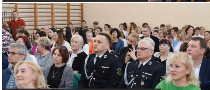
Mieszkańcy gminy i goście pierwszego dnia jubileuszu