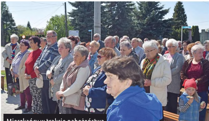
Mieszkańcy w trakcie nabożeństwa