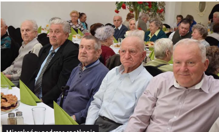
Mieszkańcy podczas spotkania