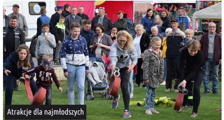
Atrakcje dla najmłodszych