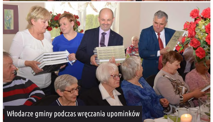
Włodarze gminy podczas wręczania upominków