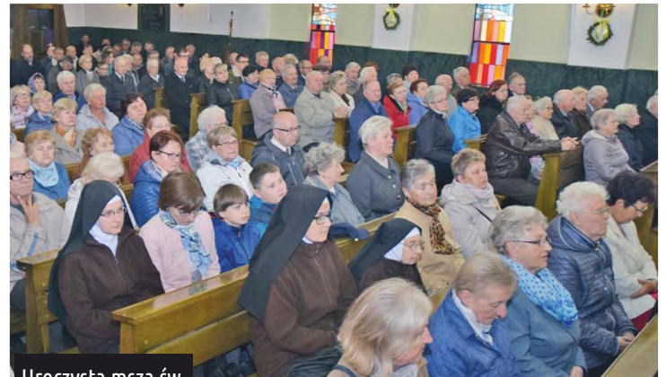
Uroczysta msza św.