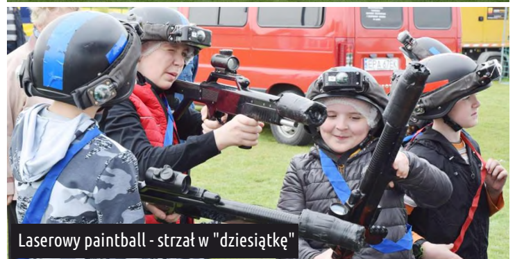
Laserowy paintball - strzał w "dziesiątkę"