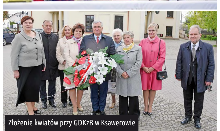
Złożenie kwiatów przy GDKzB w Ksawerowie