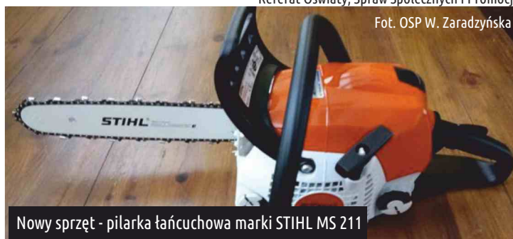
Nowy sprzęt - pilarka łańcuchowa marki STIHL MS 211