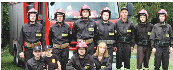
Druhowie z OSP zapraszają do uczestnictwa w jubileuszu wszystkich tych mieszkańców gminy, którym bliska jest jednostka w Woli Zaradzyńskiej

22 września Jednostka Ochotniczej Straży Pożarnej w Woli Zaradzyńskiej, obchodziła będzie jubileusz 50-lecia swojego istnienia.