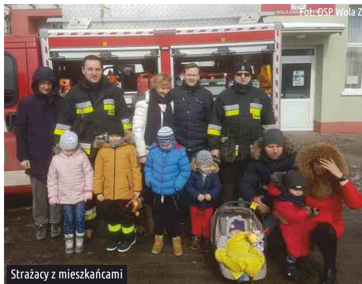
Strażacy z mieszkańcami

Uczestnicy wyjazdu doskonalili swoje umiejętności w jeździe na nartach i na snowboardach, susząc w pięknych "okolicznościach" górskiego