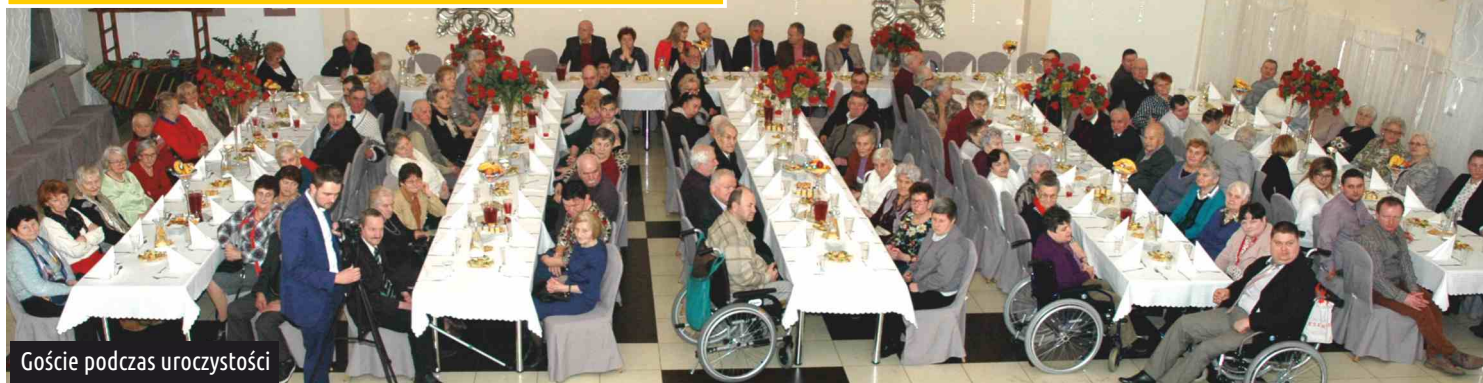
Goście podczas uroczystości