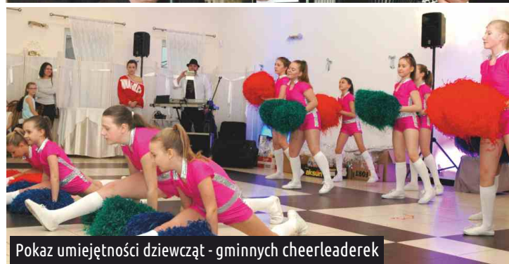
Pokaz umiejętności dziewcząt - gminnych cheerleaderek