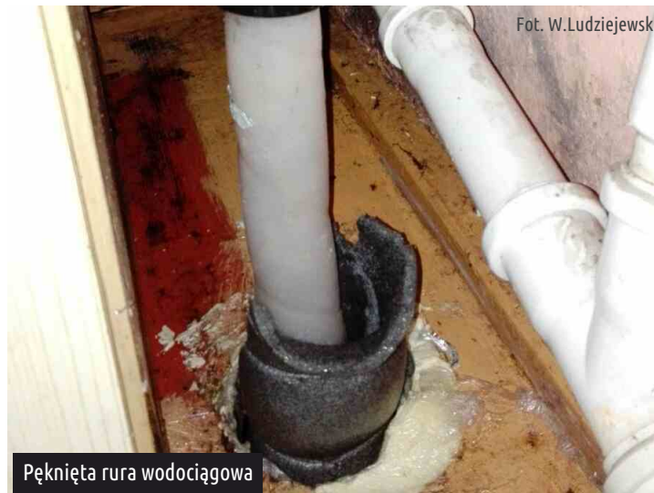
Pęknięta rura wodociągowa

Przełom lutego i marca przyniósł bardzo niskie temperatury również w naszej gminie. Szczególnie odczuli to mieszkańcy Ksawerowa, którzy niedokładnie zabezpieczyli instalację wodociągową w swoim budynku mieszkalnym. Niestety, rura doprowadzająca wodę pękła za wodomierzem, dlatego właściciel nieruchomości musiał usunąć awarię we własnym zakresie.