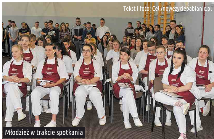
Tekst i foto: Cel./nowezyciepabianic.pl