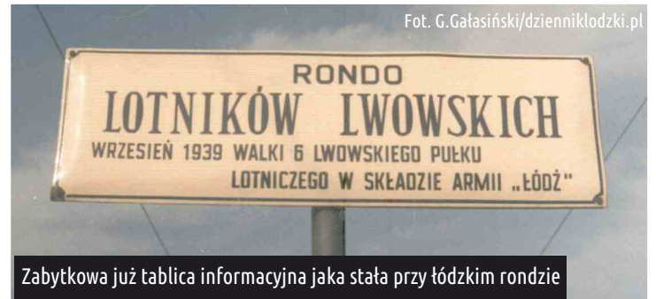
Zabytkowa już tablica informacyjna jaka stała przy łódzkim rondzie