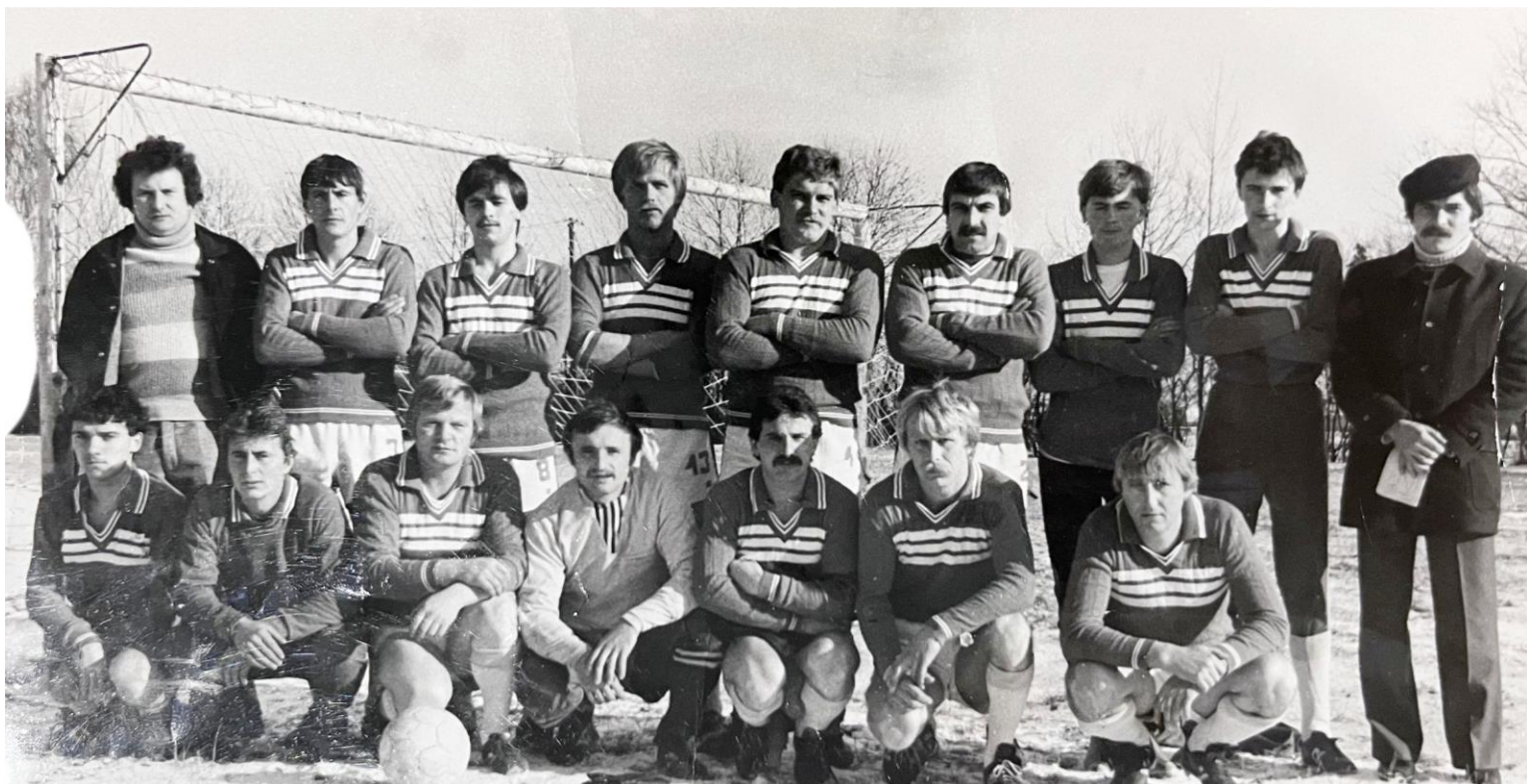
Fotografia drużynę LZS Cosmos. Fotografia jest archiwalna.