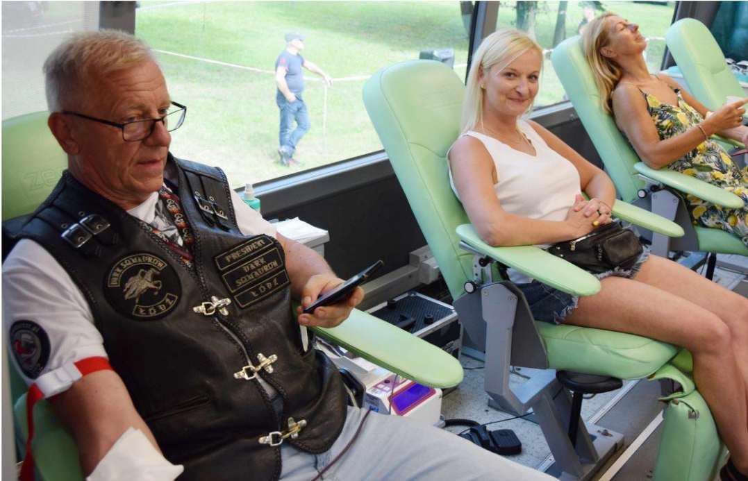
Fotografia przedstawia uczestników festynu podczas oddawania krwi. Fotografię wykonała redakcja.