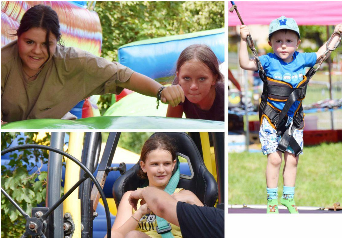
Fotografia przedstawia najmłodszych mieszkańców uczestniczących w festynie.