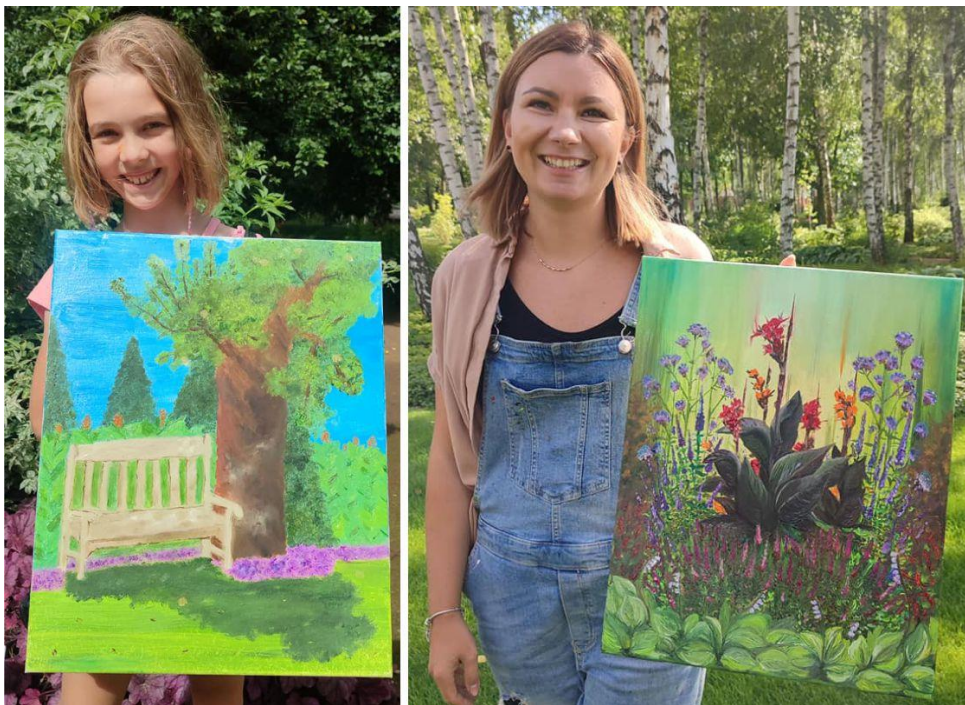
Fotografia przedstawia uczestników pleneru malarskiego ze swoimi pracami. Fotografia jest archiwalna.

Większość osób, które wzięły udział w plenerze, nigdy nie malowało farbami olejnymi. Dlatego to zadanie było nie lada wyzwaniem. W pięknych okolicznościach przyrody powstały prawdziwe dzieła sztuki. Było cudownie. Zobaczcie sami.