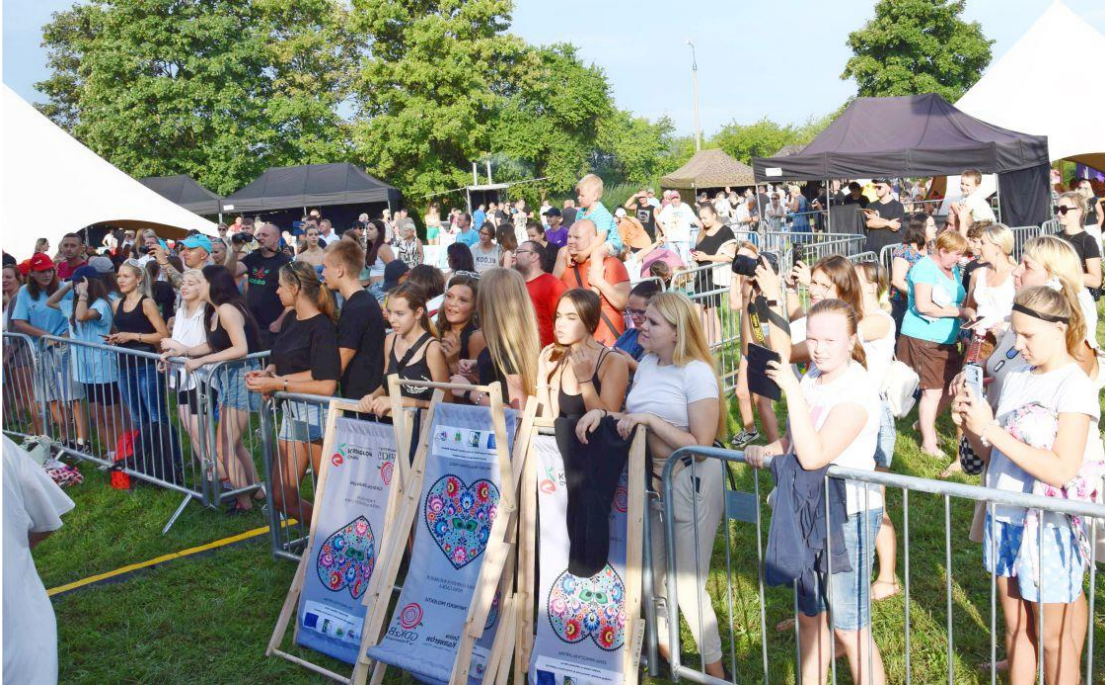
Fotografia przedstawia uczestników festynu. Fotografie wykonała redakcja.