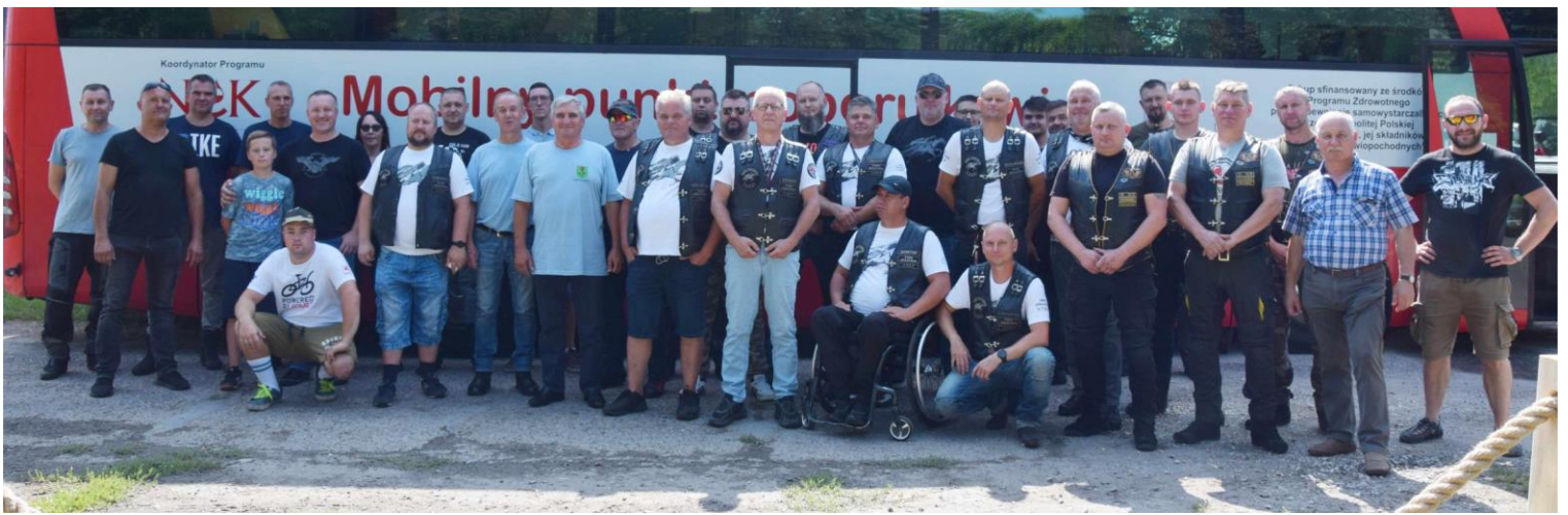
Fotografia przedstawia motocyklistów, uczestników akcji Motoserce.