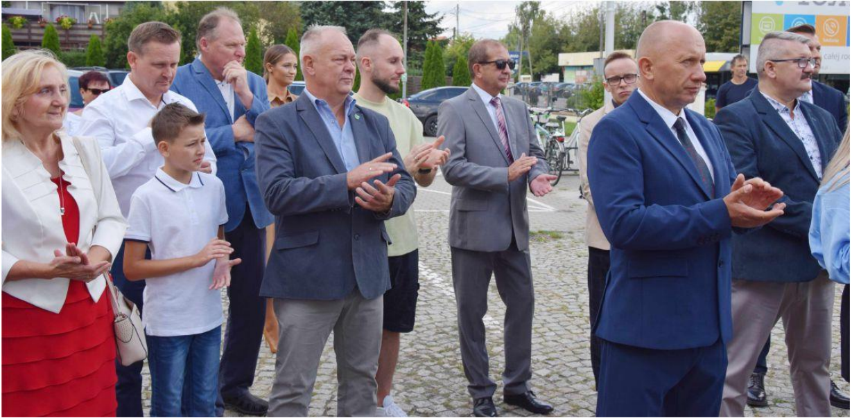
Fotografia przedstawia mieszkańców podczas uroczystości.