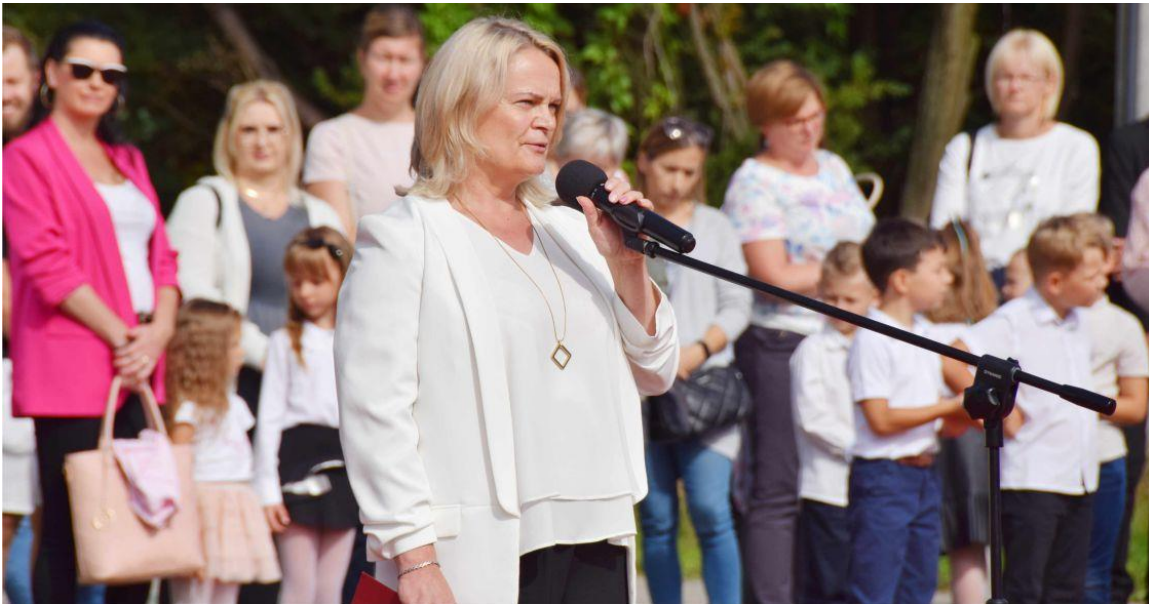
Fotografia przedstawia uczestników uroczystości rozpoczęcia roku szkolnego w Ksawerowie.