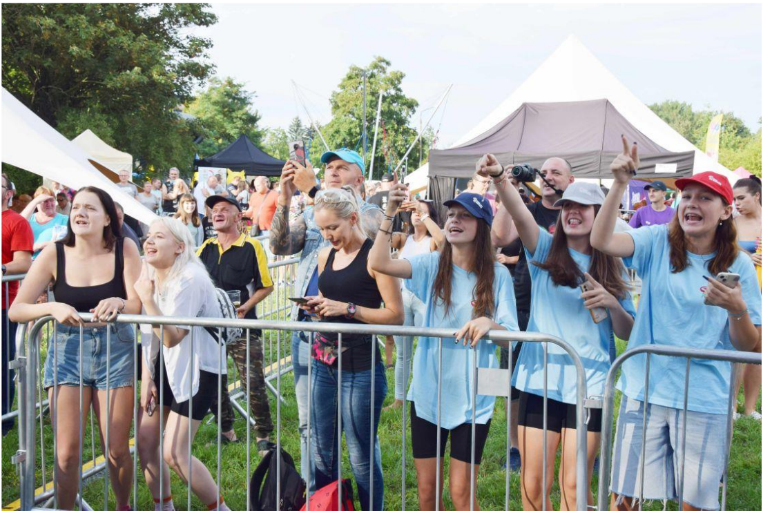
Fotografia przedstawia uczestników festynu.