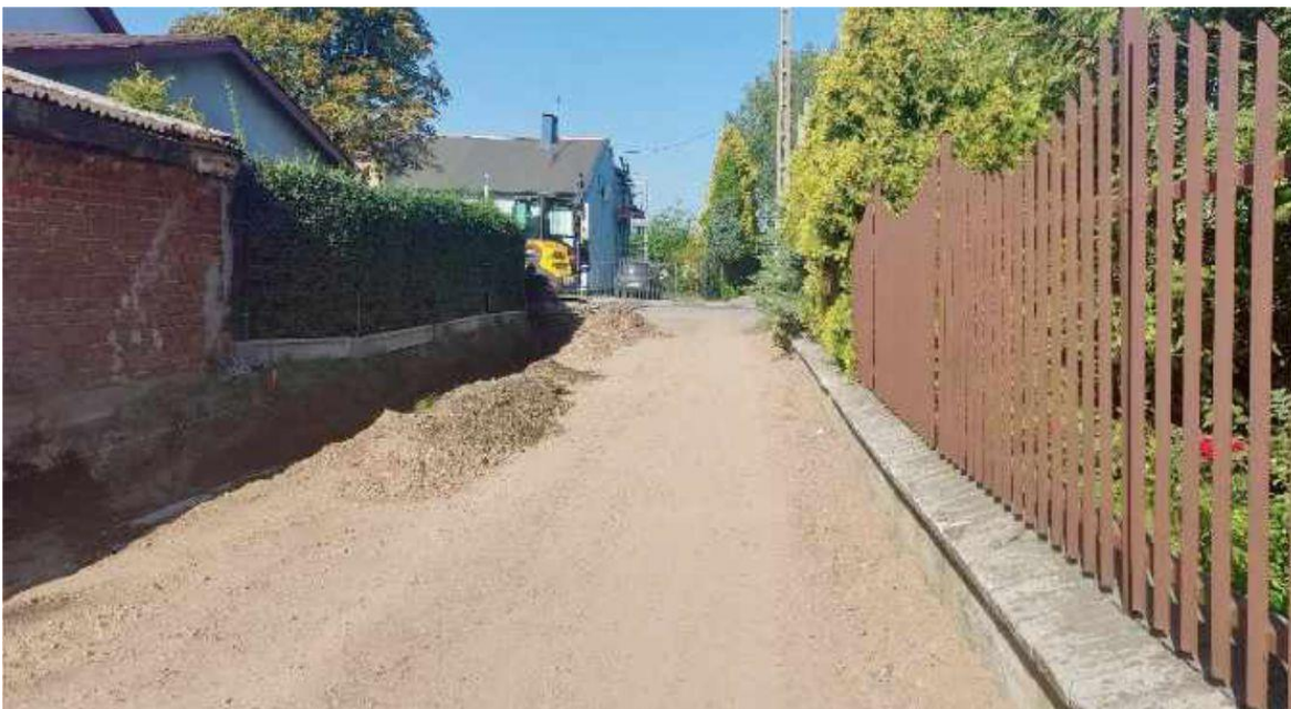
Fotografia przedstawia remontowany odcinek ulicy Żytniej. Fotografia jest archiwalna.