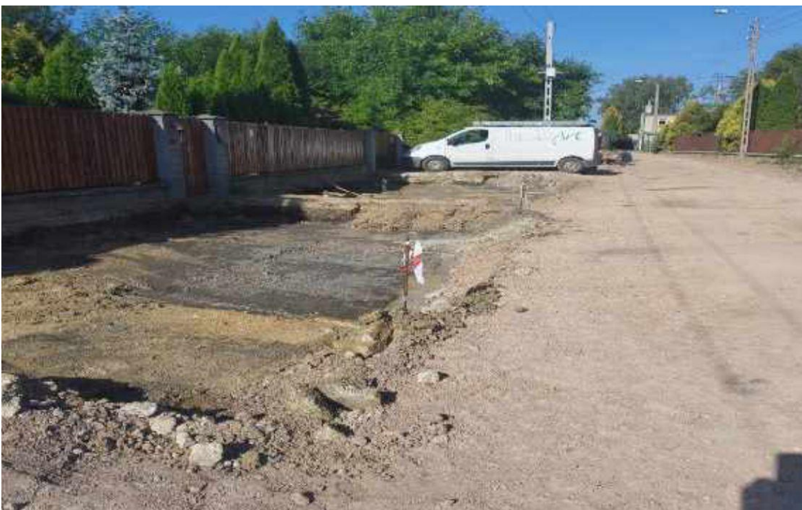
Fotografia przedstawia remontowany odcinek ulicy Żytniej. Fotografia jest archiwalna. Informację przygotował Referat Infrastruktury.