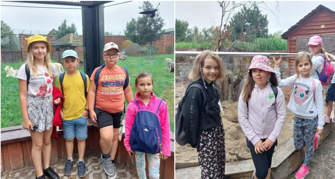
Fotografia przedstawia uczestników warsztatów podczas wycieczki do ZOO Safarai Borysew.