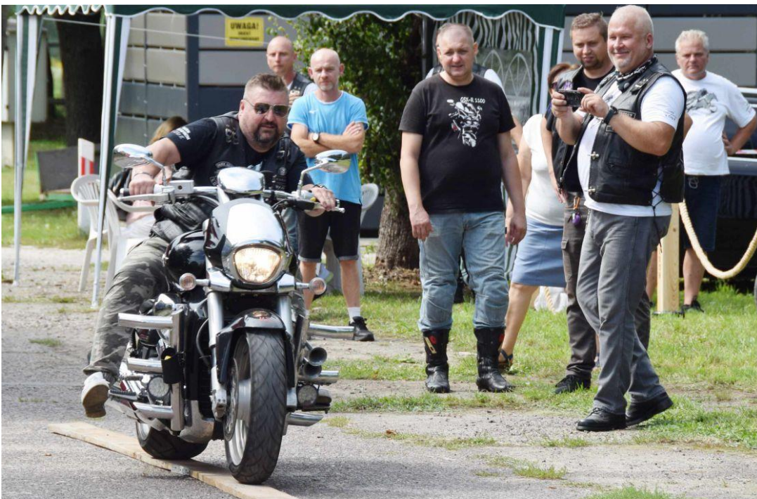
Fotografia przedstawia motocyklistów podczas konkurencji.