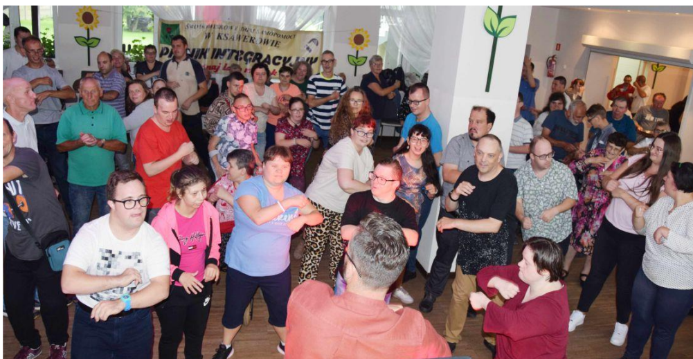
Fotografia przedstawia uczestników spotkania.

Impreza była bardzo udana, a uśmiech gości bezcenny. Do zobaczenia na kolejnym spotkaniu!