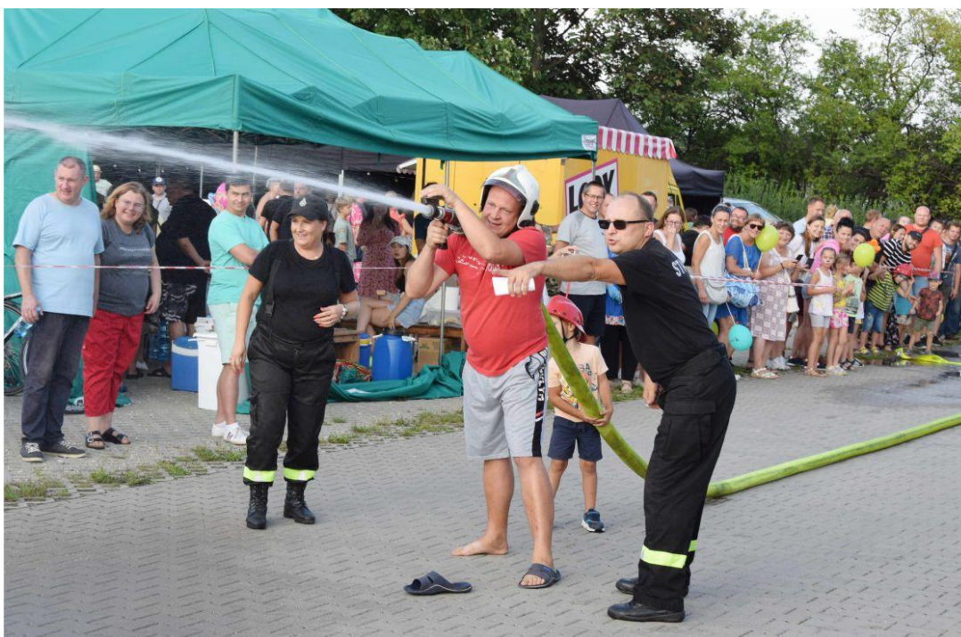
Fotografia przedstawia mieszkańców uczestniczących w konkursach strażackich.