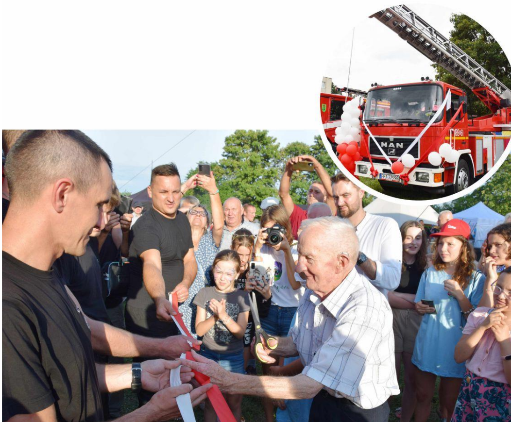
Fotografia przedstawia najstarszego uczestnika festynu, który przeciął wstęgę „witającą” nowy wóz drabiniasty.