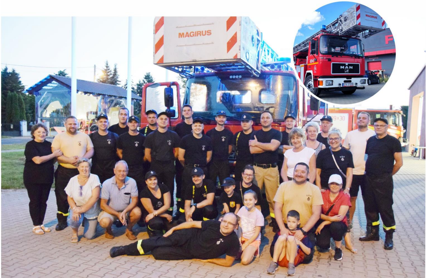
Fotografia przedstawia uczestniczących w powitaniu nowego wozu bojowego.