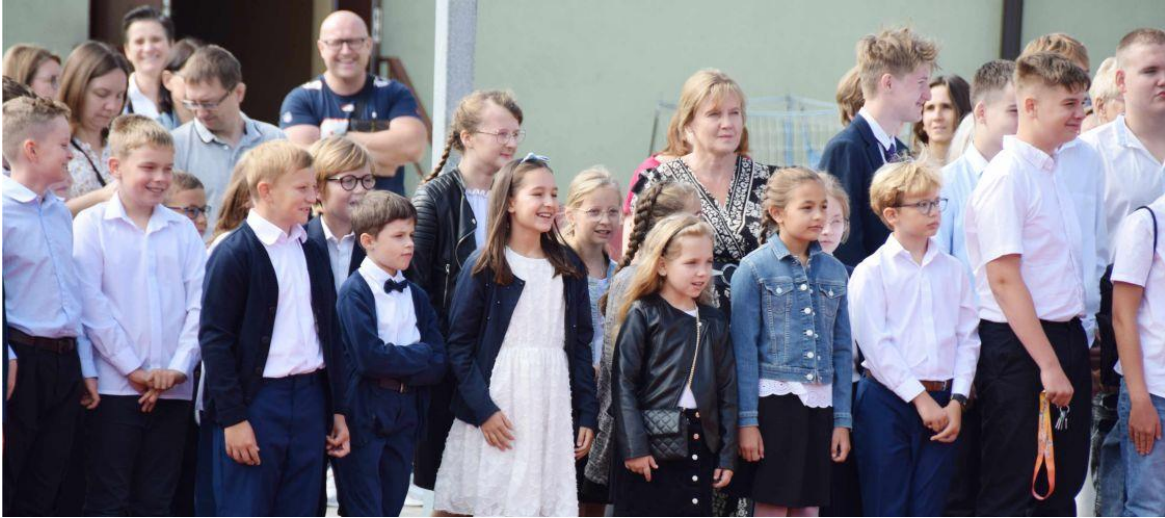
Fotografia przedstawia uczestników uroczystości rozpoczęcia roku szkolnego w Ksawerowie.