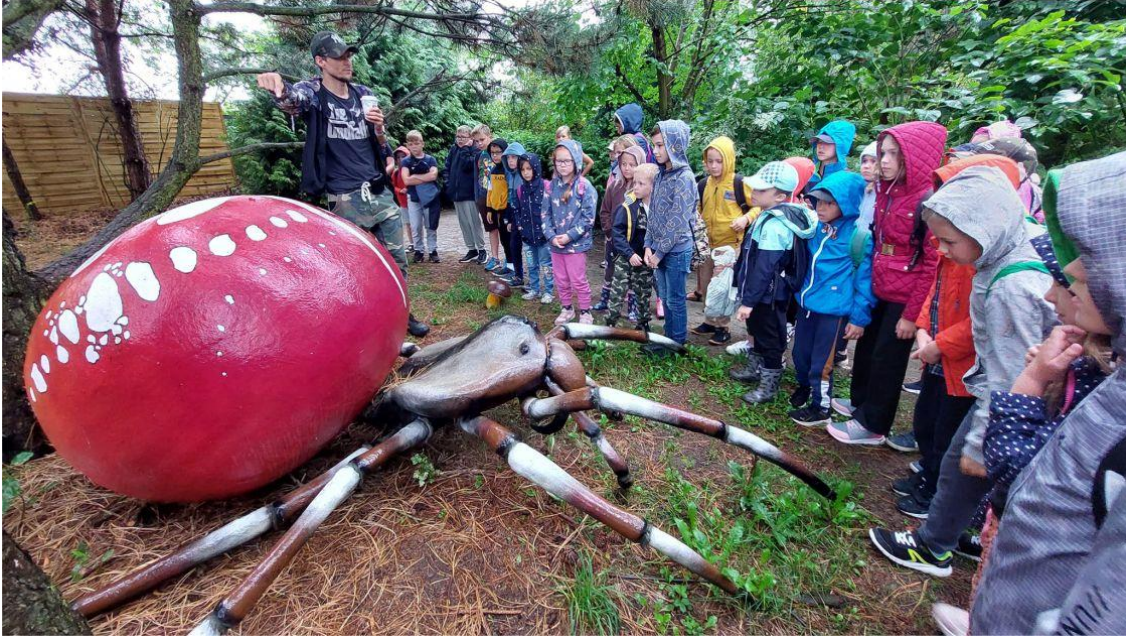
Fotografia przedstawia uczestników warsztatów podczas wycieczki do Parku Mikrokosmos.