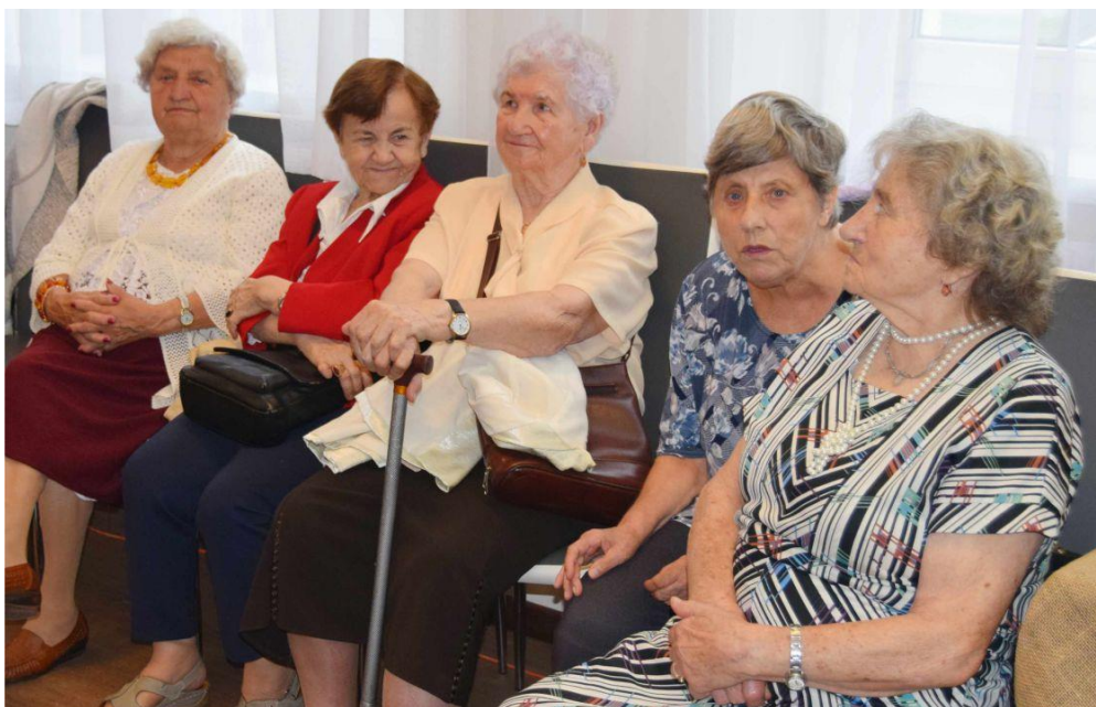
Fotografia przedstawia uczestników spotkania.