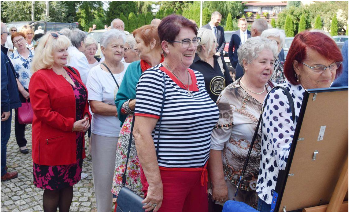
Fotografia przedstawia mieszkańców podczas uroczystości. Informację przygotował Referat Oświaty, Spraw Społecznych i Promocji.