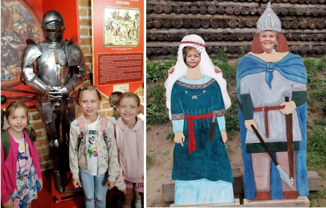
Fotografia przedstawia uczestników warsztatów podczas zwiedzania Zamku w Łęczycy.