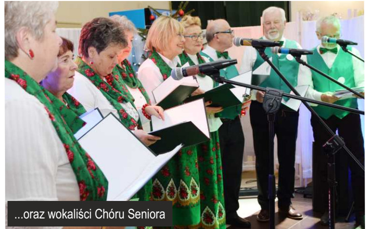
...oraz wokaliści Chóru Seniora