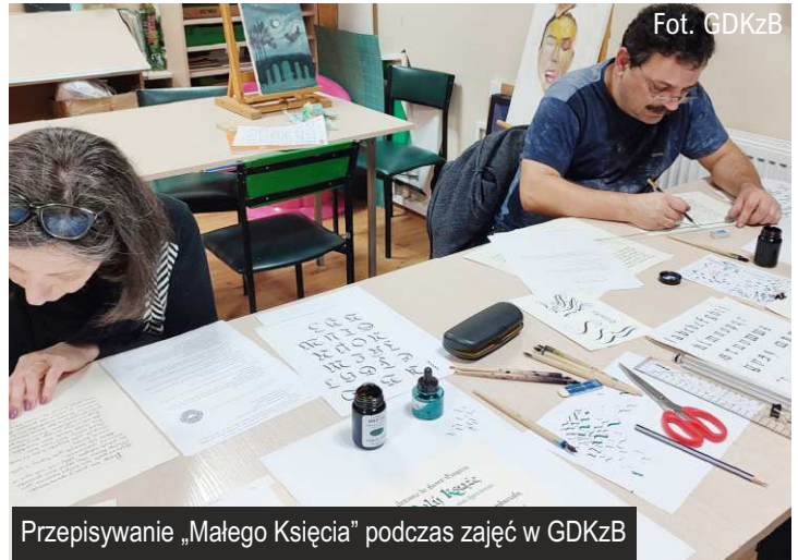
Przepisywanie „Małego Księcia” podczas zajęć w GDKzB