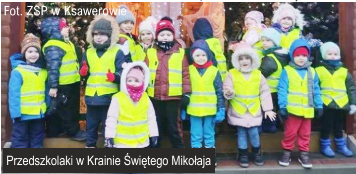
Przedszkolaki w Krainie Świętego Mikołaja