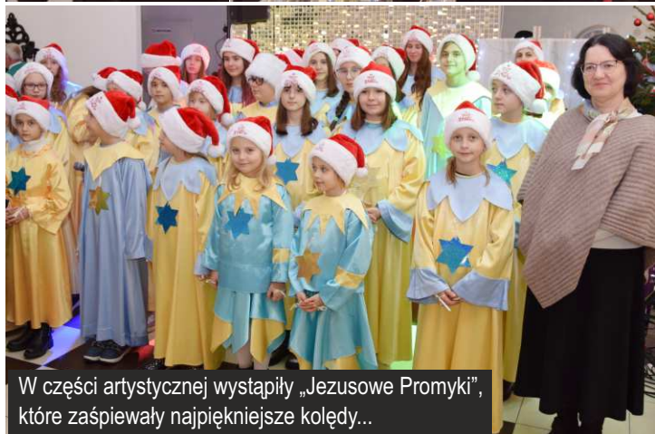
W części artystycznej wystąpiły „Jezusowe Promyki”, które zaśpiewały najpiękniejsze kolędy...