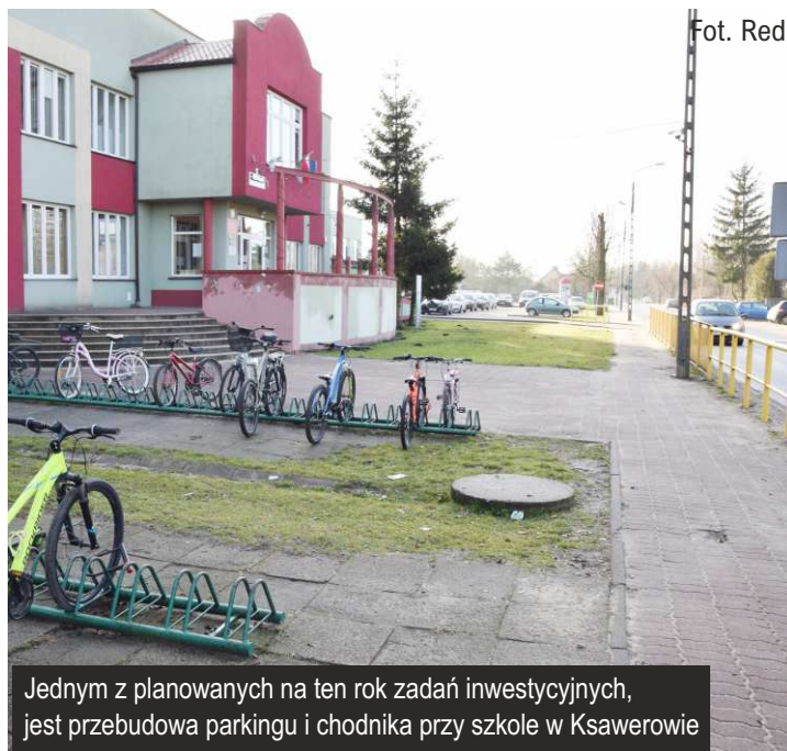
Jednym z planowanych na ten rok zadań inwestycyjnych, jest przebudowa parkingu i chodnika przy szkole w Ksawerowie

W ramach środków z „Polskiego Ładu” otrzymaliśmy promesę na blisko 11 milionów złotych na budowę nowej hali sportowej przy szkole podstawowej w Woli Zaradzyńskiej. W tym roku chcemy ogłosić przetarg na wykonanie tej inwestycji. Myślimy też o nowym ciągniku, nowej zamiatarce ulicznej, naprawie dachu w szkole podstawowej w Ksawerowie (na budynku szkoły i dachu nad salą gimnastyczną), zmianie oświetlenia ulicznego w sąsiedztwie szkoły i oświetlenia sali gimnastycznej. Wydawać się może, że lista jest długa, ale są to jedynie najważniejsze tegoroczne zadania – w planach jest też wiele mniejszych, mniej widocznych dla mieszkańców, ale równie dla nich ważnych przedsięwzięć. Urząd nieprzerwanie pracuje na wysokich obrotach. Oczywiście w miarę ich realizacji będziemy o wszystkim na bieżąco informować w gazecie Echo Gminy Ksawerów i na stronie internetowej gminy.