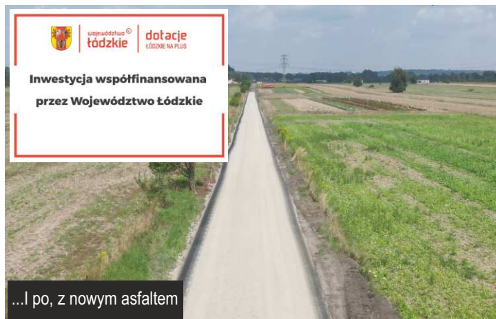
...I po, z nowym asfaltem