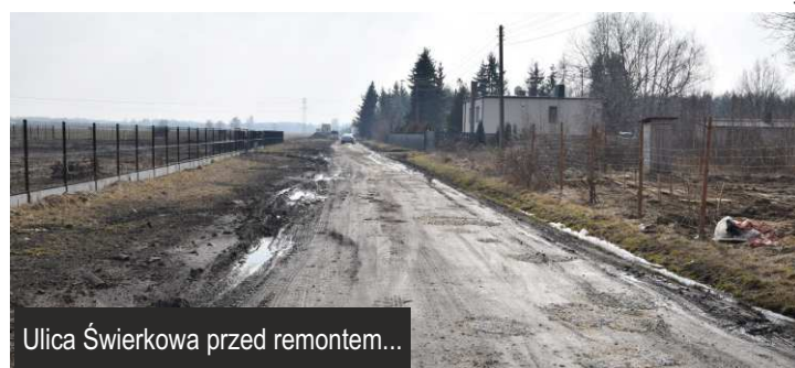
Ulica Świerkowa przed remontem...