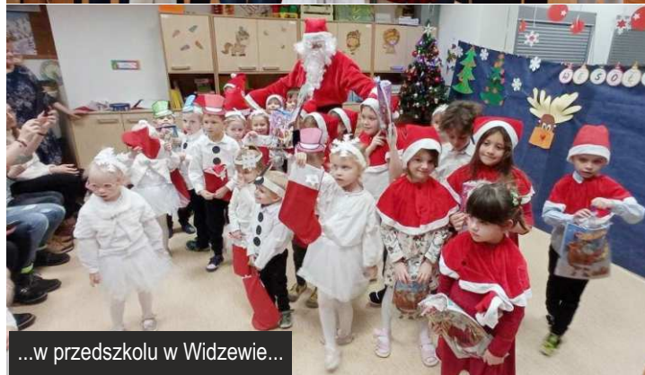
...w przedszkolu w Widzewie...