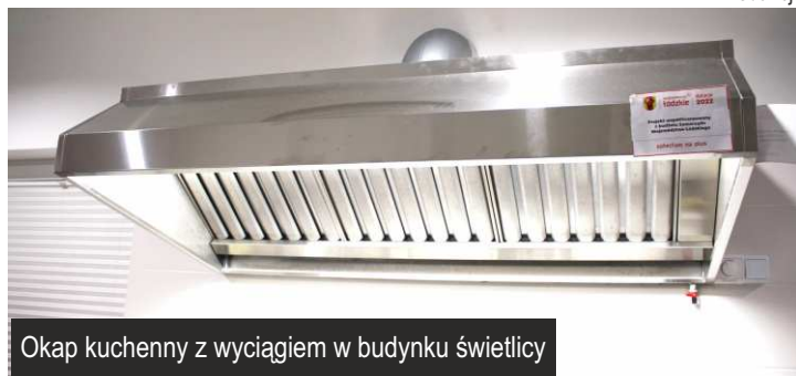
Okap kuchenny z wyciągiem w budynku świetlicy