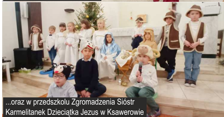
...oraz w przedszkolu Zgromadzenia Sióstr Karmelitanek Dzieciątka Jezus w Ksawerowie