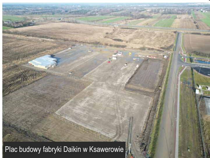
Plac budowy fabryki Daikin w Ksawerowie