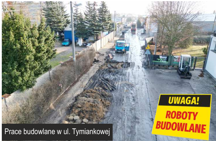
Prace budowlane w ul. Tymiankowej