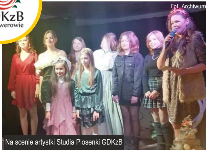
Na scenie artystki Studia Piosenki GDKzB