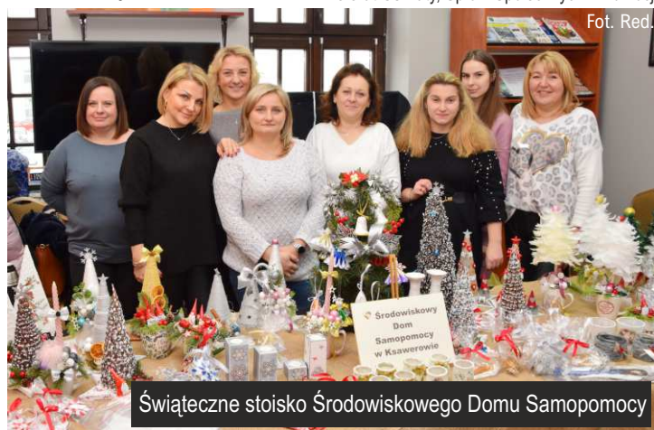
Świąteczne stoisko Środowiskowego Domu Samopomocy

Referat Oświaty, Spraw Społecznych i Promocji