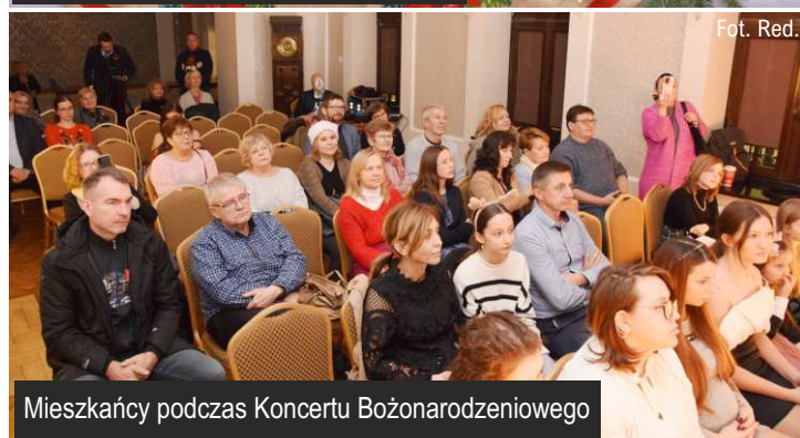
Mieszkańcy podczas Koncertu Bożonarodzeniowego