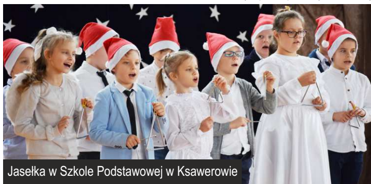
Jasełka w Szkole Podstawowej w Ksawerowie

Referat Oświaty, Spraw Społecznych i Promocji