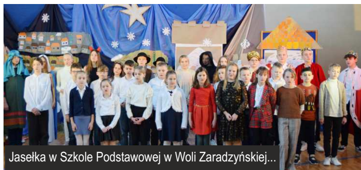
Jasełka w Szkole Podstawowej w Woli Zaradzyńskiej...