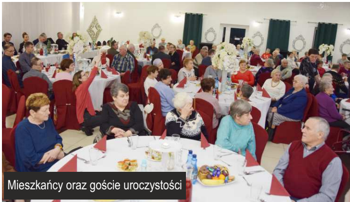
Mieszkańcy oraz goście uroczystości