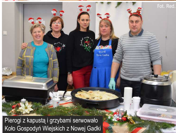
Pierogi z kapustą i grzybami serwowało Koło Gospodyń Wiejskich z Nowej Gadki