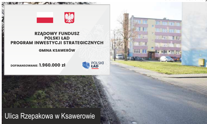
Ulica Rzepakowa w Ksawerowie