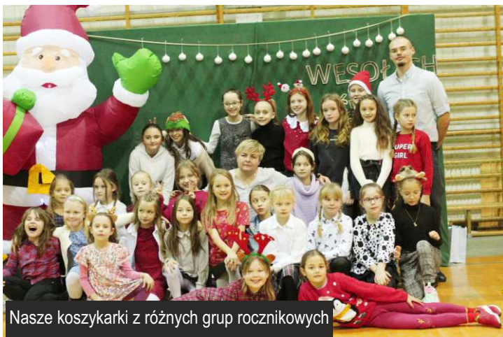
Nasze koszykarki z różnych grup rocznikowych