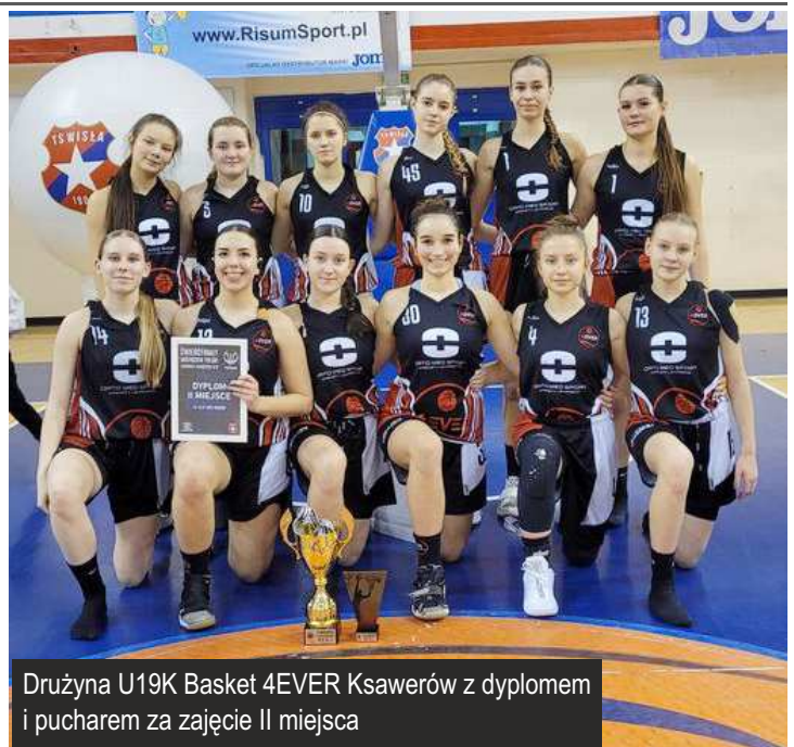
Drużyna U19K Basket 4EVER Ksawerów z dyplomem i pucharem za zajęcie II miejsca

Echo Gminy Ksawerów - gazeta samorządu terytorialnego.