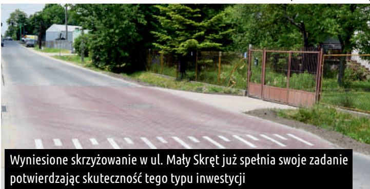
Wyniesione skrzyżowanie w ul. Mały Skręt już spełnia swoje zadanie potwierdzając skuteczność tego typu inwestycji