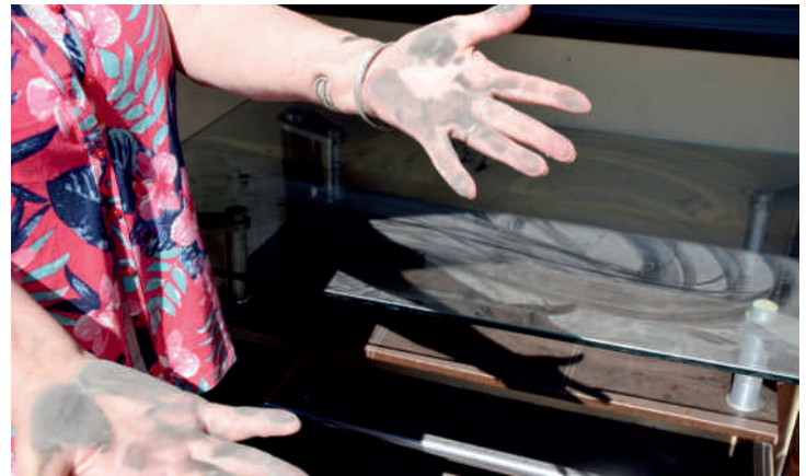
Brudny, osiadający wszędzie pył, jest codziennością mieszkańców ulicy

- Nie mamy już słów i cierpliwości. Codziennie, kiedy jest ciepło i sucho, wdychamy wszędoobylski kurz i pył, który unosi się z ulicy. Nie sposób w dzień otworzyć okno czy wywiesić pranie, proszę spojrzeć na ten stolik. Największym problem są ciężarówki, które skracają sobie drogę jeżdżąc przez naszą ulicę. Sytuacja naprawdę jest tragiczna. Od kilkudziesięciu lat wspólnie z sąsiadami walczymy o remont tej ulicy, niestety bez konkretnego odzewu ze strony Pabianic. Jak długo jeszcze musimy czekać? - mówi zirytowana mieszkanka ulicy Zaradzyńskiej.