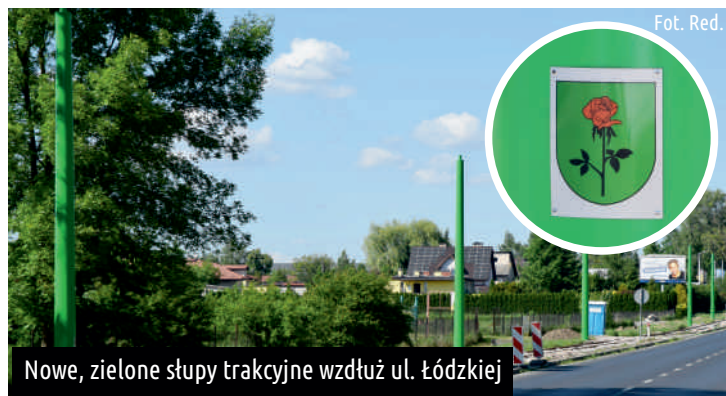
Nowe, zielone słupy trakcyjne wzdłuż ul. Łódzkiej