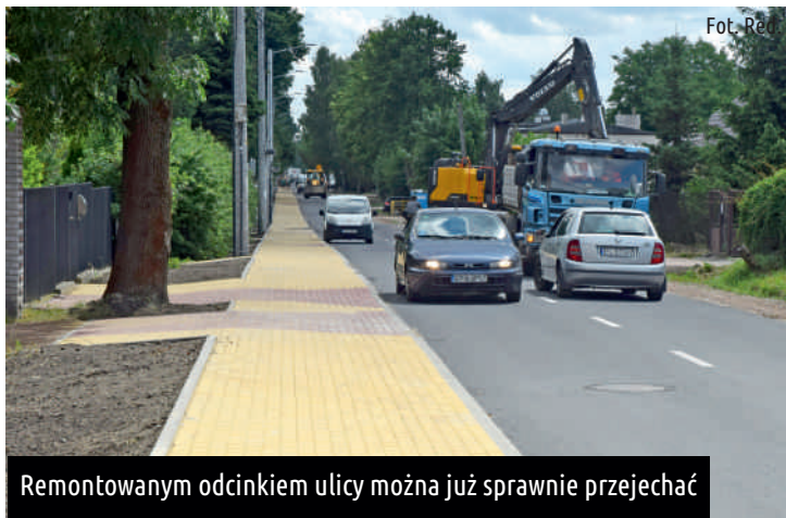
Remontowanym odcinkiem ulicy można już sprawnie przejechać

Kierowcy mogą odetchnąć, remontowanym odcinkiem ul. Zachodniej (od ul. Jana Pawła II do ul. Szerokiej) można już przejechać lub przejść pieszo nowym chodnikiem. Wykonawca inwestycji prowadzi końcowe prace wykończeniowe i pielęgnacyjne.