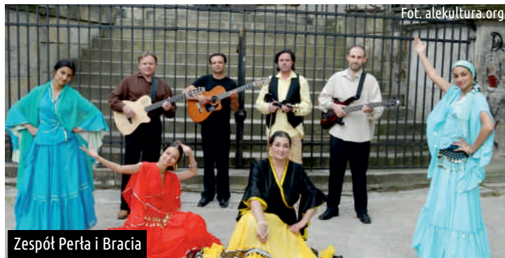
Zespół Perła i Bracia