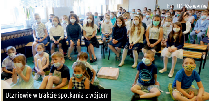
Uczniowie w trakcie spotkania z wójtem