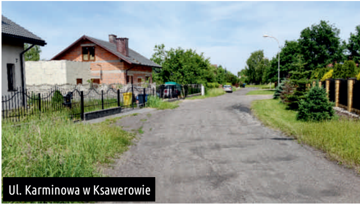
Ul. Karminowa w Ksawerowie