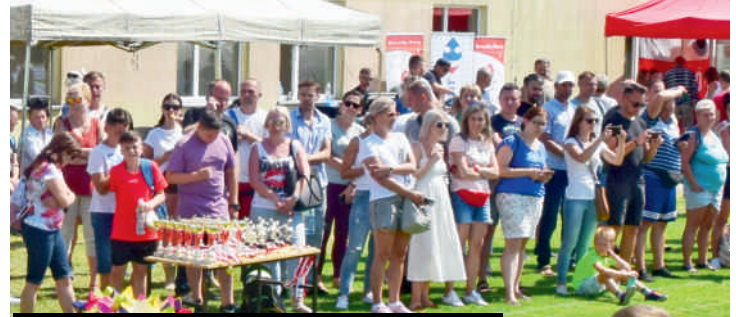
Tłumnie przybyli uczestnicy bawili się doskonale