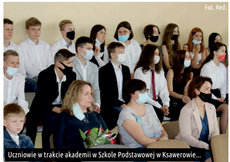
Uczniowie w trakcie akademii w Szkole Podstawowej w Ksawerowie...

Ref. Oświaty, Spraw Społecznych i Promocji