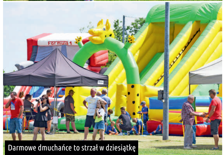
Darmowe dmuchańce to strzał w dziesiątkę