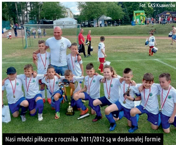
Nasi młodzi piłkarze z rocznika 2011/2012 są w doskonałej formie