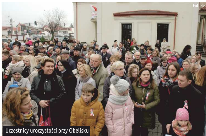
Uczestnicy uroczystości przy Obelisku