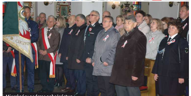
Mieszkańcy podczas nabożeństwa