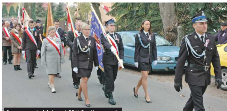
Przemarsz z kościoła pod GDKzB w Ksawerowie