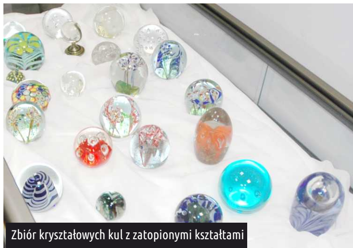
Zbiór kryształowych kul z zatopionymi kształtami

Znów kolejny przypadek. Akurat był Dzień Kobiet, a ja byłem na łódzkim targowisku po kwiatki dla moich trzech dziewczyn - dwóch córek i żony. Patrzę, a na jednym ze straganów handlarz sprzedaje kryształowe kule z zatopionymi w środku motywami kwiatów. Były piękne. Kupiłem je i tak się zaczęła ta przygoda. Kul szukałem gdzie tylko mogłem. Nawet w Bułgarii. Ale najwięcej w Czechach i w Szklarskiej Porębie. Dzisiaj kolekcja liczy już kilkadziesiąt sztuk. Patrząc na każdą z nich, uruchamiamy naszą wyobraźnię.