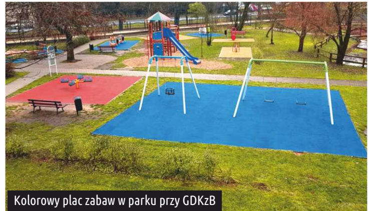
Kolorowy plac zabaw w parku przy GDKzB