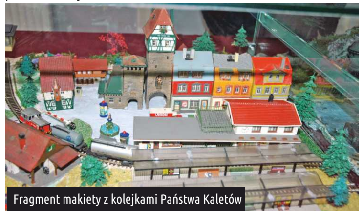
Fragment makiety z kolejkami Państwa Kaletów

Teraz chyba już rozumiem, skąd w Pana zbiorach znalazły się kolejki. Niespełnione marzenie małego chłopca? Tak właśnie było. Proszę pamiętać, że moje dzieciństwo przypadło na lata 50. Wtedy każdy chłopak marzył skrycie o kolejce jeżdżącej po wijących się torach pośród gór i lasów. Mało kto mógł ją wtedy mieć. Nie było w naszych sklepach takich zabawek. Spełniłem swoje marzenie dopiero jako młody mężczyzna, kiedy to trafiłem do Składnicy Harcerskiej. Tutaj mogłem kupić wszystkie elementy potrzebne do budowania makiety kolejki. Oczywiście, na czele z wagonikami kultowej firmy z dawnej NRD. Kupienie tych wspaniałości wcale nie było łatwe. Trzeba było mieć "dojście". Ja takie miałem, odkąd naprawiłem w składnicy popsuty transformator (uśmiech). A makiety budowałem wspólnie z żoną. Byłem odpowiedzialny za część techniczną robót. Światła musiały się świecić, a szlabany zamykać. Żona pracowała nad elementami krajobrazu - góry, tunele, lasy, jeziorka, nawet plaża musiała być.