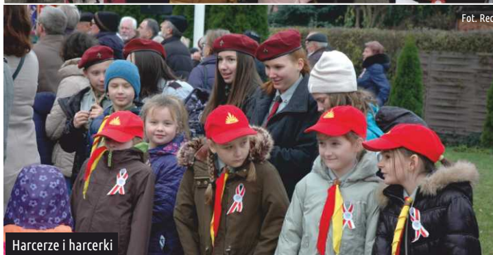
Harczerze i harcerki