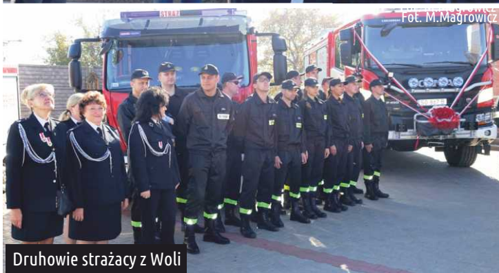
Druhowie strażacy z Woli