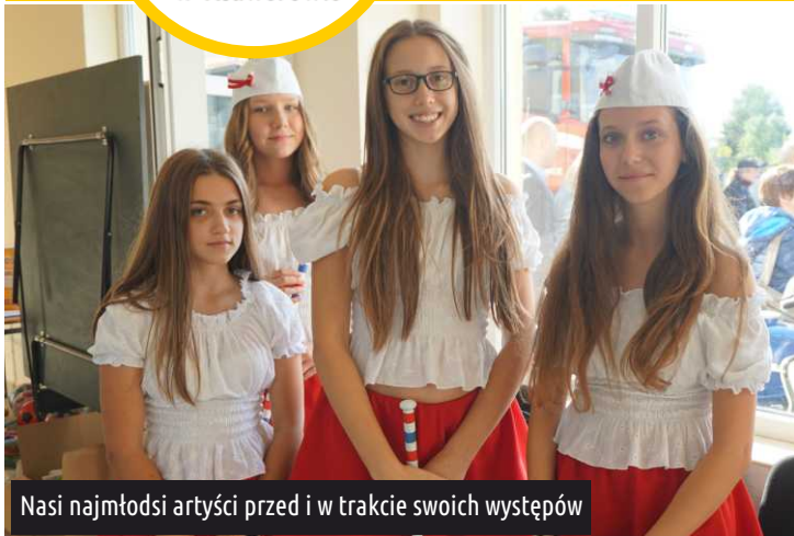
Nasi najmłodsi artyści przed i w trakcie swoich występów