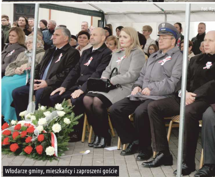
Włodarze gminy, mieszkańcy i zaproszeni goście

Dowiedz się więcej na... www.gmina.ksawerow.com