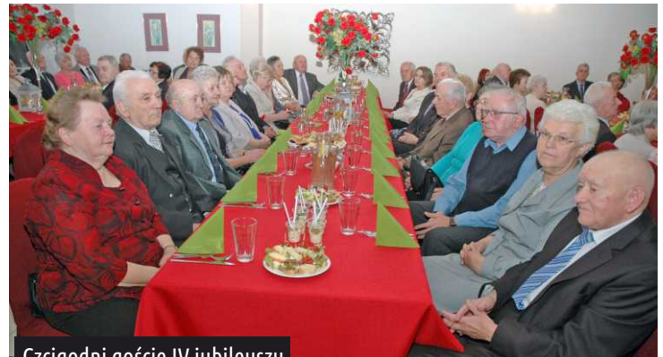
Czcigodni goście IV jubileuszu