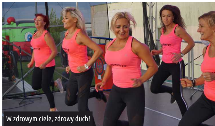
W zdrowym ciele, zdrowy duch!