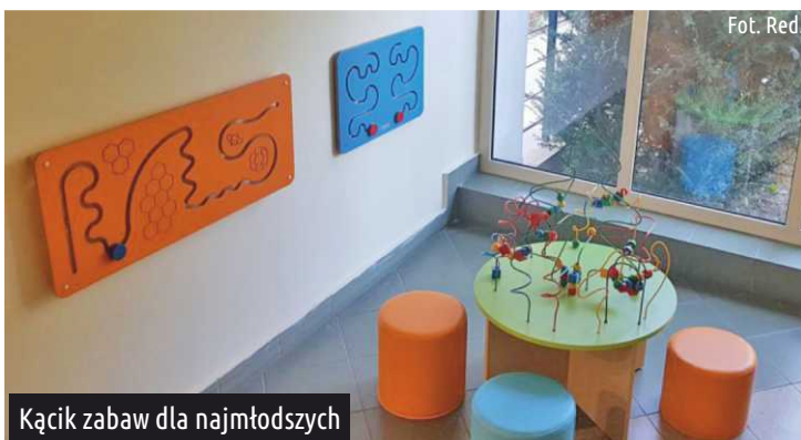
Kącik zabaw dla najmłodszych