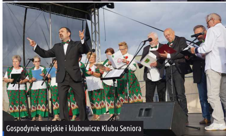
Gospodynie wiejskie i klubowicze Klubu Seniora