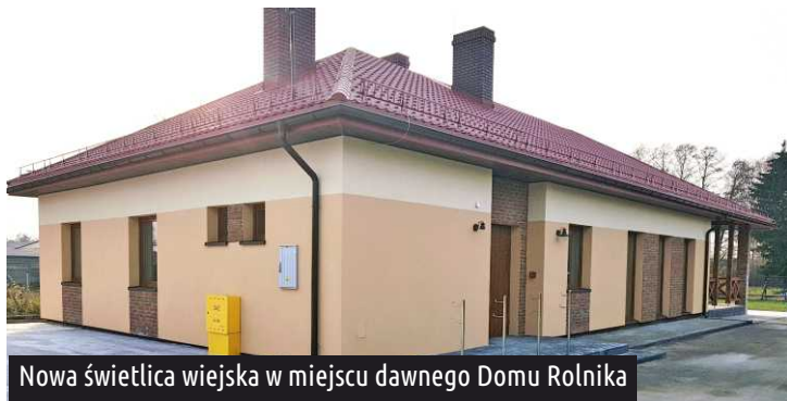
Nowa świetlica wiejska w miejscu dawnego Domu Rolnika

Dobiegła końca budowa nowej świetlicy wiejskiej w miejscu dawnego Domu Rolnika. Czekamy na podłączenie sieci gazowej. Kiedy gotowy budynek zostanie oddany do użytku? Prawdopodobnie jeszcze w tym miesiącu.