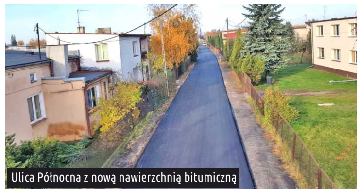
Ulica Północna z nową nawierzchnią bitumiczną

Koniec z błotem i dziurami w ulicach: Skromnej, Krótkiej, Poziomkowej i Północnej. Nowa nawierzchnia asfaltowa jest już położona.