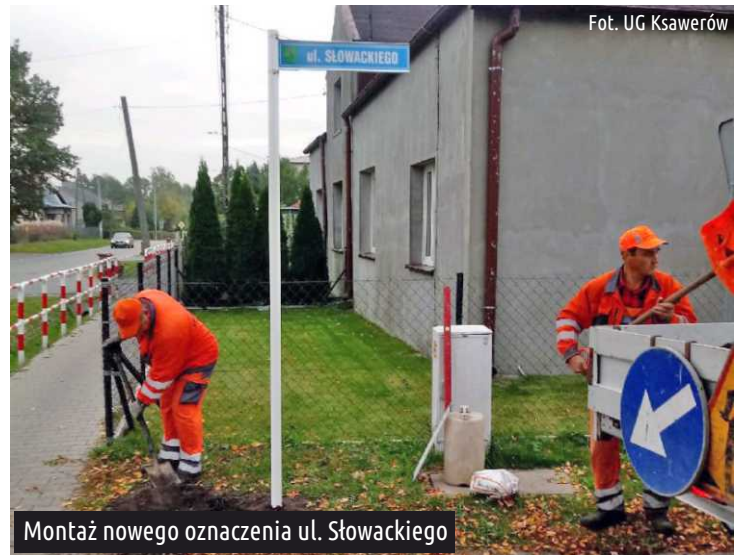
Montaż nowego oznaczenia ul. Słowackiego