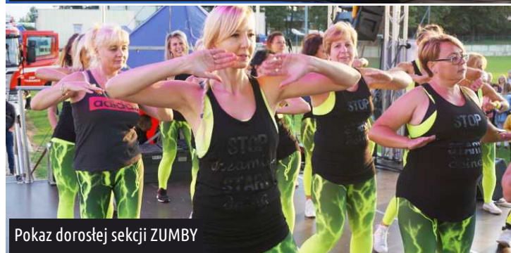
Pokaz dorosłej sekcji ZUMBY