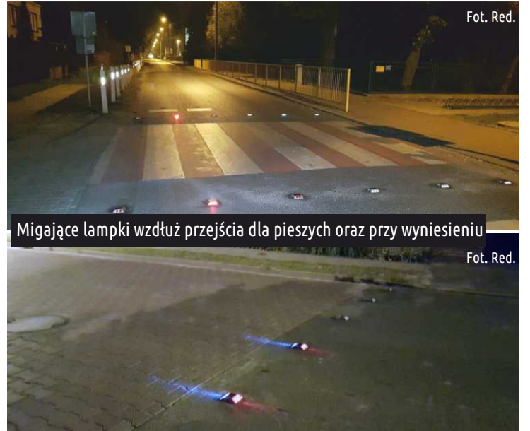
Migające lampki wzdłuż przejścia dla pieszych oraz przy wyniesieniu