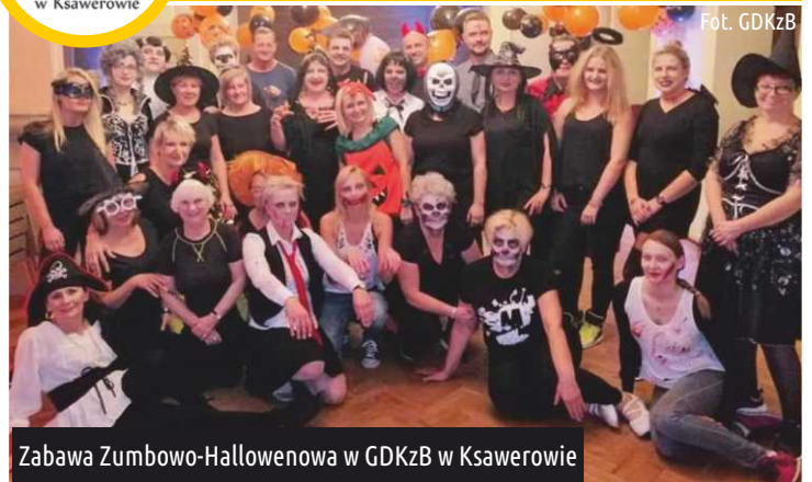
Zabawa Zumbowo-Halloweenowa w GDKzB w Ksawerowie