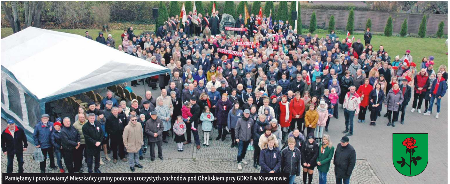
Pamiętamy i pozdrawiamy! Mieszkańcy gminy podczas uroczystych obchodów pod Obeliskiem przy GDKzB w Ksawerowie

Rok 2018 jest rokiem szczególnym - równo 100 lat temu, 11 listopada Polacy odzyskali wolność, swobodę i autonomię. Odzyskałiśmy niepodległość.