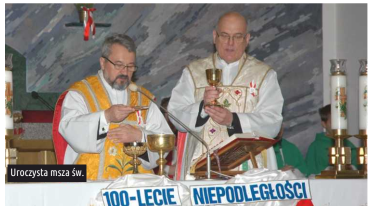
Uroczysta msza św.