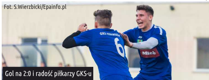
Gol na 2:0 i radość piłkarzy GKS-u