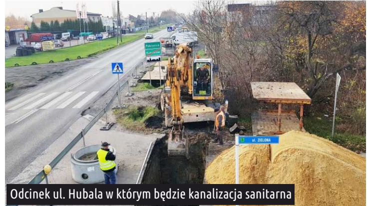
Odcinek ul. Hubala w którym będzie kanalizacja sanitarna

W ul. Hubala (na odcinku od ul. Zaradzyńskiej do ul. Karminowej) rozpoczęła się budowa sieci kanalizacji sanitarnej wraz z odcieczkami. To pierwszy etap tej dużej inwestycji realizowanej w ramach zadania "Projekt i budowa sieci wodociągowej i sieci sanitarnej w ulicach: Hubala, Ogrodników, Łącznej, Akacjowej, Łąkowej, Polnej, Świerkowej, Tylnej i Twardej w gminie Ksawerów".