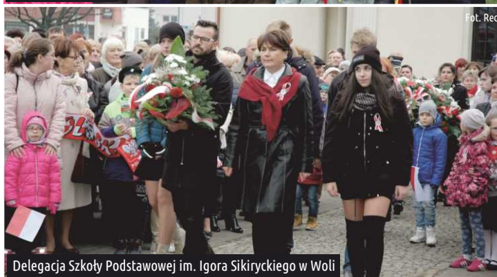
Delegacja Szkoły Podstawowej im. Igora Sikirnykiego w Woli