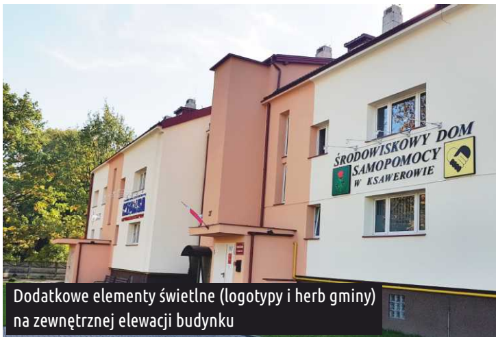
Dodatkowe elementy świetlne (logotypy i herb gminy) na zewnętrznej elewacji budynku

Ciekawie prezentuje się elewacja budynku Środowiskowego Domu Samopomocy oraz MEDiKS-y, która przykuwa uwagę również po zmroku.