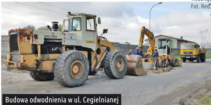
Budowa odwodnienia w ul. Cegielnianej