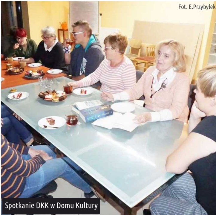
Spotkanie DKK w Domu Kultury