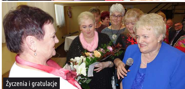
Życzenia i gratulacje