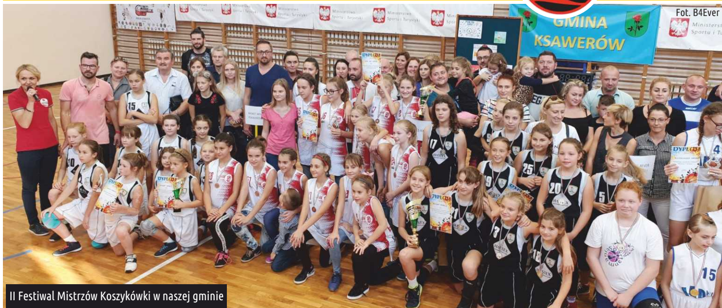
II Festiwal Mistrzów Koszykówki w naszej gminie

14 października w Szkole Podstawowej w Woli Zaradzyńskiej odbył się II Festiwal Mistrzów Koszykówki. Były emocje, dobra energia i sportowa rywalizacja.