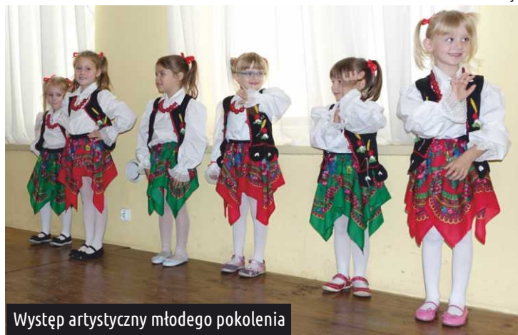
Występ artystyczny młodego pokolenia