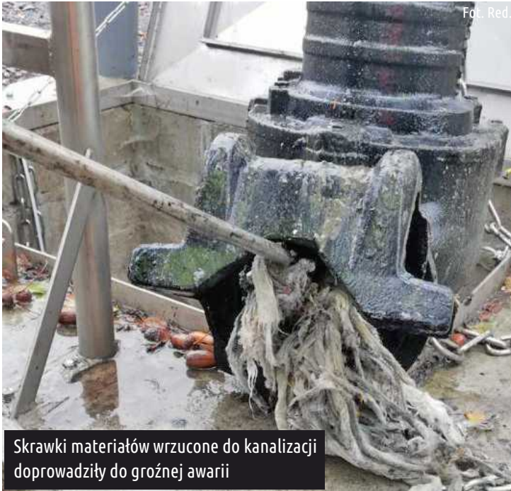
Skrawki materiałów wrzucone do kanalizacji doprowadziły do groźnej awarii