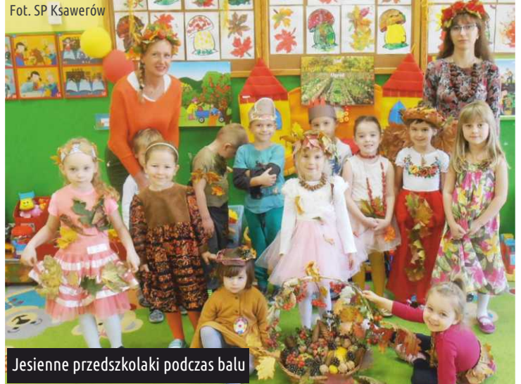
Jesiennie przedszkolaki podczas balu

Przedшкоlaki we wspaniałych jesiennych przebraniach wykonanych z pomocą rodziców spędziły czas na wesołej zabawie i dzielnie zmagaly się z zadaniami konkursowymi przygotowanymi na Turniej Jesienny. Na zakończenie zabawy, każdy uczestnik został nagrodzony naklejkami na ścianę (przekazanymi przez Firmę JUMI Sp. z o.o. Spółka komandytowa w Pabianicach). Milusińskim bardzo podobała się jesienna zabawa i z niecierpliwością oczekują na kolejne wydarzenia przedszkolne. Mimo jesiennego aury w oddziale przedszkolnym jest zawsze kolorowo i z humorem. Tutaj nie ma czasu na nudę. Serdeczne podziękowania za podarunki, które wywołały u dzieci ogromną radość. Oddziały Przedszkolne SP w Ksawerowie