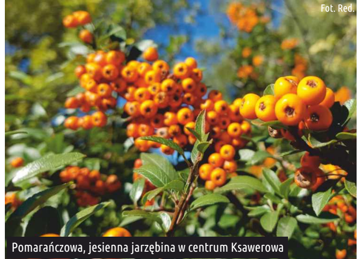
Pomarańczowa, jesienna jarzębina w centrum Ksawerowa