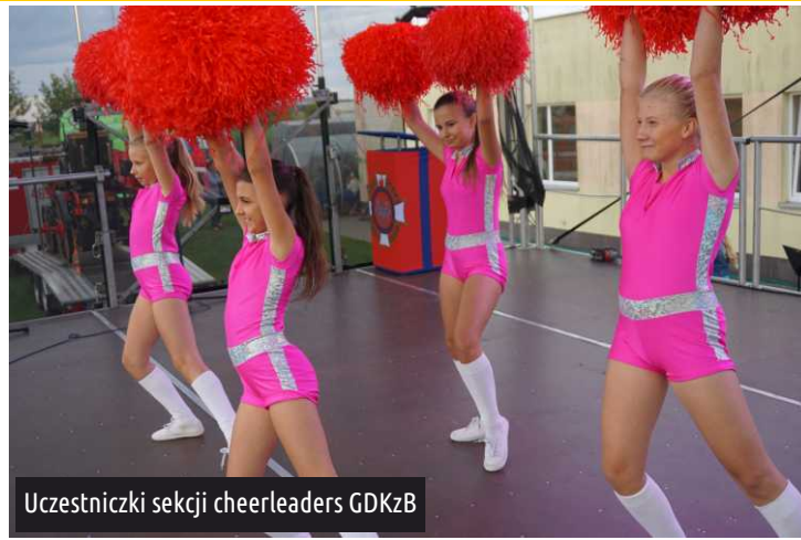
Uczestniczki sekcji cheerleaders GDKzB