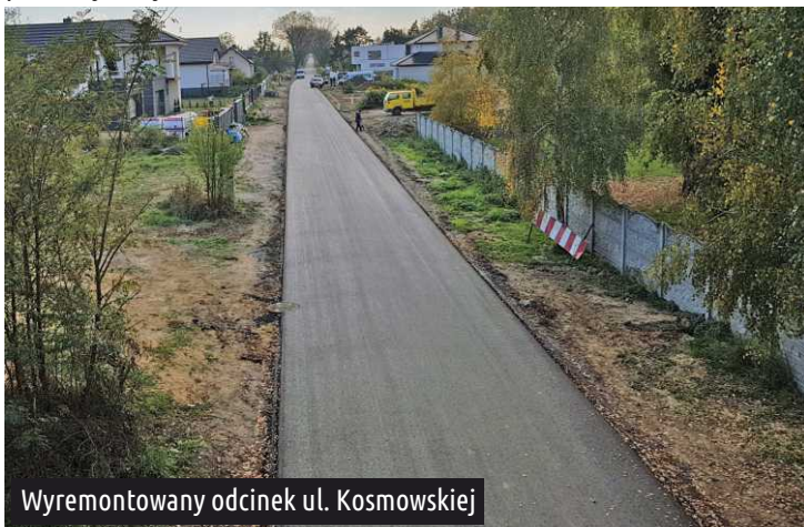
Wyremontowany odcinek ul. Kosmowskiej

W ulicy Kosmowskiej na odcinku od ul. Tylnej do ul. Różanej jest już położony nowy asfalt.