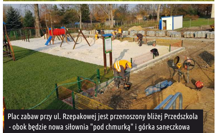
Plac zabaw przy ul. Rzepakowej jest przenoszony bliżej Przedszkola - obok będzie nowa siłownia "pod chmurką" i górką saneczkowa