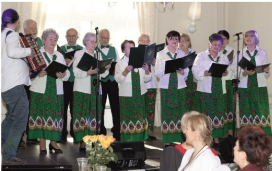
Kolaż zdjęciowy przedstawia osoby uczestniczące w spotkaniu noworocznym. Zdjęcia są archiwalne.