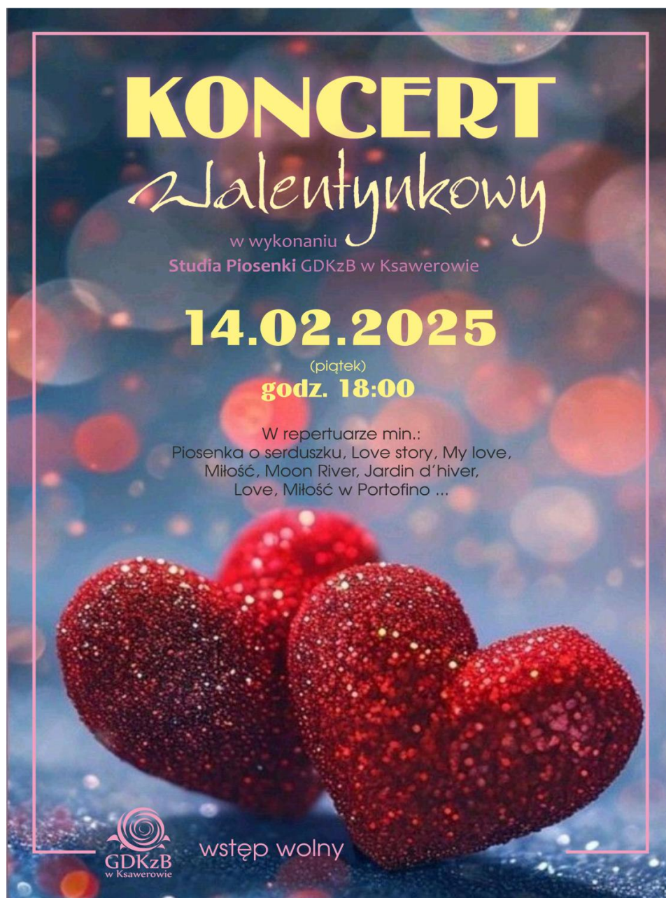
Grafika obrazuje informację o koncercie walentynkowym. Grafikę wykonał Gminny Dom Kultury z Biblioteką w Ksawerowie.