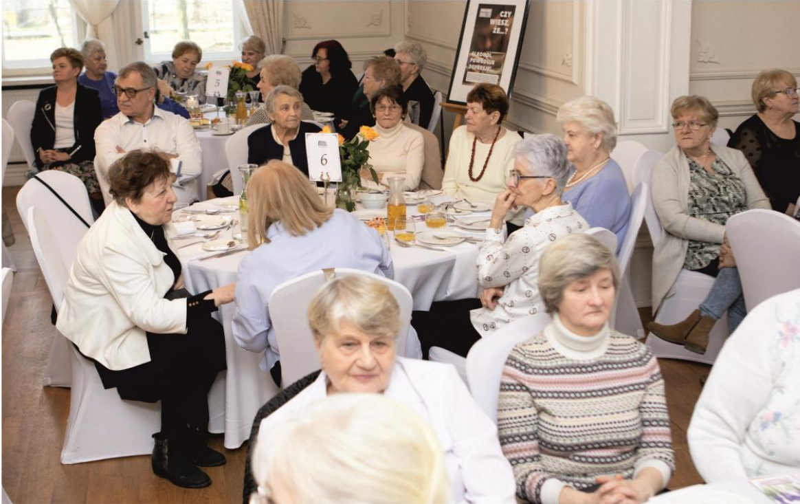
Kolaż zdjęciowy przedstawia osoby uczestniczące w spotkaniu noworocznym. Zdjęcia są archiwalne.