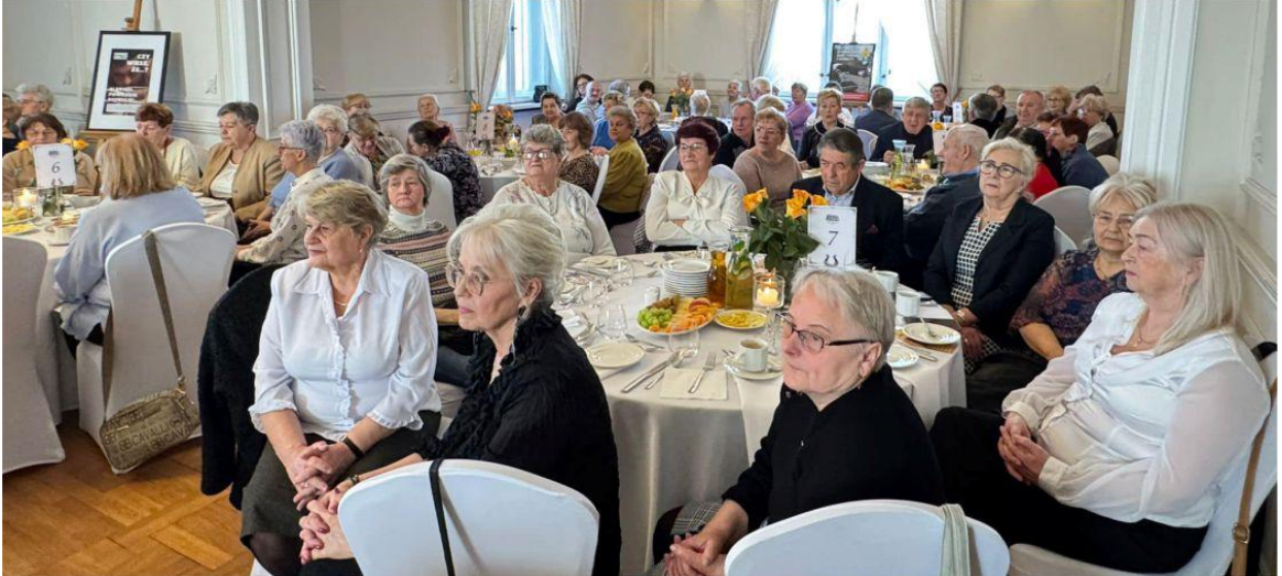
Kolaż zdjęciowy przedstawia osoby uczestniczące w spotkaniu noworocznym. Zdjęcia są archiwalne.