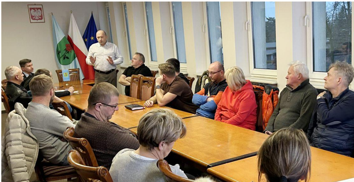
Zdjęcie przedstawia uczestników spotkania. Fotografia jest archiwalna.

Kolejne spotkanie odbędzie się już niebawem, a mieszkańcy zostaną o nim poinformowani z wyprzedzeniem.