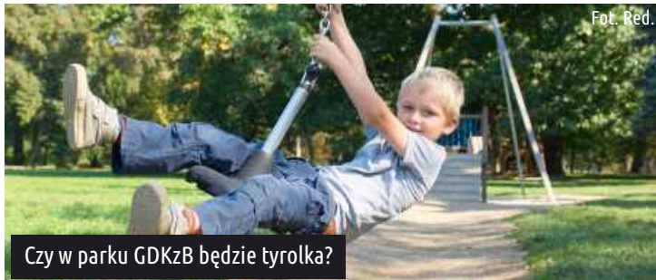
Czy w parku GDKzB będzie tyrolka?