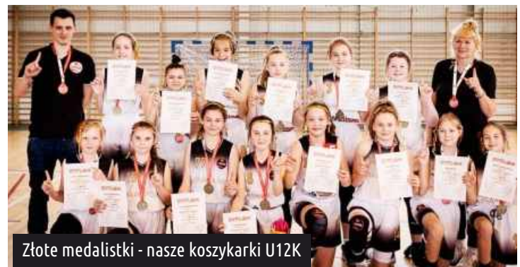
Złote medalistki - nasze koszykarki U12K