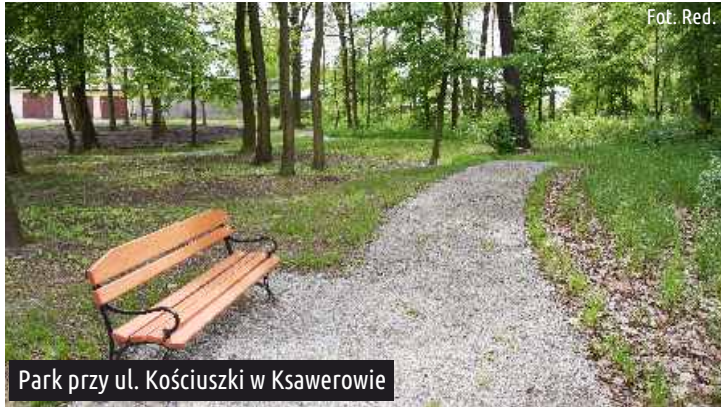
Park przy ul. Kościuszki w Ksawerowie