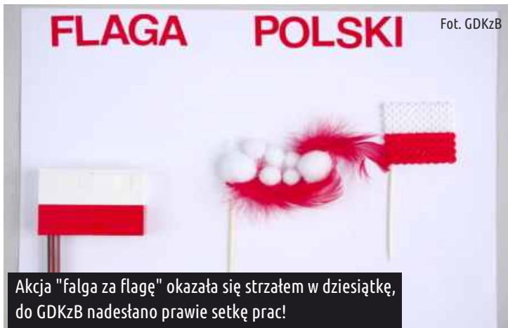
Akcja "falga za flagę" okazała się strzałem w dziesiątkę, do GDKzB nadesłano prawie setkę prac!

Dowiedz się więcej na... www.kultura-ksawerow.com