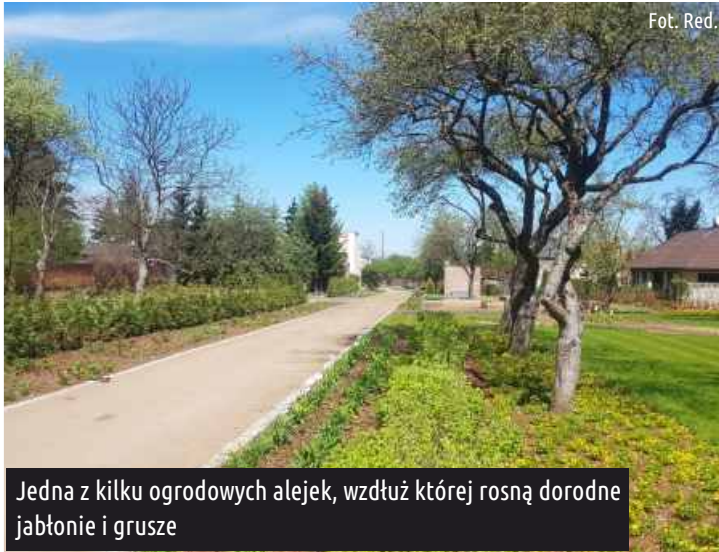
Jedna z kilku ogrodowych alejek, wzdłuż której rosną dorodne jabłonie i grusze

Aflopark zaskakuje tym, że w wielu miejscach nie ma tradycyjnych alejek – chodzi się po trawnikach. Dlaczego tak?