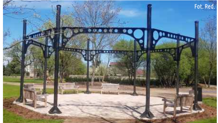
W ogrodzie nie brakuje ławek, klimatycznych miejsc do odpoczynku