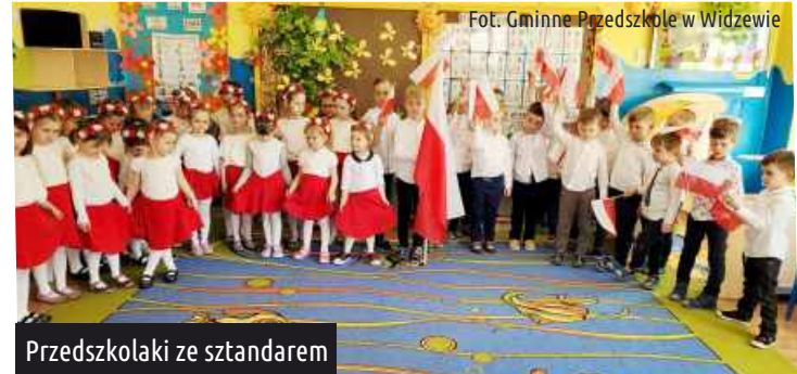
Przedkolaki ze sztandarem