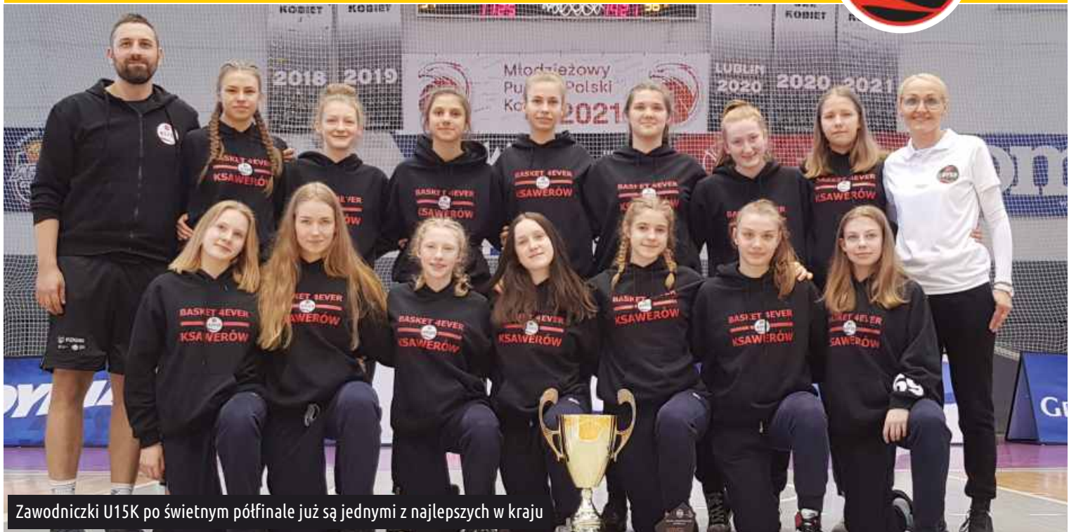
Zawodniczki U15K po świetnym półfinale już są jednymi z najlepszych w kraju