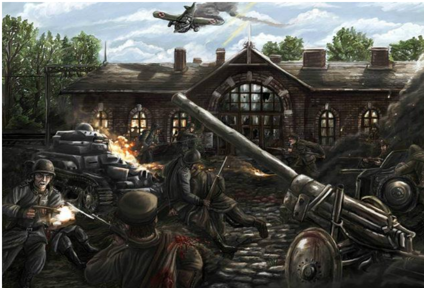
Autor grafiki: Arkadiusz Olszewski

RAJD FINANSOWANY JEST ZE ŚRODKÓW URZĘDU MARSZAŁKOWSKIEGO W ŁODZI ORAZ GMINY KSAWERÓW Pabianice, 28 września 2019