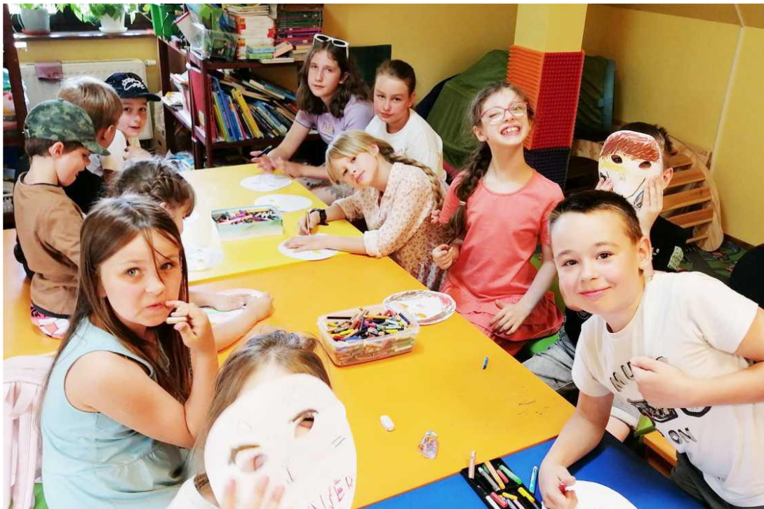
Zdjęcie przedstawia dzieci podczas letnich warsztatów w Gminnym Domu Kultury z Biblioteką w Ksawerowie. Fotografia jest archiwalna.