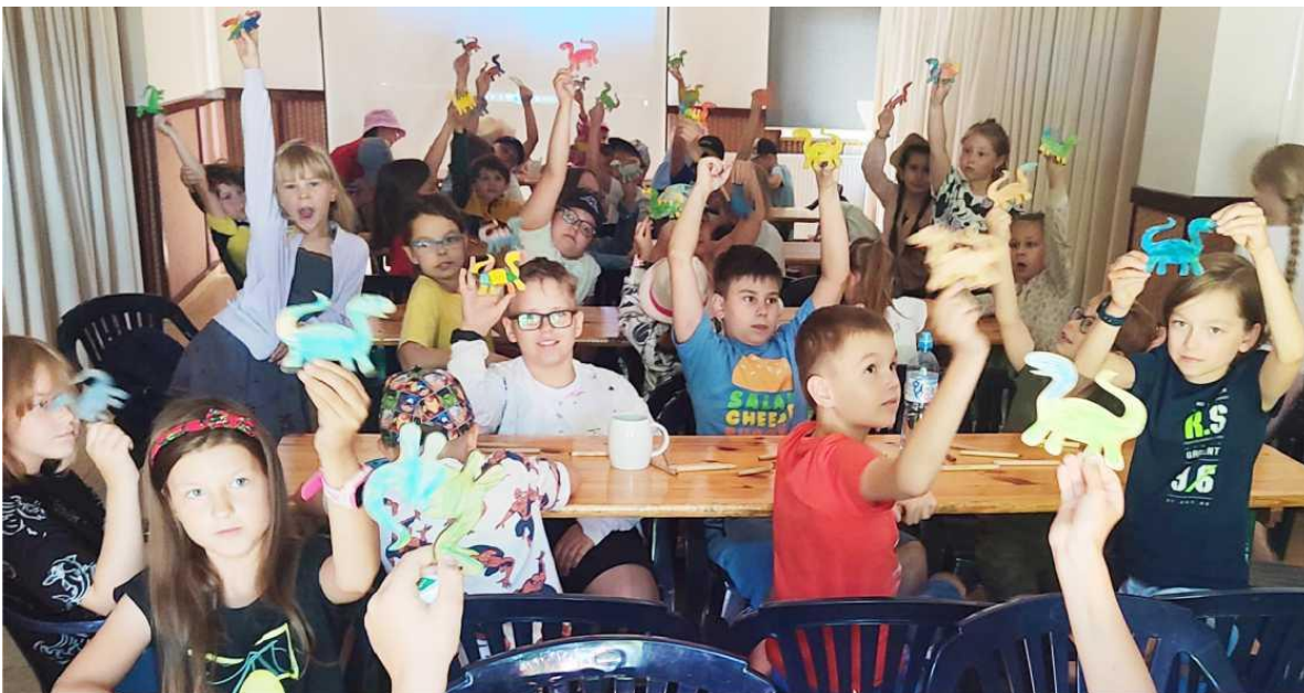
Zdjęcie przedstawia dzieci podczas letnich warsztatów w Gminnym Domu Kultury z Biblioteką w Ksawerowie. Fotografia jest archiwalna.