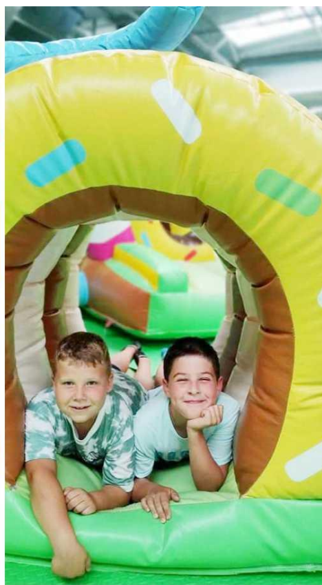
Zdjęcie przedstawia dzieci podczas półkolonii w ABC. Fotografia jest archiwalna.