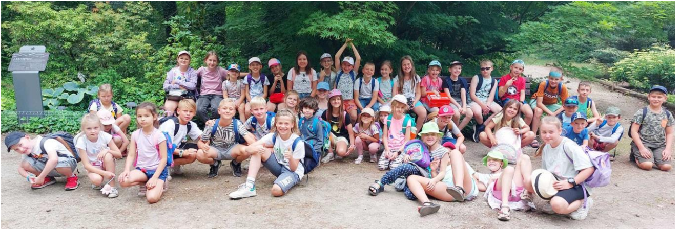
Zdjęcie przedstawia dzieci podczas letnich warsztatów w Gminnym Domu Kultury z Biblioteką w Ksawerowie. Fotografia jest archiwalna.