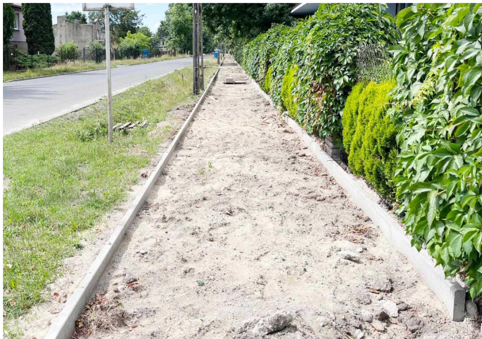
Fotografia przedstawia remont chodnika wzdłuż ulicy Traktorowej.