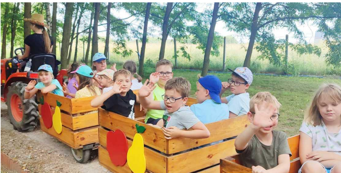
Zdjęcie przedstawia dzieci podczas letnich warsztatów w Gminnym Domu Kultury z Biblioteką w Ksawerowie. Fotografia jest archiwalna. Informację przygotowała redakcja.