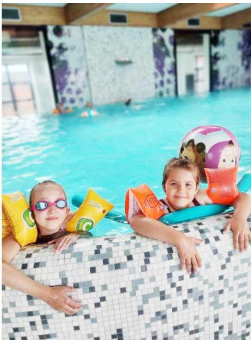
Zdjęcie przedstawia dzieci podczas półkolonii w ABC. Fotografia jest archiwalna.