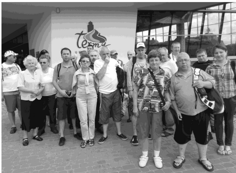
Pamiątka ze spotkania - wspólne zdjęcie z wycieczki do Uniejowa