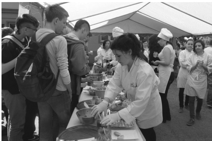
Podczas pikniku zawodów dużym powodzeniem cieszyło się stoisko kulinarne

W II edycji Ogólnopolskiego Międzyszkolnego Konkursu Kulinarного „Smaki wsi” szkołę reprezentowały dwie drużyny.