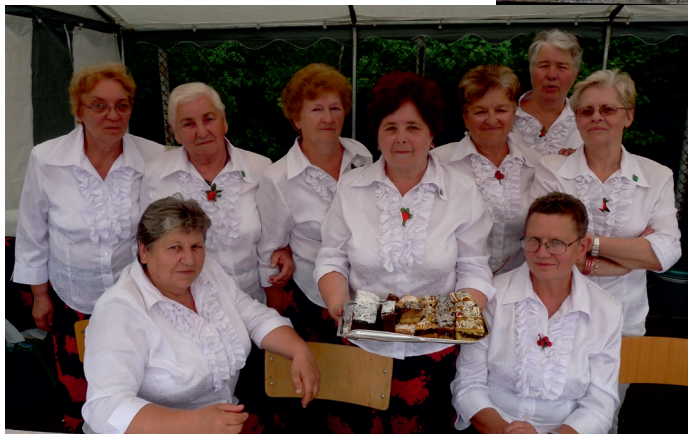
Panie z Kola Gospodyń Wiejskich w Ksawerowie