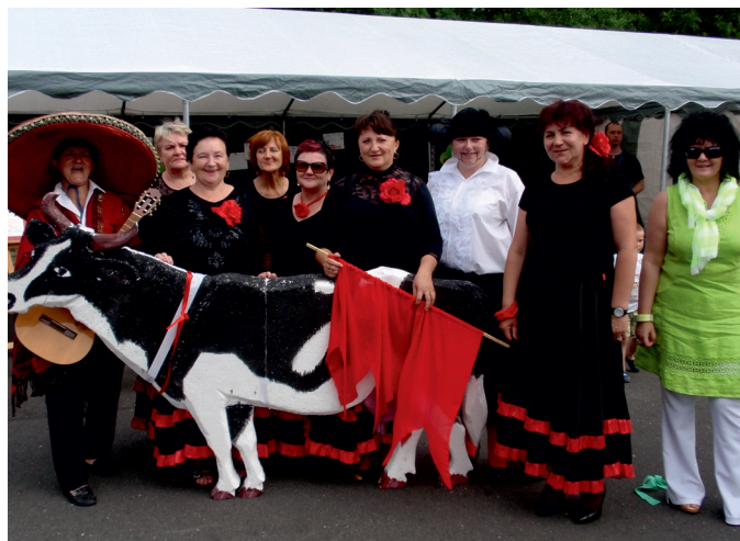
Panie z Kola Gospodyni Wiejskich z Woli Zaradzyńskiej przed występem