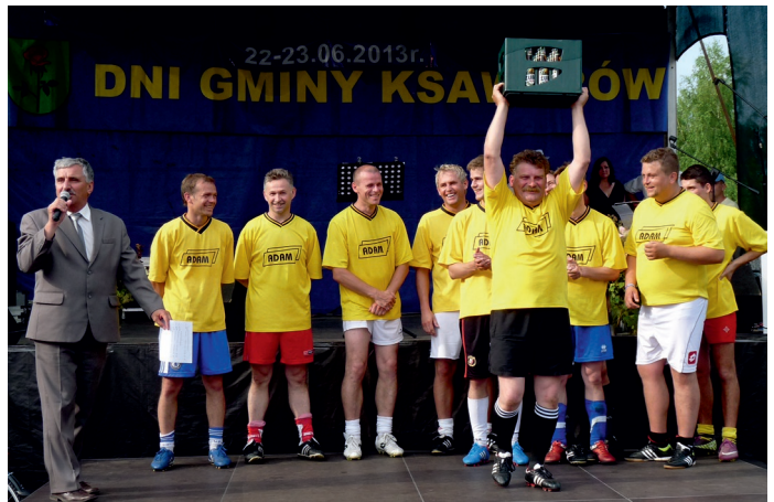
W rozgrywkach piłkarskich zwyciężyła drużyna Biznesmenów (na zdjęciu), II miejsce zajęł GKS Rodzice, a III miejsce GKS Oldboje