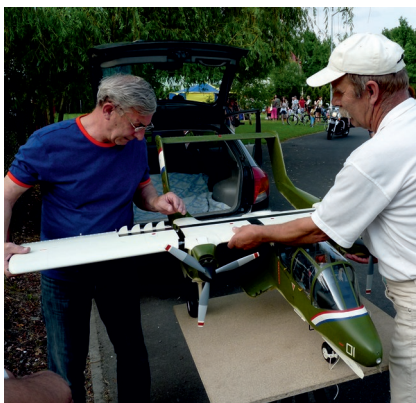
Przed prezentacją modeli latających