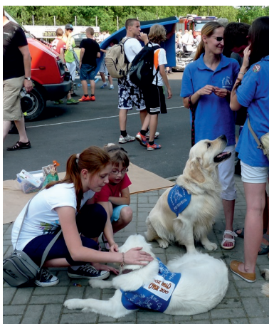
Sympatyczne psiaki do dogoterapii