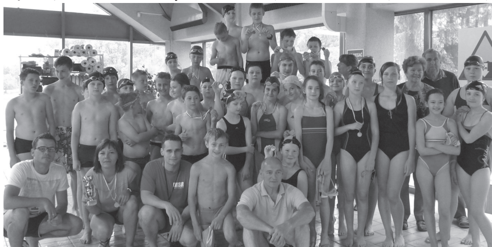
Uczestnicy Otwartych Mistrzostw Gminy w Pływaniu

W tej konkurencji taki awans zdarzył się po raz pierwszy w historii szkoły. Niestety ze względów obiektywnych nie mogliśmy wziąć udziału w tych prestiżowych zawodach (wycieczka klasowa).