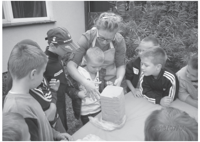
Zajęcia na półkoloniach w GDKzB w Ksawerowie

W ramach Gminnego Programu Profilaktyki i Rozwiązywania Problemów Alkoholowych i Gminnego Programu Przeciwdziałania Narkomanii 26 dzieci z terenu gminy Ksawerów skorzysta z wypoczynku. Pierwsze 15 dzieciaków, uczniów szkół podstawowych, wyjechało do miejscowości Małecz, gdzie będą do połowy lipca. Gimnazjaliści pojadą na koniec lipca na dwa tygodnie do Rogowa. Wypoczynek orga-