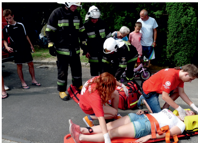
Dużym zainteresowaniem cieszył się pokaz ratownictwa w wykonaniu harcerzy i strażaków