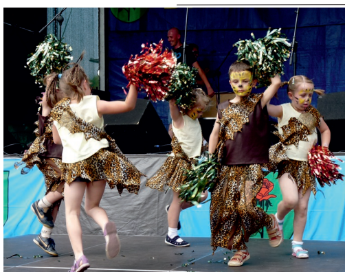
Afrykańskie rytmy w wykonaniu przedszkolaków z Widzewa