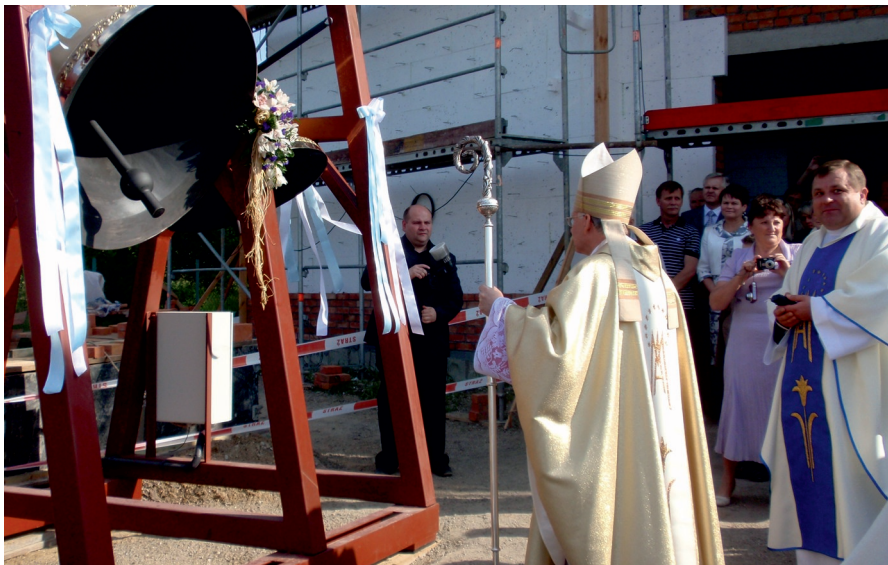
Poświęcenia i błogosławieństwa nowych dzwonów i krzyża dokonał ks. arcybiskup metropolita łódzki Marek Jędraszewski

W czerwcu minęło pięć lat od erygowania parafii pod wezwaniem Najświętszej Maryi Panny Niepokalanego Poczę-