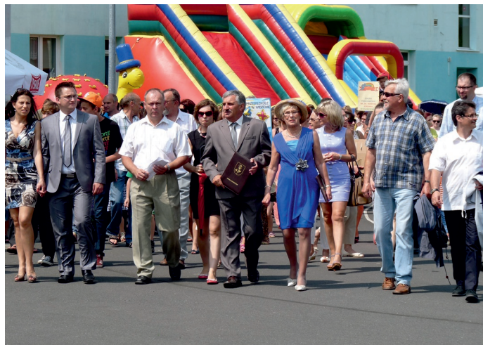
Gospodarze i goście rozpoczęli imprezę wspólnym przemarszem