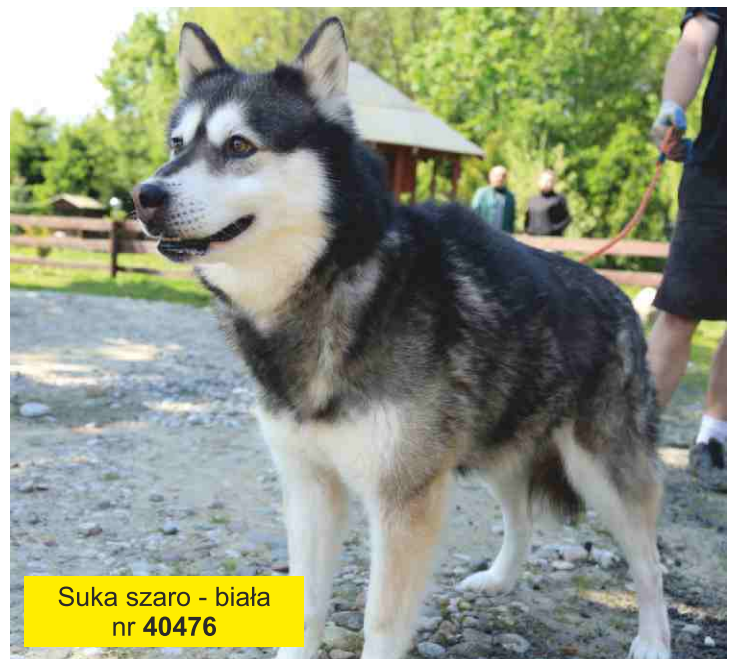
Suka szaro - biała nr 40476