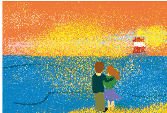
Praca wykonana przez Aleksandrę Rydz

Info: Szkoła Podstawowa z oddziałami przedszkolnymi w Ksawerowie