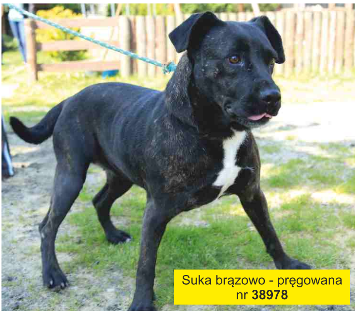
Suka brązowo - pręgowana nr 38978

Informujemy, iż zdjęcia pozostałych piesków będą umieszczane sukcesywnie w następnych wydaniach gazety.