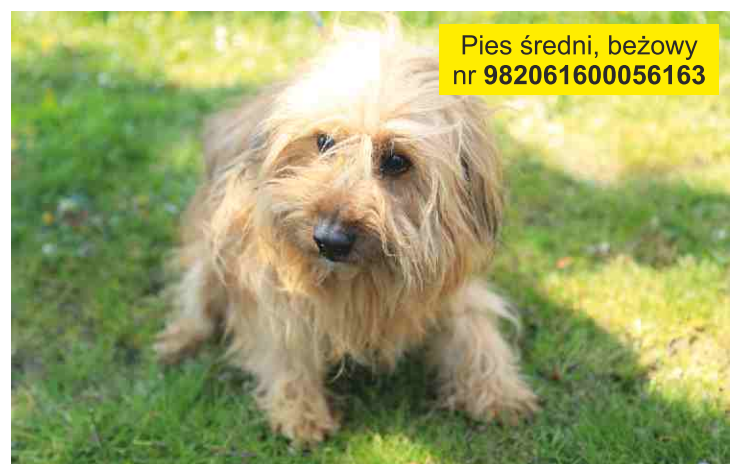
Pies średni, beżowy nr 982061600056163