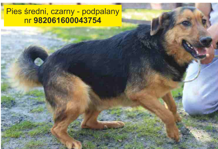
Pies średni, czarny - podpalany nr 982061600043754