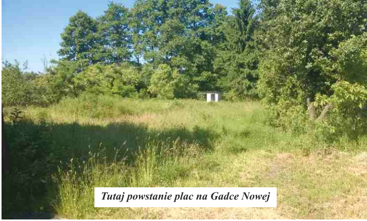
Tutaj powstanie plac na Gadce Nowej

Najmłodszy mieszkańcy naszej gminy już niebawem będą mogli cieszyć się z nowych miejsc do zabawy. Już wkrótce ruszają prace dotyczące budowy dwóch nowych placów zabaw. Pierwszy z nich powstanie przy ulicy Ogrodników na Gadce Nowej (przy Domu Rolnika), drugi przy ulicy Rzepakowej w Widzewie.