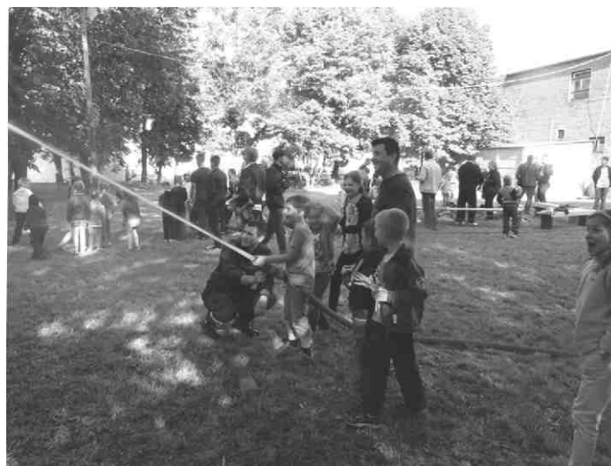
Info: Szkoła Podstawowa z oddziałami przedszkolnymi w Ksawerowie