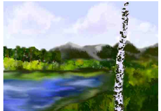
Praca wykonana przez Karolinę Ciebade