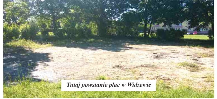
Tutaj powstanie plac w Widzewie