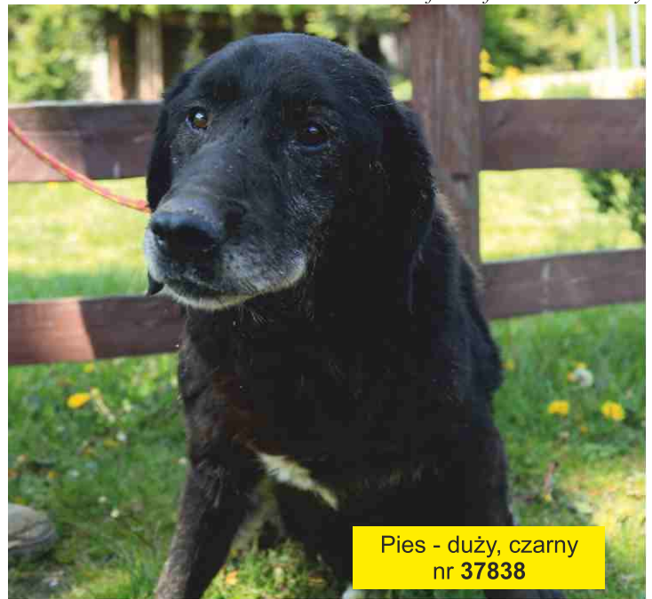
Pies - duży, czarny nr 37838