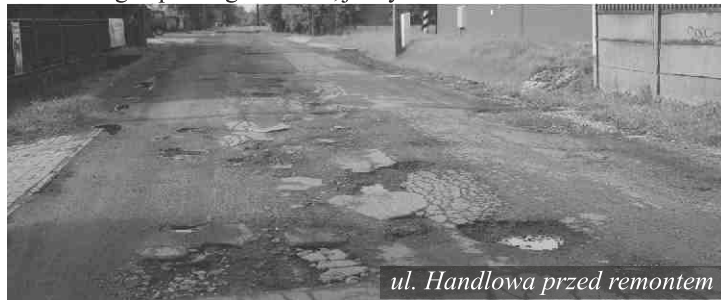
ul. Handlowa przed remontem

10 - letni Kamil napisał do wójta podanie, w który prosi go m.in. o naprawę ulicy przy której mieszka - ulicy Handlowej. Chłopiec wskazuje na dziury, które stanowią poważne zagrożenie podczas codziennego - pieszego marszu, jazdy rowerem lub samochodem.