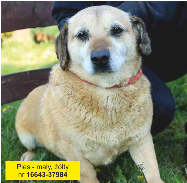
Pies - mały, żółty nr 16643-37984