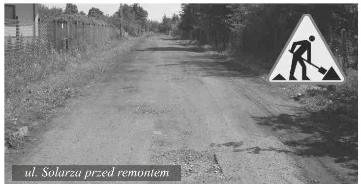
ul. Solarza przed remontem

Harmonogram przewiduje zakończenie wszystkich prac do końca września br., a wartość całego przedsięwzięcia to 947.000,14 zł.