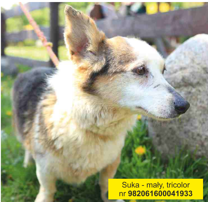
Suka - mały, tricolor nr 982061600041933