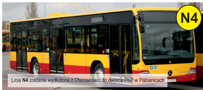
Linia N4 zostanie wydłużona z Chocianowic do dworca PKP w Pabianicach

W najbliższych dniach powinna wreszcie zakończyć się procedura uruchomienia linii nocnej N4, autobusu, którym mieszkańcy Ksawerowa (i nie tylko) będą mogli w soboty i niedziele dojechać do Łodzi i do dworca PKP w Pabianicach.