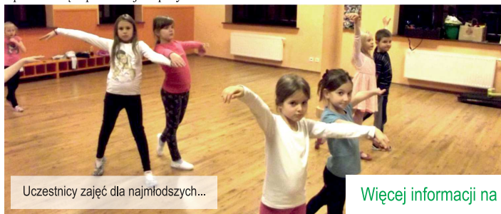
Uczestnicy zajęć dla najmłodszych...

Zajęcia te prowadzone są z myślą o najmłodszych dzieciach które ćwiczą nie tylko kroki, lecz także poprawiają swoją sprawność ruchową, koordynację, muzykalność oraz przelamują barierę wstydu. To najlepsza inwestycja w rozwój młodego człowieka, która z pewnością zapoczątkuje w przyszłości.