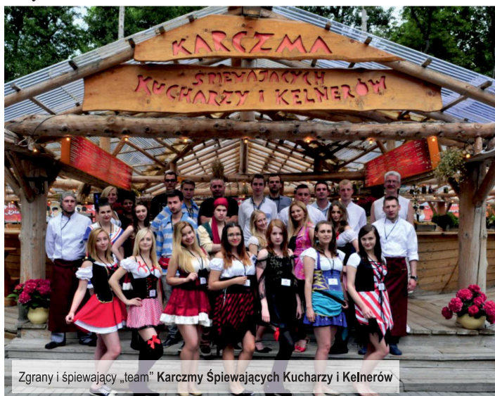
Zgrani i śpiewający „team” Karczmny Śpiewających Kucharzy i Kelnerów

Muzyka jest niezwykłą pasją. Wymaga szczególnego natchnienia i ponadprzeciętnej wrażliwości. Lecz satysfakcja z wyrażania własnych emocji i osobowości poprzez muzykę jest bezgraniczna.