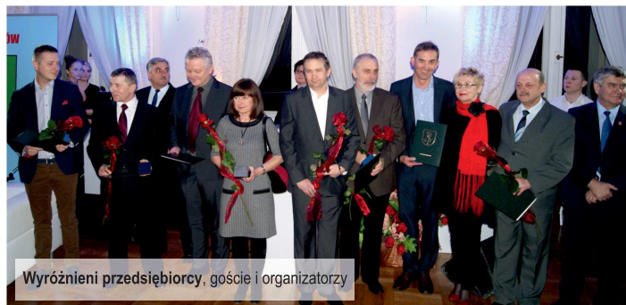
Wyróżnieni przedsiębiorcy, goście i organizatorzy

23 stycznia br. , zgodnie z cykliczną już tradycją wpisaną do gminnego kalendarza imprez, miało miejsce uroczyste wyróżnienie przedstawicieli lokalnego biznesu. Spotkanie wóldarzy gminy z przedsiębiorcami oraz zaproszonymi na tę okazję gośćmi, tak jak w roku ubiegłym, odbyło się w zabytkowym Pałacu Ksawerów.