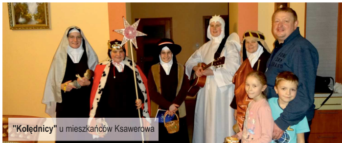
"Kołędnicy" u mieszkańców Ksawerowa

info: Zgromadzenie Sióstr Karmelitanek Dzieciątka Jezus w Ksawerowie