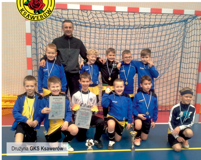
Drużyna GKS Ksawerów

W dniu 6 grudnia 2014 r., w Szczercowie odbył się „Mikołajkowy” Turniej piłkarski. Udział w nim wzięły następujące drużyny: