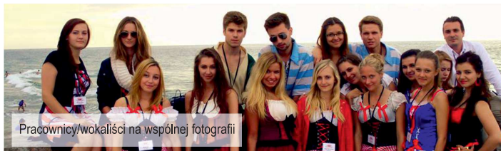
Pracownicy/wokaliści na wspólnej fotografii

Jako absolwentka szkoły muzycznej nie mogę narzekać na brak występów scenicznych, ale zazwyczaj jest to zupełnie inny rodzaj publiki. Wychodząc z koncertu znów staję się osobą anonimową i wracam do normalnego życia. W Darłówku wychodząc na ulicę, byłam zawsze łączona przez przechodniów z tą konkretną śpiewającą kelnerką. Bardzo często turyści nawiązywali do rozmowy i pozdrawiali na deptaku pytając, czy przygotuję dla nich dany utwór. Przede wszystkim taka praca daje bardzo duże obycie z różną publicznością.