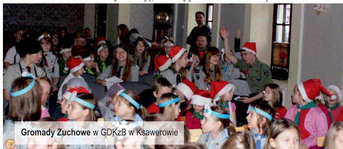
Gromady Zuchowe w GDKzB w Ksawerowie

Ostatnią, zaplanowaną na 2014 rok imprezą w Gminnym Domu Kultury z Biblioteką był gościnnie organizowany przez Namiestnictwo zuchowe Hufca ZHP Pabianice przeгляд kołed i pastorałek. Cały sobotni poranek aż do popołudnia na scenie prezentowały się gromady zuchowe. Był Mikołaj, Elf i wiele atrakcji. Wszyscy mali przyjaciele spisali się na medal. Było bardzo świątecznie i bardzo sympatycznie. Mamy nadzieję, że zuchy jeszcze nas odwiedzą!