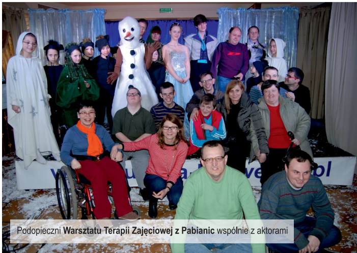
Podopieczni Warsztatu Terapii Zajęciowej z Pabianic wspólnie z aktorami

Spektakl „Kraina Lodu”, który swoją premierę miał pod koniec lutego br. w GDKzB cieszy się niesłabnącym zainteresowaniem. Do dnia 24 marca br. spektakl ten w wykonaniu aktorów z sekcji teatralnej GDKzB w Ksawerowie obejrzało 1070 widzów ...ten rekord będzie ciężko pobić.