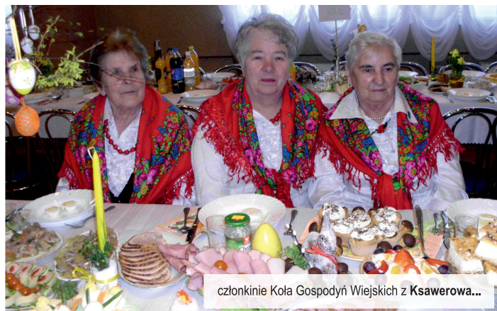
członkinie Koła Gospodyń Wiejskich z Ksawerowa...

W dniu 21 marca br. w sali OSP w Kudrowicach miał miejsce pokaz wyjątkowo pięknych stołów wielkanocnych. W spotkaniu udział wzięło dziesięć kół z całego powiatu pabianickiego. Koło Gospodyń Wiejskich z Nowej Gadki zajęło pierwsze miejsce wśród wyróżnionych, zaś gospodynie z Ksawerowa mogą pochwalić się miejscem drugim. Wśród gości specjalnych znaleźli się m.in. wójtowie oraz radni z gminy Ksawerów oraz Pabianice.