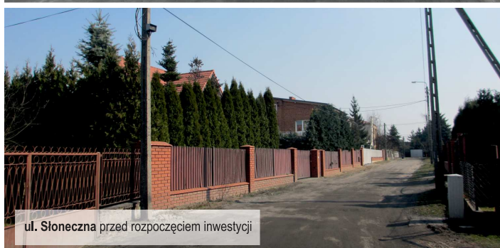
ul. Słoneczna przed rozpoczęciem inwestycji