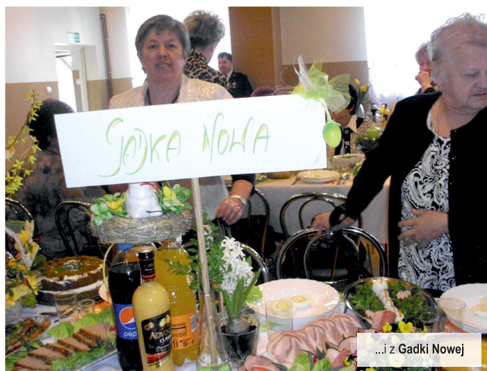
...i z Gadki Nowej