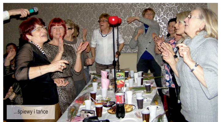
...śpiewy i tańce

Oferty prosimy składać do dnia 15 kwietnia 2015 r. w sekretariacie Gminnego Domu Kultury z Biblioteką w Ksawerowie, ul. Jana Pawła II 1, lub poprzez e-mail: gdkzb@ksawerow.com