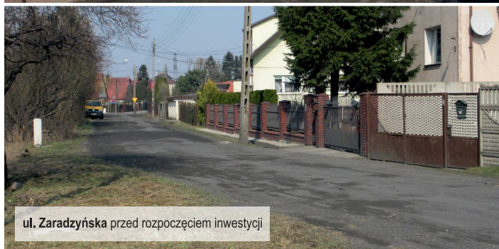
ul. Zaradzińska przed rozpoczęciem inwestycji