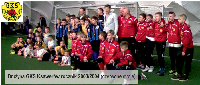
Drużyna GKS Ksawerów rocznik 2003/2004 (czerwone stroje)