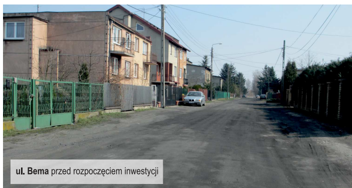
ul. Bema przed rozpoczęciem inwestycji