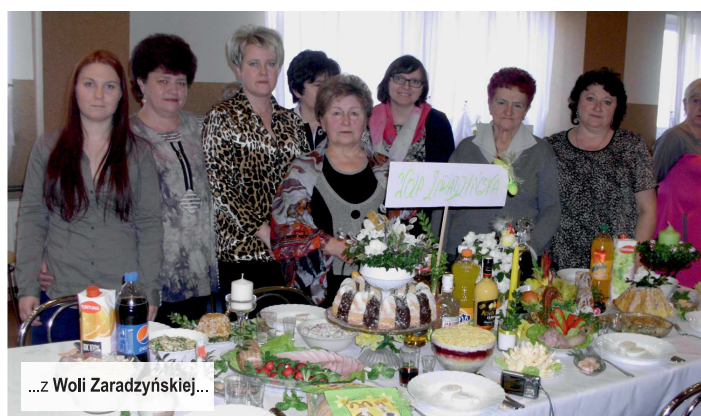
...z Woli Zaradzińskiej...