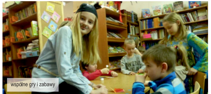
wspólne gry i zabawy

Dni Otwarte skłoniły do wizyty nie tylko mieszkańców naszej gminy, ale również rodziców spoza terenu naszego obwodu szkolnego. Jest to powód do zadowolenia i satysfakcji dla organizatorów Dnia Otwartego oraz całej naszej szkoły