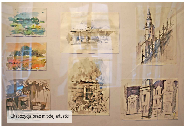
Ekspozycja prac młodej artystki

Jesteśmy ze sobą bardzo zżyci i spotykamy się także poza programem Funduszu. Mamy "fejsbukowe grupy", dzięki którym jesteśmy stale w kontakcie. Tworzymy grono dobrych znajomych. Nie rywalizujemy ze sobą, a wspieramy się i pomagamy.