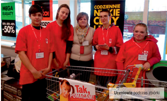
Uczniowie podczas zbiórki

W dniach 13-14 marca 2015 r. uczniowie ze Szkolnych Kół Caritas ze Szkoły Podstawowej i Gimnazjum w Ksawerowie wzięli udział w ogólnopolskiej zbiórce żywności w sklepie Biedronka organizowanej przez Caritas Archidiecezji Łódzkiej. Mieszkańcy Ksawerowa przekazali ponad 350 kg różnego rodzaju trwałej żywności, z której 70% trafiło do rodzin ksawerowskich będących w trudnej sytuacji rodzinnej lub materialnej.