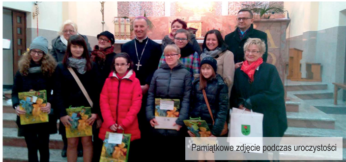
Pamiątkowe zdjęcie podczas uroczystości