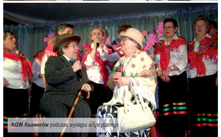
KGW Ksawerów podczas występu artystycznego

Więcej informacji na www.kultura-ksawerow.pl