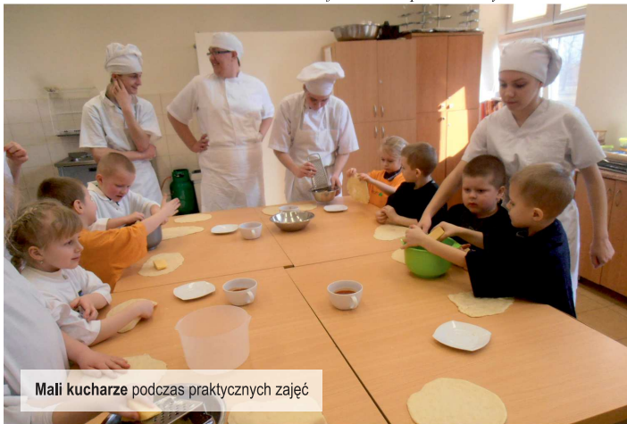
Mali kucharze podczas praktycznych zajęć

Na koniec najmłodszy podziękowali za możliwość odbycia zajęć i w dowód wdzięczności wręczyli przygotowane samodzielnie podziękowanie. Najedzeni i w dobrych nastrojach wszyscy szczęśliwie wrócili do zerówki. info: Oddział przedszkolny SP w Ksawerowie