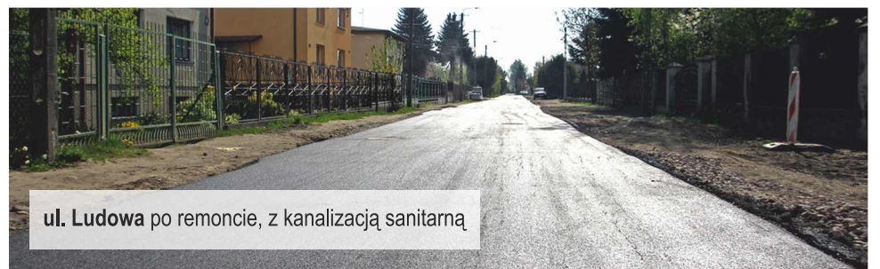
ul. Ludowa po remoncie, z kanalizacją sanitarną