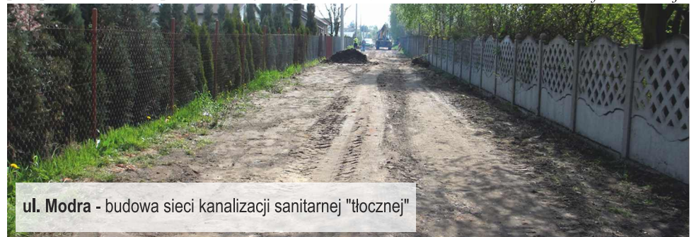
ul. Modra - budowa sieci kanalizacji sanitarnej "tłocznej"

Urząd Gminy stara się także o zwrot środków wydatkowanych na termomodernizację budynku gminy. Gmina otrzyma zwrot po pozytywnie zakończonej kontroli przeprowadzonej na początku maja br. przez Urząd Marszałkowski. info: Redakcja