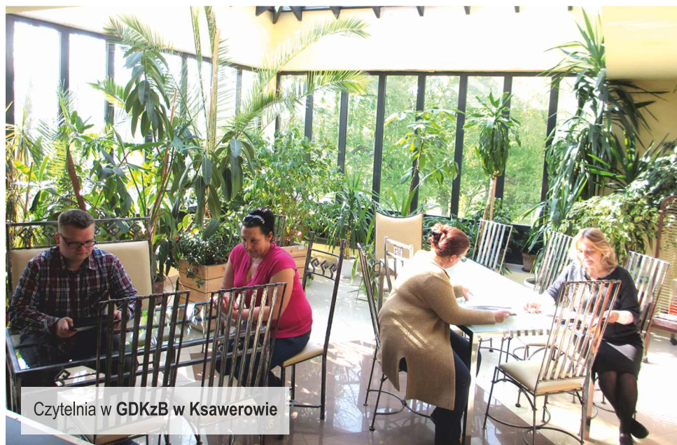
Czytelnia w GDKzB w Ksawerowie

Zapisać może się każdy. Oczywiście osoba niepełnoletnia robi to w obecności rodzica, opiekuna, w każdym razie musi to być osoba pełnoletnia, która podpisuje zobowiązanie że będzie odpowiedzialna za powierzony księgozbiór. Mamy swój regulamin, który przedstawiamy do akceptacji i wypisujemy kartę zgłoszeniową na podstawie dokumentu tożsamości. Są to standardowe procedury obowiązujące w innych placówkach tego typu. Dziecko może wypożyczyć jednorazowo trzy książki a osoba dorosła pięć na okres jednego miesiąca. Lektury wypożyczamy na dwa tygodnie z opcją ewentualnego przedłużenia. Biblioteka czynna jest od poniedziałku do soboty w następujących godzinach: pon. 13-20, wt. 8-15, śr. 9-15, czw. 13-20, pt. 11-17, sob. 9-12.