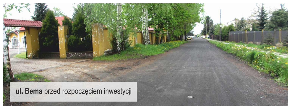
ul. Bema przed rozpoczęciem inwestycji