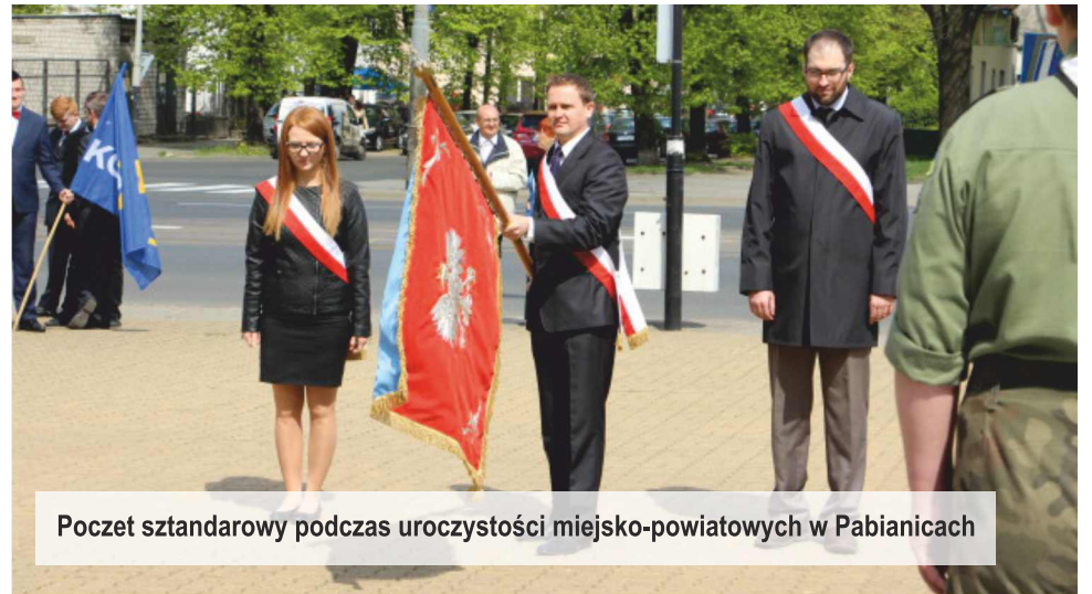
Poczet sztandarowy podczas uroczystości miejsko-powiatowych w Pabianicach