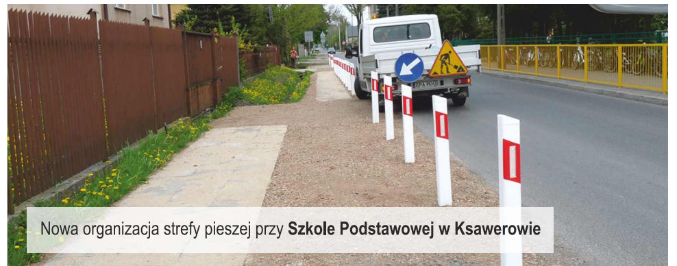
Nowa organizacja strefy pieszej przy Szkole Podstawowej w Ksawerowie

Już wkrótce mieszkańcy ul. Bema, ul. Zaradzińskiej i ul. Słonecznej otrzymają możliwość przyłączenia się do sieci kanalizacji sanitarnej, która niebawem powstanie w tych ulicach. Urząd Gminy wystąpił do POiŚ Fundusz Spójności na lata 2007 – 2013 (Projekt pod nazwą "Rozbudowa sieci kanalizacji sanitarnej na terenie Gminy Ksawerów") o możliwość dofinansowania do 85% kosztów kwalifikowanych tych inwestycji.