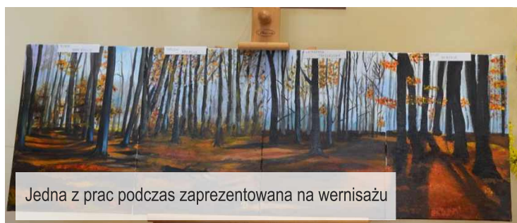
Jedna z prac podczas zaprezentowana na wernisażu

Wystawę będzie można oglądać jeszcze do 15 maja, od poniedziałku do piątku w godz. 11.00 - 20.00, oraz w soboty od 9.00 - 13.00. Zapraszamy!