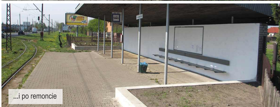
...i po remoncie