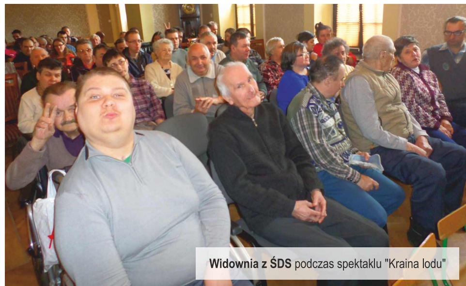
Widownia z ŚDS podczas spektaklu "Kraina lodu"