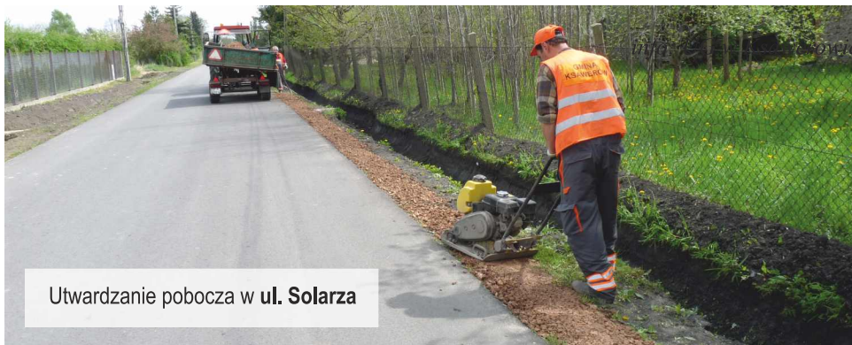
Utwardzanie pobocza w ul. Solarza

Na bieżąco są wykaszane rowy. Na początku maja w ulice wjechała maszyna czyszcząca krawężniki po zimie.