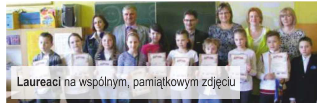
Laureaci na wspólnym, pamiątkowym zdjęciu