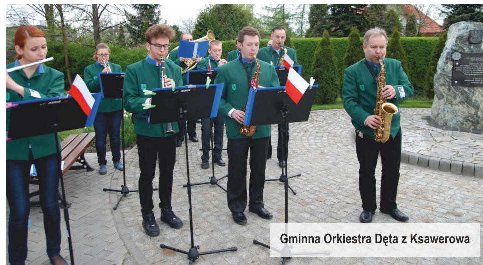
Gminna Orkiestra Dęta z Ksawerowa