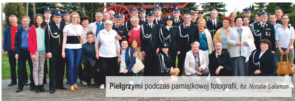
Pielgrzymi podczas pamiątkowej fotografii

Po raz trzeci Ochotnicza Straż Pożarna z Woli Zaradzyńskiej uczestniczyła w VII Ogólnopolskiej Pielgrzymce Strażaków na Jasną Górę . Pielgrzymka ta odbywa się co 5 lat, w tym roku strażacy spotkali się w Sanktuarium 26 kwietnia .