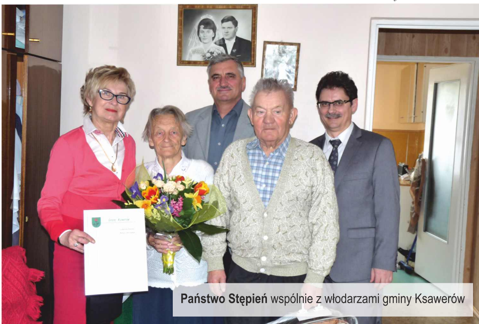
Państwo Stępień wspólnie z wóldarzami gminy Ksawerów

Z naszymi strażakami do Częstochowy pojechali również najbliżsi oraz sympatycy. Pielgrzymka zakończyła się wspólnym obiadem u sióstr zakonnych, po czym pełni wrażeń wróciliśmy do jednostki. Wszystkim uczestnikom dziękujemy za to, że mogliśmy razem spędzić ten szczególny dzień i modlić się nie tylko za strażaków, ale również w różnych intencjach osobistych. Do miłego spotkania za 5 lat na VIII Pielgrzymce.