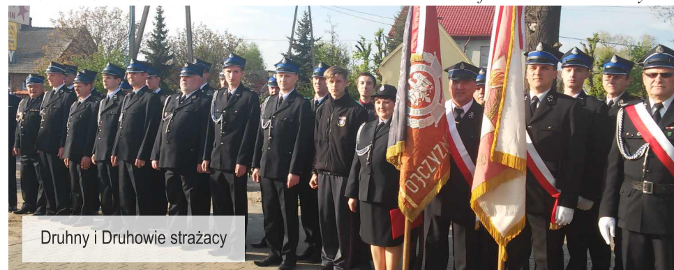
Druhny i Druhowie strażacy