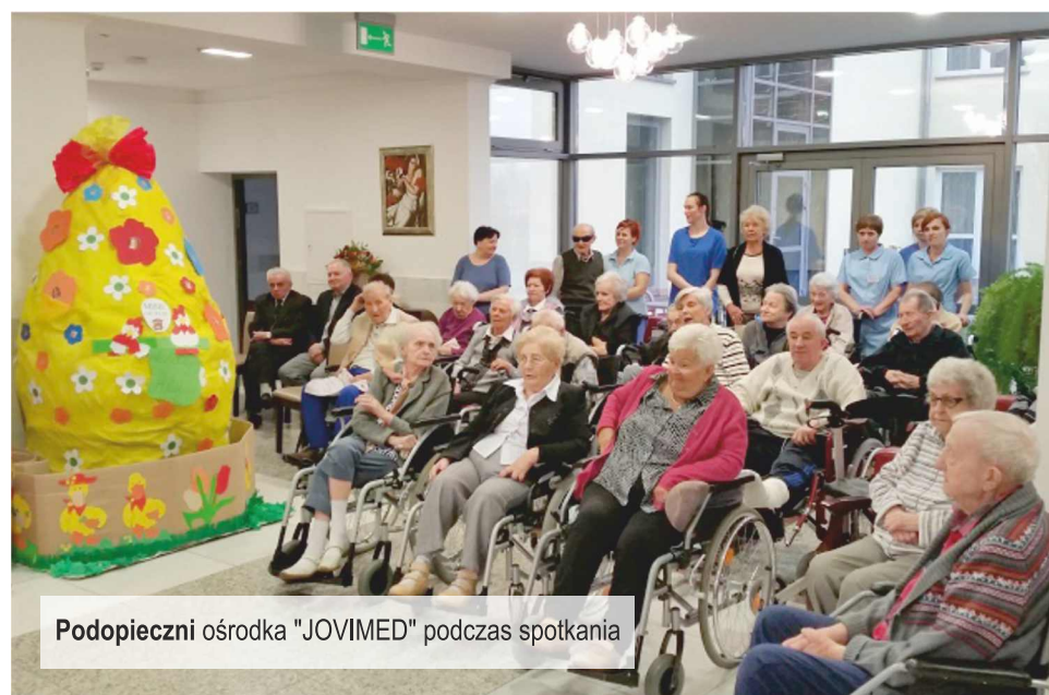
Podopieczni ośrodka "JOVIMED" podczas spotkania