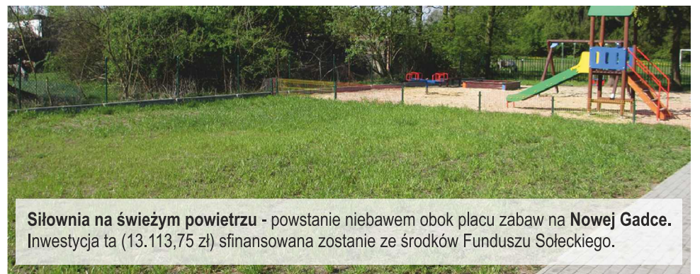
Siłownia na świeżym powietrzu - powstanie niebawem obok placu zabaw na Nowej Gadce . Inwestycja ta (13.113,75 zł) sfinansowana zostanie ze środków Funduszu Sołeckiego.