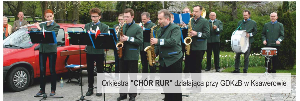
Orkiestra "CHÓR RUR" działająca przy GDKzB w Ksawerowie