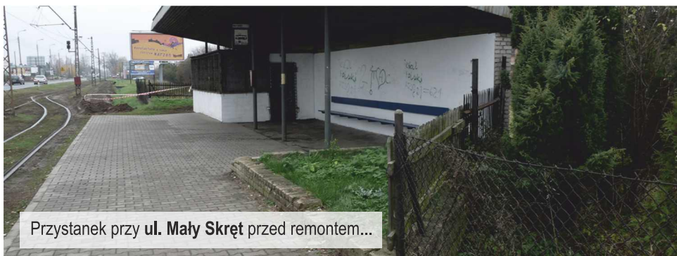
Przystanek przy ul. Mały Skręt przed remontem...