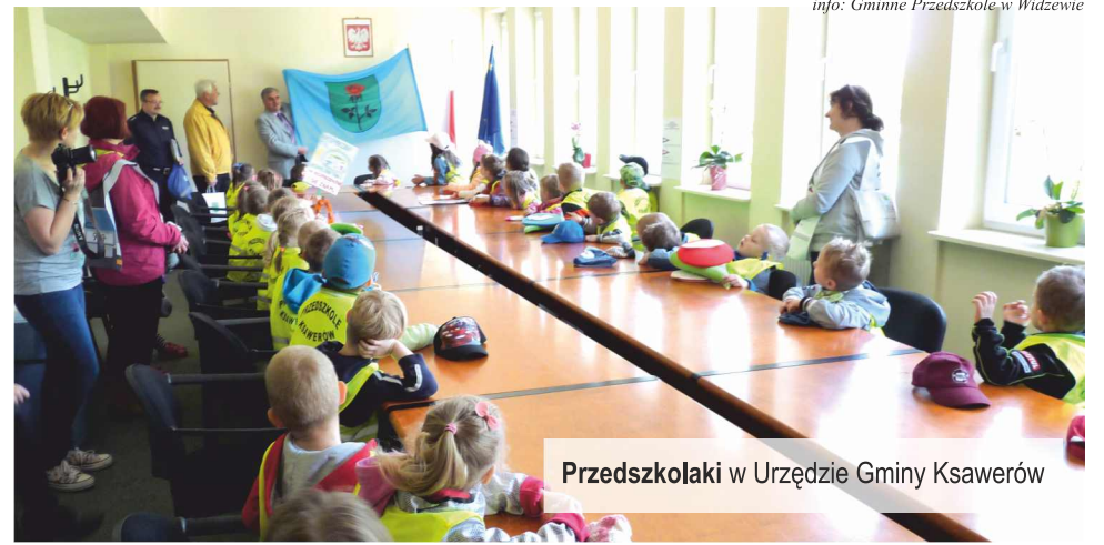
Przedszkolaki w Urzędzie Gminy Ksawerów