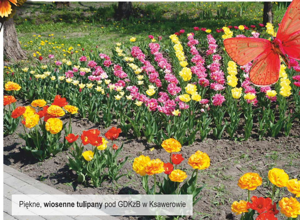
Piękne, wiosenne tulipany pod GDKZB w Ksawerowie