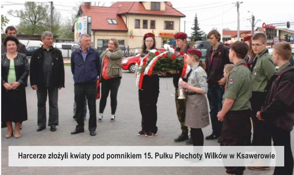
Harczerze złożyli kwiaty pod pomnikiem 15. Pułku Piechoty Wilków w Ksawerowie