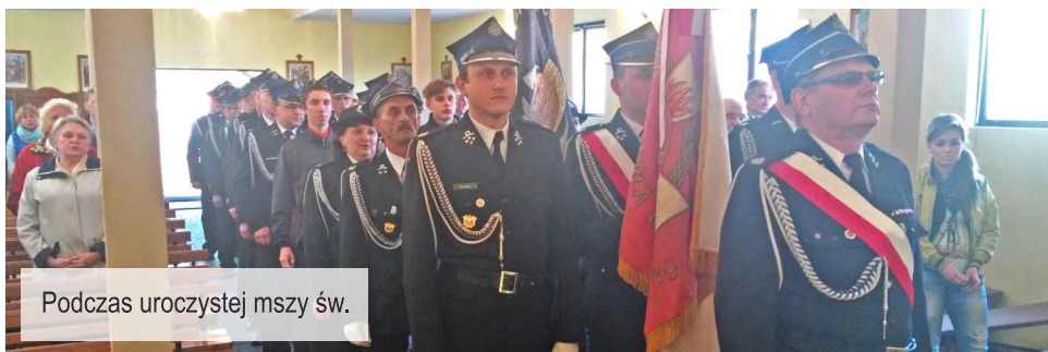
Podczas uroczystej mszy św.