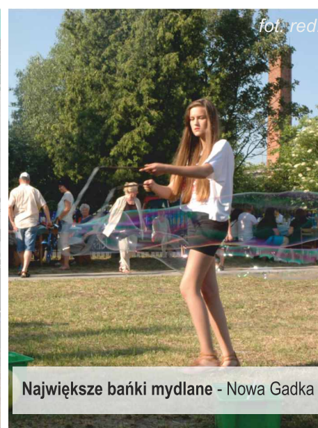
Największe bańki mydlane - Nowa Gadka