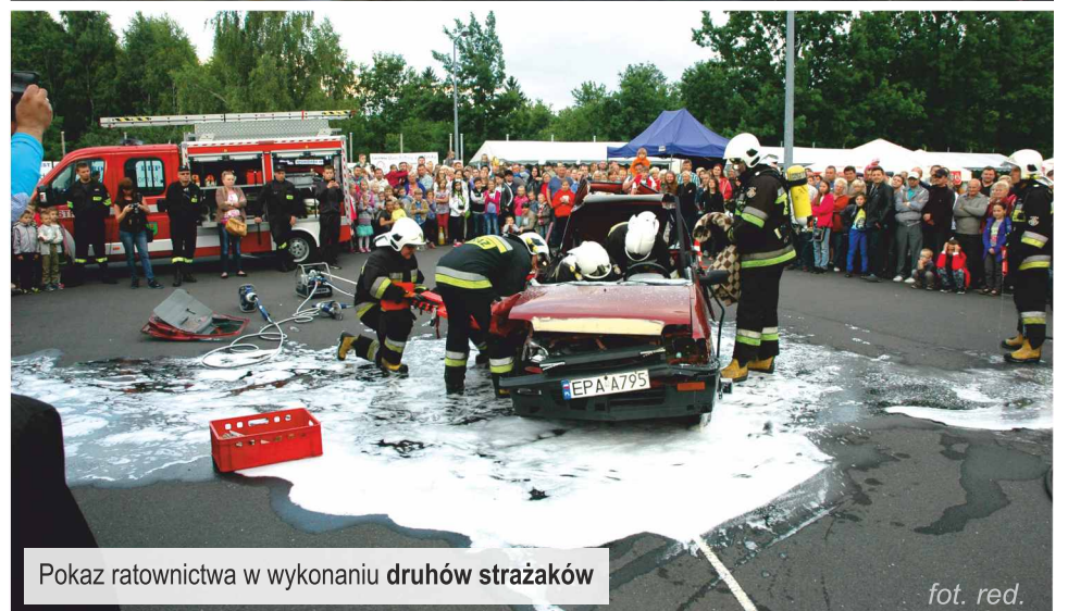
Pokaz ratownictwa w wykonaniu druhów strażaków