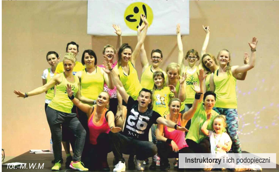
Instruktorzy i ich podopieczni

Spaliliśmy tysiące kalorii! Zamknęliśmy codzienność za drzwiami! A to wszystko za sprawą zumby, czyli fitnessowego szaleństwa zainspirowanego latynoskimi rytмами. Zumba przyciągnęła tego dnia wszystkich: młodszych i starszych, wszystkich którzy postanowili spędzić te kilka godzin aktywnie i pożytecznie. Pozytywny nastrój udzielał się każdemu bez wyjątku. Niektórzy nie dowierzali, że zumba potrafi wywoływać takie emocje.