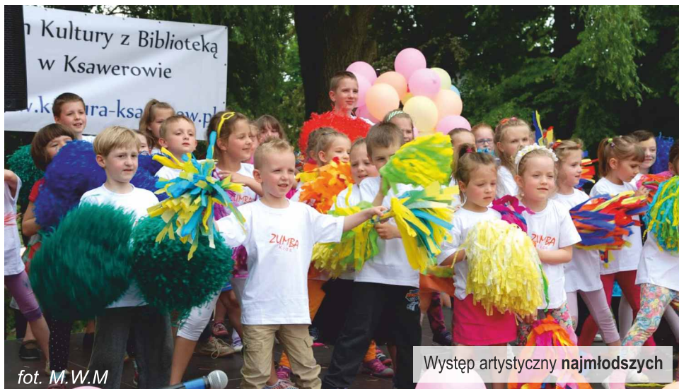
Występ artystyczny najmłodszych

Scena należała przede wszystkim do dzieci i młodzieży, na której ku uciesze rodziców i opiekunów, prezentowali swoje talenty i artystyczne umiejętności. Były pokazy taneczne: zumba kids, hip-hop, pokazy karate, pokaz młodych instrumentalistów oraz piosenkarzy.