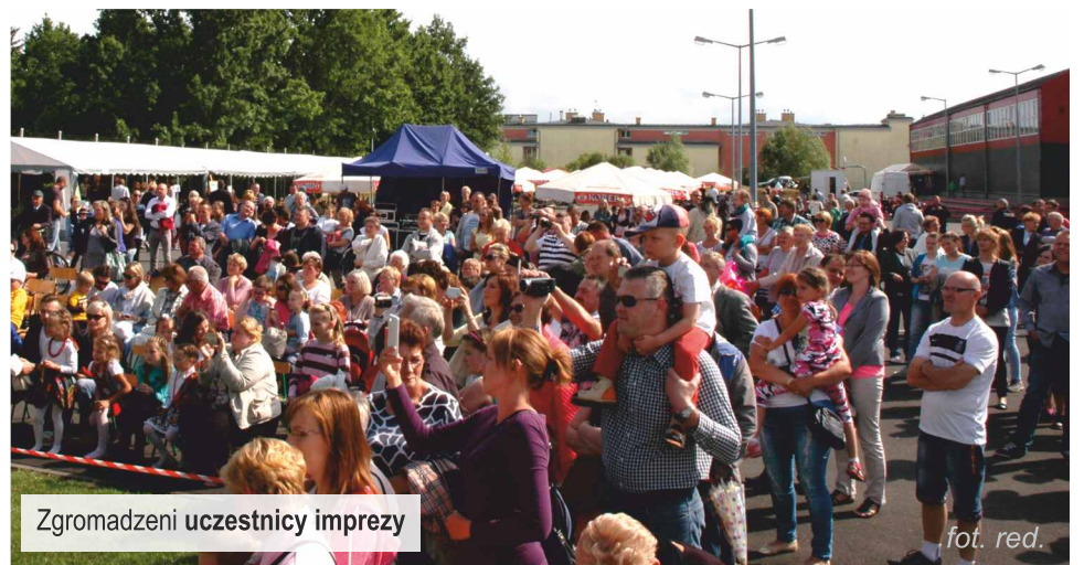
Zgromadzeni uczestnicy imprezy