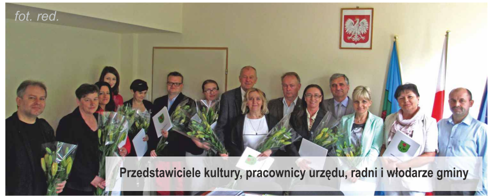
Przedstawiciele kultury, pracownicy urzędu, radni i wóldarze gminy