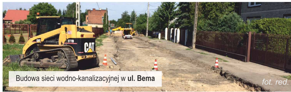
Budowa sieci wodno-kanalizacyjnej w ul. Bema