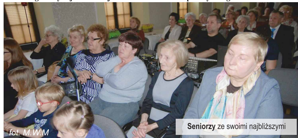
Seniorzy ze swoimi najbliższymi