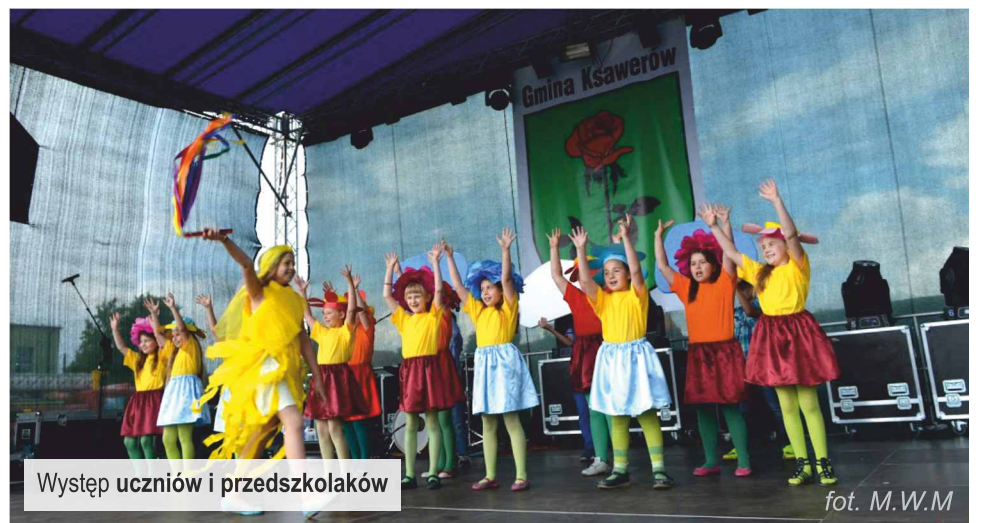
Występ uczniów i przedszkolaków