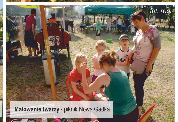
Malowanie twarzy - piknik Nowa Gadka