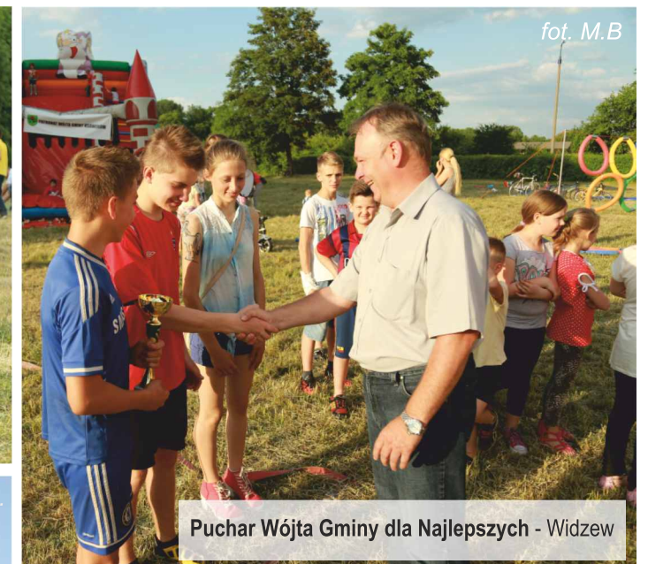
Puchar Wójta Gminy dla Najlepszych - Widzew