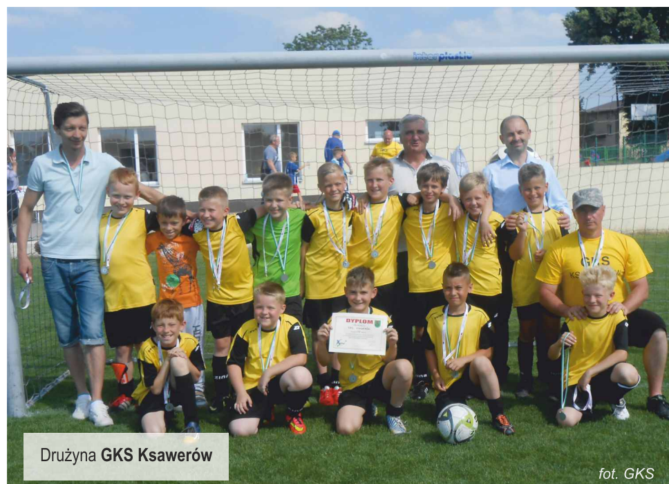
Drużyna GKS Ksawerów