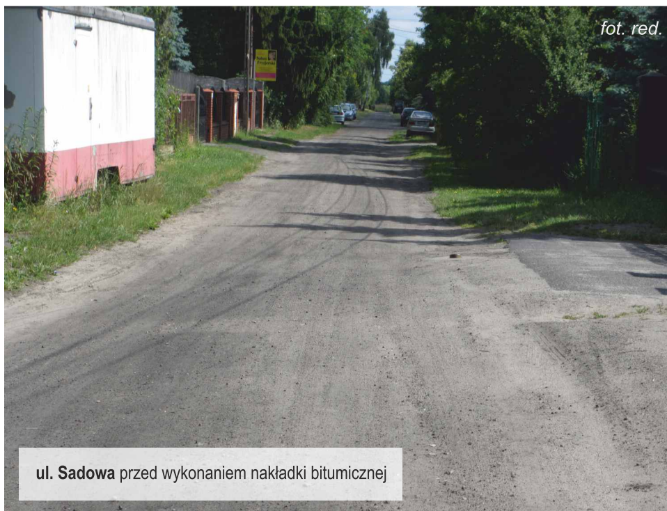
ul. Sadowa przed wykonaniem nakładki bitumicznej