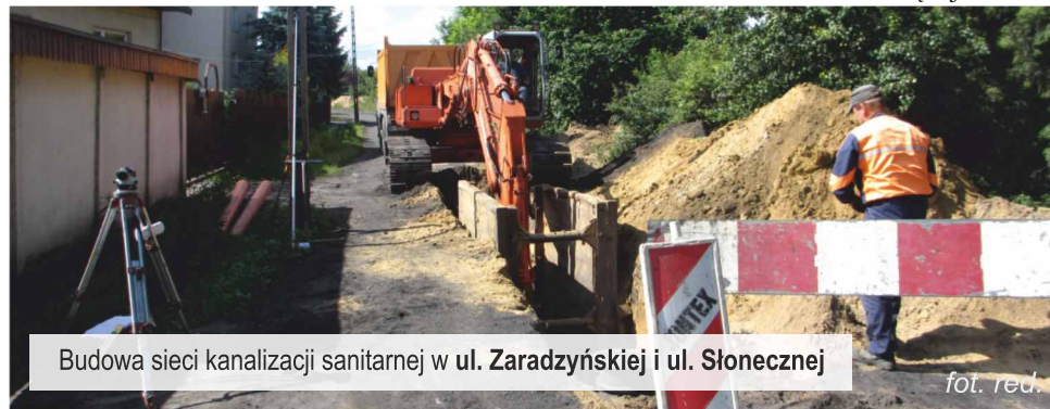
Budowa sieci kanalizacji sanitarnej w ul. Zaradzyńskiej i ul. Słonecznej