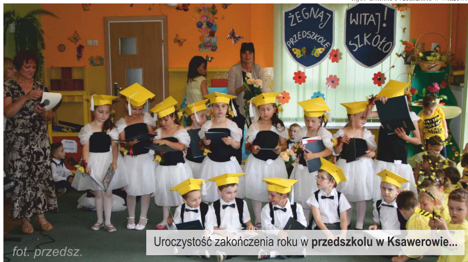
Uroczystość zakończenia roku w przedszkolu w Ksawerowie...