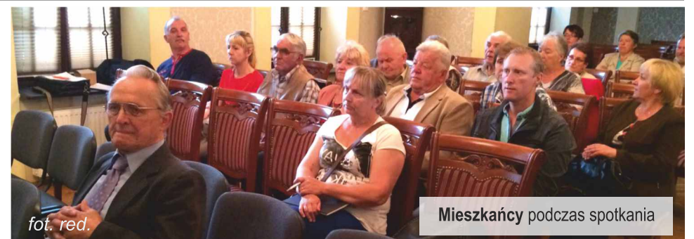
Mieszkańcy podczas spotkania