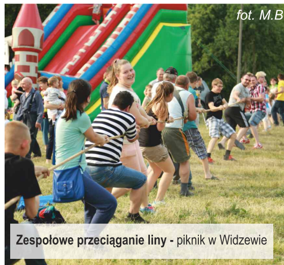
Zespołowe przeciąganie liny - piknik w Widzewie