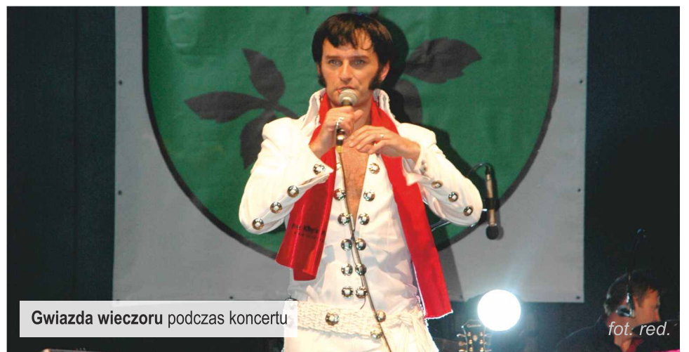
Gwiazda wieczoru podczas koncertu