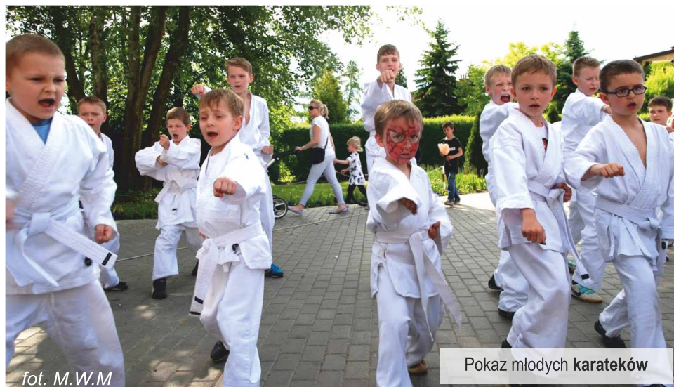
Pokaz młodych karateków