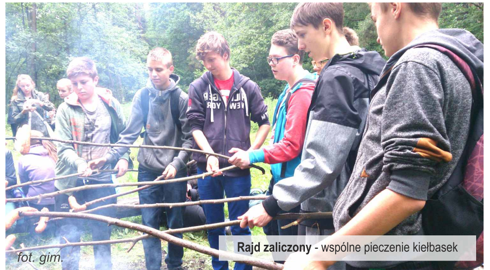
Rajd zaliczony - wspólne pieczenie kiełbasek