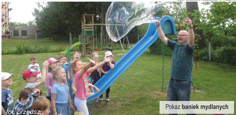
Pokaz baniek mydlanych