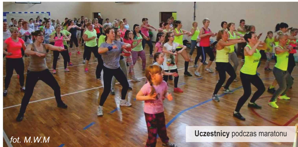
Uczestnicy podczas maratonu

Z uwagi na ogromne zainteresowanie Maratonem Zumba oraz wspaniałą zabawę na pewno nie będzie to jedyny Maraton Zumba w Gminie Ksawerów.