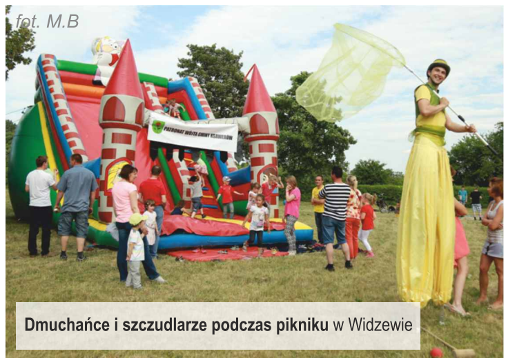
Dmuchańce i szczudlarze podczas pikniku w Widzewie