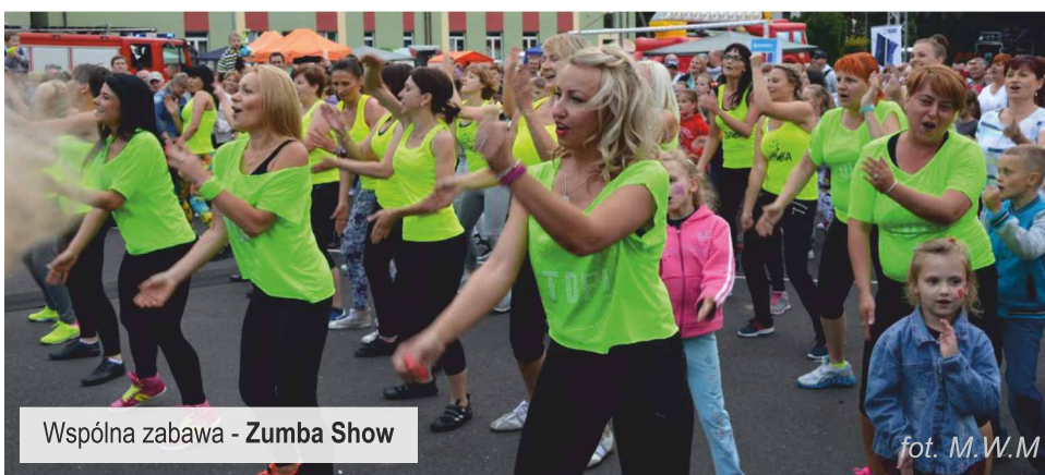
Wspólna zabawa - Zumba Show