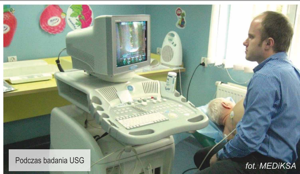
Podczas badania USG