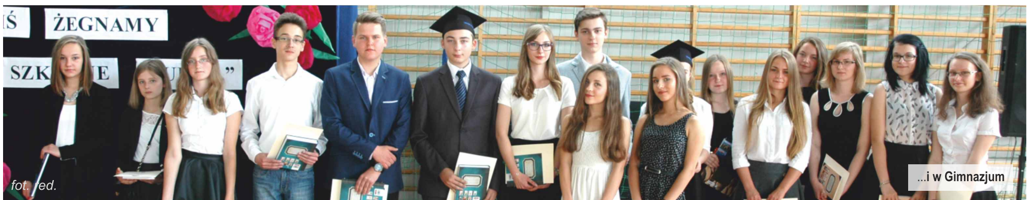
...i w Gimnazjum