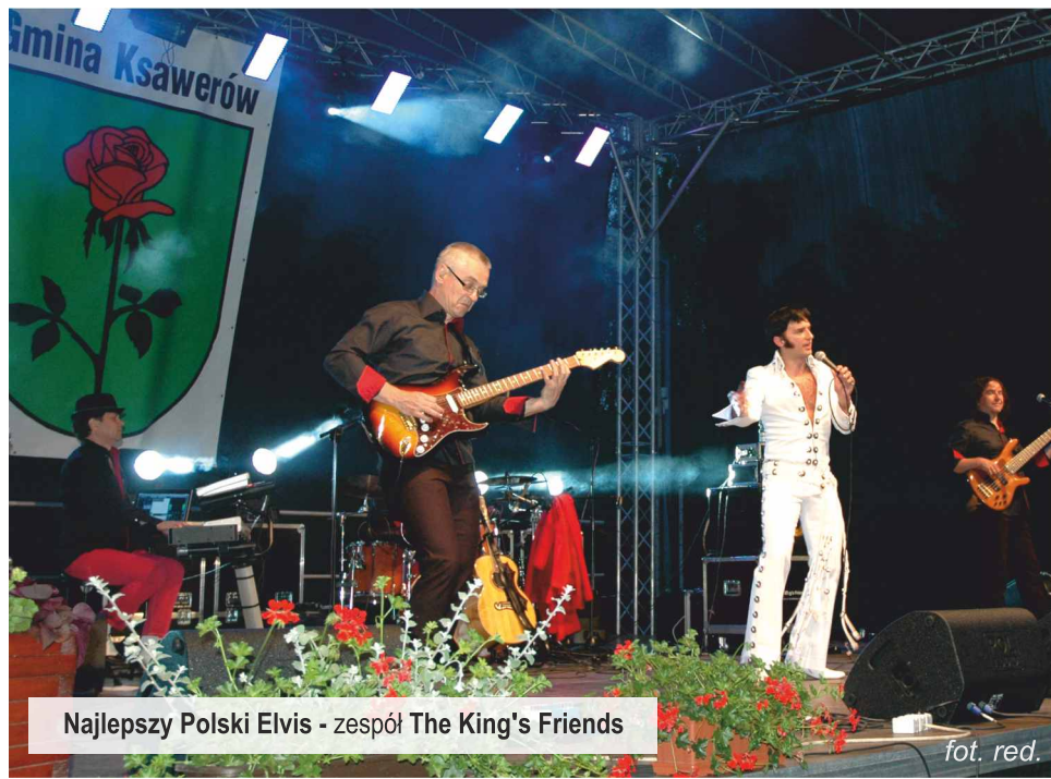
Najlepszy Polski Elvis - zespół The King's Friends