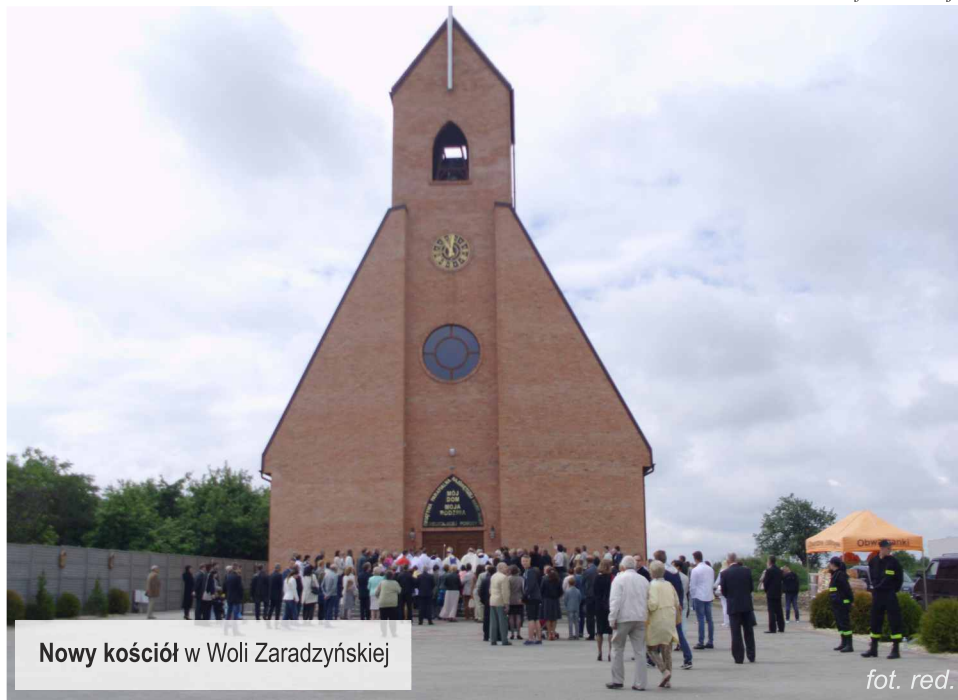
Nowy kościół w Woli Zaradzyńskiej