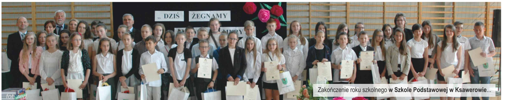
Zakończenie roku szkolnego w Szkole Podstawowej w Ksawerowie...