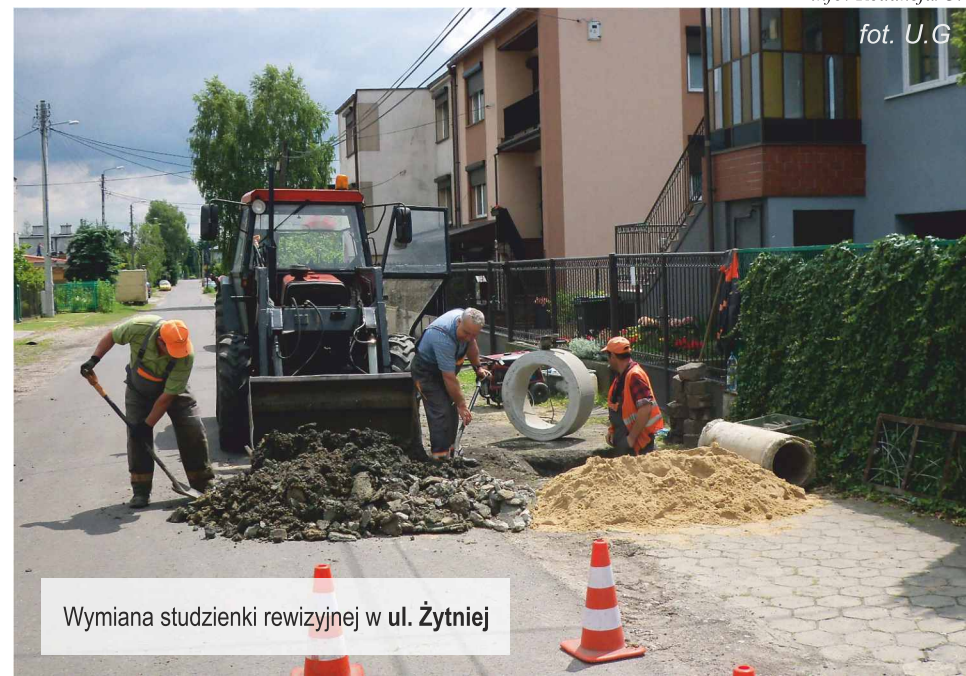
Wymiana studzienki rewizyjnej w ul. Żytniej