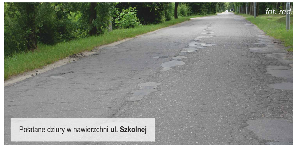
Połatane dziury w nawierzchni ul. Szkolnej

Zabezpieczone w budżetach samorządów Powiatu Pabianickiego i Gminy Ksawerów środki umożliwiają realizację najbardziej pilnych prac, czyli wykonanie nowej nawierzchni, konserwację rowów i częściowo wykonanie chodnika. Inwestycja będzie finansowana ze środków własnych powiatu i gminy, samorzady będą partycypowały w kosztach realizacji przedsięwzięcia w pięćdziesięciu procentach. W budżecie Gminy Ksawerów została zarezerwowana odpowiednia kwota, a podczas czerwcowych sesji w Gminie i Powiecie radni obydwu samorządów przyjęli uchwały o finansowaniu zadania.