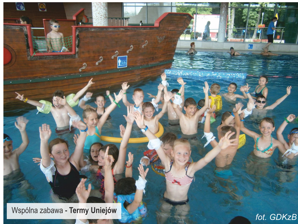
Wspólna zabawa - Termy Uniejów

Najważniejsi byli najmłodszy. Wiadomo nie od dziś, że przez pierwsze dni wakacji rodzice stają przed poważnym problemem, jak zapewnić opiekę i uatrakcyjnić czas własnym dzieciom. Nic prostszego jak tylko zapisać je na półkolonie w miejscowym Domu Kultury. Były one niestety krótkie, bo to przecież czas urlopów, ale za to bardzo intensywne. Już od poniedziałku ( 29 czerwca br. ) dzieci poczuły letnią atmosferę pluskając się do woli w uniejowskich basenach. Po kąpeli oczywiście lody na dobry początek wakacji.