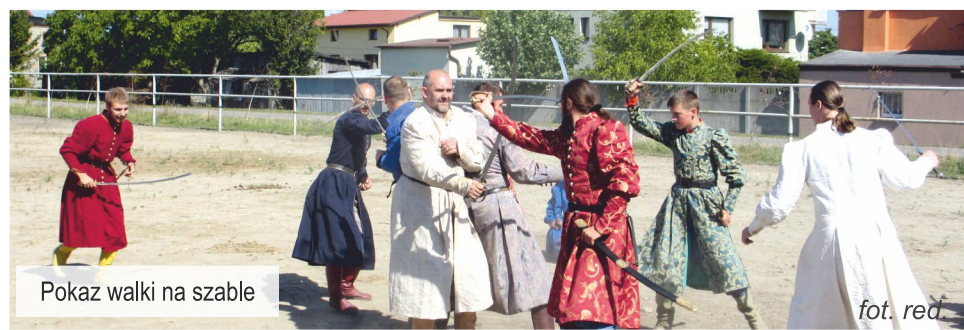
Pokaz walki na szable