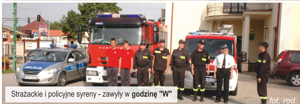
Strażackie i policyjne syreny - zawyły w godzinę "W"