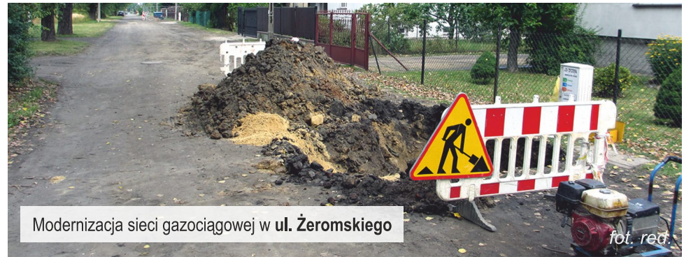
Modernizacja sieci gazociągowej w ul. Żeromskiego