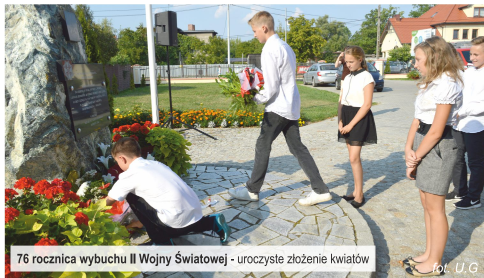
76 rocznica wybuchu II Wojny Światowej - uroczyste złożenie kwiatów