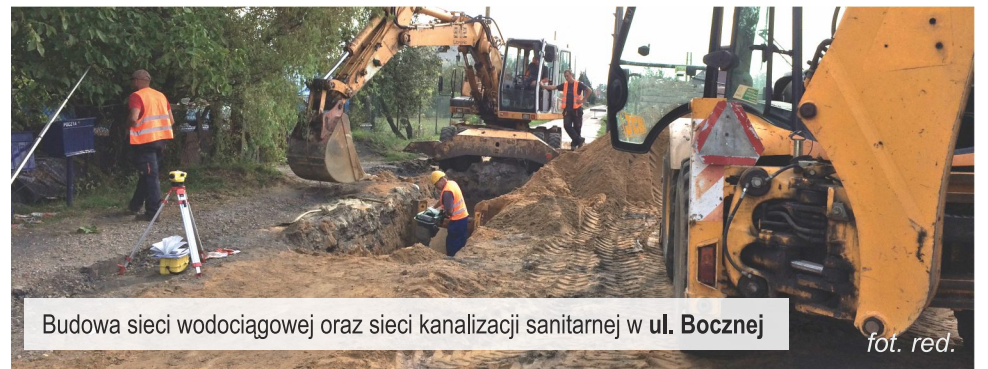
Budowa sieci wodociągowej oraz sieci kanalizacji sanitarnej w ul. Bocznej

Przerwy w dostępie do wody były spowodowane nieprzewidzianymi okolicznościami, niezależnymi od Urzędu Gminy Ksawerów.