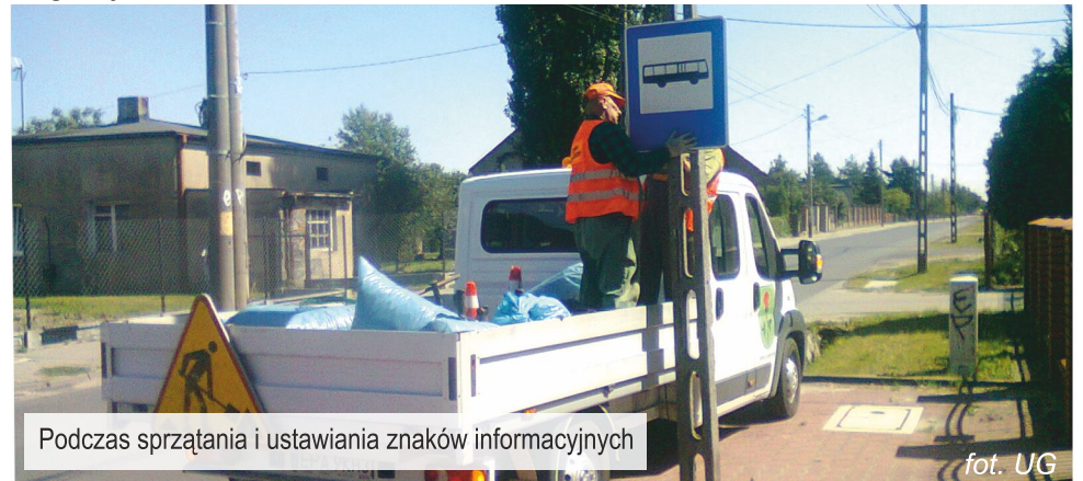
Podczas sprzątania i ustawiania znaków informacyjnych

Pracownicy gminnej ekipy gospodarczej przez cały okres wakacyjny dbali o ład i porządek na terenie gminy. Ich systematyczną pracę można było dostrzec m.in. podczas koszenia rowów i poboczy, oraz przy bieżących remontach i naprawach gminnej zabudowy drogowej.