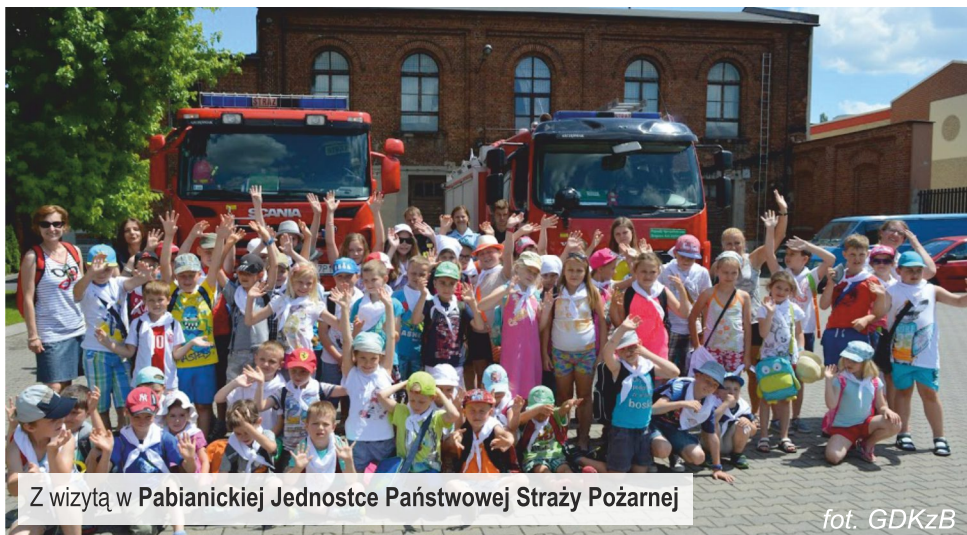
Z wizytą w Pabianickiej Jednostce Państwowej Straży Pożarnej