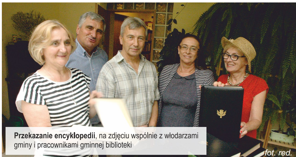
Przekazanie encyklopedii, na zdjęciu wspólnie z włodarzami gminy i pracownikami gminnej biblioteki