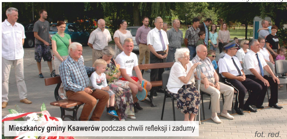
Mieszkańcy gminy Ksawerów podczas chwili refleksji i zadumy