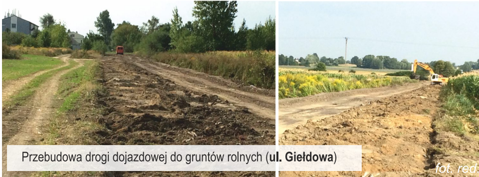
Przebudowa drogi dojazdowej do gruntów rolnych ( ul. Giędlowa )