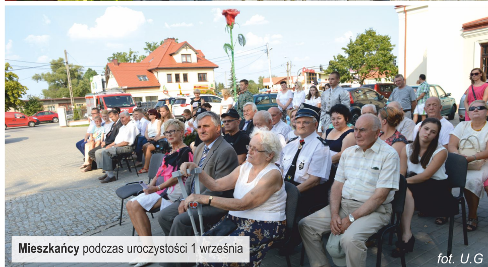
Mieszkańcy podczas uroczystości 1 września