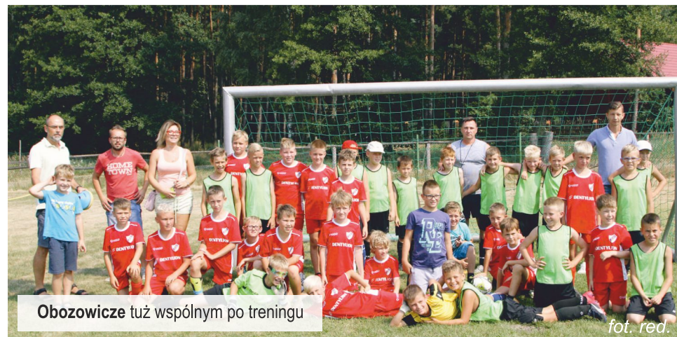
Obozowicze tuż wspólnym po treningu

Ośrodek Sportu i Rekreacji Wawrzkowizna spełnił oczekiwania uczestników pod każdym względem: dostępności do boiska i elastyczności układania grafików treningów, zakwaterowania, wyżywienia, dostępu do wody, a co najistotniejsze wszelkiej pomocy i uprzejmości ze strony zarządzających. Ośrodek jest naprawdę godny polecenia.