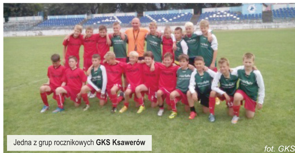
Jedna z grup rocznikowych GKS Ksawerów