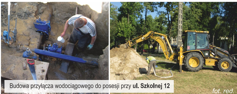
Budowa przyłącza wodociągowego do posesji przy ul. Szkolnej 12