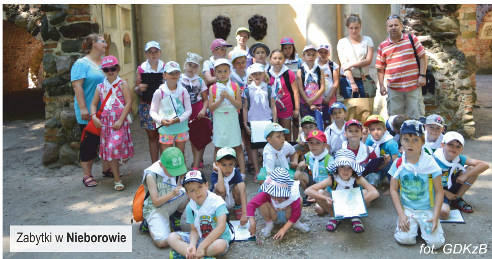
Zabytki w Nieborowie