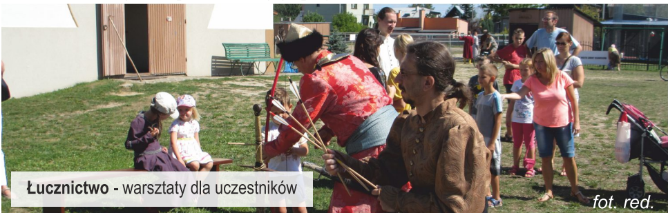
Łucznicтво - warsztaty dla uczestników

Dodatkowymi atrakcjami, które wywołały niemałe zainteresowanie wśród najmłodszych uczestników obydwu pikników były przymierzanie zbroi husarskich, bieg rycerski,