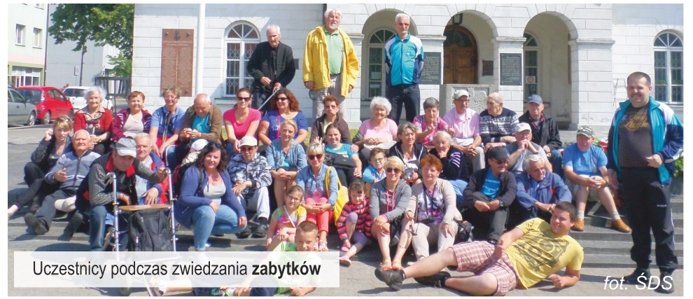
Uczestnicy podczas zwiedzania zabytków