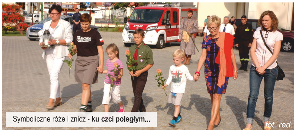
Symboliczne róże i znicz - ku czci poległym...