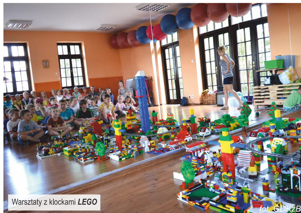
Warsztaty z klockami LEGO

Kolejne dni przyniosły następną porcję atrakcji. Zwiedzanie łódzkiego ZOO, pod opieką przewodnika, pozwoliło najmłodszym bliżej poznać jego mieszkańców, którzy dotąd byli dla nich interesujący ale anonimowi. Co odważniejsi przekonali się, że nawet węże lubią być głaskane. Wizyta w gościnnej pabianickiej Remizie przybliżyła dzieciom codzienną pracę strażaków, jej niebezpieczeństwa i ogromną odpowiedzialność. Warsztaty Klocków Lego ukazały ogromną kreatywność małych budowniczych. Makieta Ksawerowa okazała się jedną z najładniejszych powstałych podczas zajęć. Tydzień zakończyła romantyczna i pełna lirycznego uroku wycieczka do nieborowskiego pałacu. Kto nie był ma czego żałować... W Nieborowie czas się zatrzymał i wciąż czuję się niepowtarzalną atmosferą tych lat minionych.