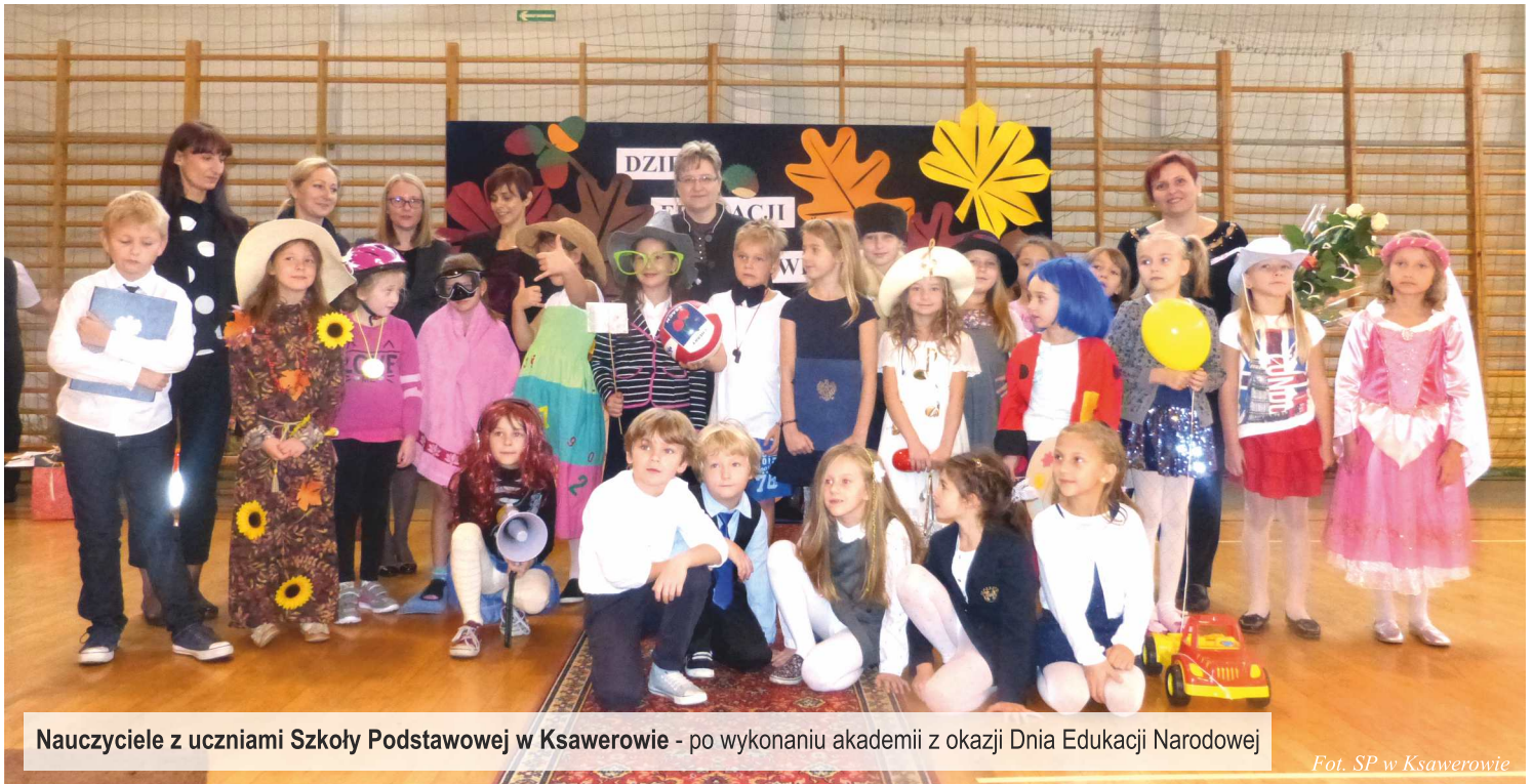
Nauczyciele z uczniami Szkoły Podstawowej w Ksawerowie - po wykonaniu akademii z okazji Dnia Edukacji Narodowej