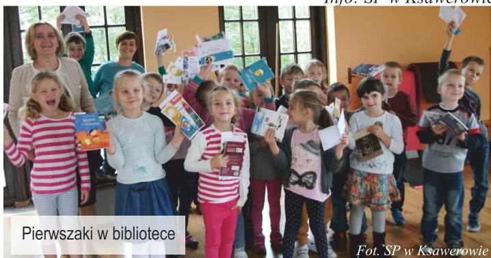
Pierwszaki w bibliotece