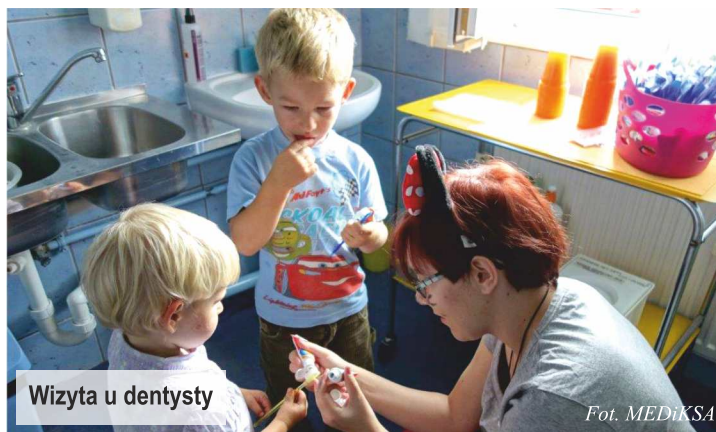
Wizyta u dentysty

W tegorocznej ofercie znalazły się badania cytologiczne i mammograficzne, konsultacje lekarza specjalisty chirurga onkologa, konsultacje lekarza specjalisty dermatologa, badania dermatoskopowe, badania słuchu wraz z konsultacją lekarza specjalisty laryngologa oraz konsultacje lekarza specjalisty chorób płuc, nauka samobadania piersi prowadzona przez położną, oraz USG serca.