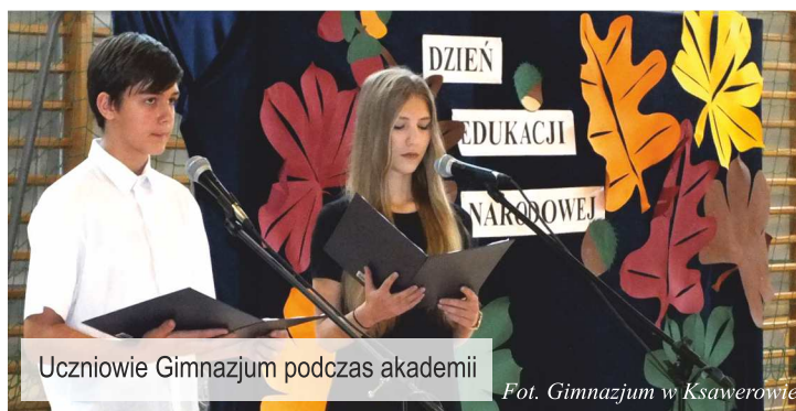
Uczniowie Gimnazjum podczas akademii