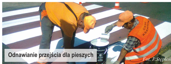
Odnawianie przejścia dla pieszych