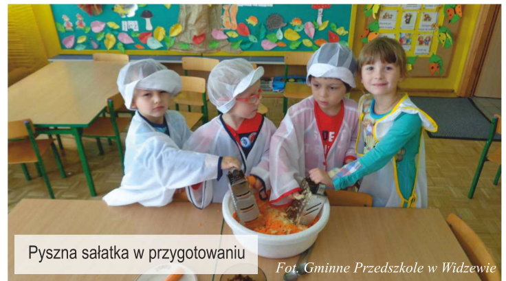
Pyszna sałatka w przygotowaniu