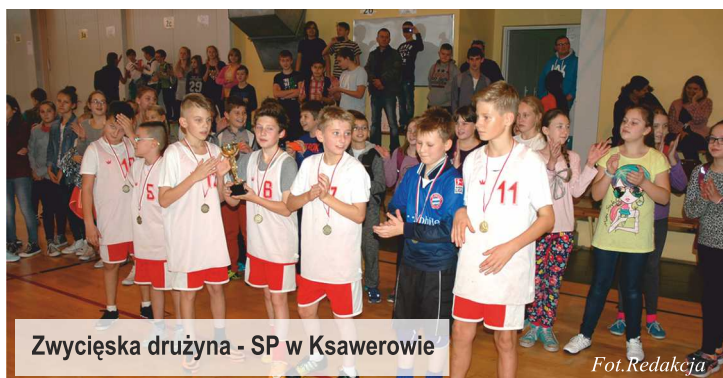
Zwycięska drużyna - SP w Ksawerowie

Pierwsze miejsce zajęła reprezentacja nr 1 z Ksawerowa, drugie miejsce Szkoła Podstawowa nr 14 z Pabianic a na trzeciej lokacie uplasowali się gracze z jedynej łódzkiej drużyny. Gratulacje!!!