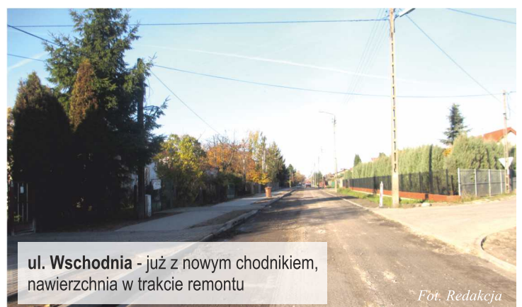
ul. Wschodnia - już z nowym chodnikiem, nawierzchnia w trakcie remontu