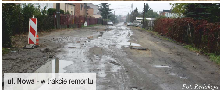
ul. Nowa - w trakcie remontu