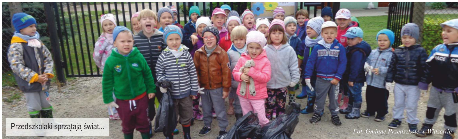
Przedszkolaki sprzątają świat...

Info: Referat Gospodarki Przestrzennej, Rolnictwa i Ochrony Środowiska