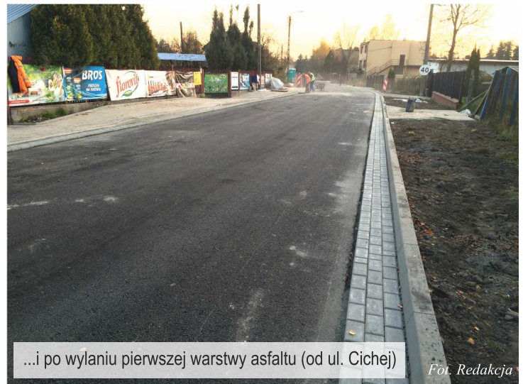
...i po wylaniu pierwszej warstwy asfaltu (od ul. Cichej)