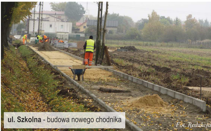
ul. Szkolna - budowa nowego chodnika