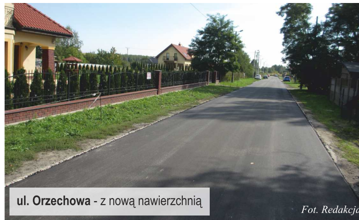
ul. Orzechowa - z nową nawierzchnią