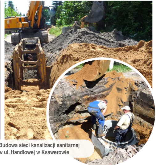
Budowa sieci kanalizacji sanitarnej w ul. Handlowej w Ksawerowie

Realizacja Projektu spowoduje zebranie i poddanie procesom oczyszczania ścieków od 1371 osób, które w chwili obecnej w sposób niekontrolowany lub w sposób niedostatecznie oczyszczony trafiają do środowiska gruntowo-wodnego. Po realizacji Projektu nastąpi wzmocnienie potencjału rozwojowego Gminy oraz spowoduje to osiągnięcie: strategicznych celów gospodarczych tego obszaru. Fundusz Spójności, który dofinansowuje to zadanie powstał na mocy Traktatu z Maastricht o utworzeniu Unii Europejskiej z 1991 roku, który wszedł w życie w 1993 roku.