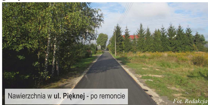
Nawierzchnia w ul. Pięknej - po remoncie

Cieszą oko nowe nakładki asfaltowe, które zostały wykonane na ulicach: Sadowa, Kosmowskiej, Dolna, Rataja, Piękna, Hanka Sawickiej, Orzechowa, Ogrodnicza oraz Kwiatowa . Inwestycja w wysokości około 750.000,00 zł wydatkowana została z budżetu gminy Ksawerów.