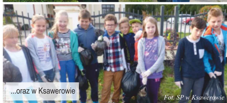
...oraz w Ksawerowie