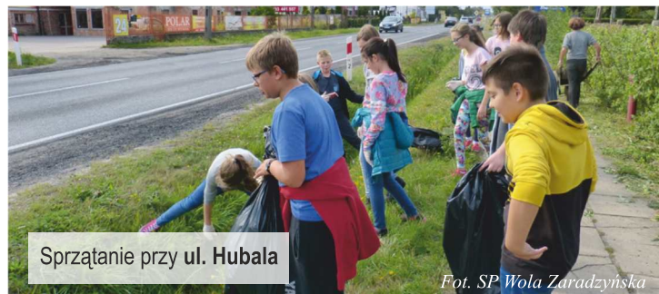
Sprzątanie przy ul. Hubala