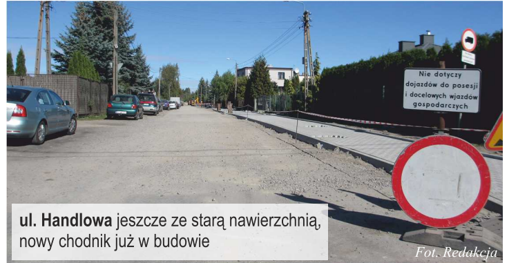
ul. Handlowa jeszcze ze starą nawierzchnią, nowy chodnik już w budowie

Dynamicznie przebiegają prace związane z budową nowej nawierzchni i chodnika w ul. Handlowej (od ul. Nowotki do ul. Cichej) oraz w ul. Wschodniej (od ronda do ul. Obwodowej). Planowane ukończenie tej ważnej i oczekiwanej przez mieszkańców inwestycji, jeszcze w tym roku.