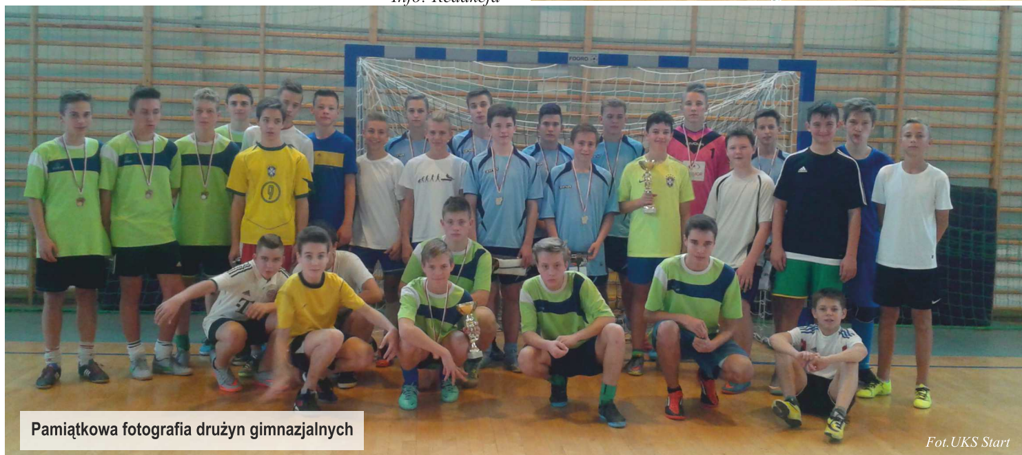
Pamiątkowa fotografia drużyn gimnazjalnych