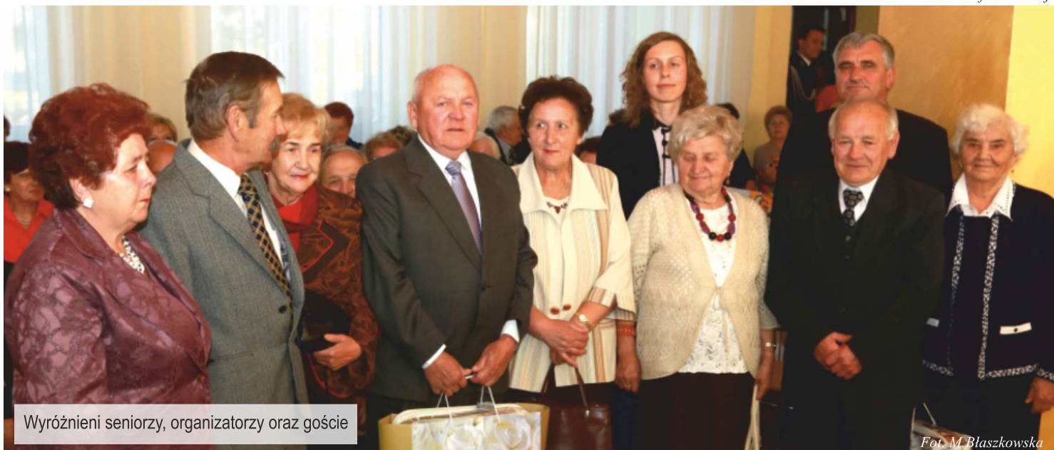
Wyróżnieni seniorzy, organizatorzy oraz goście