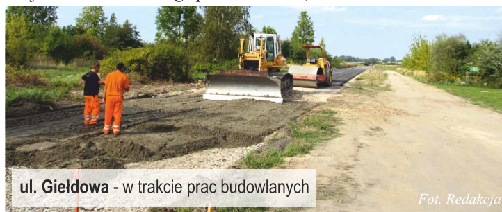
ul. Giełdowa - w trakcie prac budowlanych

Długość zmodernizowanego odcinka drogi to około 1 kilometr nawierzchni asfaltowo-mineralnej o szerokości od 4 -7 metrów . Koszt tej inwestycji to ponad 810.000,00 zł, w tym środki z budżetu Województwa Łódzkiego ponad 230.000,00 zł.