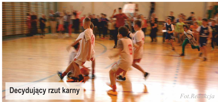
Decydujący rzut karny