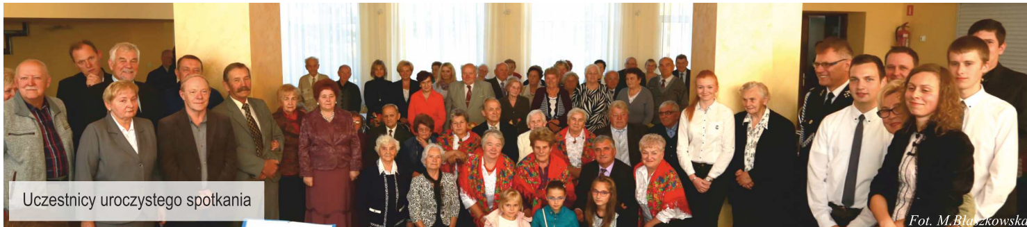
Uczestnicy uroczystego spotkania