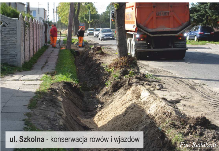
ul. Szkolna - konserwacja rowów i wjazdów