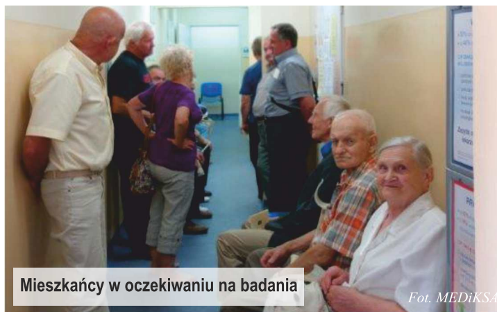
Mieszkańcy w oczekiwaniu na badania