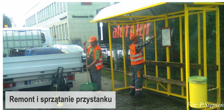
Remont i sprzątanie przystanku