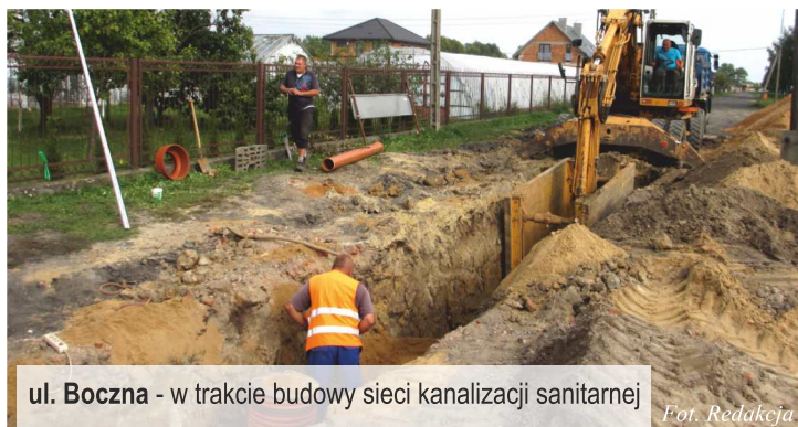
ul. Boczna - w trakcie budowy sieci kanalizacji sanitarnej

Już niebawem mieszkańcy ul. Bocznej i ul. Nowej będą mieli możliwość podłączenia się do nowopowstałej sieci wodociągowej i sieci kanalizacji sanitarnej z odeszczami.