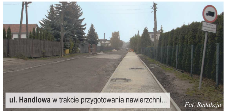
ul. Handlowa w trakcie przygotowania nawierzchni...