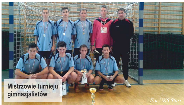
Mistrzowie turnieju gimnazjalistów