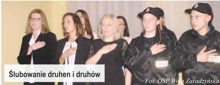
Ślubowanie druhen i druhów

29 stycznia br. w Woli Zaradzyńskiej odbyło się Walne Zebranie Sprawozdawczo-Wyborcze Ochotniczej Straży Pożarnej z Woli Zaradzyńskiej.