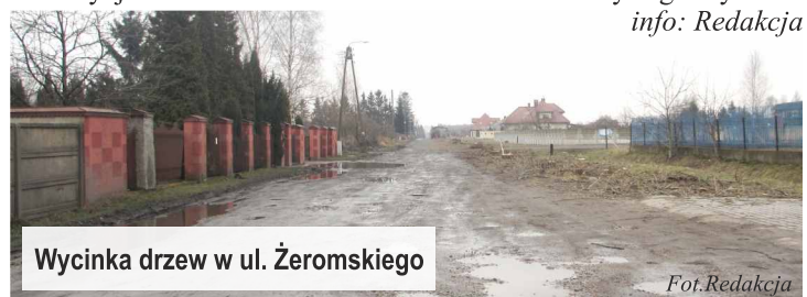
Wycinka drzew w ul. Żeromskiego