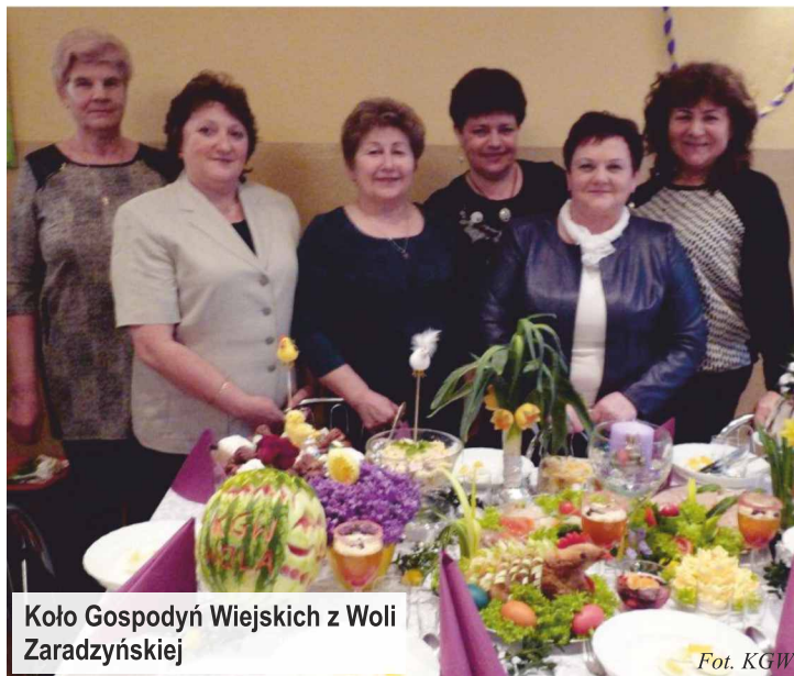
Koło Gospodyń Wiejskich z Woli Zaradzyńskiej

Gminę Ksawerów reprezentowały koła: Koło Gospodyń Wiejskich w Woli Zaradzyńskiej , Koło Gospodyń Wiejskich z Ksawerowa oraz Koło Gospodyń Wiejskich z Nowej Gadki . Wystrój i pomysłowość naszych gospodyń była nie do przecenienia, dlatego też wyróżnione zostały wszystkie stoły wielkanocne!