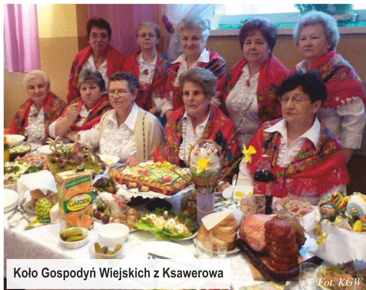
Koło Gospodyń Wiejskich z Ksawerowa