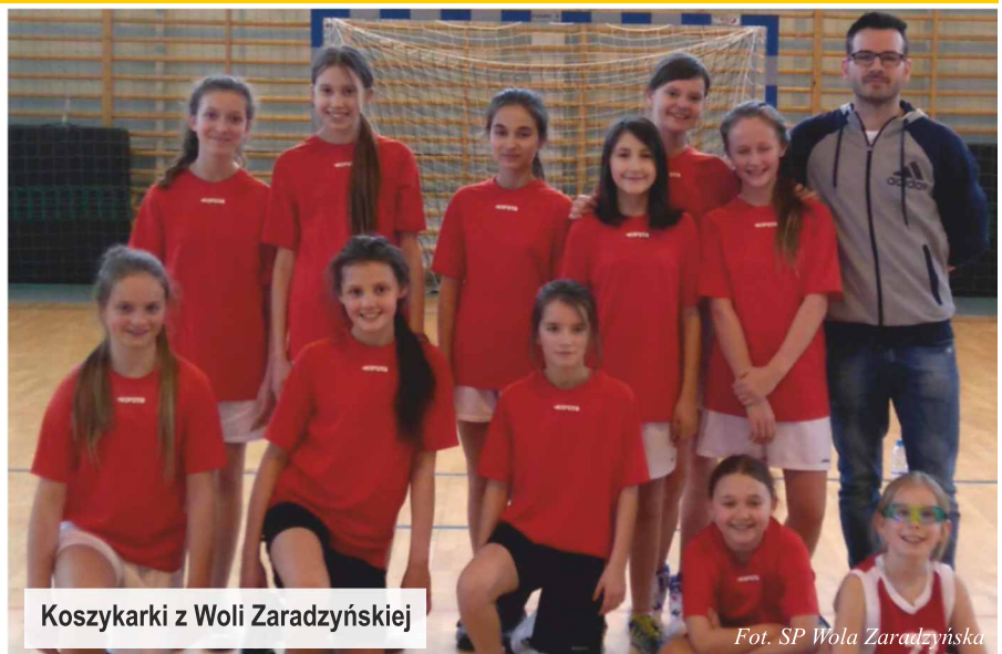
Koszykarki z Woli Zaradzyńskiej