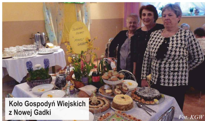
Koło Gospodyń Wiejskich z Nowej Gadki