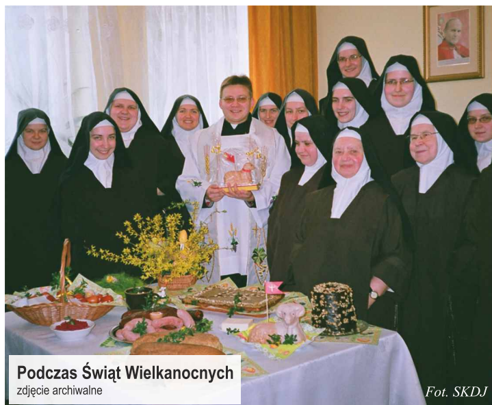
Podczas Świąt Wielkanocnych zdjęcie archiwalne