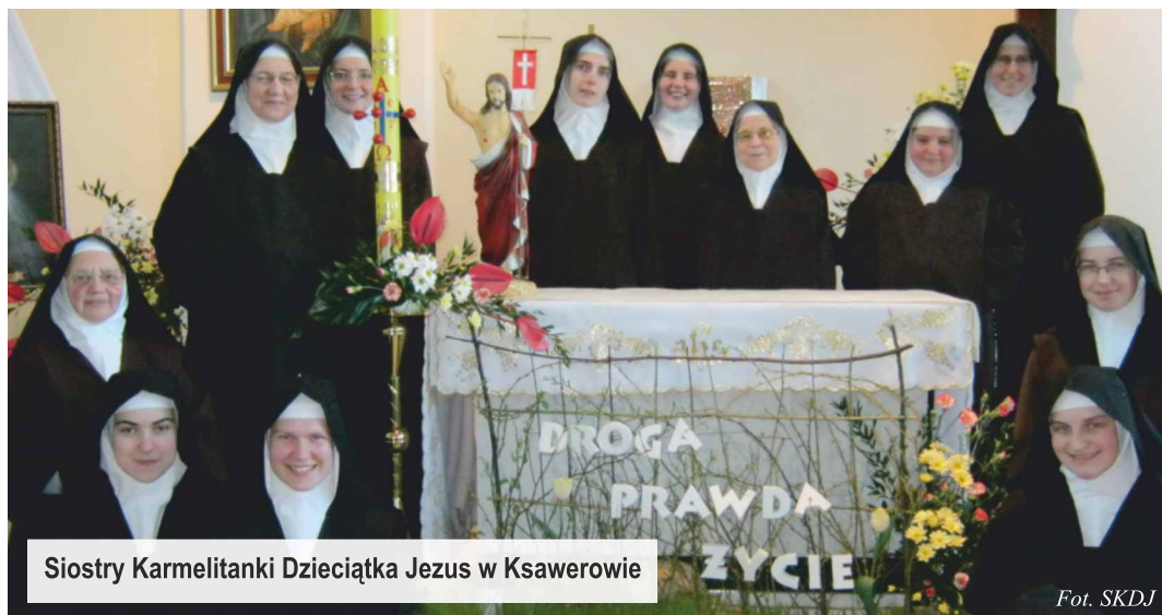
Siostry Karmelitanki Dzieciątka Jezus w Ksawerowie