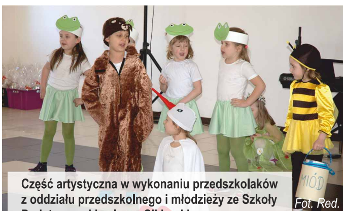
Część artystyczna w wykonaniu przedszkolaków z oddziału przedszkolnego i młodzieży ze Szkoły Podstawowej im. Igora Sikiryckiego w Woli Zaradzyńskiej