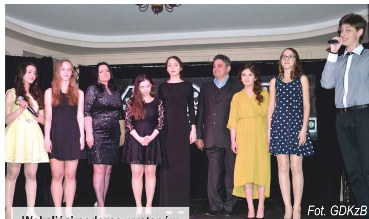
Wokaliści podczas występów