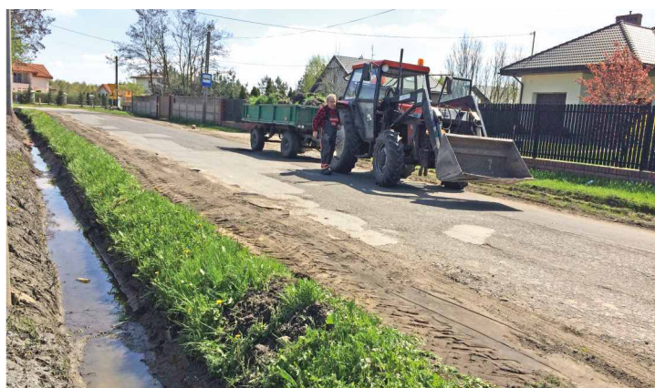
Czyszczenie i udrażnianie rowu w ul. Tymiankowej