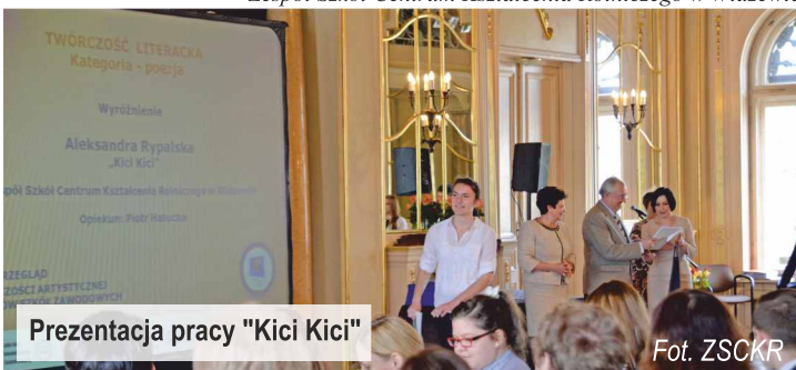
Prezentacja pracy "Kici Kici"

Zespół Szkół Centrum Kształcenia Rolniczego w Widzewie