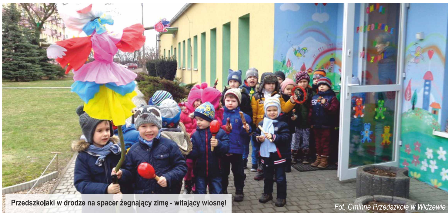
Przedszkolaki w drodze na spacer żegnający zimą - witający wiosnę!