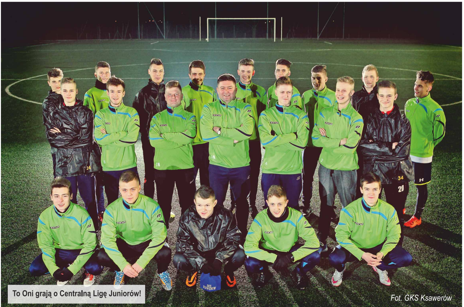
To Oni grają o Centralną Ligę Juniorów!