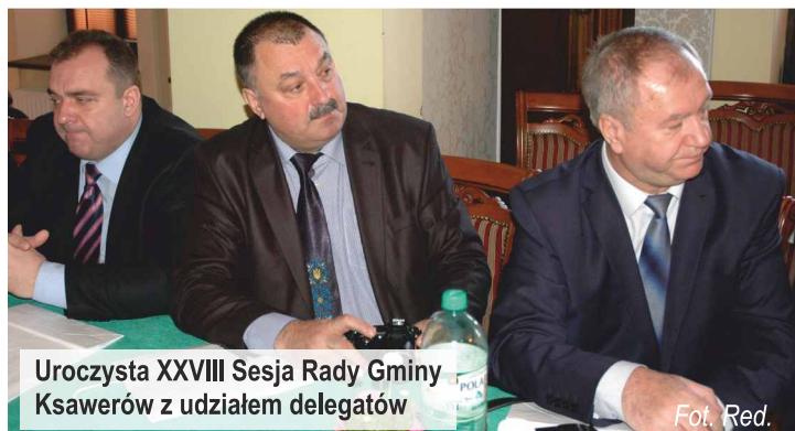
Uroczysta XXVIII Sesja Rady Gminy Ksawerów z udziałem delegatów