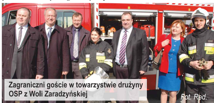
Zagraniczni goście w towarzystwie drużyny OSP z Woli Zaradzyńskiej