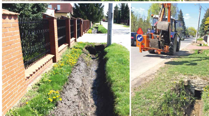
Odmulanie i udrażnianie rowów w ul. Klonowej