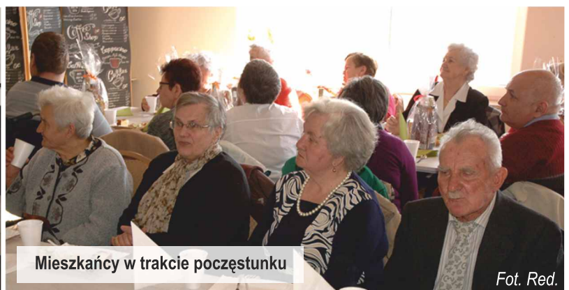
Mieszkańcy w trakcie poczęstunku