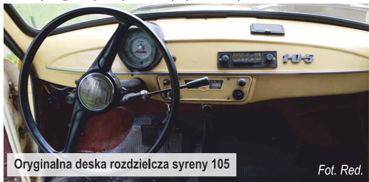
Oryginalna deska rozdzielcza syreny 105

Oczywiście, Panie redaktorze zjechaliśmy z żoną tym autem prawie całą Polskę. I wzdłuż i w szerz. Morze i góry, a jak nie mieliśmy gdzie przenocować to spaliśmy w naszej syrence. Siedzenia są rozkładane, i całkiem wygodne. Jakoś trzeba było sobie radzić. Można śmiało powiedzieć, że syrenka towarzyszyła nam w najróżniejszych momentach i zawsze Nas zawiozła do celu. Raz tylko mieliśmy drobną stłuczkę. Wyjeżdżające większe auto zawadziło w tylną lampę i błotnik. Na szczęście skutki tej niegroźnej kolizji udało się szybko usunąć.