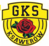
"Alibi na szczęście"