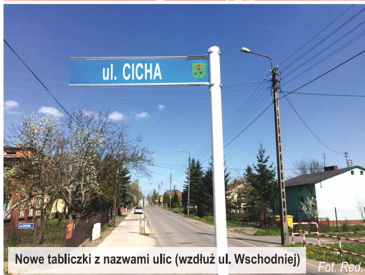
Nowe tabliczki z nazwami ulic (wzdłuż ul. Wschodniej)