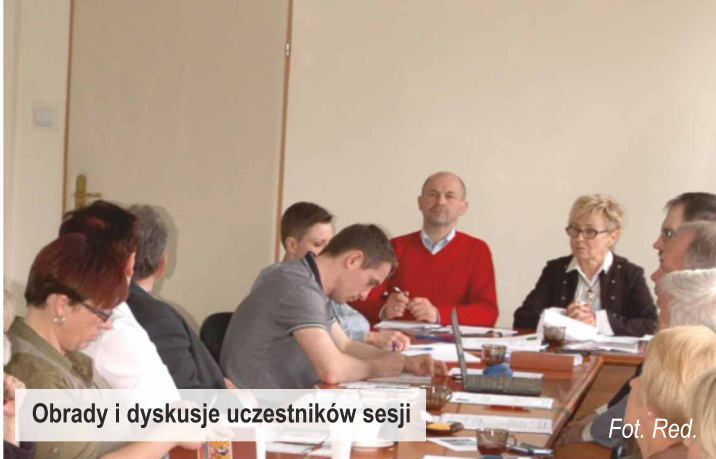
Obrady i dyskusje uczestników sesji

20 kwietnia br. radni obradowali podczas XXX Sesji Rady Gminy Ksawerów . Wśród podjętych uchwał znalazły się m.in te dotyczące zmian w budżecie na bieżący rok. W spotkaniu uczestniczyli mieszkańcy naszej gminy, dyskutując i omawiając tematy dotyczące bieżących oraz planowanych inwestycji remontowo-budowlanych na wskazanych ulicach.