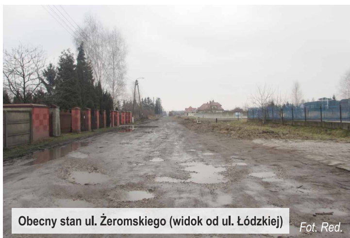
Obecny stan ul. Żeromskiego (widok od ul. Łódzkiej)