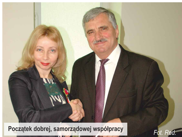
Początek dobrej, samorządowej współpracy