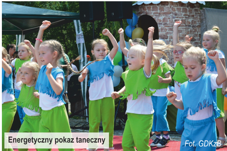
Energetyczny pokaz taneczny

W pierwszą czerwcową sobotę br. teren wokół Gminnego Domu Kultury z Biblioteką w Ksawerowie zamienił się w prawdziwą strefę zabaw i atrakcji przygotowanych specjalnie z okazji Dnia Dziecka. Najmłodszy mieszkańcy naszej gminy mogli dać upust swojej radości dokazując na fantastycznych dmuchańcach.