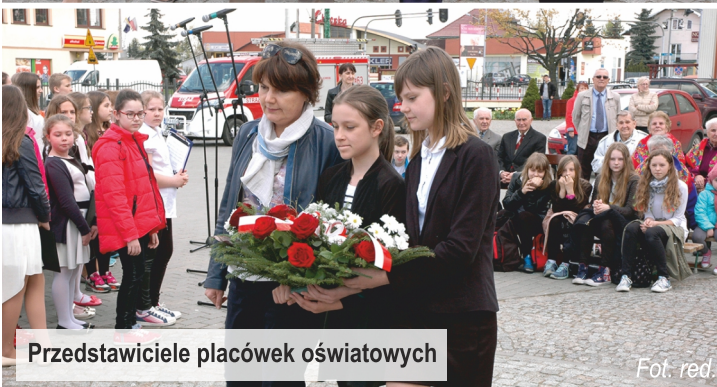
Przedstawiciele placówek oświatowych