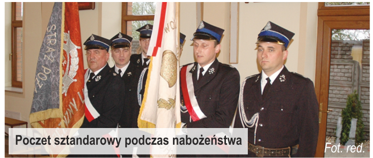
Poczet sztandarowy podczas nabożeństwa