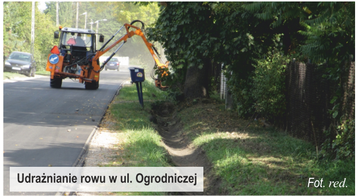
Udrażnianie rowu w ul. Ogrodniczej