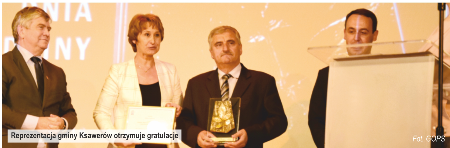
Reprezentacja gminy Ksawerów otrzymuje gratulacje