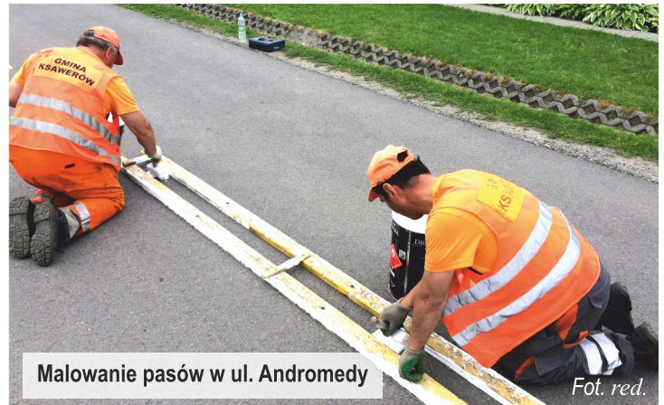
Malowanie pasów w ul. Andromedy