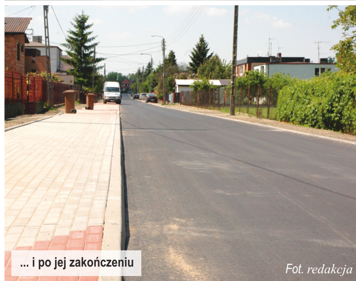
... i po jej zakończeniu