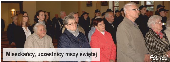
Mieszkańcy, uczestnicy mszy świętej

W uroczystości, którą koncelebrował ks. Grzegorz Adamek, wzięło udział wielu zaproszonych gości, w tym władze gminy Ksawerów, jej radni, kierownicy jednostek organizacyjnych oraz mieszkańcy gminy. Ze względu na padający deszcz, zaplanowane na ten dzień ognisko zastąpiono poczęstunkiem w sali przy OSP. Bartosz Chmiela