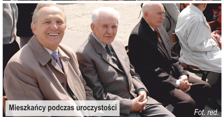
Mieszkańcy podczas uroczystości