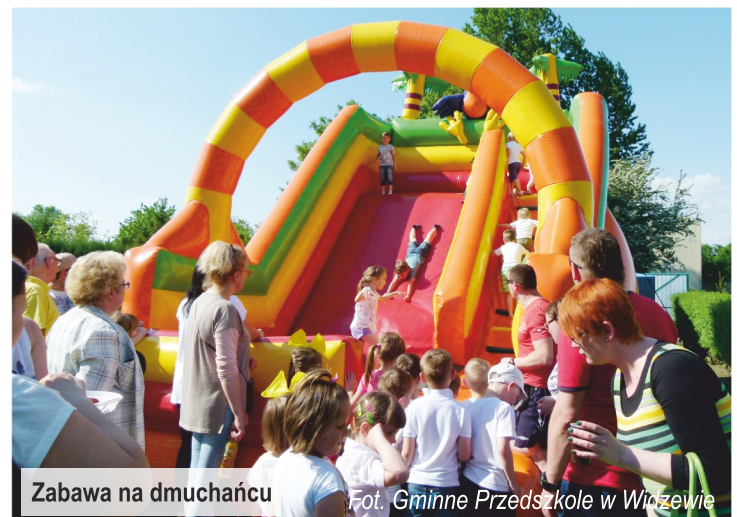
Zabawa na dmuchańcu