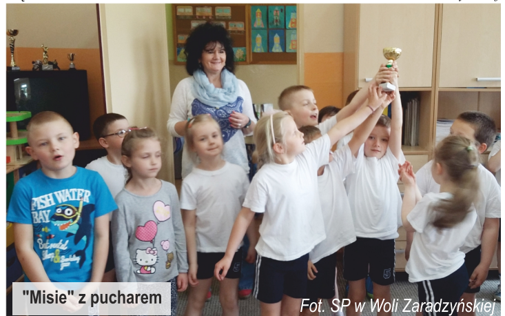
"Misie" z pucharem