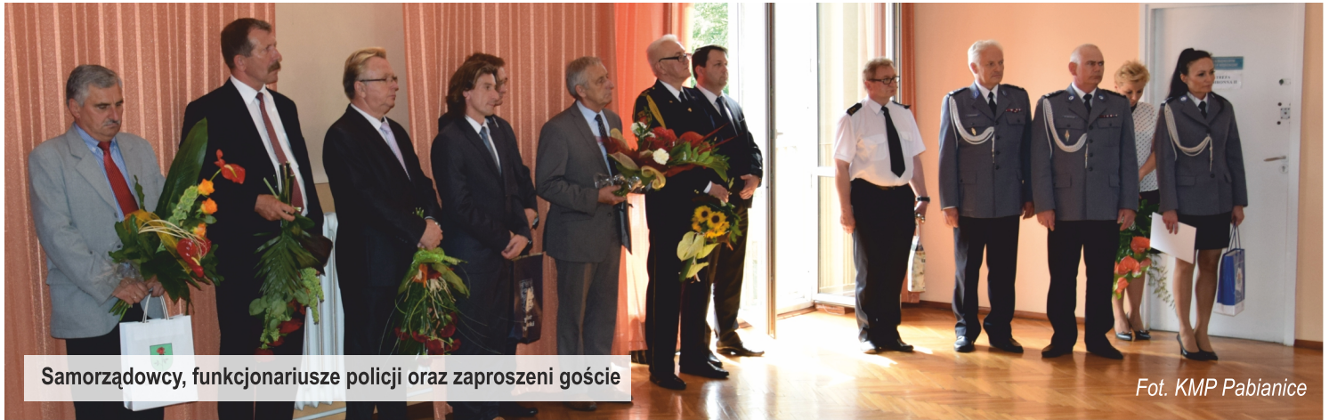
Samorządowcy, funkcjonariusze policji oraz zaproszeni goście