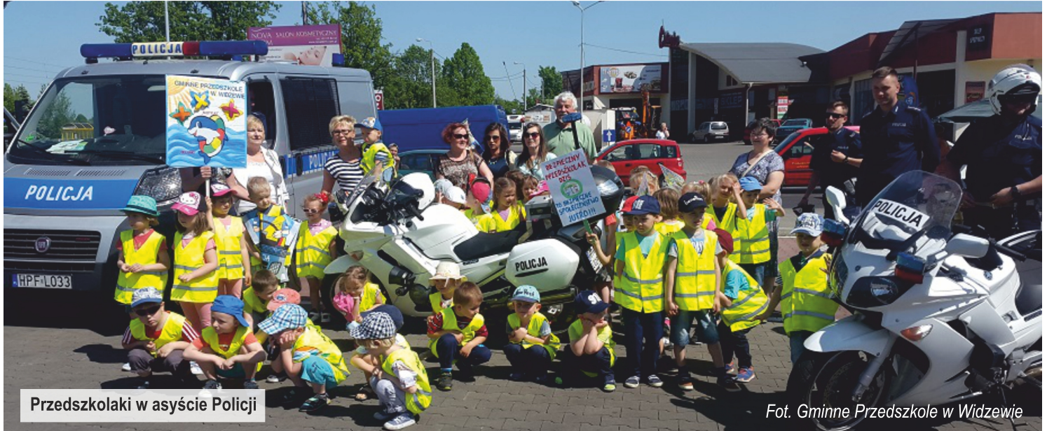
Przedszkolaki w asyście Policji