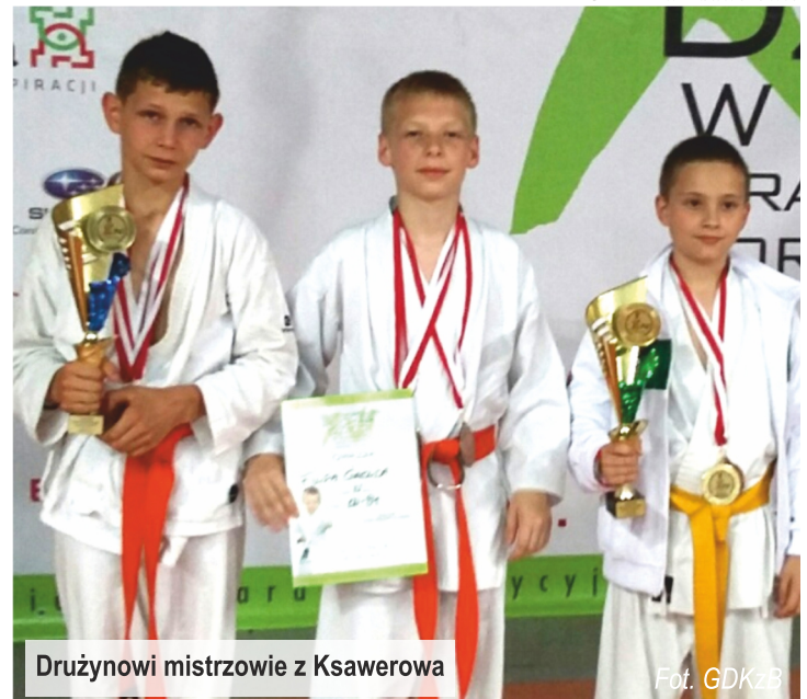
Drużynowi mistrzowie z Ksawerowa