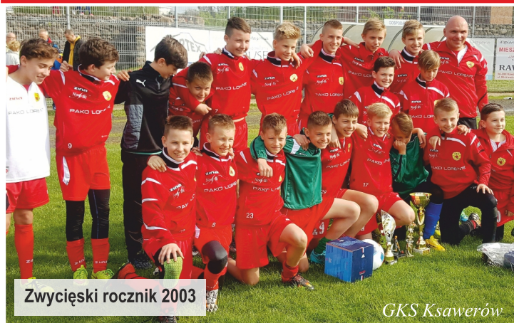
Zwycięski rocznik 2003