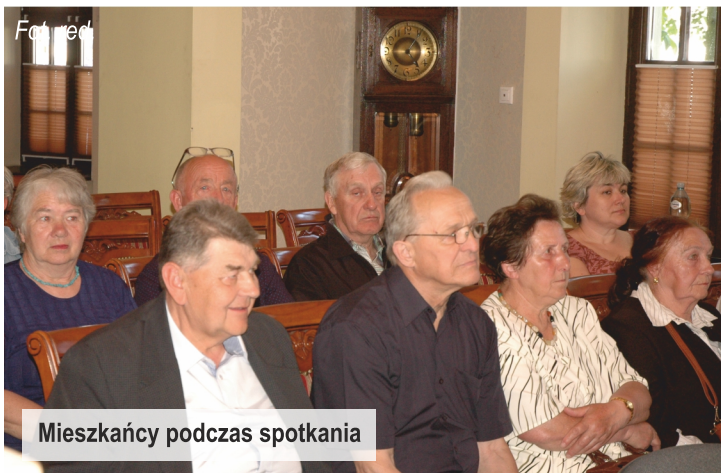
Mieszkańcy podczas spotkania