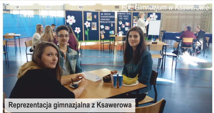
Reprezentacja gimnazjalna z Ksawerowa