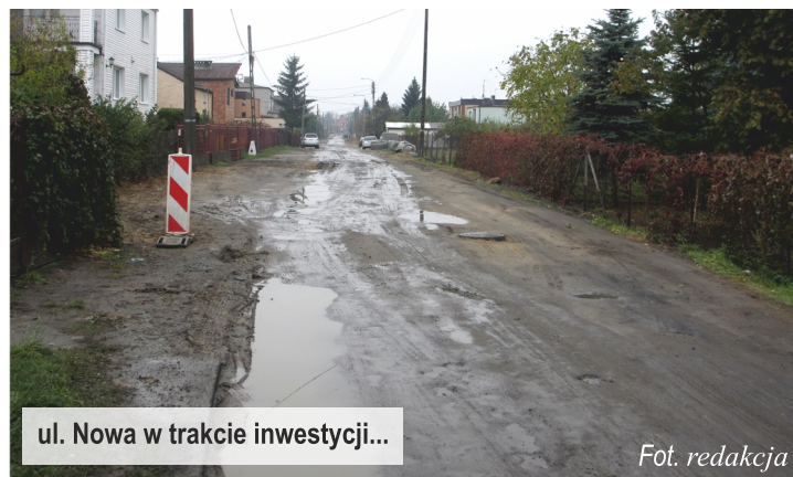
ul. Nowa w trakcie inwestycji...