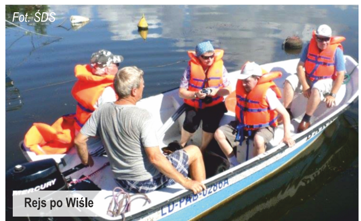
Rejs po Wiśle

Podopieczni Środowiskowego Domu Samopomocy w Ksawerowie rozpoczęli sezon letni od czterodniowego wyjazdu do Nowego Duninowa . Czas spędzony na świeżym powietrzu pokrył się z równonocą letnią i Sobótkami. Uczestnicy po raz kolejny mogli żeglować po rzece Wiśle. Wykonali również wianki z kwiatów, które zostały pущone zgodnie z tradycją na rzekę. Wycieczkowicze zwiedzili ponadto zabytki Płocka, oraz mieli możliwość rozkoszowania się urokami przepięknej promenady wiodącej wzdłuż Wisły. Zapewne cały wyjazd, a szczególności żeglowanie, zostanie na długo w pamięci uczestników wyjazdu. ŚDS w Ksawerowie