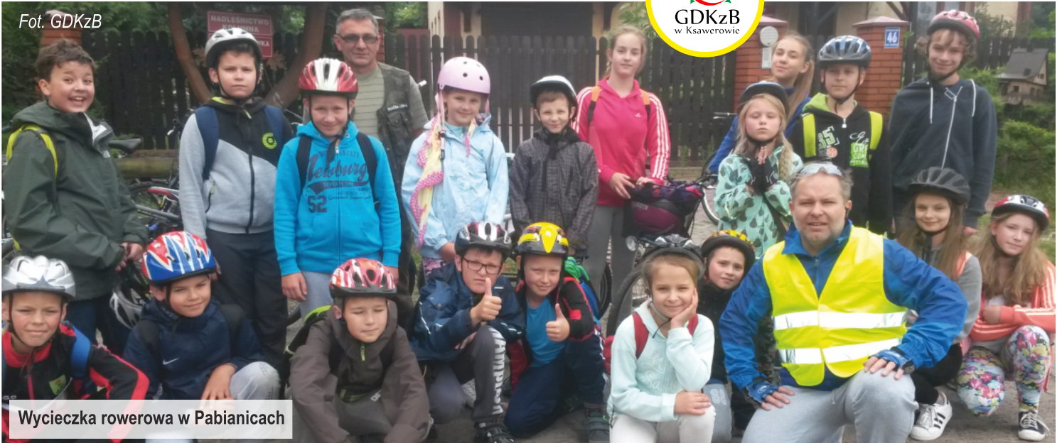
Wycieczka rowerowa w Pabianicach