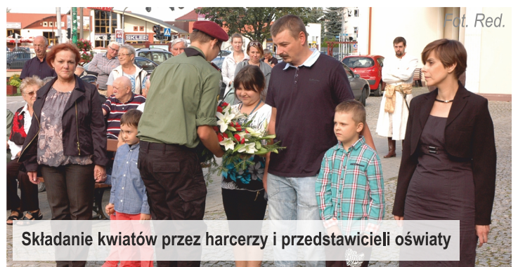
Składanie kwiatów przez harcerzy i przedstawicieli oświaty