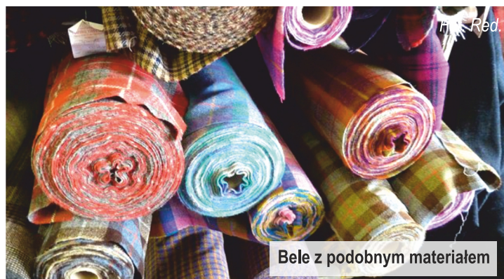
Bele z podobnym materiałem

Skradzony w ten sposób materiał odsprzedawali po zaniżonych cenach osobom prowadzącym szwalnię.