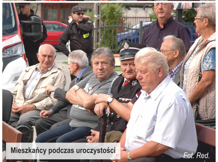
Mieszkańcy podczas uroczystości