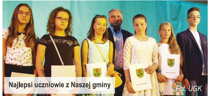
Najlepsi uczniowie z Naszej gminy