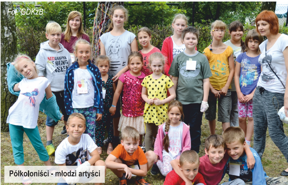
Półkolonisci - młodzi artyści

Trzecim tygodniem półkolonii był tydzień artystyczny , skupiony przede wszystkim na niezwyklej technice Street Art . Ten gatunek sztuki stanowi próbę ingerencji w naturalne środowisko i wykorzystanie go do stworzenia nowej artystycznej przestrzeni. Nasi młodzi artyści wykorzystywali do swoich prac drzewa w parku przy GDKzB w Ksawerowie. W tygodniu artystycznym dzieci szyły ponadto fantastyczne „skarpeciaki”.