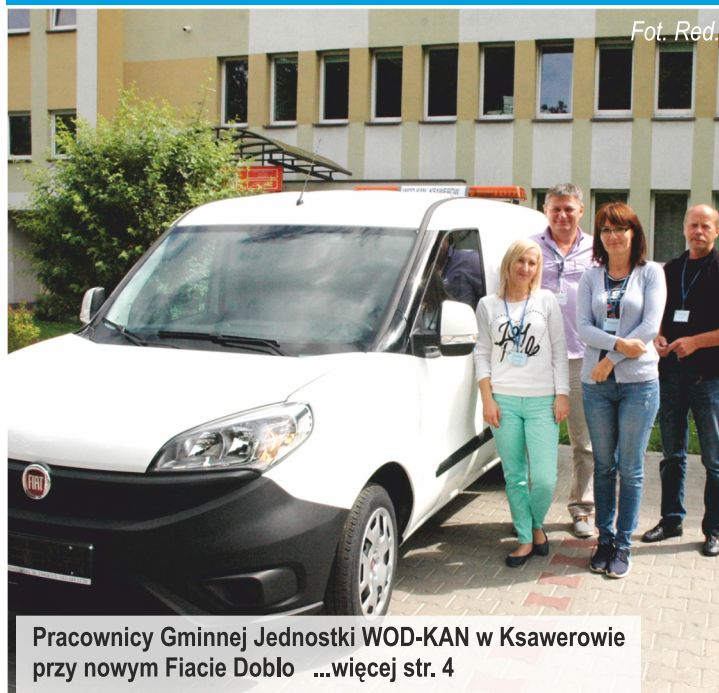
Pracownicy Gminnej Jednostki WOD-KAN w Ksawerowie przy nowym Fiacie Doblo ...więcej str. 4