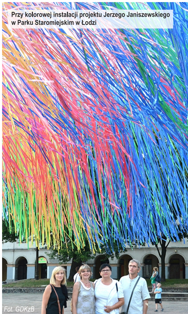
Przy kolorowej instalacji projektu Jerzego Janiszewskiego w Parku Staromiejskim w Łodzi

Przedmiotem umowy jest odbiór i zagospodarowanie odpadów komunalnych od właścicieli nieruchomości zamieszkałych oraz wyposażenie ich w pojemniki do gromadzenia odpadów komunalnych. Firma zapewnia także odbiór i zagospodarowanie odpadów komunalnych zebranych selektywnie w Punkcie Selektywnego Zbierania Odpadów Komunalnych (PSZOK) oraz wyposażenie PSZOKu w pojemniki i kontenery do gromadzenia odpadów. Ponadto w ramach zbiórki objazdowej zbierane są tzw. wielkogabaryty zgodnie z harmonogramem.