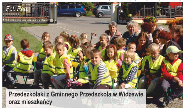
Przedшкоlaki z Gminnego Przedszkola w Widzewie oraz mieszkańcy