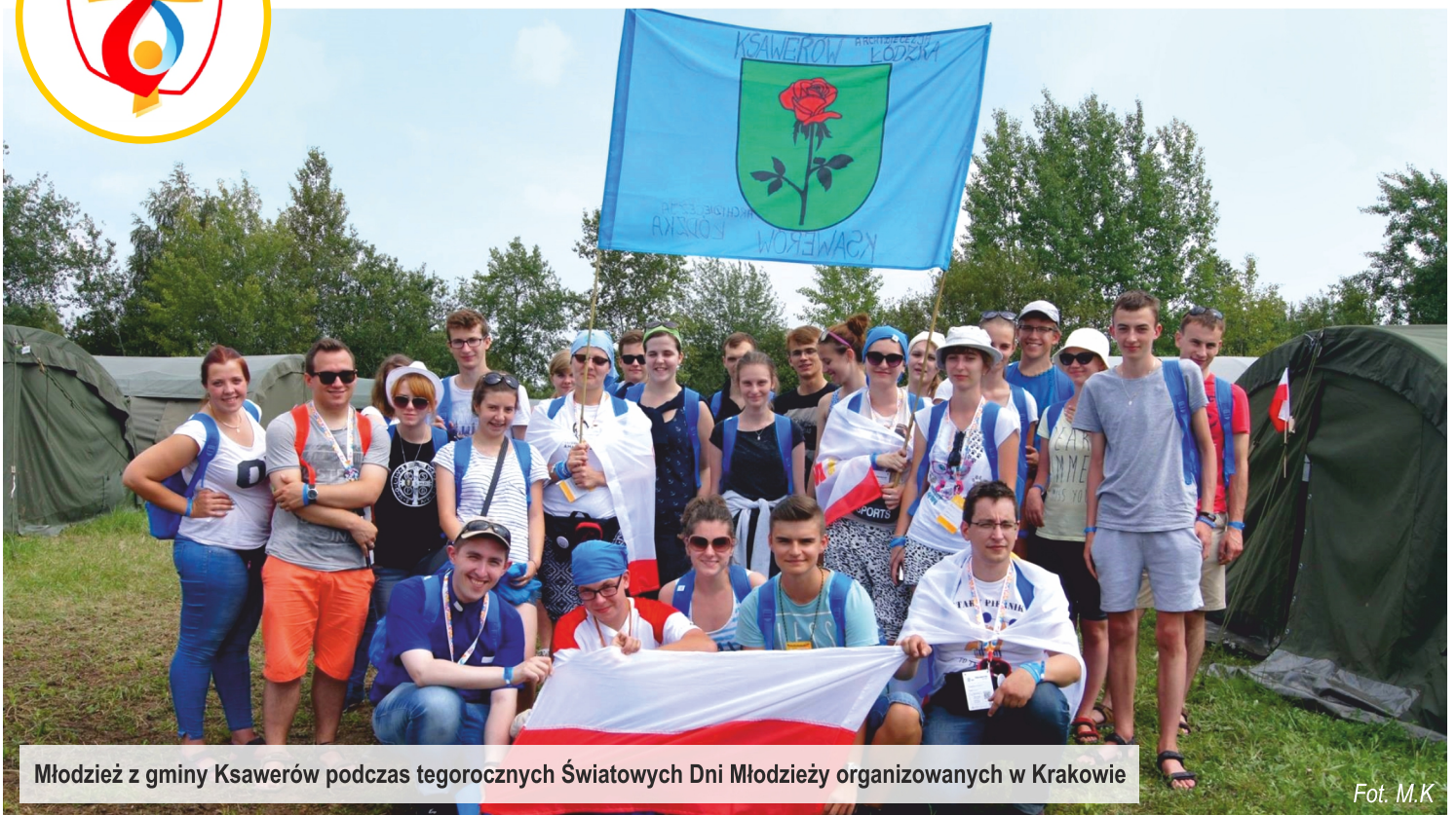
Młodzież z gminy Ksawerów podczas tegorocznych Świątowych Dni Młodzieży organizowanych w Krakowie

Niezwykłe spotkanie młodzieży katolickiej