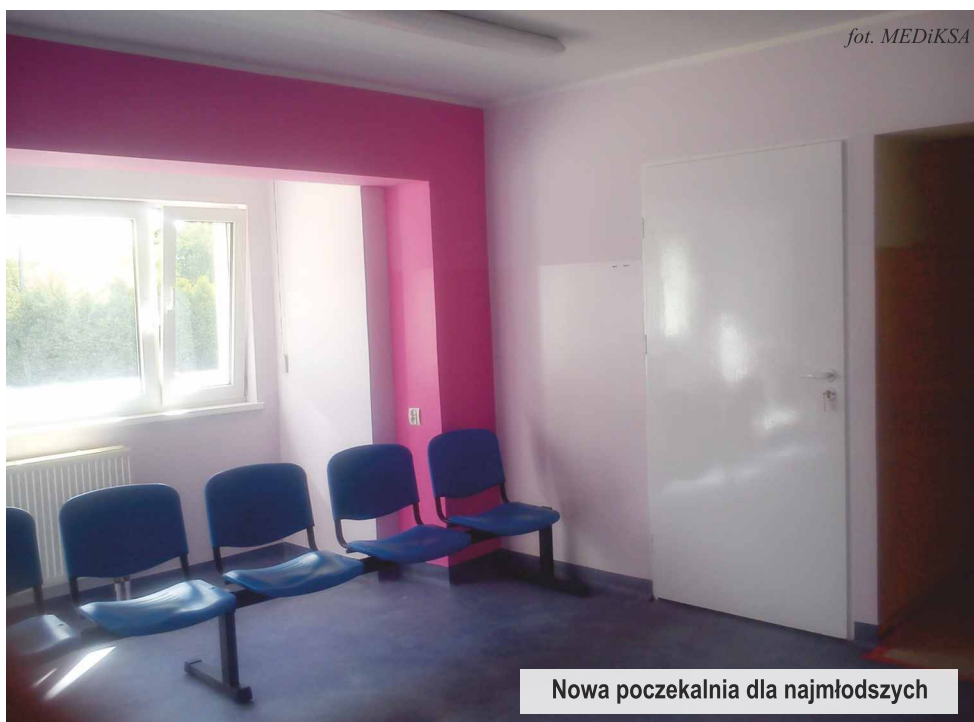
Nowa poczekalnia dla najmłodszych