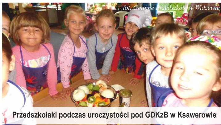
Przedszkolaki podczas uroczystości pod GDKzB w Ksawerowie