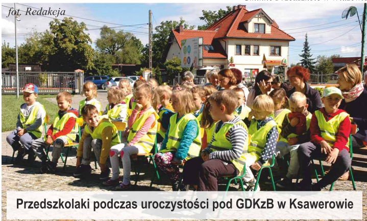
Przedszkolaki podczas uroczystości pod GDKzB w Ksawerowie