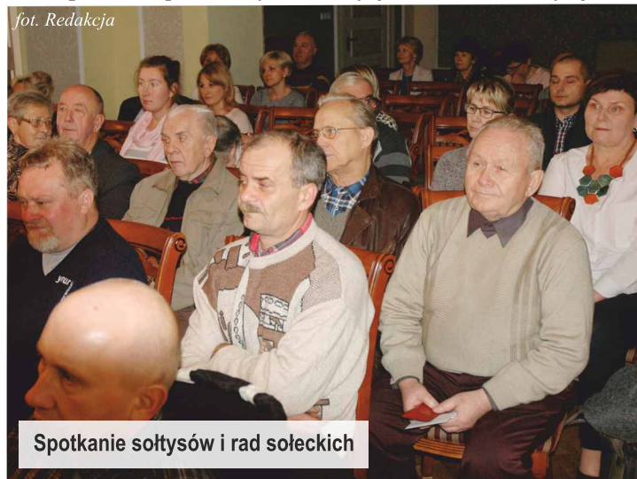
Spotkanie sołtysów i rad sołeckich

Mieszkańcy poszczególnych sołectw wybierali we wrześniu br. zadania do realizacji na przyszły rok w ramach tzw. „funduszy sołeckich”. Sołtysi i członkowie rad sołeckich dyskutowali w listopadzie nt. planowanych inwestycji. ...więcej str. 4