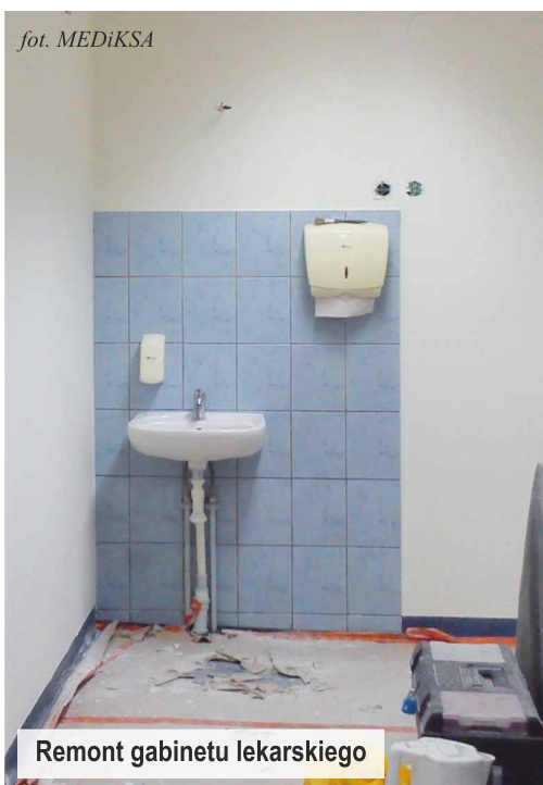
Remont gabinetu lekarskiego