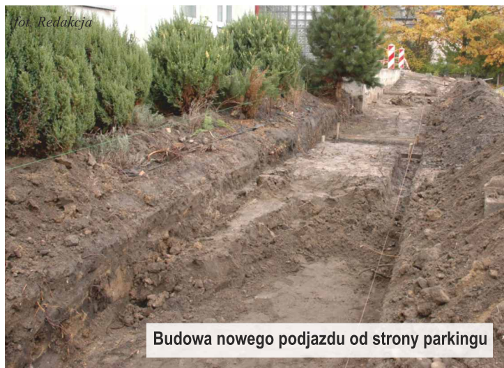
Budowa nowego podjazdu od strony parkingu

W przychodni MEDIKSA trwają prace remontowo-budowlane. Zakończenie prac zaplanowano do końca br. Ze względu na konieczność bieżącego funkcjonowania przychodni bez ograniczeń, prace zostały rozłożone na kilka etapów. ...więcej str. 3