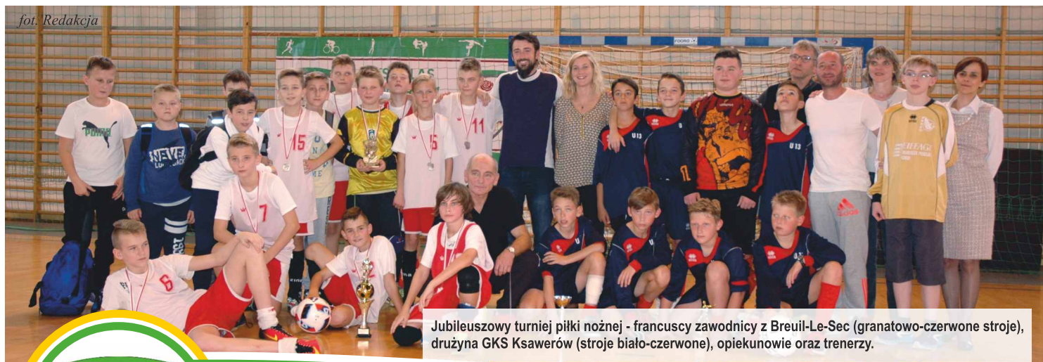
Jubileuszowy turniej piłki nożnej - francuscy zawodnicy z Breuil-Le-Sec (granatowo-czerwone stroje), drużyna GKS Ksawerów (stroje biało-czerwone), opiekunowie oraz trenerzy.