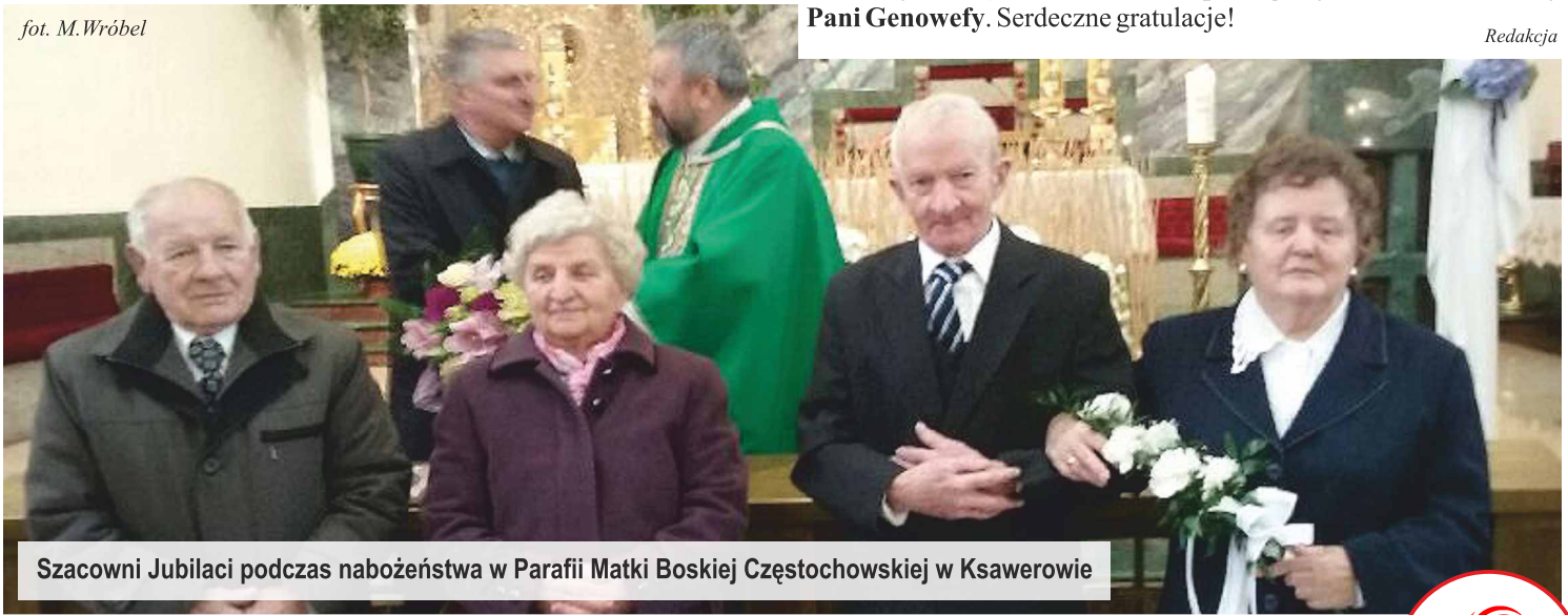
Szacowni Jubilaci podczas nabożeństwa w Parafii Matki Boskiej Częstochowskiej w Ksawerowie