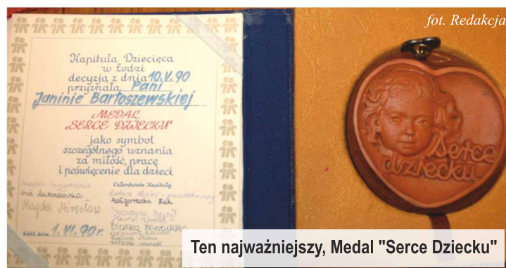
Ten najważniejszy, Medal "Serce Dziecku"

J.B Panie Redaktorze chciałbym tylko dodać, że podczas mojego dorosłego życia, największym motywatorem do dalszego społecznego działania był dla mnie uśmiech i szczęście dzieci. Otrzymywałam różne wyróżnienia i podziękowania. Jednak to najważniejsze, medal „Serce Dziecku” jest zawsze blisko mnie.