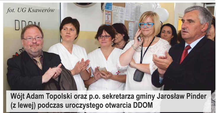
fot. UG Ksawerów