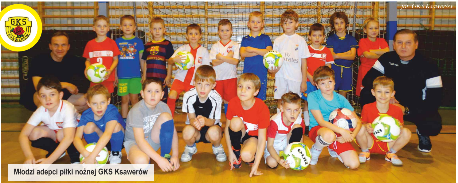
Młodzi adepci piłki nożnej GKS Ksawerów