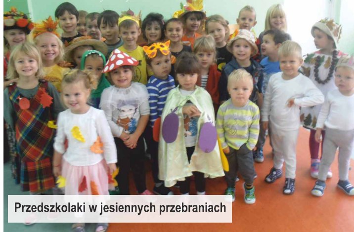
Przedszkolaki w jesiennych przebraniach