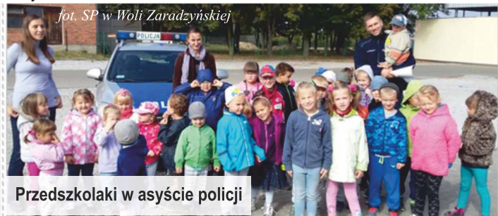
Przedszkolaki w asyście policji