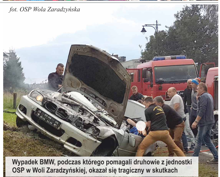
Wypadek BMW, podczas którego pomagali druhowie z jednostki OSP w Woli Zaradzińskiej, okazał się tragiczny w skutkach