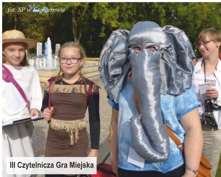
III Czytelnicza Gra Miejska