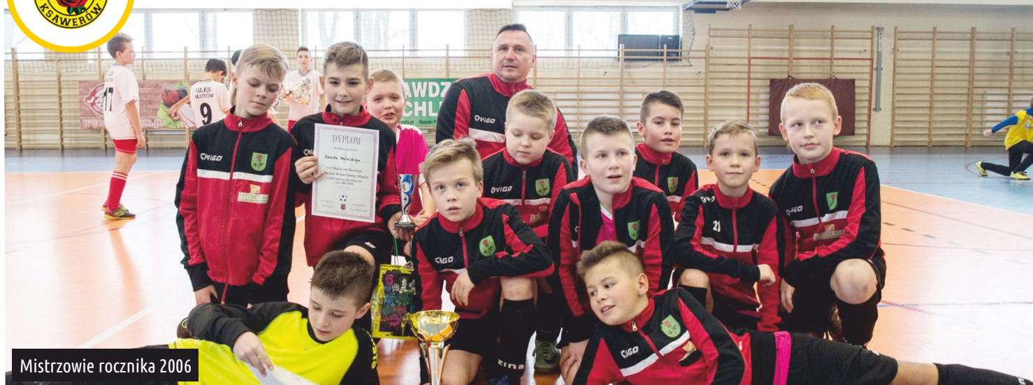
Mistrzowie rocznika 2006

Młodzi piłkarze GKS Ksawerów z rocznika 2006, zwyciężyli w Pierwszym Halowym Turnieju o Puchar Wójta Gminy Dłutów!