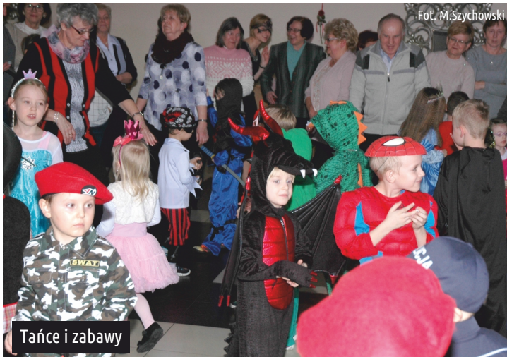
Tańce i zabawy

Milusińscy tańczyli ze swoimi babkami i dziadkami na wyjątkowym balu karnawałowym. Dyrekcja przedszkola organizując tę uroczystość, stanęła na wysokości zadania. Wszystkie babcie i dziadkowie byli bardzo zadowoleni, gdzie w przemiłej atmosferze mogli cieszyć się bliskością swoich najukochańszych wnucząt.