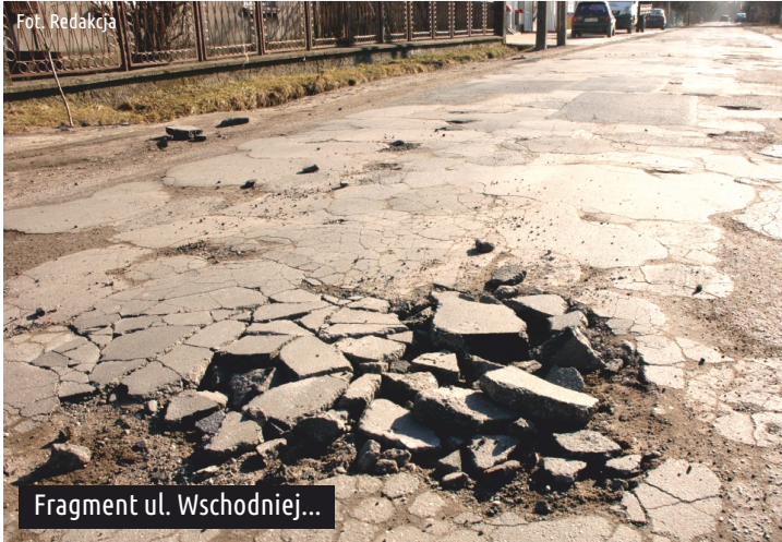
Fragment ul. Wschodniej...