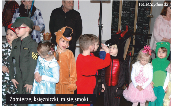
Żołnierze, księżniczki, misie, smoki...