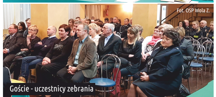
Goście - uczestnicy zebrania