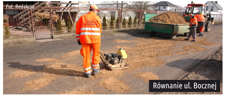
Równanie ul. Bocznej