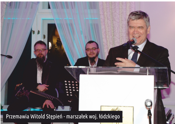
Przemawia Witold Stępień - marszałek woj. łódzkiego