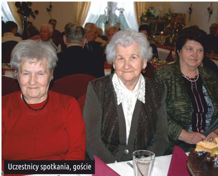
Uczestnicy spotkania, goście