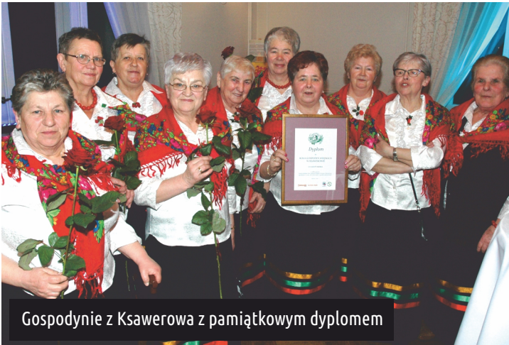
Gospodynie z Ksawerowa z pamiątkowym dyplomem