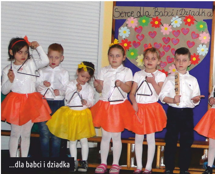
...dla babci i dziadka

Jak gorące są serduszka przedszkolaków i jak wielkim uczuciem obdarzają swoich najbliższych - można było się przekonać 8 lutego br., podczas programu artystycznego przygotowanego specjalnie dla babci i dziadka. Gorące podziękowania dla wszystkich, którzy pomogli i zaangażowali