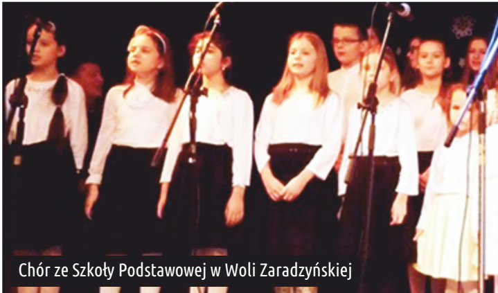
Chór ze Szkoły Podstawowej w Woli Zaradzyńskiej

W grudniu ub.r. chór ze Szkoły Podstawowej w Woli Zaradzyńskiej - w którego skład wchodzi uczniowie klas od I do VI - wziął udział w III Ogólnopolskim Konkursie Kolęd i Pastoralek. Młodzi wokaliści zaśpiewali staropolską pastorałkę pt: "Panna wesoła", oraz "Kolędę kołysankę" - zdobywając wyróżnienie w zmaganiach chórzystów. Kolejnym wydarzeniem - tym razem o charakterze międzypowiatowym - w którym chór ze Szkoły Podstawowej w Woli Zaradzyńskiej osiągnął sukces,