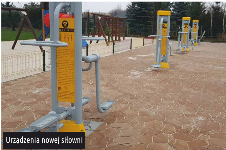
Urządzenia nowej siłowni