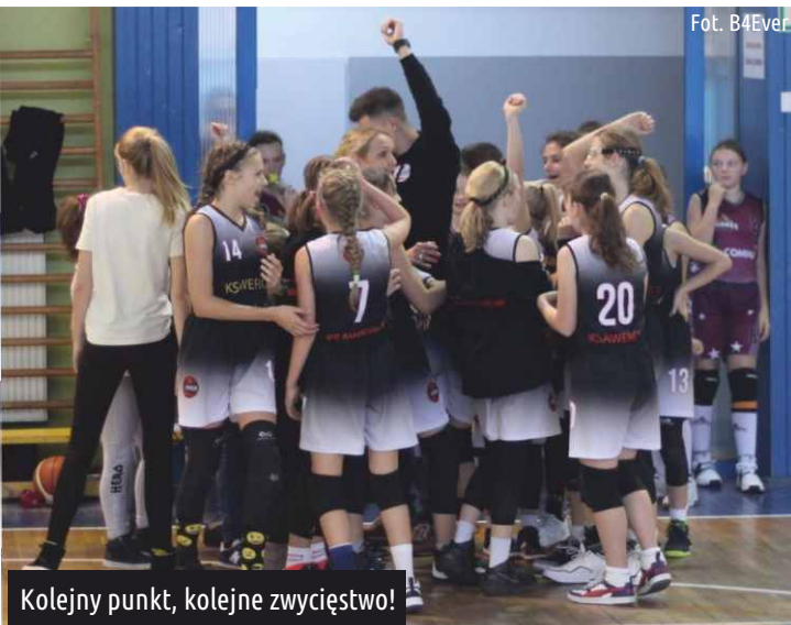
Kolejny punkt, kolejne zwycięstwo!