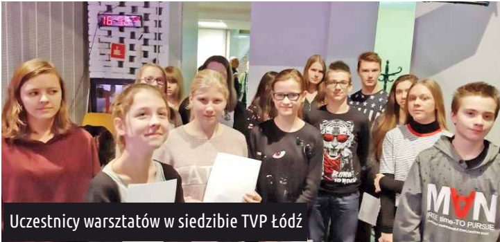
Uczestnicy warsztatów w siedzibie TVP Łódź