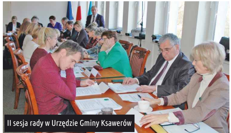
II sesja rady w Urzędzie Gminy Ksawerów

29 listopada radni obradowali po raz drugi w nowej kadencji. Po raz pierwszy w historii rady głosowanie odbyło się w formie elektronicznej - każdy z radnych posiadał tablet kompatybilny z dedykowanym serwisem internetowym. Podczas posiedzenia radni podjęli uchwały dotyczące m.in. utworzenia Komisji Rady Gminy Ksawerów oraz powołania ich przewodniczących.