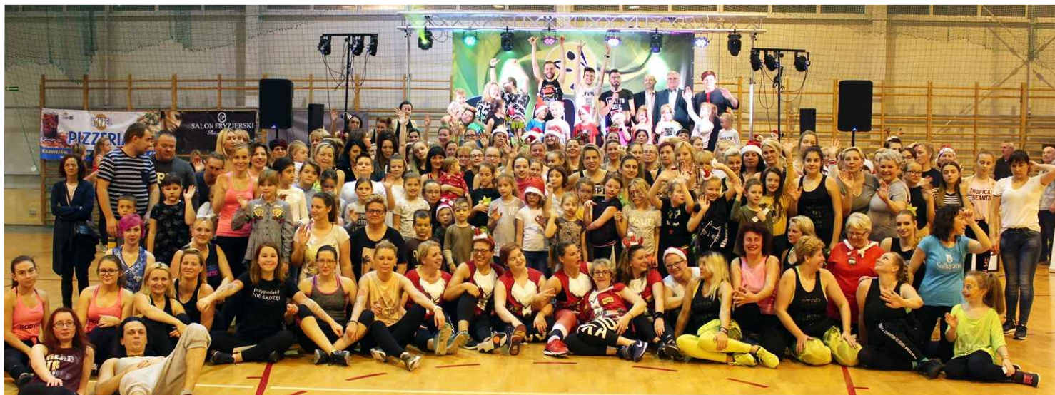
Uczestnicy przedświątecznego maratonu ZUMBY

Ponad 350 osób wzięło udział w przedświątecznym maratonie ZUMBY, który w niedzielne popołudnie odbył się w Hali Sportowej Szkoły Podstawowej im. dr. Henryka Jordana w Ksawerowie.