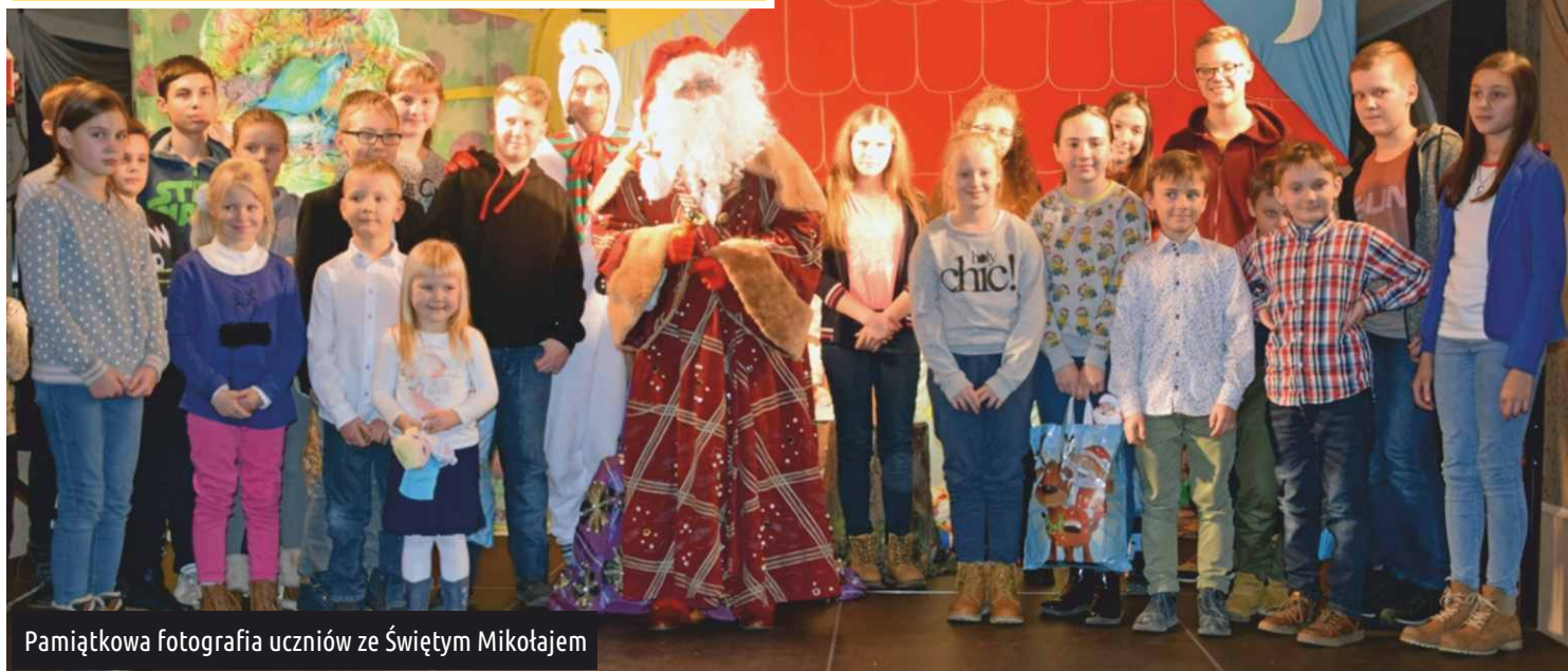
Pamiątkowa fotografia uczniów ze Świętym Mikołajem