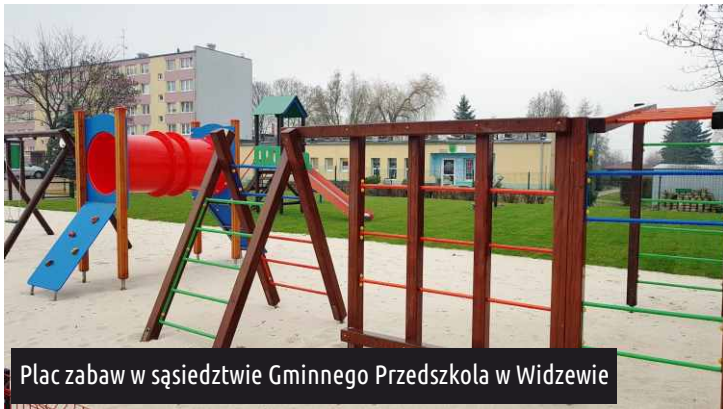
Plac zabaw w sąsiedztwie Gminnego Przedszkola w Widzewie