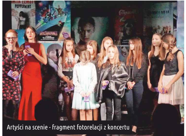
Artyści na scenie - fragment fotorelacji z koncertu