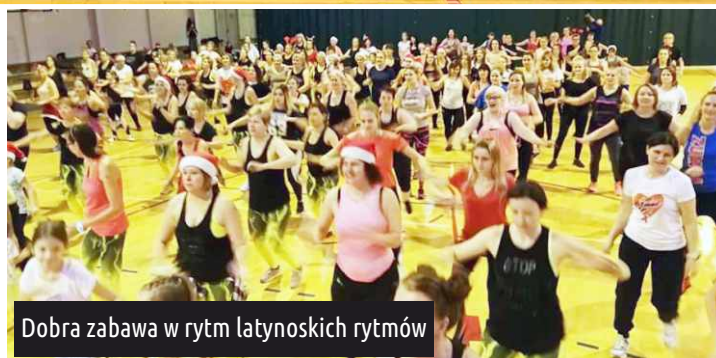
Dobra zabawa w rytm latynoskich rytmów