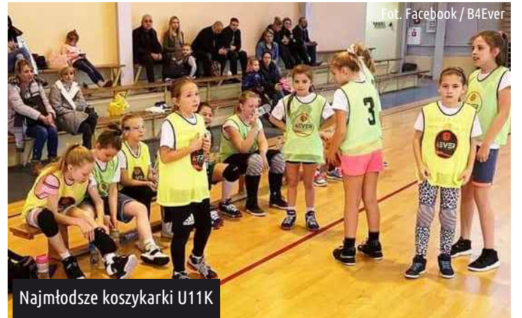
Najmłodsze koszykarki U11K