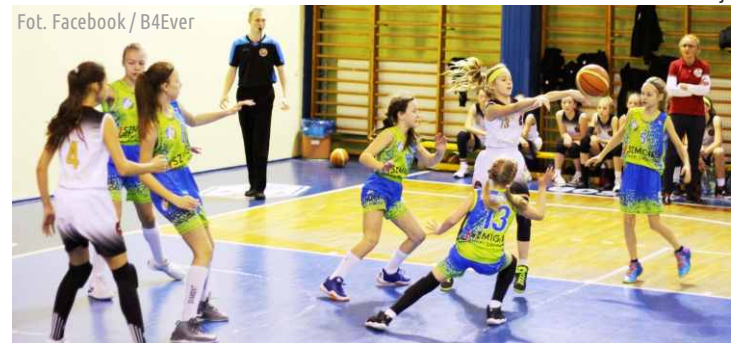
Mecz z PTK