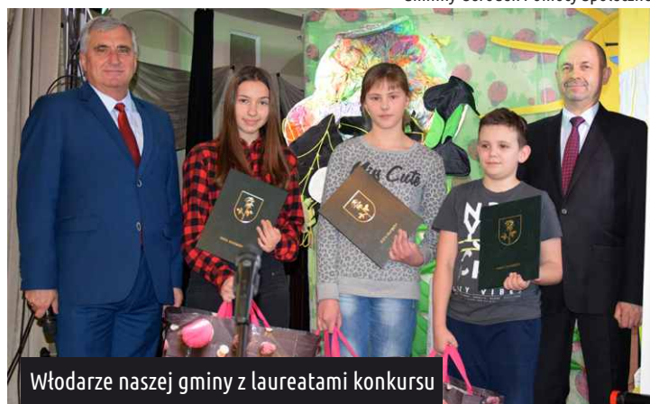
Wóldarze naszej gminy z laureatami konkursu