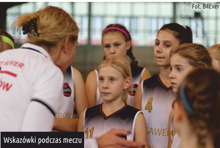
Wskazówki podczas meczu