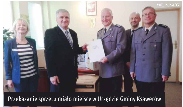
Przekazanie sprzętu miało miejsce w Urzędzie Gminy Ksawerów