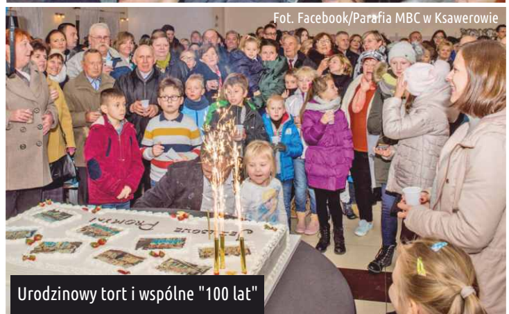
Urodzinowy tort i wspólne "100 lat"