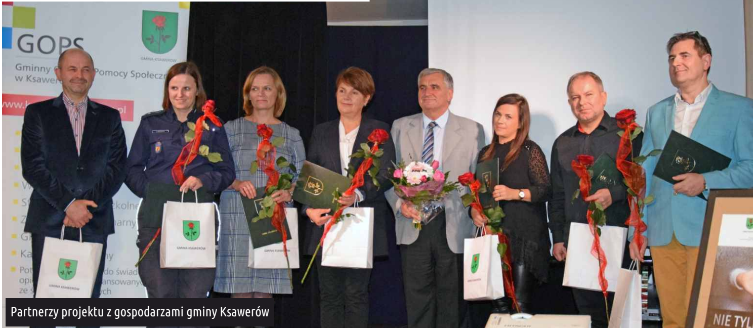
Partnerzy projektu z gospodarzami gminy Ksawerów

3 grudnia br. w placówkach oświatowych prowadzonych przez gminę Ksawerów, odbyły się ostatnie już - cykliczne spotkania w ramach projektu "Nie tylko bicie boli" realizowanego przez Gminny Ośrodek Pomocy Społecznej w Ksawerowie.