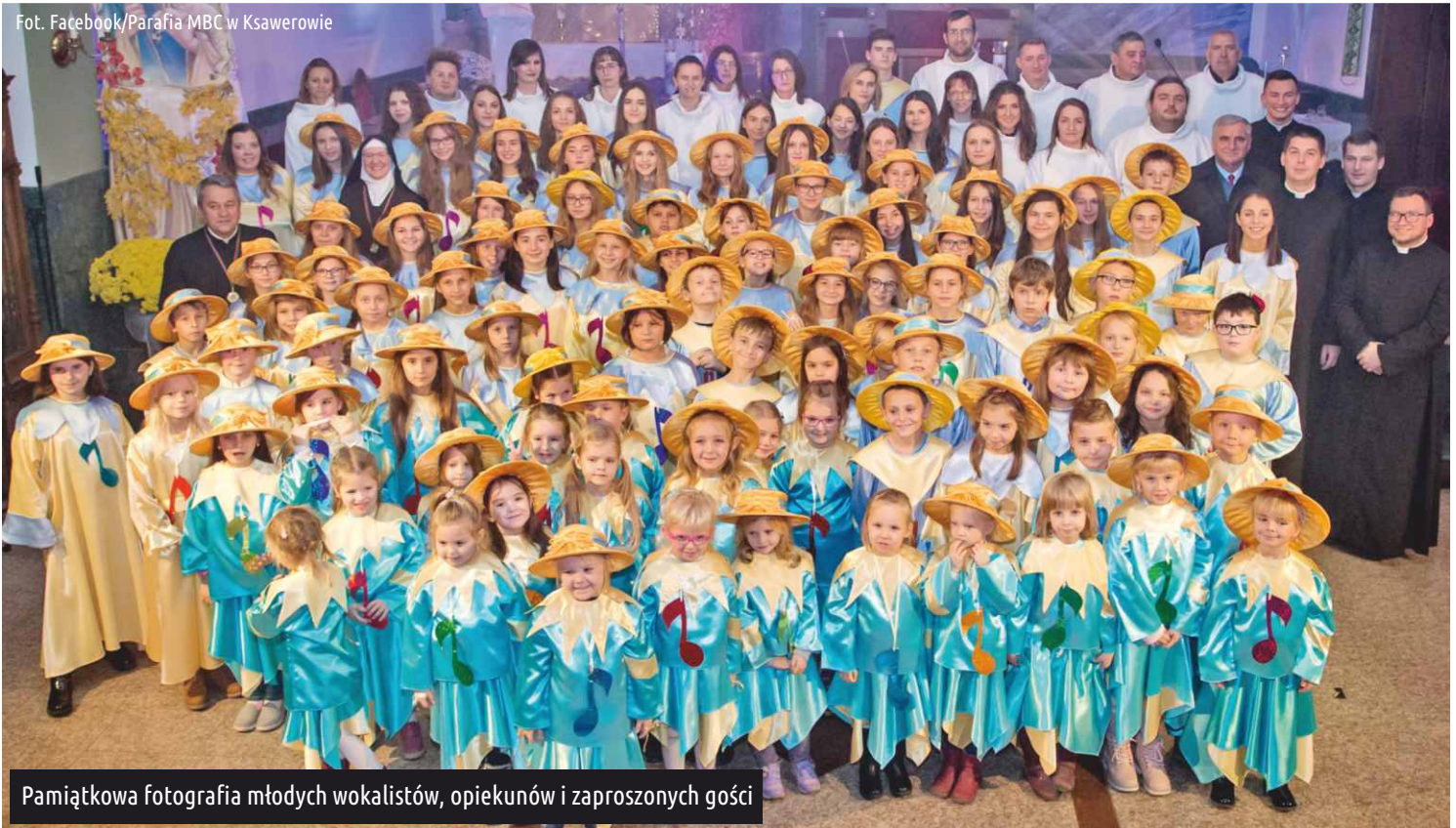
Pamiątkowa fotografia młodych wokalistów, opiekunów i zaproszonych gości

18 listopada w parafii pw. Matki Boskiej Częstochowskiej w Ksawerowie odbył się urodzinowy koncert z okazji jubileuszu 20-lecia scholi Jezusowe Promyki. Kto nie był, niech żałuje.