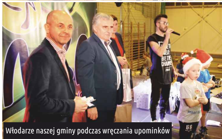
Włodarze naszej gminy podczas wręczania upominków