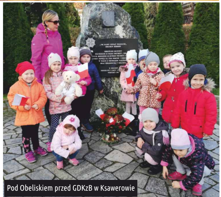
Pod Obeliskiem przed GDKzB w Ksawerowie