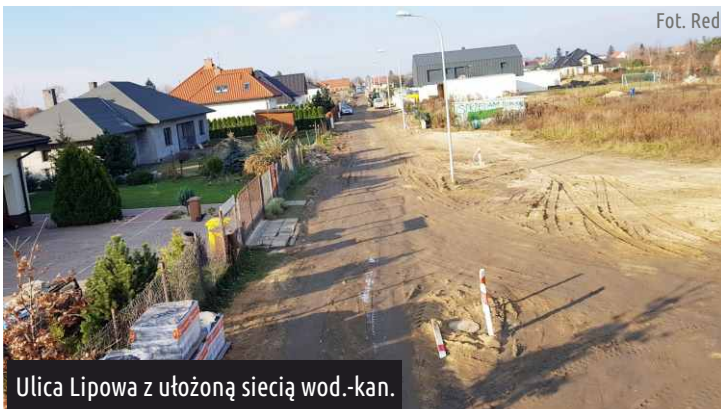
Ulica Lipowa z ułożoną siecią wod.-kan.