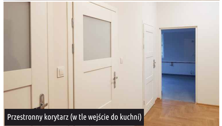
Przestronny korytarz (w tle wejście do kuchni)