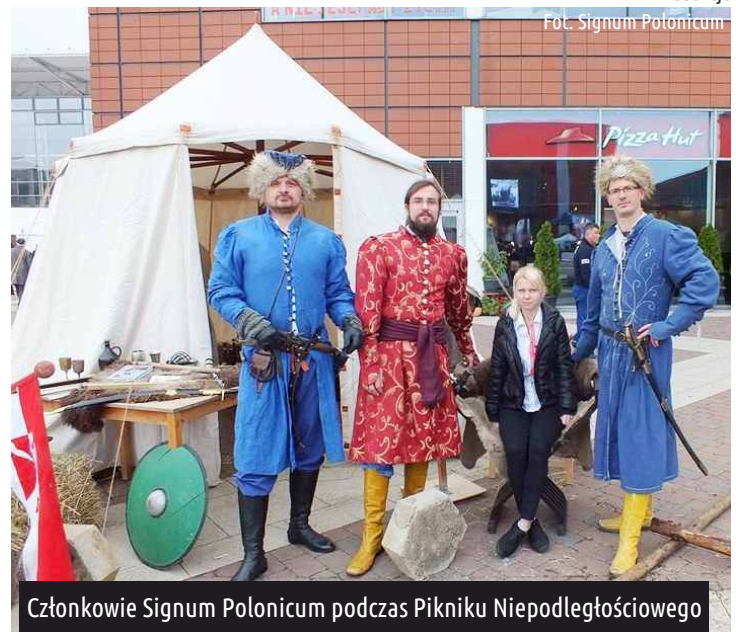
Członkowie Signum Polonicum podczas Pikniku Niepodległościowego