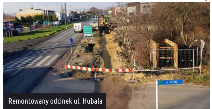
Remontowany odcinek ul. Hubala