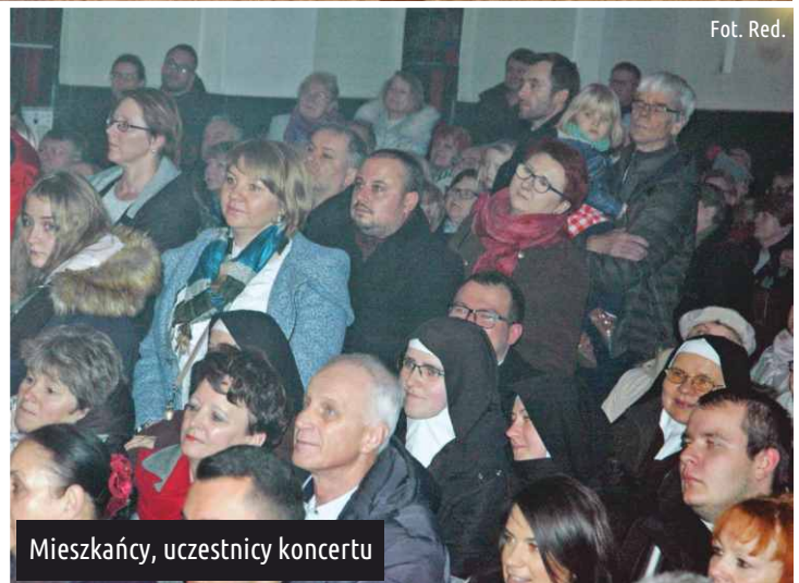
Mieszkańcy, uczestnicy koncertu