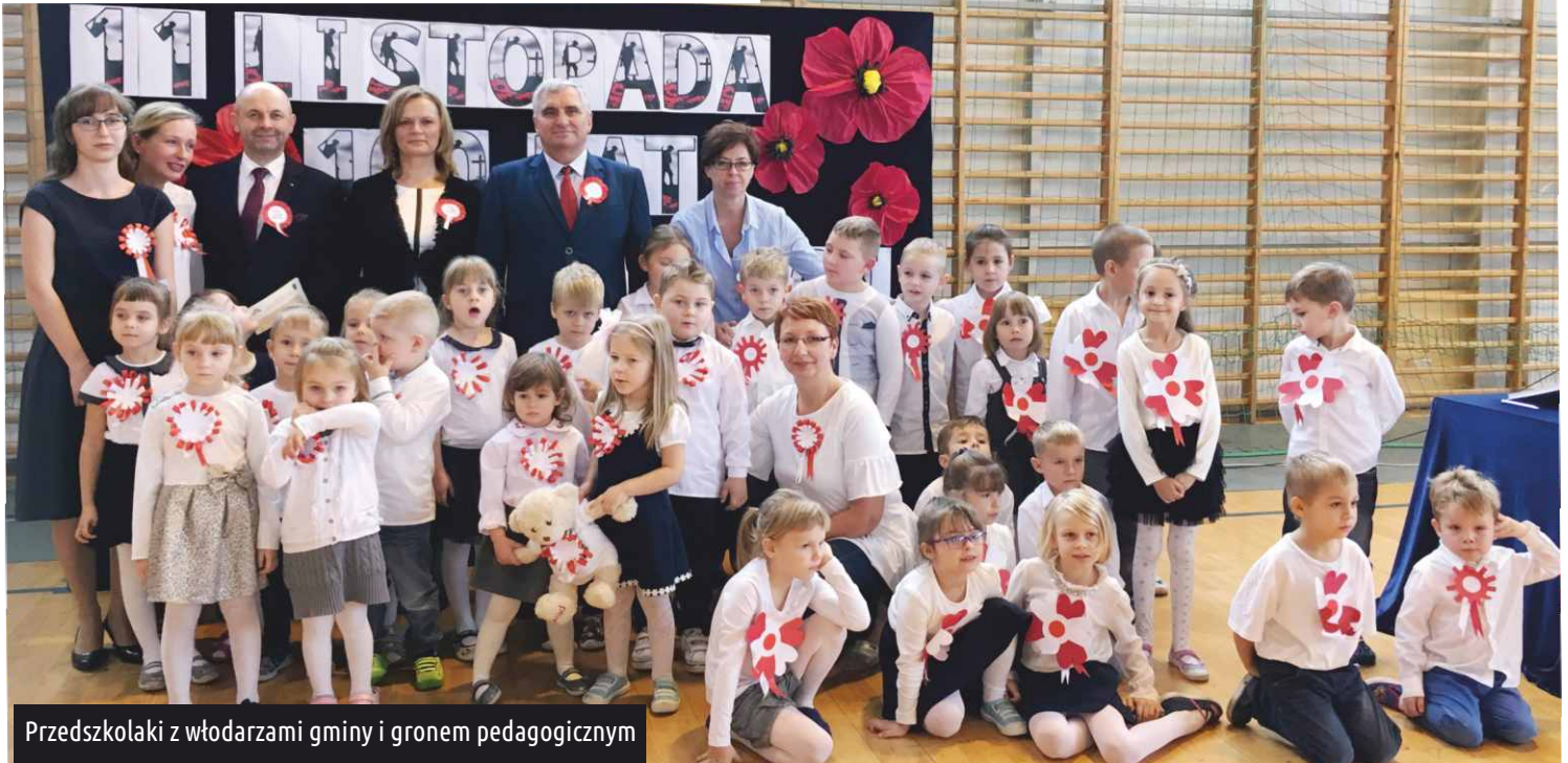
Przedшкоlaki z wóldarzami gminy i gronem pedagogicznym

Przedшкоlaki z oddziału przedшкоlnego w Szkole Podstawowej im. dr. Henryka Jordana w Ksawerowie zainicjowały obchody 100-lecia odzyskania niepodległości już w czwartek 8 listopada br.