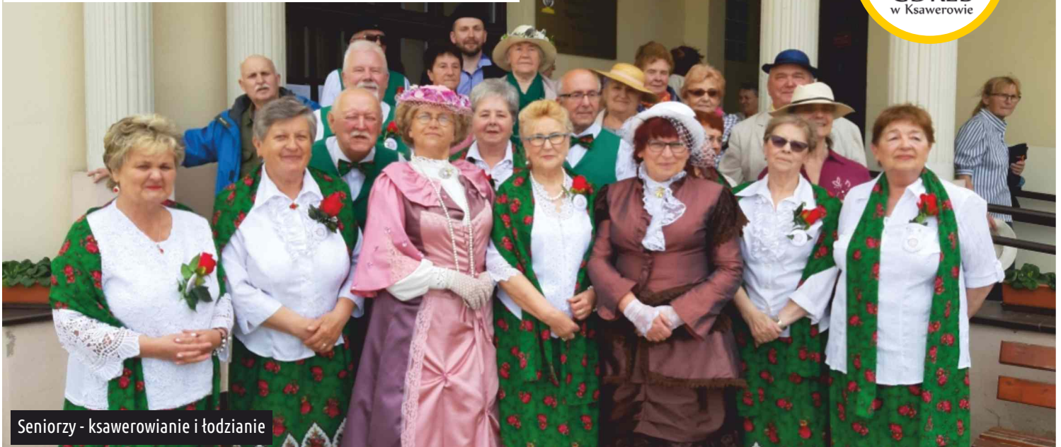
Seniorzy - ksawerowianie i łodzianie

29 maja br. członkowie ksawerowskiego Klubu Seniora gościli przemyłych seniorów z Łodzi.