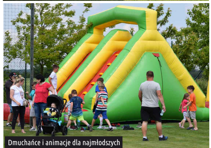
Dmuchańce i animacje dla najmłodszych