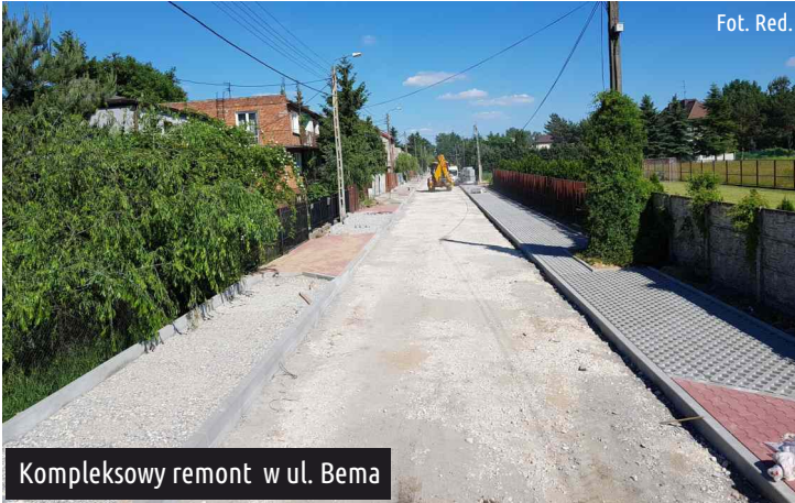
Kompleksowy remont w ul. Bema