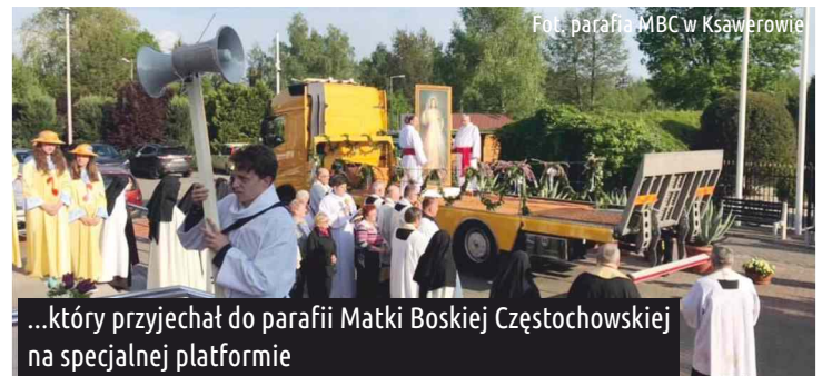
...który przyjechał do parafii Matki Boskiej Częstochowskiej na specjalnej platformie