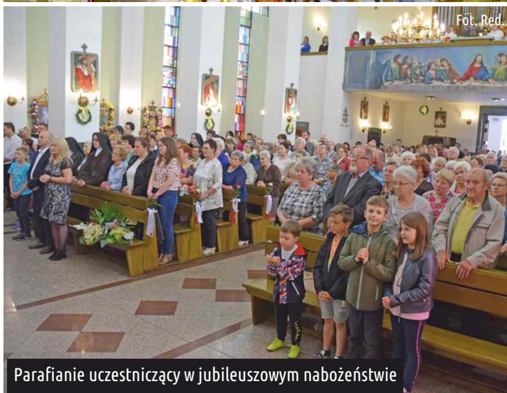
Parafianie uczestniczący w jubileuszowym nabożeństwie