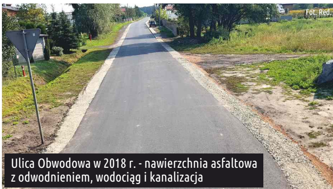
Ulica Obwodowa w 2018 r. - nawierzchnia asfaltowa z odwodnieniem, wodociąg i kanalizacja