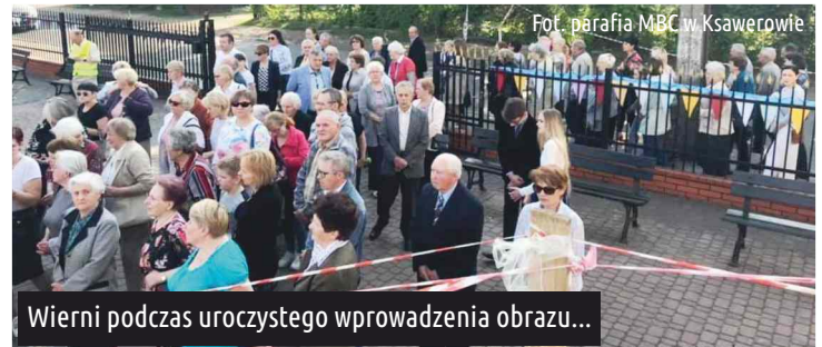
Wierni podczas uroczystego wprowadzenia obrazu...