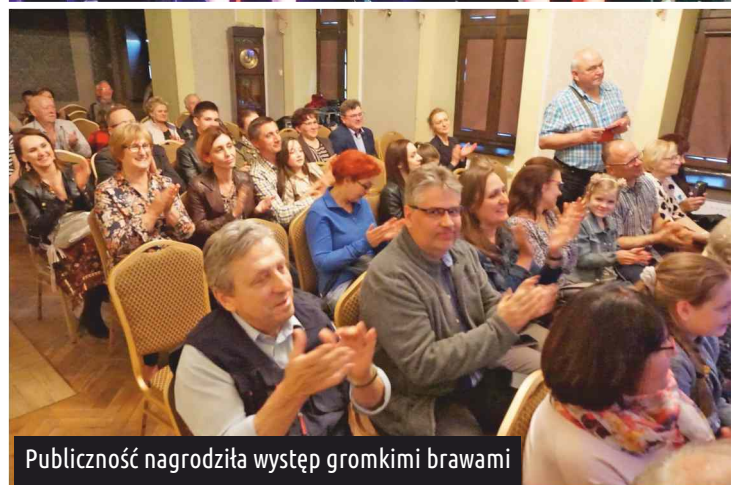
Publiczność nagrodziła występ gromkimi brawami

Echo Gminy Ksawerów - gazeta samorządu terytorialnego.