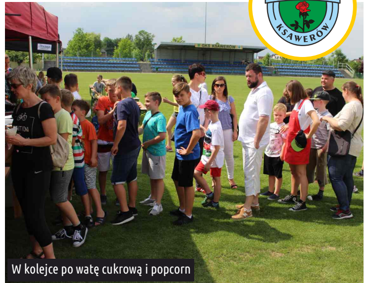
W kolejce po watę cukrową i popcorn