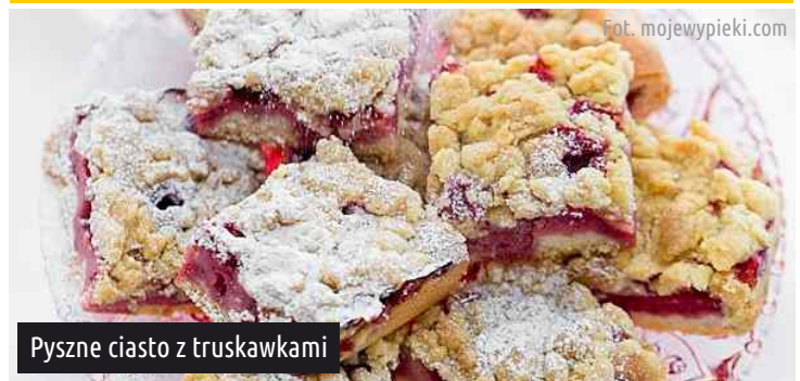
Pyszne ciasto z truskawkami