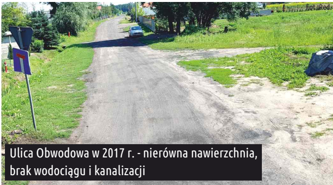
Ulica Obwodowa w 2017 r. - nierówna nawierzchnia, brak wodociągu i kanalizacji