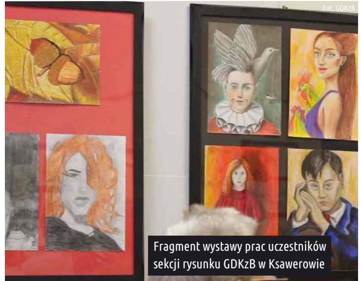
Fragment wystawy prac uczestników sekcji rysunku GDKzB w Ksawerowie