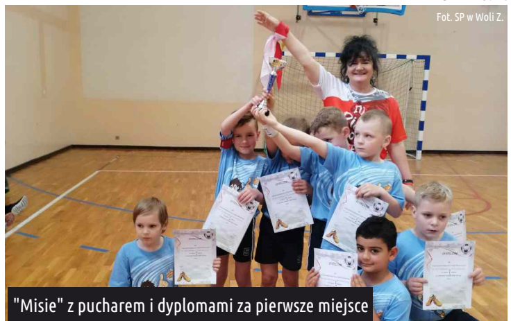
"Misie" z pucharem i dyplomami za pierwsze miejsce