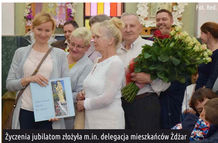
Życzenia jubilatowi złożyła m.in. delegacja mieszkańców Żdżar