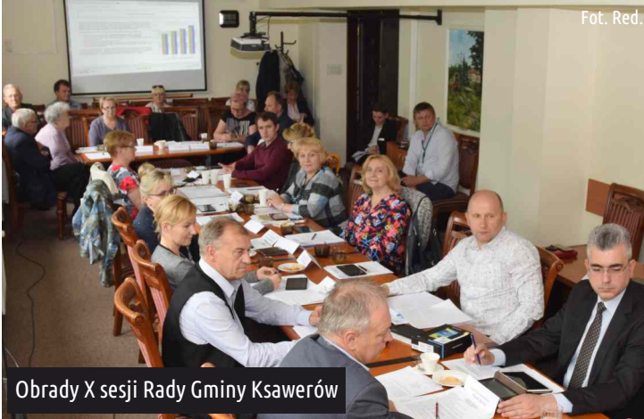
Obrazy X sesji Rady Gminy Ksawerów