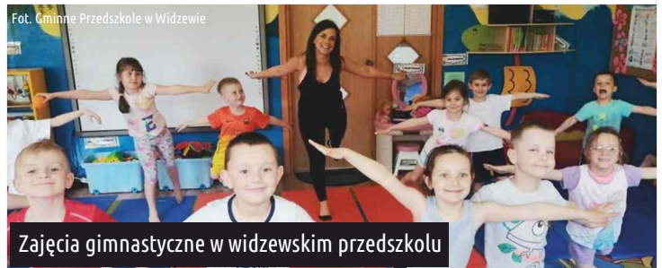
Fot. Gminne Przedszkole w Widzewie