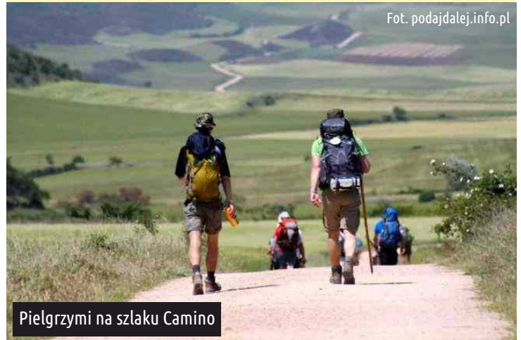
Pielgrzymi na szlaku Camino