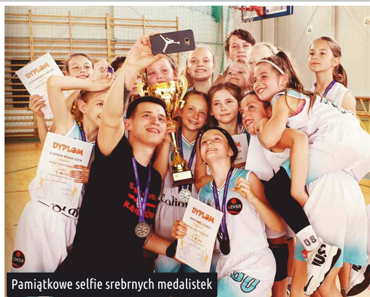
Pamiętkowe selfie srebrnych medalistek

Turniej finałowy w kategorii Skrzatek został rozegrany na hali w Ksawerowie przy ul. Zachodniej 33. W spotkaniu półfinałowym drużyna Basket4EVER pewnie pokonała koszykarki z łódzkiego klubu UKS Szkoła Gortata wynikiem 55:31, i w finale zmierzyła się z drużyną PTK Cocomore z Pabianic. Ostatni mecz sezonu 2018/2019 przebiegał na bardzo wysokim poziomie, a przez większą część spotkania przeważały nasze ksawerowianki. Losy finału odwróciła ostatnia kwarta, w której pabianiczanki szybkimi kontrami wypracowały bezpieczną przewagę, przez co mecz zakończył się ostatecznie wynikiem 58:53 dla Pabianic.