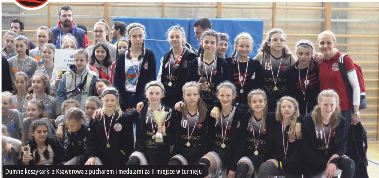
Dumne koszykarki z Ksawerowa z pucharem i medalami za II miejsce w turnieju

Basket4EVER Ksawerów okazał się najlepszą polską drużyną w roczniku 2006 i młodsze na turnieju Tytus Cup 2019.