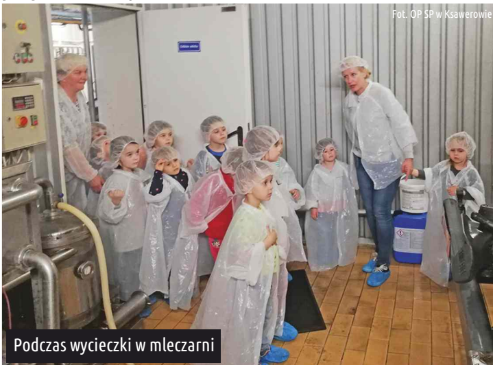
Podczas wycieczki w mleczarni