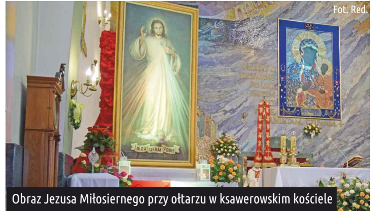
Obraz Jezusa Miłosiernego przy ołtarzu w ksawerowskim kościele

W parafii Matki Boskiej Częstochowskiej w Ksawerowie misje Miłosierdzia rozpoczęły się 18 maja br. po przywitaniu obrazu, który przybył do naszej gminy z parafii w Górcie Pabianickiej. Z tej okazji odprawione zostało uroczyste nabożeństwo. Podczas całego następnego tygodnia (tyle czasu trwają misje) wierni modlili się podczas mszy św., Koronki do Bożego Miłosierdzia i Godzinkach o Miłosierdziu Bożym. Każdy dzień kończony był Apelem Jasnogórskim, podczas którego powierzano Maryi cały miniony dzień.