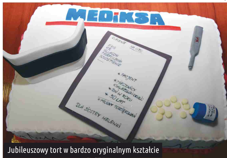
Jubileuszowy tort w bardzo oryginalnym kształcie