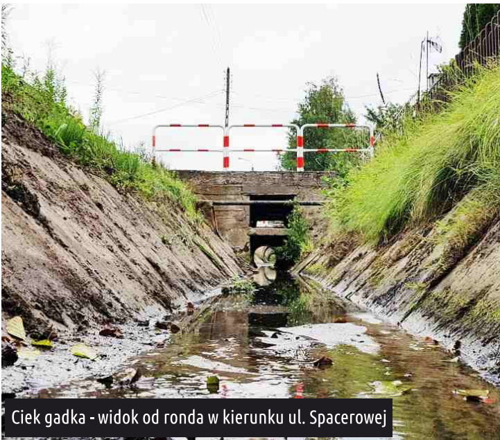
Ciek gadka - widok od ronda w kierunku ul. Spacerowej