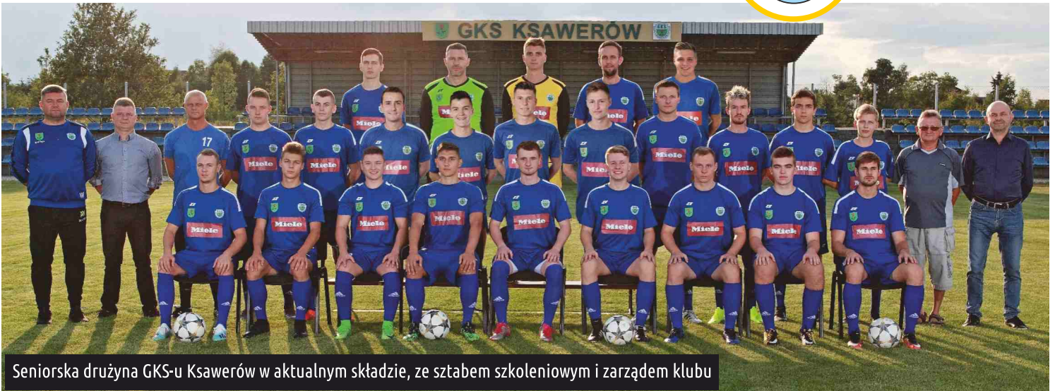
Seniorska drużyna GKS-u Ksawerów w aktualnym składzie, ze sztabem szkoleniowym i zarządem klubu

Po dwóch miesiącach przerwy piłkarze drużyn GKS-u Ksawerów wznowili rozgrywki. Jako pierwsi na boisko wybiegli seniorzy, którzy na stadionie w Pabianicach rozegrali mecz z drużyną PTC Pabianice.