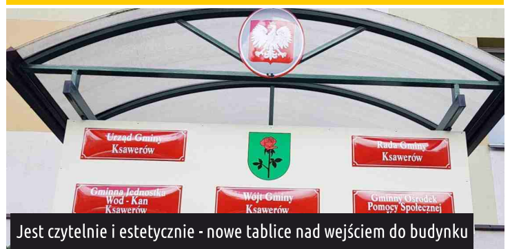
Jest czytelnie i estetycznie - nowe tablice nad wejściem do budynku