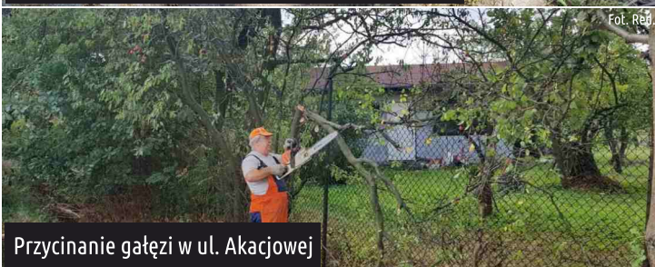
Przycinanie gałęzi w ul. Akacjowej