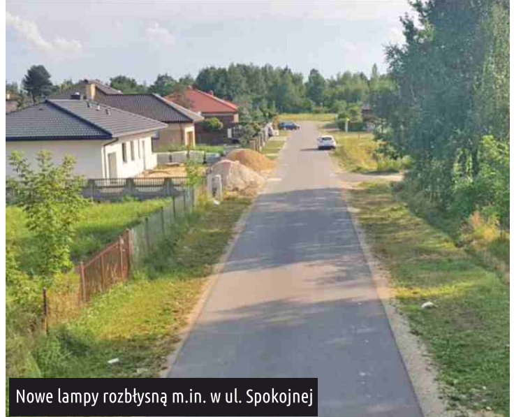
Nowe lampy rozbłyśną m.in. w ul. Spokojnej