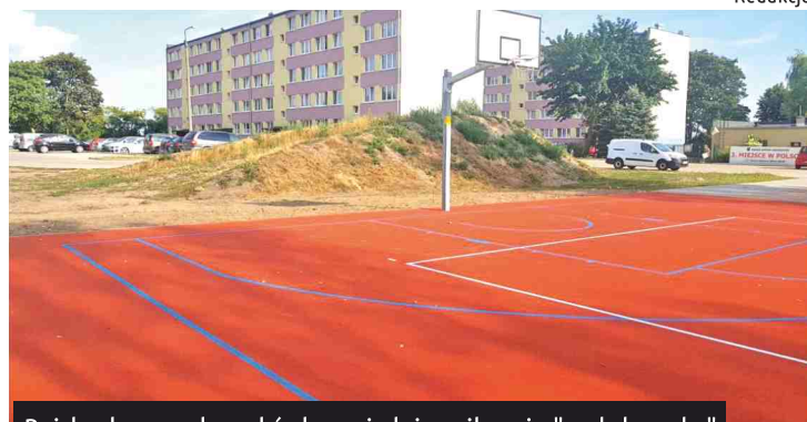
Boisko do gry w koszykówkę sąsiaduje z siłownią "pod chmurką"