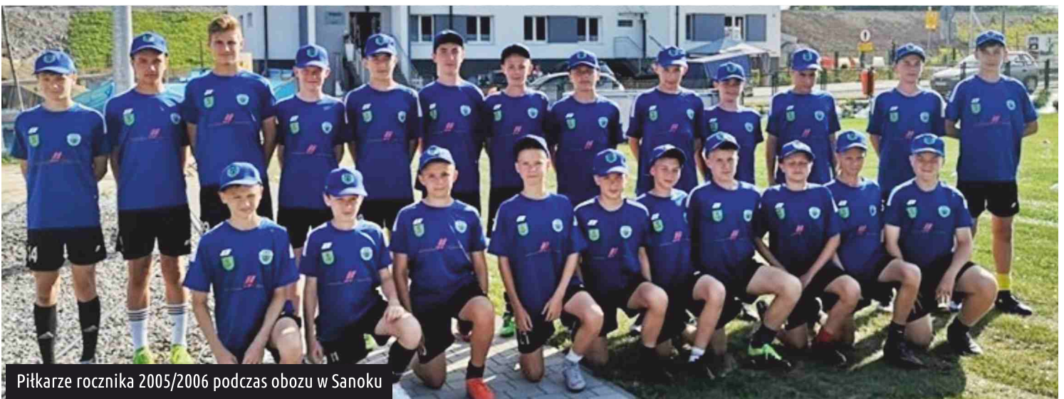
Piłkarze rocznika 2005/2006 podczas obozu w Sanoku