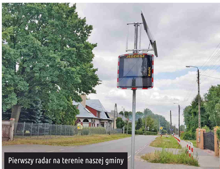
Pierwszy radar na terenie naszej gminy