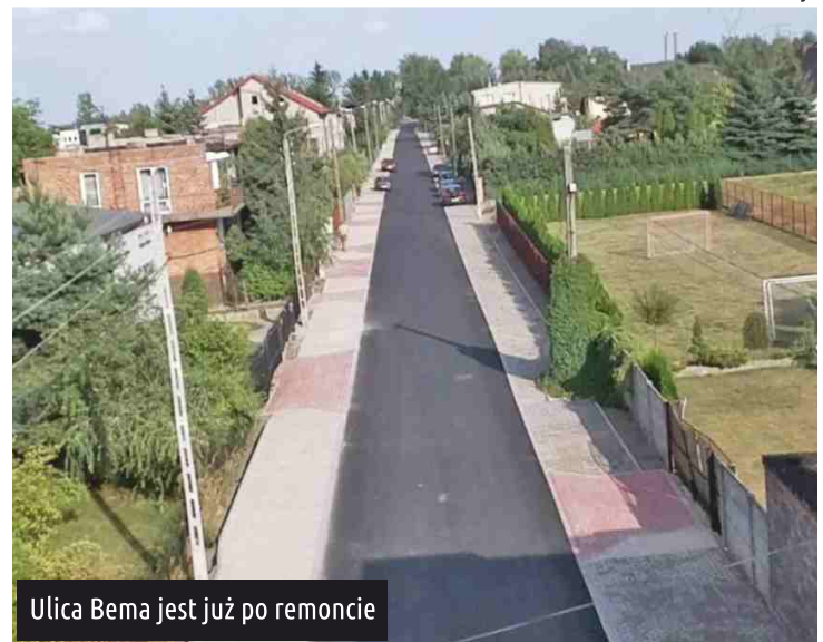
Ulica Bema jest już po remoncie