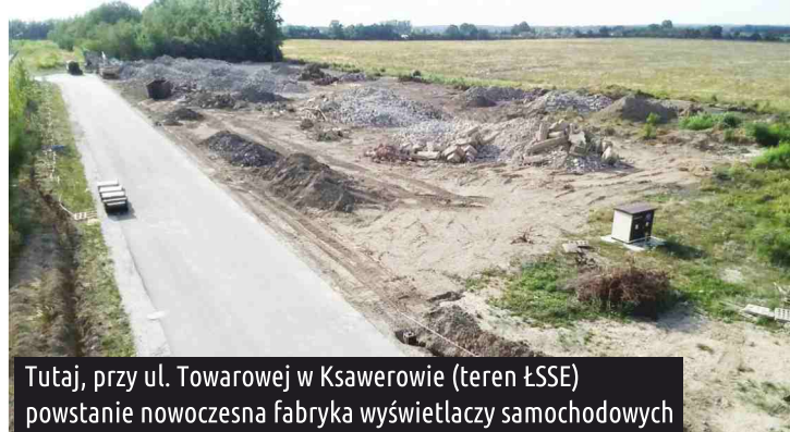
Tutaj, przy ul. Towarowej w Ksawerowie (teren ŁSSE) powstanie nowoczesna fabryka wyświetlaczy samochodowych