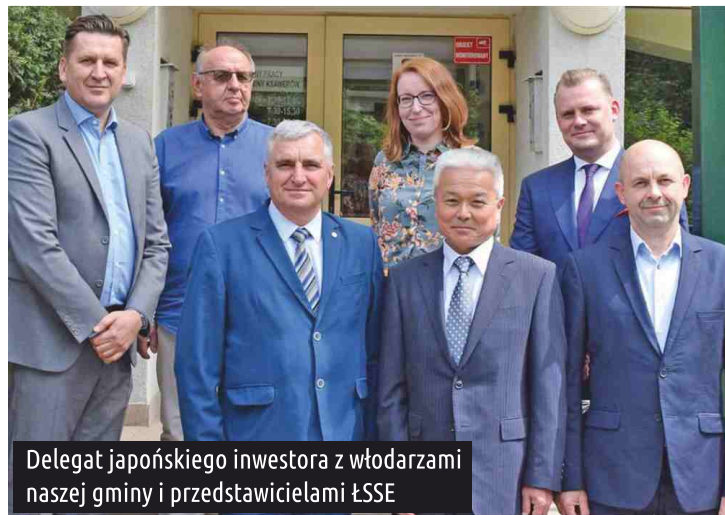
Delegat japońskiego inwestora z wójtami naszej gminy i przedstawicielami ŁSSE