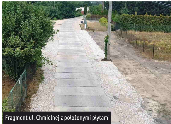
Fragment ul. Chmielnej z położonymi płytami