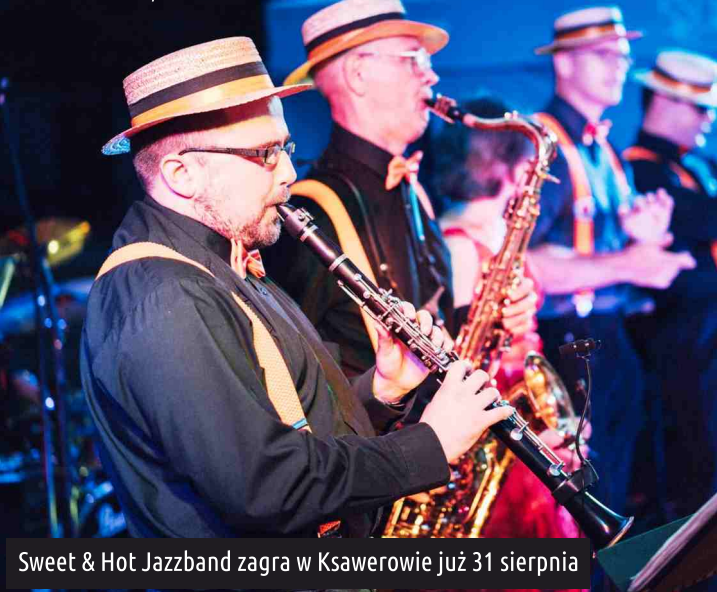
Sweet & Hot Jazzband zagra w Ksawerowie już 31 sierpnia

Na zakończenie lata, 31 sierpnia podczas pikniku rodzinnego sołectwa Ksawerów - Południe (godz. 17.00), zagra w Ksawerowie - dla słuchaczy i tancerzy - bodaj jedyna formacja jazzu tradycyjnego w regionie, bawiąca się tym rodzajem muzyki już 15 lat. Zespół Sweet & Hot Jazzband! Dla przybywających jedna rada - KONIECZNIE wólcie buty wygodne do tańca.