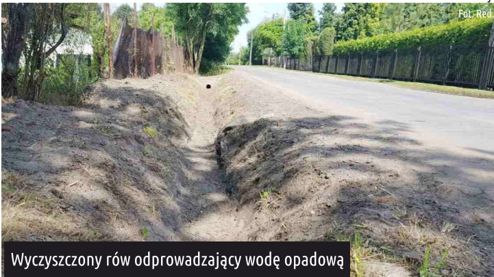
Wyczyszczony rów odprowadzający wodę opadową