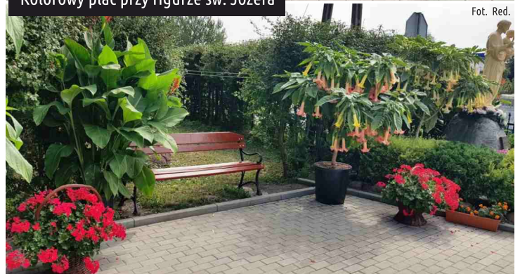
Kolorowy plac przy figurce św. Józefa