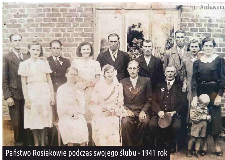
Państwo Rosiakowie podczas swojego ślubu - 1941 rok