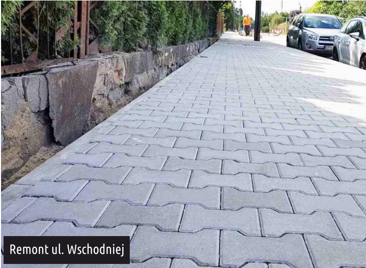
Remont ul. Wschodniej