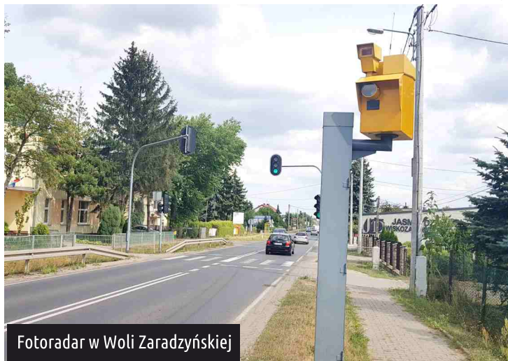
Fotoradar w Woli Zaradzyńskiej