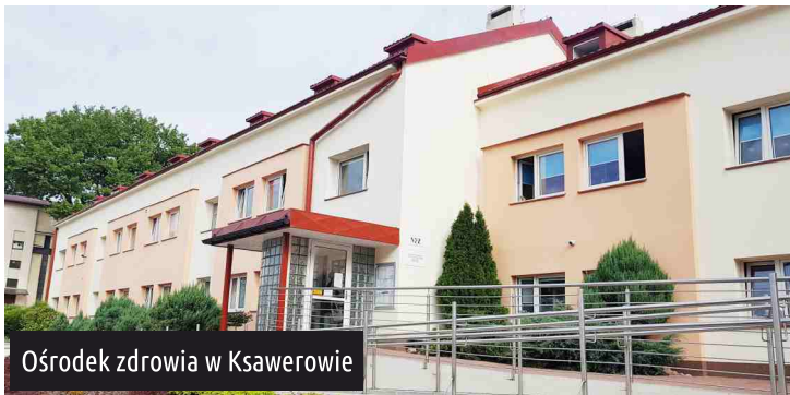
Ośrodek zdrowia w Ksawerowie