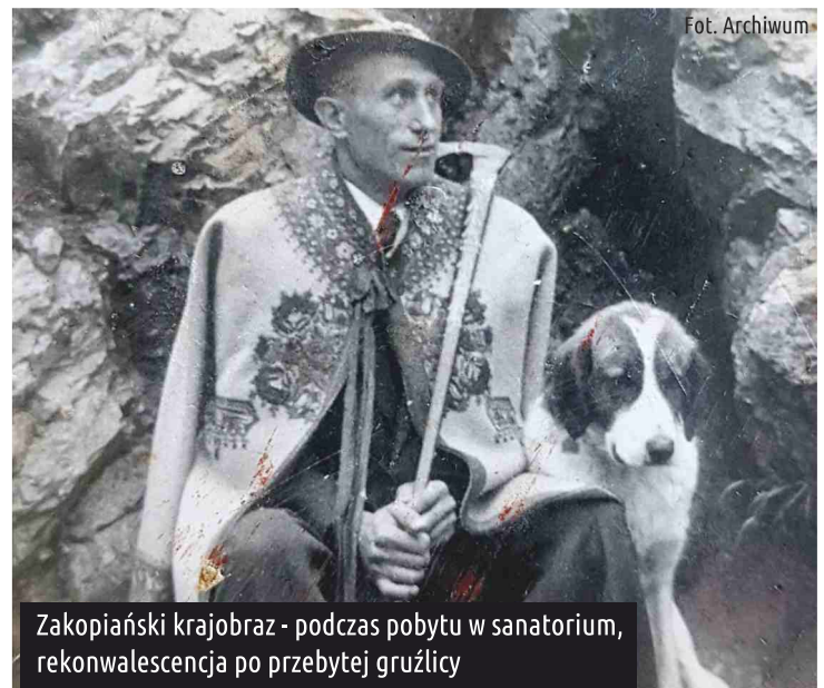
Zakopiański krajobraz - podczas pobytu w sanatorium, rekonwalescencja po przebytej gruźlicy

Córka - Zaraz po wojnie tata ciężko zachorował na gruźlicę. Z 20-sto osobowej sali szpitalnej tylko on przeżył. To był tragiczny czas. Codziennie jeden, dwóch umierało. Można było się załamać. Ale tatę nie opuszczało szczęście, przeżył to wszystko i wyzdrowiał. Bardzo pomogła mu żona, która z wielkim oddaniem o niego dbała. Pielęgnowała, rosółki przynosiła. Można powiedzieć, że lekarzom i żonie zawdzięcza życie.