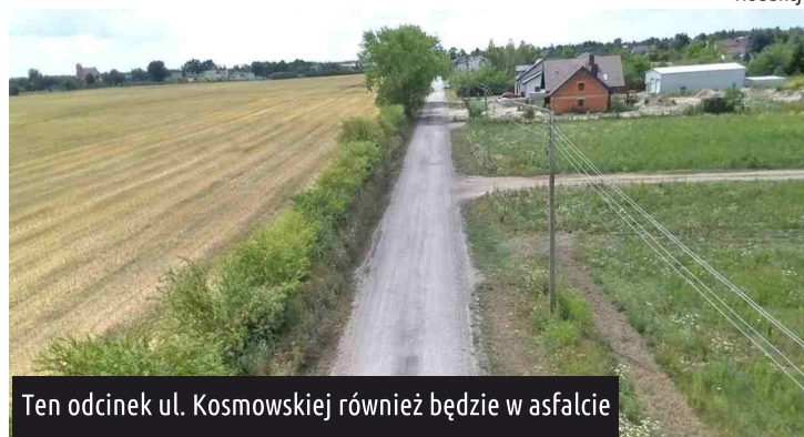
Ten odcinek ul. Kosmowskiej również będzie w asfalcie