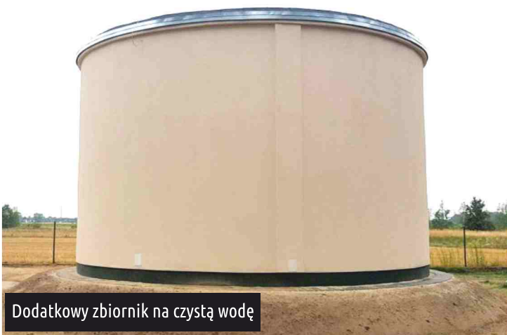
Dodatkowy zbiornik na czystą wodę