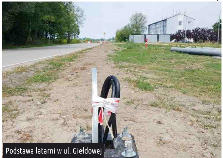
Podstawa latarni w ul. Giełdowej