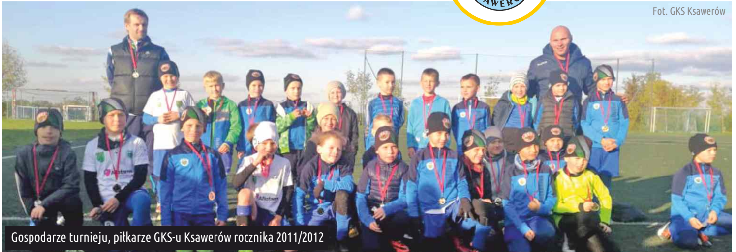
Gospodarze turnieju, piłkarze GKS-u Ksawerów rocznika 2011/2012

6 października na stadionie GKS-u Ksawerów odbył się turniej piłkarski rocznika 2011/2012. Drużyna gospodarzy zaprosiła do rywalizacji takie zespoły jak: ŁKS I Łódź, ŁKS II Łódź, Zawisza Rzgów, Orzeł Piątkowisko, Iskra Dobroń, PTC Pabianice oraz CRI Pabianice.