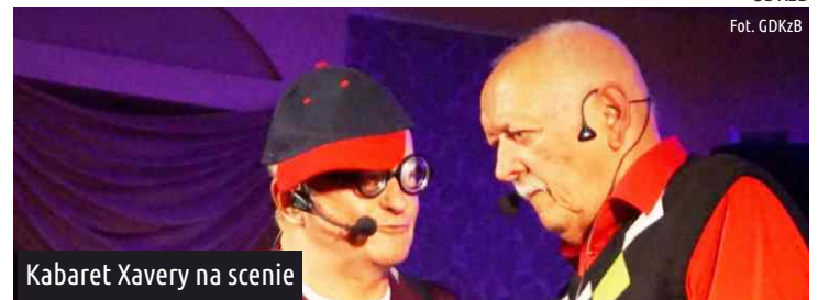
Kabaret Xavery na scenie