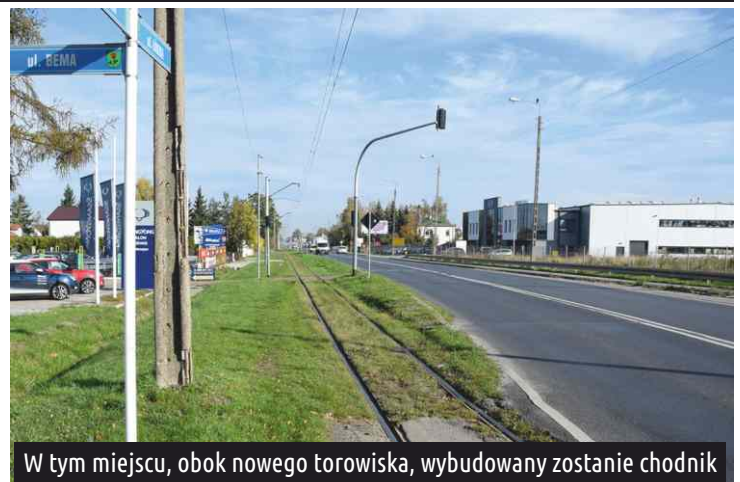
W tym miejscu, obok nowego torowiska, wybudowany zostanie chodnik

Gmina Ksawerów - jako partner projektu partycypuje w przedsięwzięciu kwotą ok. 23 mln zł (dofinansowanie ok. 14 mln zł). Miasto Pabianice - jako lider projektu finansuje inwestycję kwotą ok. 151 mln zł (dofinansowanie ok. 70 mln zł)