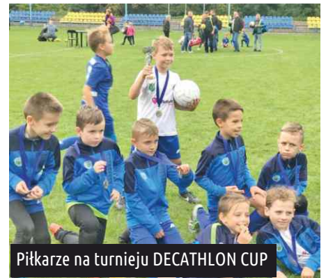
Piłkarze na turnieju DECATHLON CUP