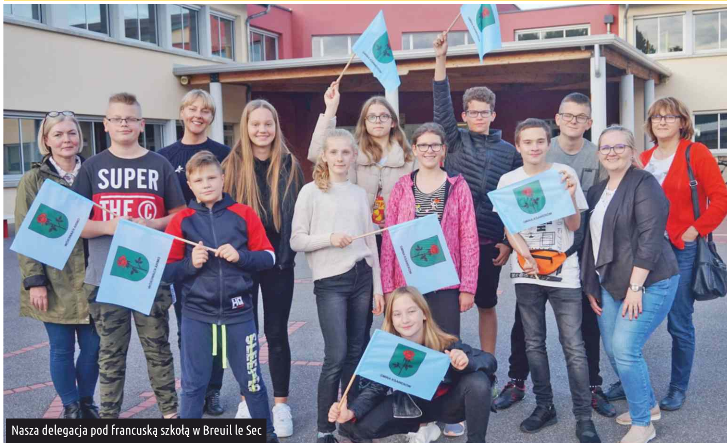
Nasza delegacja pod francuską szkołą w Breuil le Sec

Laureaci "Gminnego konkursu wiedzy o Francji" rozstrzygniętego w czerwcu br., w którym nagrodą był wyjazd do Francji do zaprzyjaźnionej Gminy Breuil le Sec, pod koniec września spędzili cztery fantastyczne dni u naszych zachodnich sąsiadów. Uczestnicy wyjazdu zostali serdecznie przywitani przez gospodarzy.