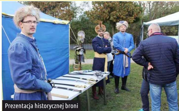
Prezentacja historycznej broni