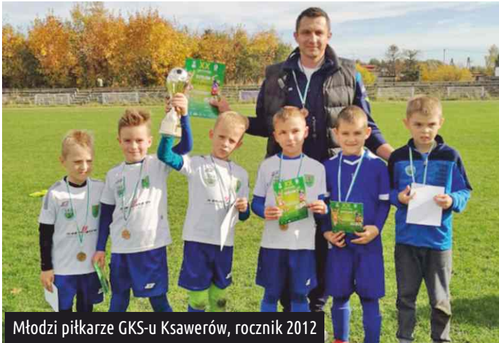
Młodzi piłkarze GKS-u Ksawerów, rocznik 2012

Reprezentacja Szkoły Podstawowej w Ksawerowie rocznika 2010 składająca się z chłopców klasy IVB również wygrała powiatowy etap turnieju "Z Podwórka na Stadion o Puchar Tymbarku", tym samym uzyskując awans do rozgrywek wojewódzkich i prawo gry w finałach na Stadionie Narodowym.