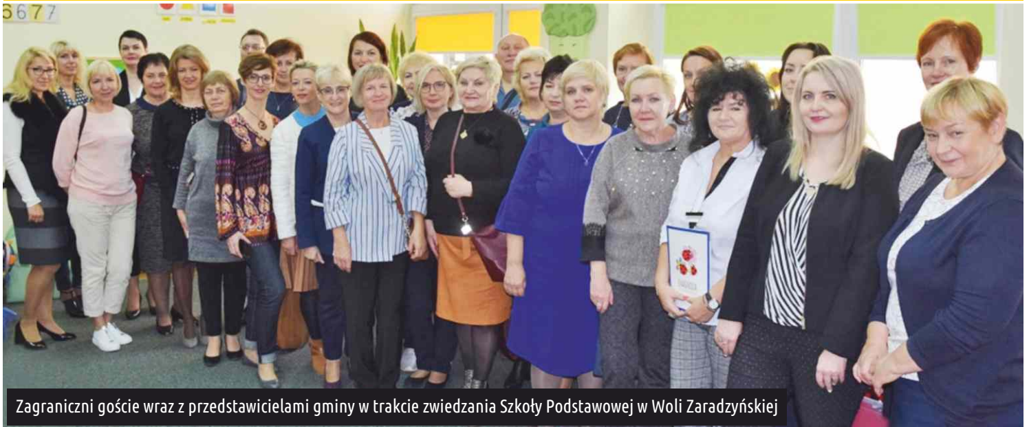
Zagraniczni goście wraz z przedstawicielami gminy w trakcie zwiedzania Szkoły Podstawowej w Woli Zaradzyńskiej

Grupa 25 osób - nauczycieli z łotewskiego samorządu Daugavpils, odwiedziła w październiku dwie placówki oświatowe na terenie naszej gminy. Celem wizyty było pokazanie zagranicznym gościom najważniejszych założeń polskiego systemu edukacji.