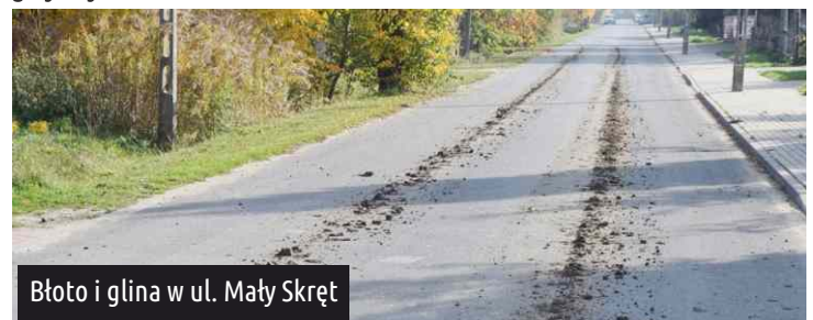
Błoto i glina w ul. Mały Skręt

Ciężki sprzęt wyjeżdżający z działek przy ul. Traktorowej, ul. Mały Skręt oraz ul. Solarza w Ksawerowie pozostawił na drodze kłopotliwe zabrudzenia z gliny i błota. Niestety, kierowcy owych pojazdów za nic mają kodeks wykroczeń. Co na to policja? Zabrudzenie jezdni błotem to nawet 1500 zł grzywny!