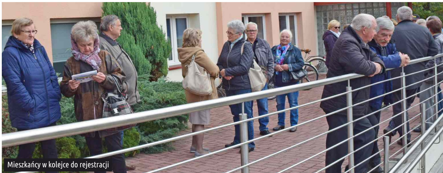
Mieszkańcy w kolejce do rejestracji

W sobotę 5 października nasi mieszkańcy wzięli udział w corocznej akcji profilaktycznej "ZDROWA RODZINA - ZDROWA GMINA" organizowanej na terenie gminy. O bardzo dużym zainteresowaniu ksawerowian bezpłatną diagnostyką świadczy ilość badań lekarskich, których wykonano łącznie aż 350!