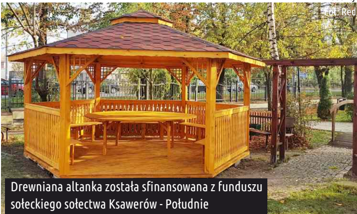
Drewniana altanka została sfinansowana z funduszu sołectkiego sołectwa Ksawerów - Południe