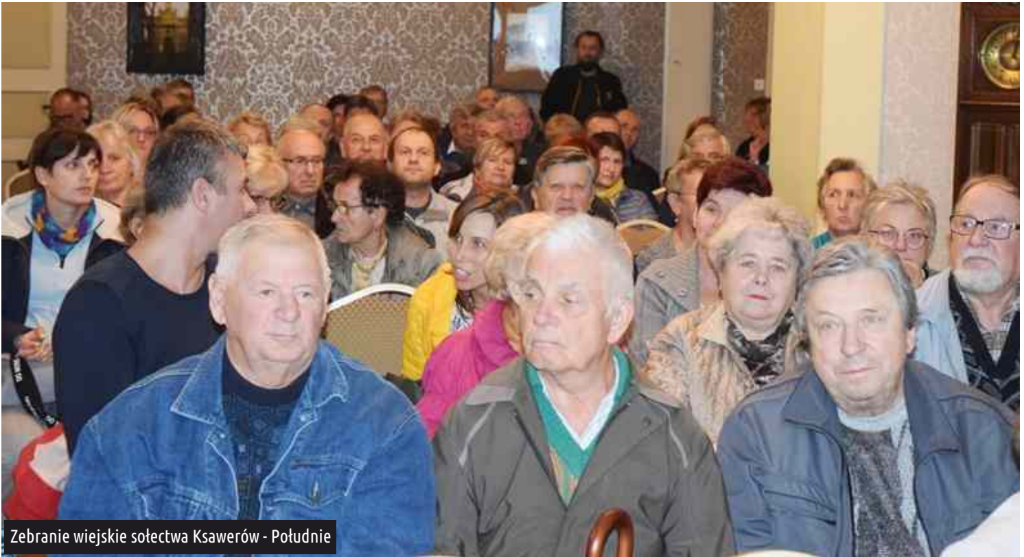
Zebranie wiejskie sołectwa Ksawerów - Południe

Pod koniec września mieszkańcy dwóch kolejnych sołectw zdecydowali o wyborze zadań do realizacji w ramach funduszy sołectkich na 2020 r.