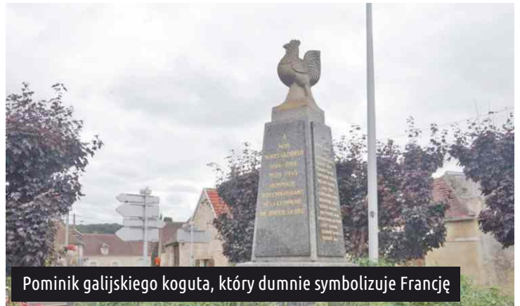
Pomnik galijskiego koguta, który dumnie symbolizuje Francję