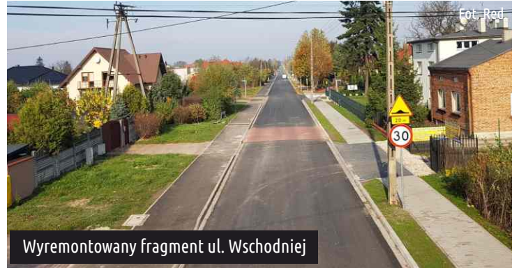
Wyremontowany fragment ul. Wschodniej