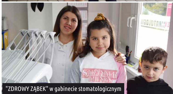
"ZDROWY ZĄBEK" w gabinecie stomatologicznym