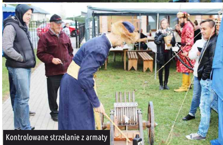
Kontrolowane strzelanie z armaty