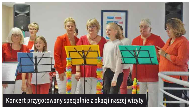
Koncert przygotowany specjalnie z okazji naszej wizyty