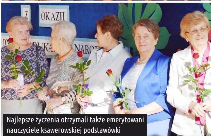
Najlepsze życzenia otrzymali także emerytowani nauczyciele ksawerowskiej podstawówki