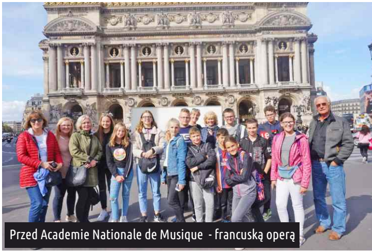
Przed Academie Nationale de Musique - francuską operą

Trzeciego dnia uczestnicy wyjazdu spędzili czas z francuskimi rodzinami, które gościły naszych zdolnych uczniów. Niektórzy wybrali się na spacer do okolicznego zamku Chateau de Chantilly, inni do kręgielni, a jeszcze inni postanowili ulepić polskie pierogi dla swoich gospodarzy.