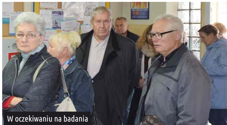
W oczekiwaniu na badania