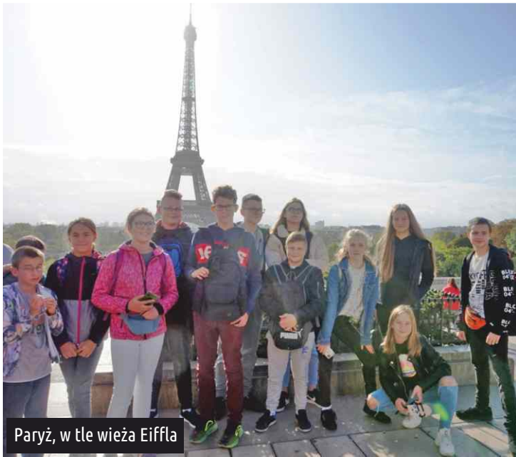
Paryż, w tle wieża Eiffla

Następnie uczniowie wraz z opiekunami wyruszyli autobusem (z placu Concorde) w dalszą podróż po deszczowym Paryżu (podziwiając m.in. gmach Opery Narodowej).