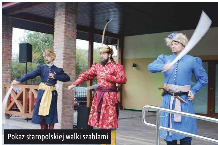
Pokaz staropolskiej walki szablami

W sobotę 5 października odbył się "Piknik historyczno-integracyjny w Nowej Gadce", który zorganizowany został przez Gminny Klub Polskiej Sztuki Walki Signum Polonicum w Ksawerowie dzięki pozyskanym środkom zewnętrznym. Zadanie zrealizowane zostało w ramach Lokalnej Strategii Rozwoju wdrażanej przez Lokalną Grupę Działania "BUD-UJ RAZEM".