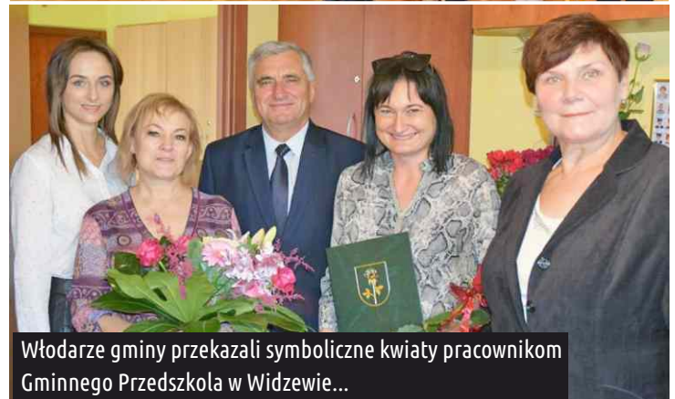
Włodarze gminy przekazali symboliczne kwiaty pracownikom Gminnego Przedszkola w Widzewie...