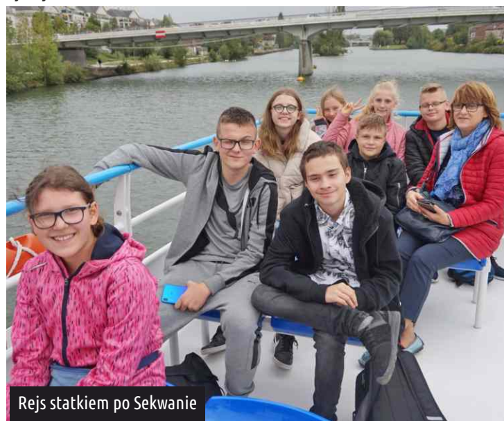
Rejs statkiem po Sekwanie

Jeszcze tego samego dnia uczniowie wraz z opiekunami zwiedzili szkołę w Breuil le Sec, zamek w Compiègne oraz las Compiègne, w którym został podpisany rozejm kończący I wojnę światową. Ostatnią atrakcją w tym dniu był rejs statkiem.