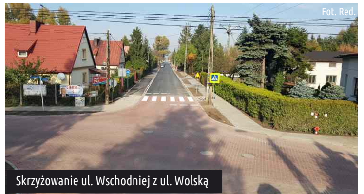
Skrzyżowanie ul. Wschodniej z ul. Wolską