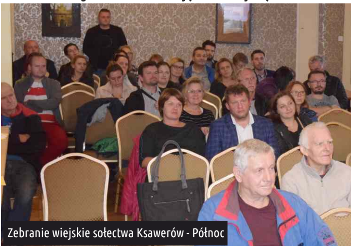
Zebranie wiejskie sołectwa Ksawerów - Północ