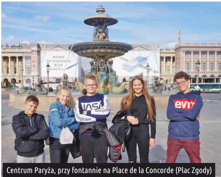
Centrum Paryża, przy fontannie na Place de la Concorde (Plac Zgody)