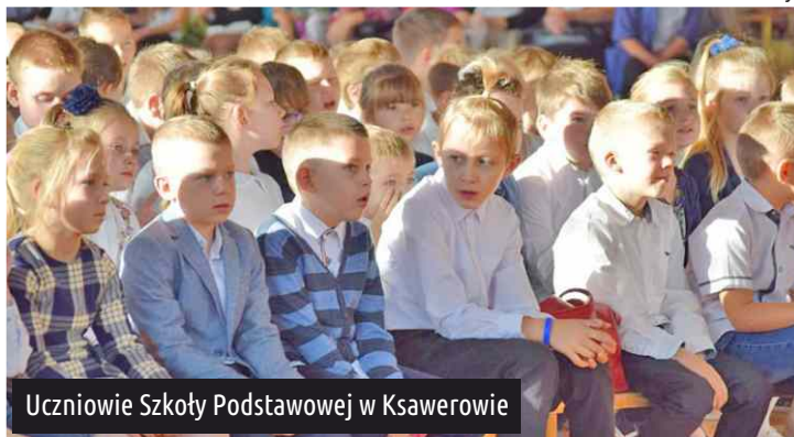
Uczniowie Szkoły Podstawowej w Ksawerowie