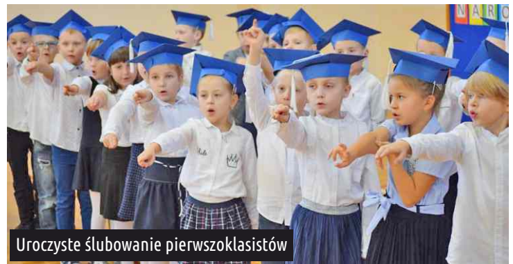
Uroczyste ślubowanie pierwszoklasistów

Tegoroczny Dzień Edukacji Narodowej był wyjątkowy również dla pierwszoklasistów, którzy podczas uroczystej akademii w Szkole Podstawowej im. Igora Sikiryckiego w Woli Zaradzyńskiej zostali pasowani na uczniów. Po akcie ślubowania zostali oficjalnie przyjęci do społeczności swojej szkoły, prezentując dumnie własne legitymacje szkolne. Redakcja