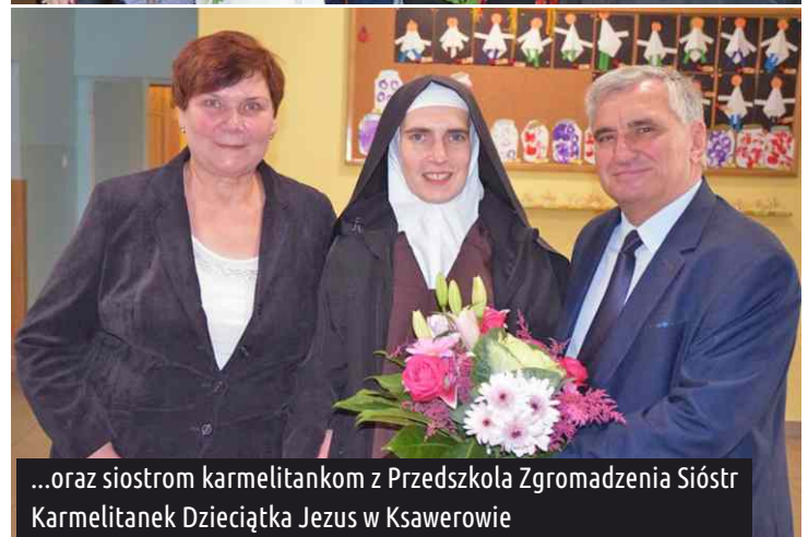
...oraz siostrami karmelitanek z Przedszkola Zgromadzenia Sióstr Karmelitanek Dzieciątka Jezus w Ksawerowie