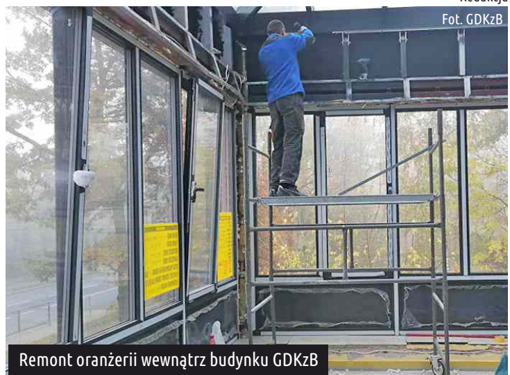
Remont oranżerii wewnątrz budynku GDKzB