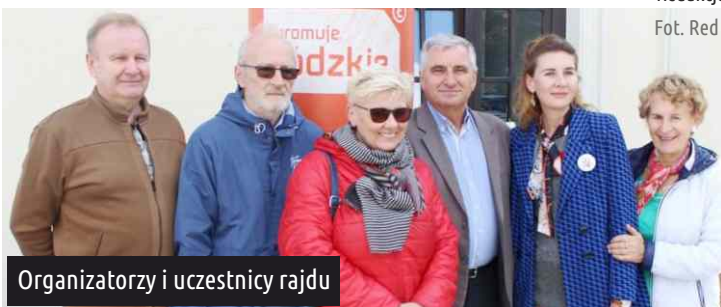
Organizatorzy i uczestnicy rajdu