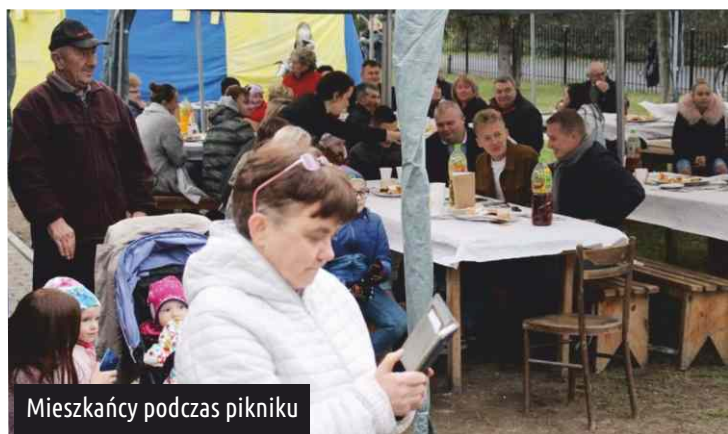
Mieszkańcy podczas pikniku

Sympatycy tradycji oręża polskiego, którzy byli ubrani w przepiękne staropolskie żupany, broń i oporządzenie historyczne, pokazali zebrany ćwiczenia oraz walkę szablami. Pokaz rzemiosła tkackiego zaprezentowała Łódzka Grupa Kreatywna (w ramach umowy z LGD). Mieszkańcy gminy mogli poznać także techniki ręcznego tkania, poprzez naukę najprostszyc splotów tkackich. W części wokalne programu, swoje umiejętności zaprezentowali członkowie studia piosenki GDKZB w Ksawerowie. Dla wszystkich przygotowano przekąski - grillowane kietbaski oraz słodką watę cukrową i popcorn.