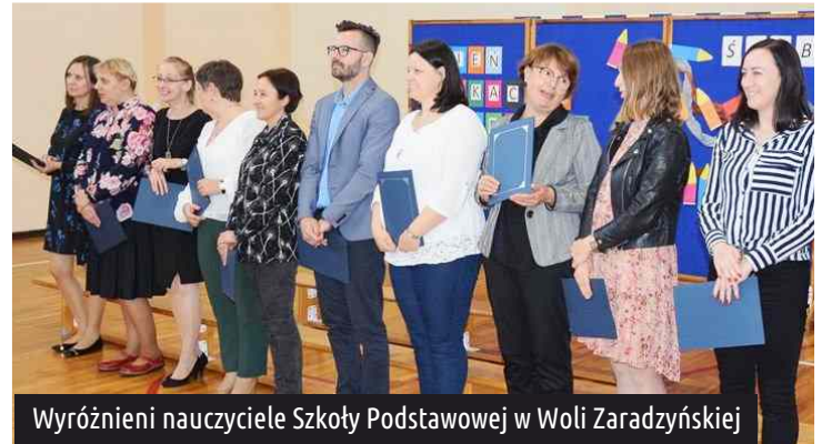
Wyróżnieni nauczyciele Szkoły Podstawowej w Woli Zaradzyńskiej