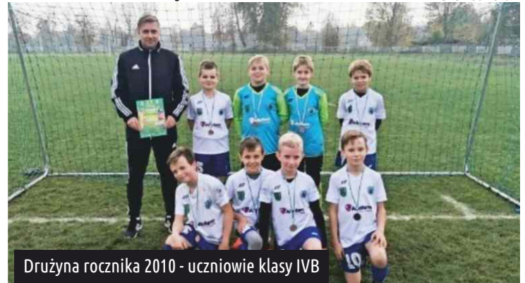
Drużyna rocznika 2010 - uczniowie klasy IVB