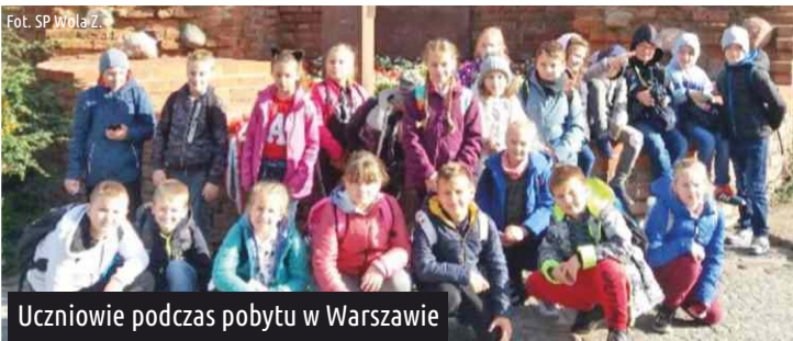
Uczniowie podczas pobytu w Warszawie