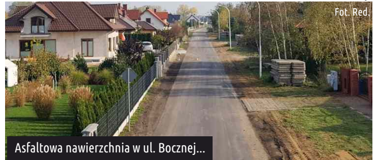
Asfaltowa nawierzchnia w ul. Bocznej...