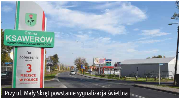
Przy ul. Mały Skręt powstanie sygnalizacja świetlna