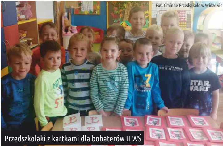
Przedszkolaki z kartkami dla bohaterów II WŚ