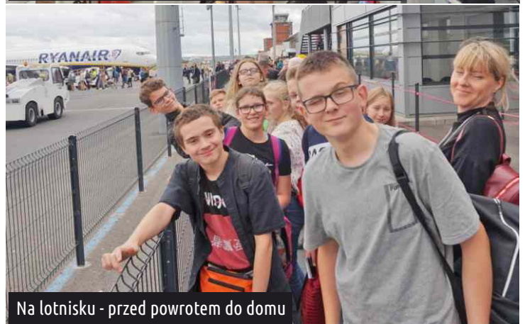
Na lotnisku - przed powrotem do domu