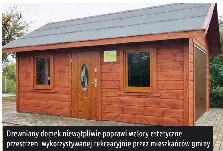
Drewniany domek niewątpliwie poprawi walory estetyczne przestrzeni wykorzystywanej rekreacyjnie przez mieszkańców gminy