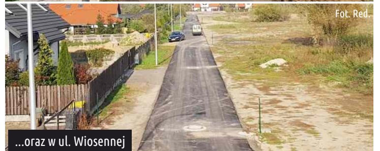
...oraz w ul. Wiosennej