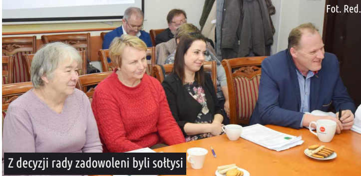
Z decyzji rady zadowoleni byli sőtyszi