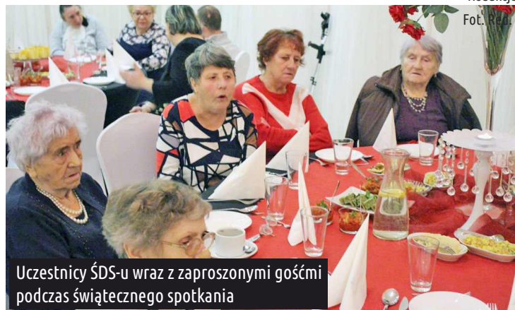
Uczestnicy ŚDS-u wraz z zaproszonymi gośćmi podczas świątecznego spotkania