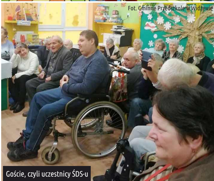
Goście, czyli uczestnicy ŚDS-u