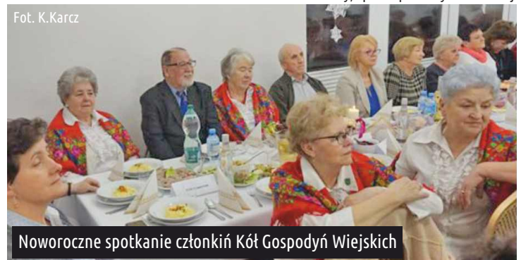
Noworoczne spotkanie członkiń Kół Gospodyń Wiejskich