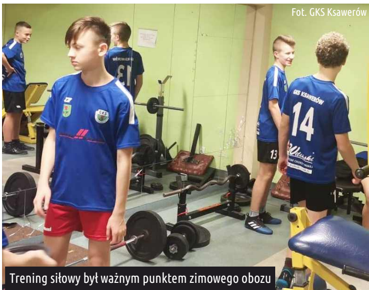
Trening siłowy był ważnym punktem zimowego obozu

Zaraz po powrocie piłkarze wrócili do treningów na boisku. Drużyna rozegrała dwa sparingi, pierwszy w Łodzi z drużyną MULKS Łask wygrywając 6:2, drugi w Aleksandrowie z miejscowym Sokotem remisując po wyrównanym meczu 2:2. Piłkarze niebawem rozegrają kolejne mecze kontrolne (m.in. z Talentem Warszawa oraz kilkoma łódzkimi drużynami). Runda wiosenna grupy C1 Trampkarz rozpoczyna się już 21 marca meczem w Łodzi z drużyną SP Widzew. Zapraszamy do kibicowania!