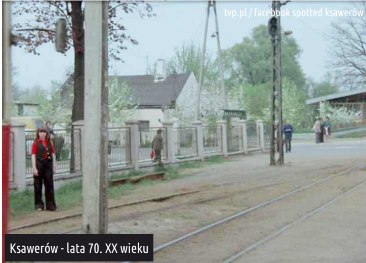
Ksawerów - lata 70. XX wieku

Poniższy kadr pochodzi z obyczajowego serialu telewizyjnego "Daleko od szosy" w reż. Zbigniewa Chmielewskiego., którego akcja rozgrywa się m.in. w Ksawerowie.