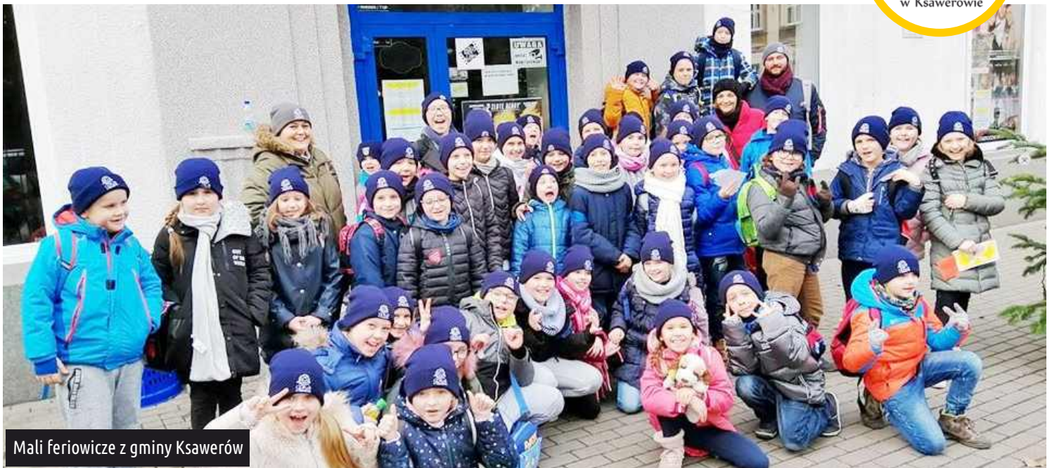
Mali feriwicze z gminy Ksawerów

Jak co roku Gminny Dom Kultury z Biblioteką w Ksawerowie przygotował dla naszych najmłodszych mieszkańców pełen atrakcji zimowy wypoczynek. Zajęcia trwały od 13 do 17 stycznia.