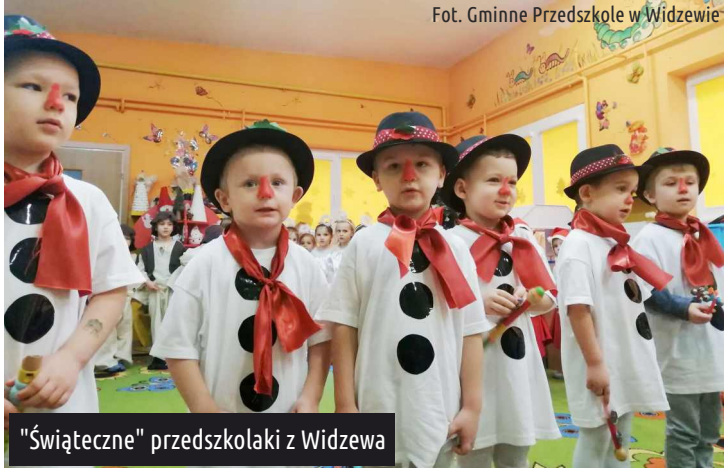
"Świąteczne" przedszkolaki z Widzewa