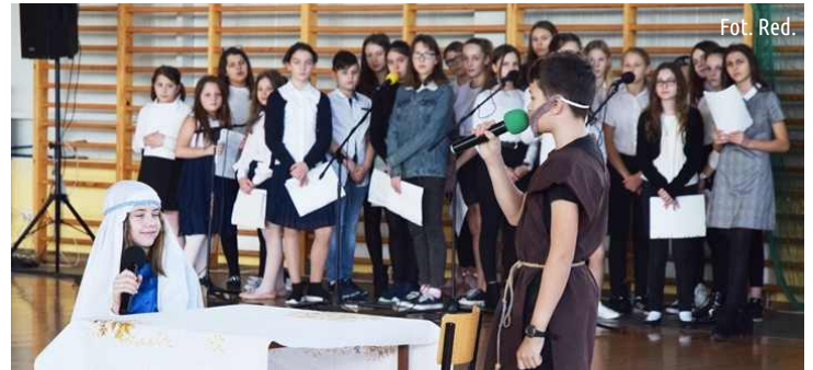
Bożonarodzeniowa inscenizacja w Szkole Podstawowej w Ksawerowie...