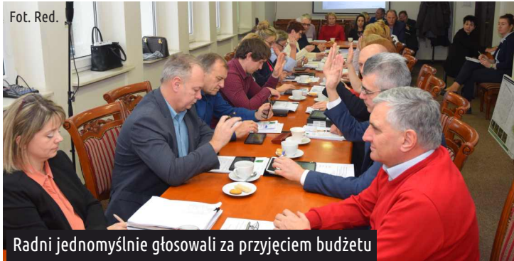
Radni jednogłośnie głosowali za przyjęciem budżetu