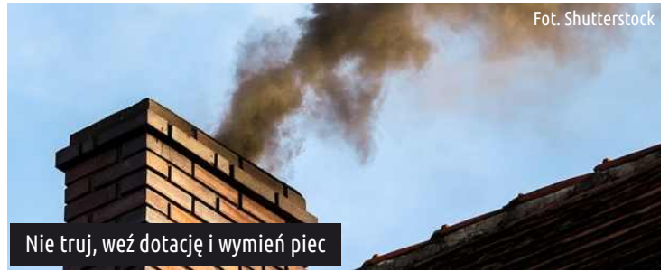
Nie truj, weź dotację i wymień piec

Wnioski wraz z załącznikami o udzielenie dotacji można pobierać ze strony internetowej Urzędu Gminy Ksawerów www.gmina.ksawerow.com , oraz w Referacie Gospodarki Przestrzennej, Nieruchomościami, Rolnictwa i Ochrony Środowiska (III p. Urzędu Gminy Ksawerów, ul. Kościuszki 3h).