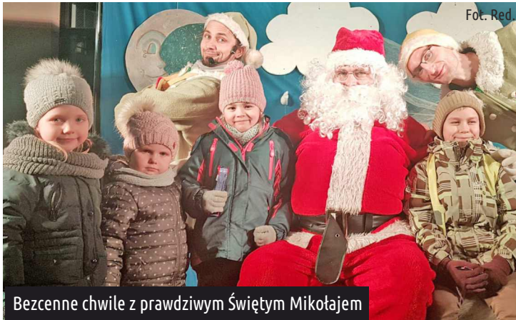
Bezczenne chwile z prawdziwym Świętym Mikołajem