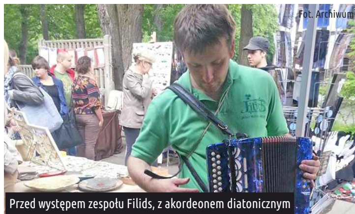
Przed występem zespołu Filids, z akordeonem diatonicznym

Mocno, to akordeon diatoniczny, wydający inne dźwięki przy rozciąganiu miecha, a inne przy ściąganiu. To jest taki sam system jak w harmonijce ustnej. Jest to instrument mały, guzikowy, ma tylko 23 guziki. Musiałem się na nim uczyć grać od nowa. Ale chciałem na nim grać, bo rzeczywiście bardzo lubię muzykę irlandzką.