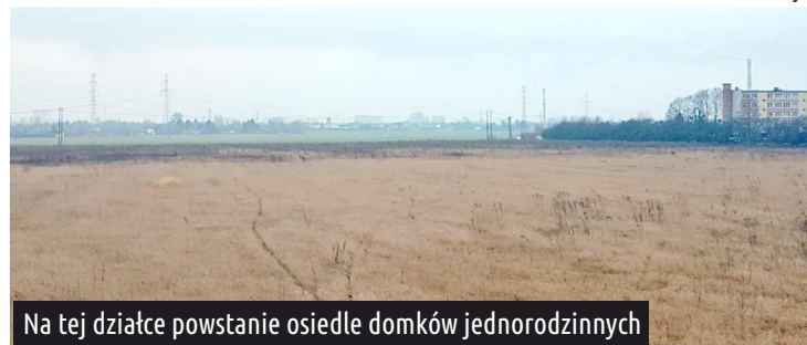
Na tej działce powstanie osiedle domków jednorodzinnych