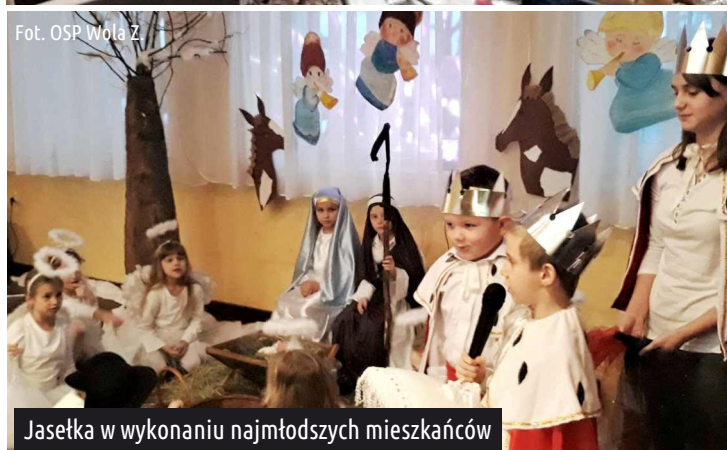
Jasełka w wykonaniu najmłodszych mieszkańców