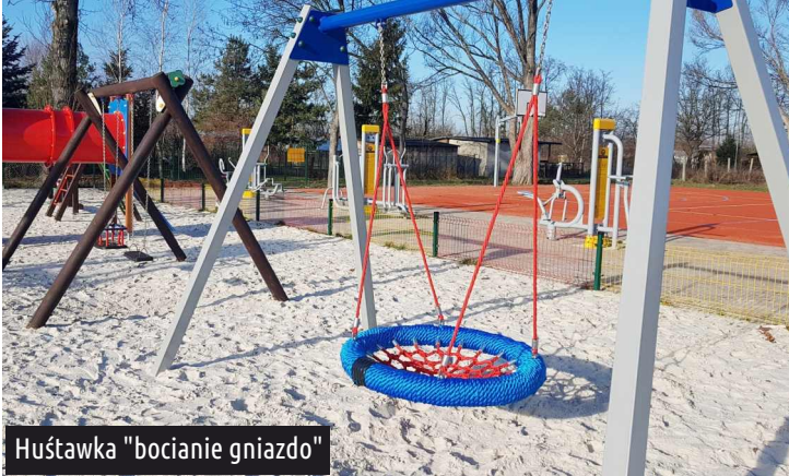
Huśtawka "bocianie gniazdo"