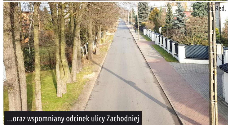
...oraz wspomniany odcinek ulicy Zachodniej