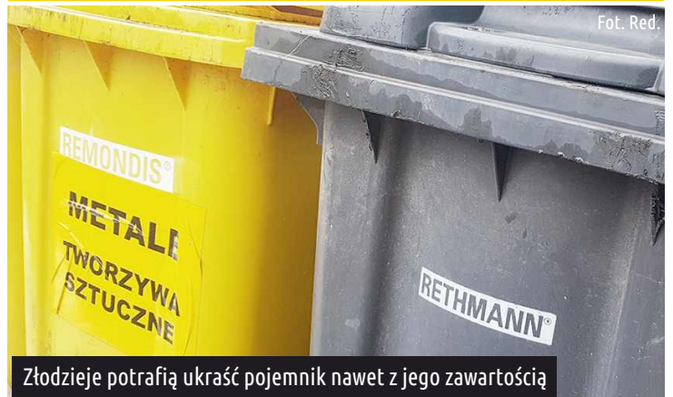
Złodzieje potrafią ukraść pojemnik nawet z jego zawartością

W związku z tym, że nie wszystkie gminy zapewniają mieszkańcom pojemniki na śmieci (w przeciwieństwie do gminy Ksawerów), a zmiana przepisów o gospodarce odpadami wymusza na właścicielach nieruchomości segregację odpadów, z nieruchomości położonych na terenie naszej gminy zaczęły znikać pojemniki na odpady.