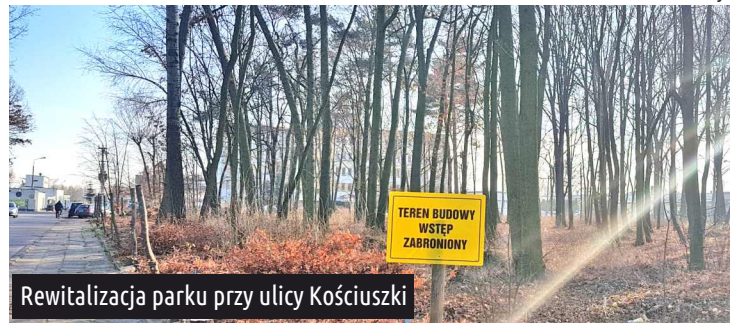
Rewitalizacja parku przy ulicy Kościuszki