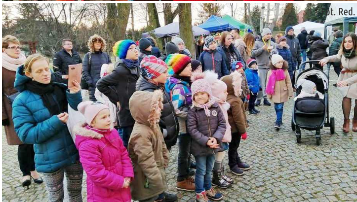
Mieszkańcy podczas Jarmarku