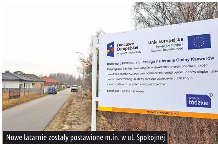
Nowe latarnie zostały postawione m.in. w ul. Spokojnej