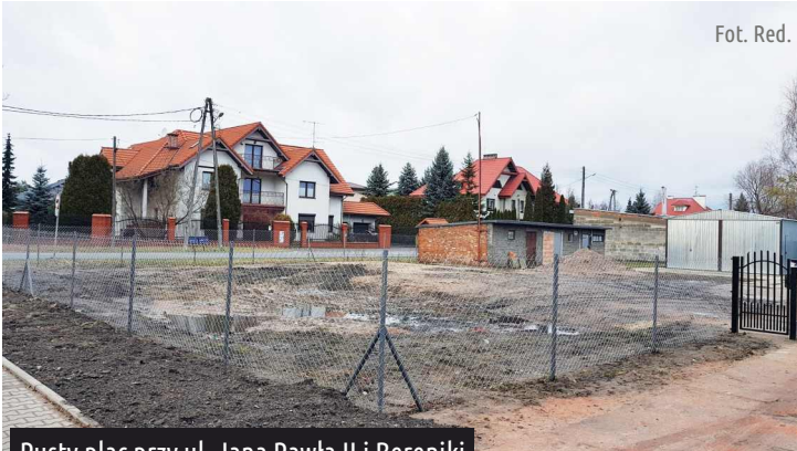
Pusty plac przy ul. Jana Pawła II i Bereniki