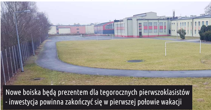
Nowe boiska będą prezentem dla tegorocznych pierwszoklasistów - inwestycja powinna zakończyć się w pierwszej połowie wakacji