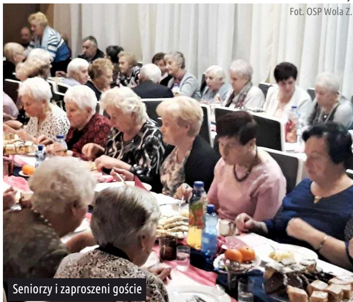
Seniorzy i zaproszeni goście