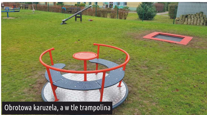
Obrotowa karuzela, a w tle trampolina