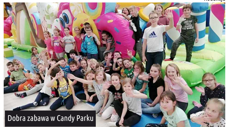
Dobra zabawa w Candy Parku