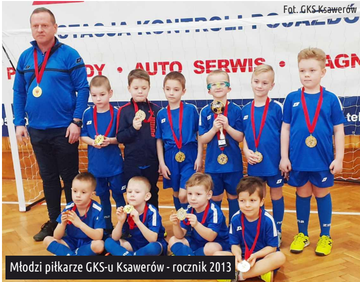
Młodzi piłkarze GKS-u Ksawerów - rocznik 2013

W zawodach udział wzięło 8 drużyn: AKS SMS Łódź, Teofilek, Zjednoczeni Stryków, Progres Konstancynów, GKS Ksawerów, AKS Łódź Południe, RAP Radomsko oraz Łęczyca. Wspólne rozgrywki były dla dzieci świetną zabawą z mnóstwem pozytywnych emocji. Był to pierwszy, "poważny" turniej piłkarski tej grupy rocznikowej. Rodzice i opiekunowie również dobrze się bawili, kibicując głośno swoim pociechom.