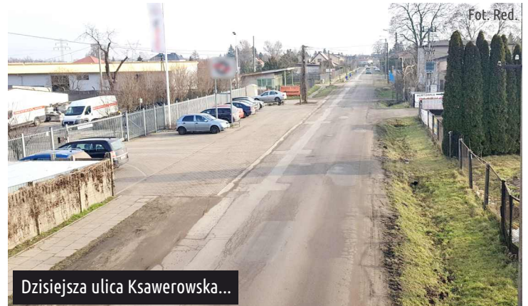
Dzisiejsza ulica Ksawerowska...