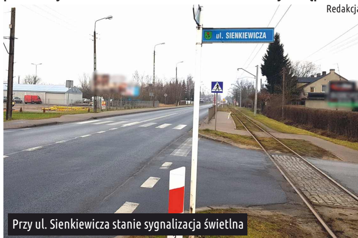
Przy ul. Sienkiewicza stanie sygnalizacja świetlna