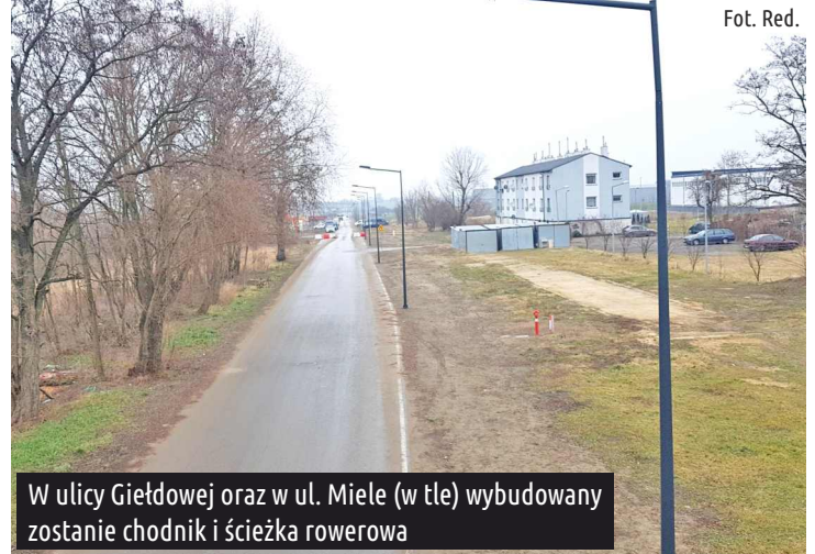
W ulicy Giełdowej oraz w ul. Miele (w tle) wybudowany zostanie chodnik i ścieżka rowerowa