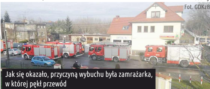
Jak się okazało, przyczyną wybuchu była zamrażarka, w której pękł przewód