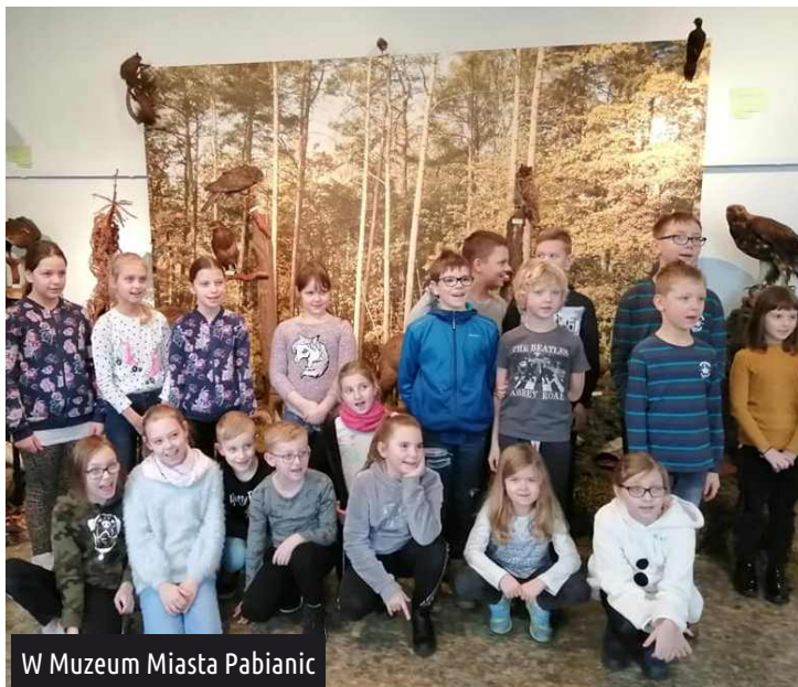
W Muzeum Miasta Pabianic

Było to pięć bardzo aktywnych dni, w trakcie których nie było czasu na nudę. Podczas pierwszego tygodnia ferii, kreatywnego i pełnego ciekawych zajęć, dzieci zwiedziły Muzeum Miasta Pabianic, uczestniczyły w niezwykłych warsztatach ("Wycinanka Sieradzka" - niby wycinanka, a sprawa wcale nie taka prosta - zabawa na całego, oraz "Od ziarenka do bochenka" - etnograficzny warsztat pokazał jak trudny i ciekawy jest proces wypieku chleba na przelocie wieków), zaliczyły seans w kinie Tomi i spędziły miłe przedpołudnie w Teatrze Lalek Arlekin (oglądając spektakl "Jacek i Placek"). W trakcie trzeciego dnia zimowego wypoczynku jego uczestnicy odwiedzili Muzeum Włókiennictwa w Łodzi. To był pracowity i warsztatowy dzień. Dzieci uczestniczyły w takich warsztatach jak: zwierzo-zwierz, portret anatomiczny, łódzkie legendy oraz od włóczki do kłębka.