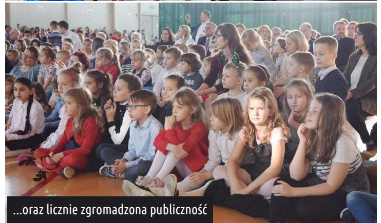
...oraz licznie zgromadzona publiczność