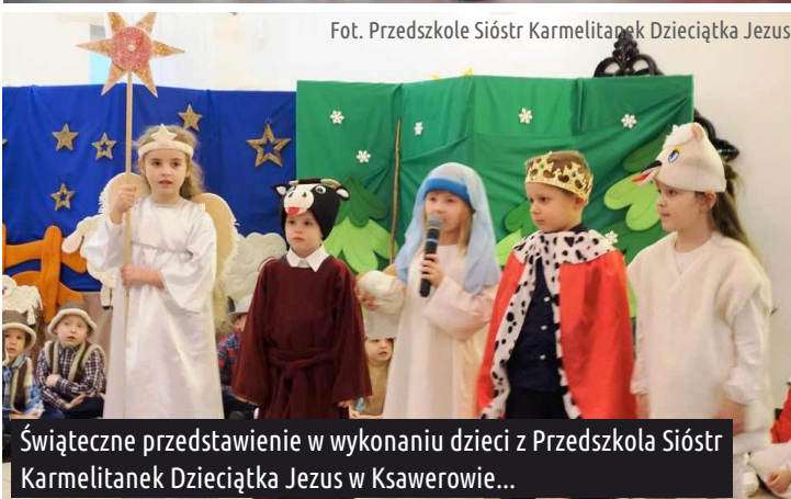
Świąteczne przedstawienie w wykonaniu dzieci z Przedszkola Sióstr Karmelitanek Dzieciątka Jezus w Ksawerowie...