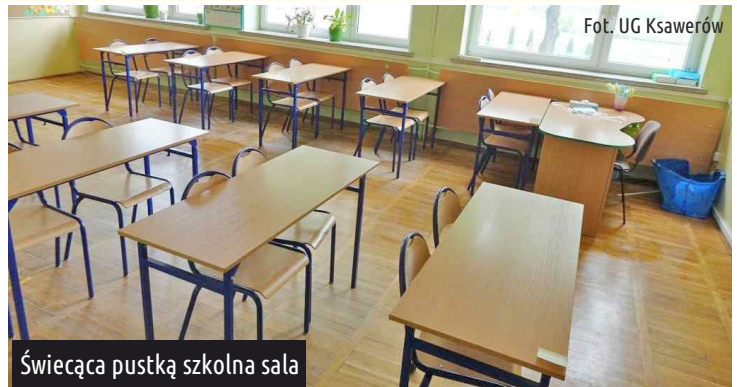
Świeżą pustką szkolna sala