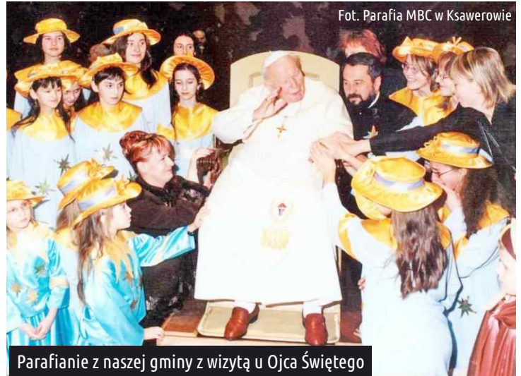
Parafianie z naszej gminy z wizytą u Ojca Świętego