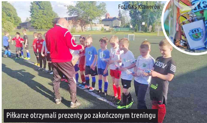
Piłkarze otrzymali prezenty po zakończonym treningu