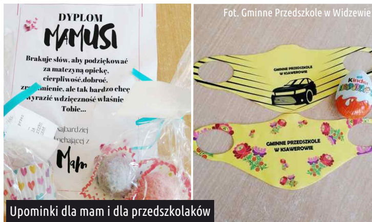
Upominki dla mam i dla przedszkolaków