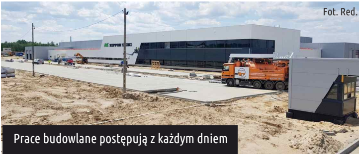
Prace budowlane postępują z każdym dniem