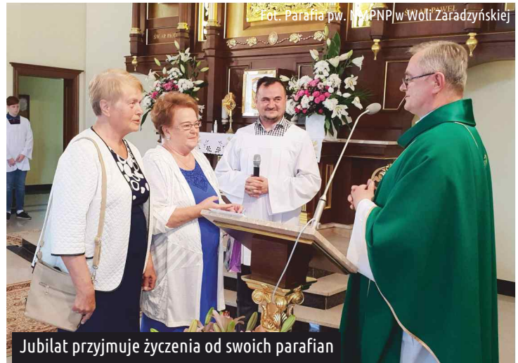
Jubilat przyjmuje życzenia od swoich parafian