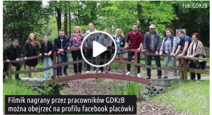
Filmik nagrany przez pracowników GDKzB można obejrzeć na profilu facebook placówki

W związku z panującą pandemią, integralną częścią akcji (zapoczątkował ją Solar - Karol Poziemski, polski raper) staje się zbiórka charytatywna - Beef z koronawirusem #hot16challenge - organizowana wraz z fundacją Siepomaga.pl.