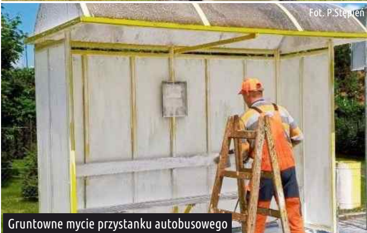
Gruntowne mycie przystanku autobusowego