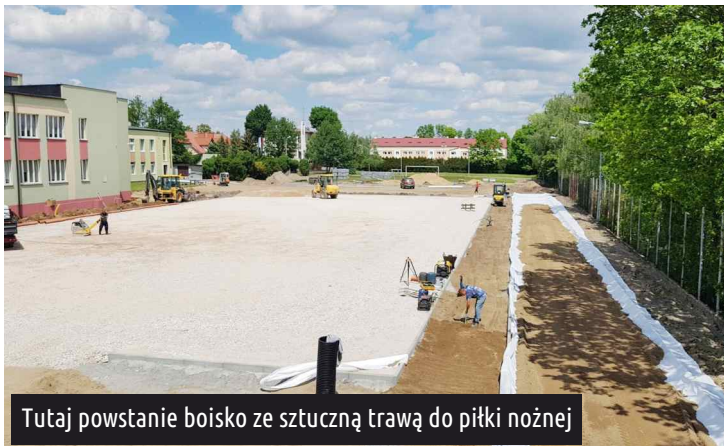
Tutaj powstanie boisko ze sztuczną trawą do piłki nożnej

Planowany termin zakończenia prac to połowa lipca tego roku. Redakcja