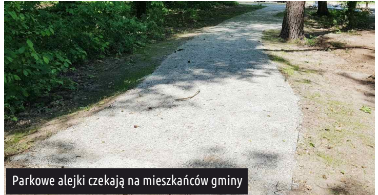
Parkowe alejki czekają na mieszkańców gminy

Mieszkańcy mogą już spacerować po nowych alejkach, wypoczywając w okolicznościach otaczającej park przyrody. W drugim etapie prac, który zaplanowany został na przyszły rok, powstanie m.in. strefa zabaw dla dzieci i ścieżka zdrowia dla dorosłych). Redakcja