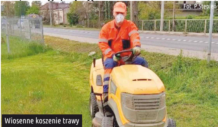
Wiosenne koszenie trawy