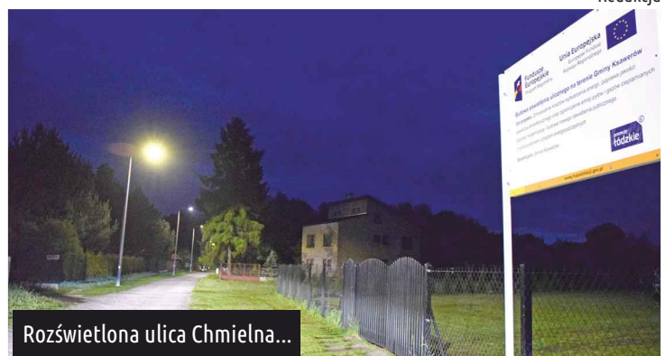
Rozświetlona ulica Chmielna...

Wszystkie lampy ujęte w tym projekcie już świecą. Redakcja