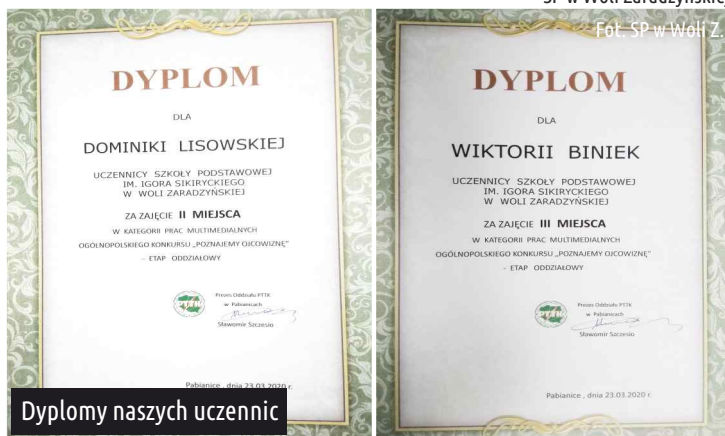
Dyplomy naszych uczennic