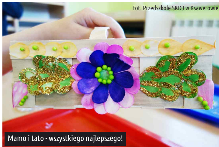
Mamo i tato - wszystkiego najlepszego!