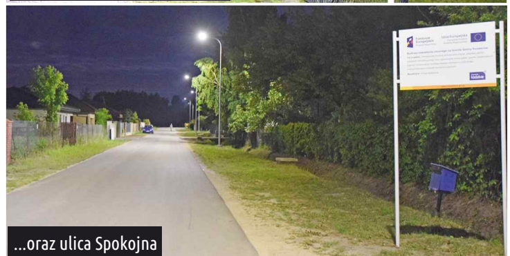
...oraz ulica Spokojna