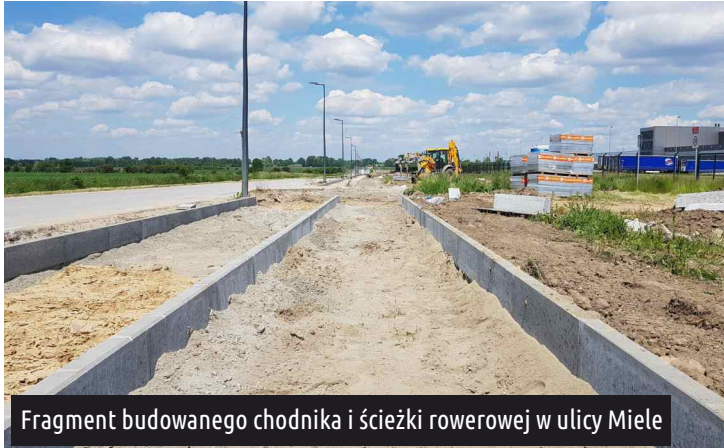
Fragment budowanego chodnika i ścieżki rowerowej w ulicy Miele

Inwestycja powinna zostać skończona w drugiej połowie czerwca br. Redakcja