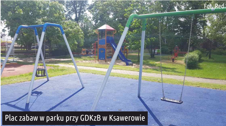
Plac zabaw w parku przy GDKzB w Ksawerowie