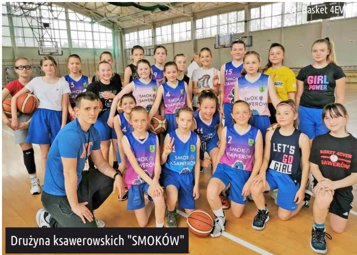
Drużyna ksawerowskich "SMOKÓW"