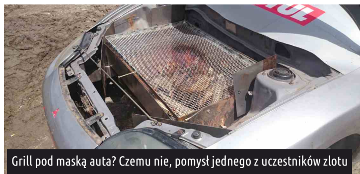
Grill pod maską auta? Czemu nie, pomysł jednego z uczestników zlotu