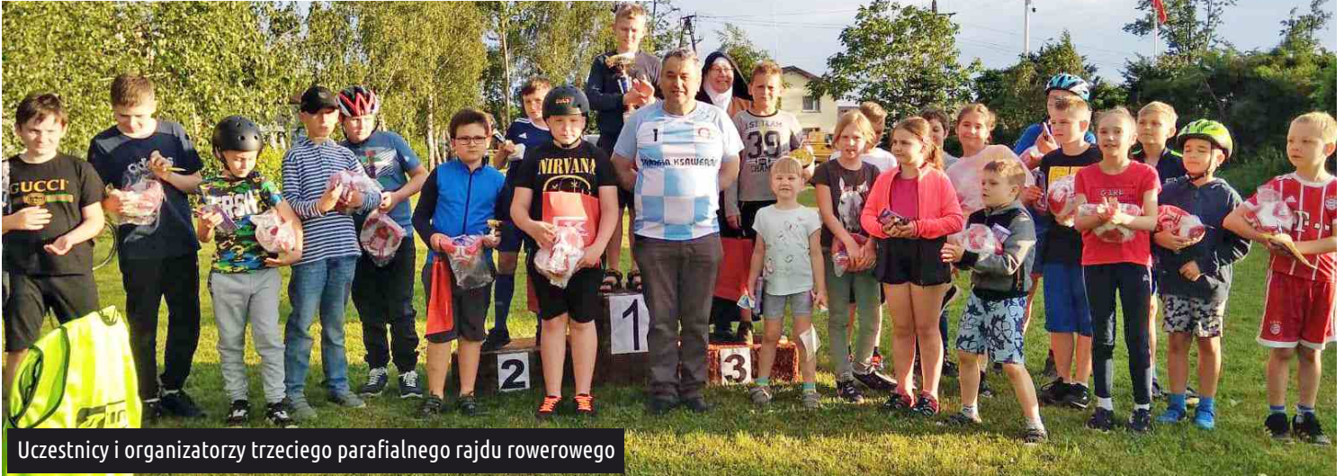
Uczestnicy i organizatorzy trzeciego parafialnego rajdu rowerowego

We wtorek 23 czerwca punktualnie o godzinie 19.00 rozpoczął się trzeci parafialny wyścig rowerowy, zorganizowany przez Parafię Matki Boskiej Częstochowskiej w Ksawerowie.