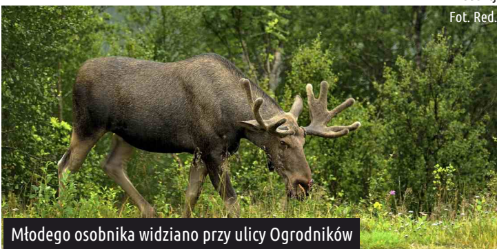
Młodego osobnika widziano przy ulicy Ogrodników