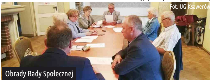
Obrady Rady Społecznej