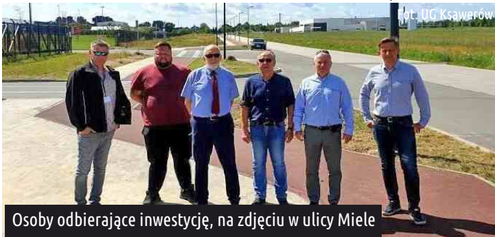
Osoby odbierające inwestycję, na zdjęciu w ulicy Miele