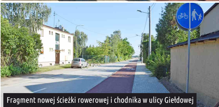
Fragment nowej ścieżki rowerowej i chodnika w ulicy Giełdowej