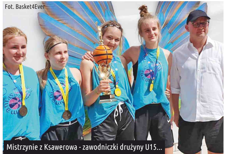
Mistrzyni z Ksawerowa - zawodniczki drużyny U15...