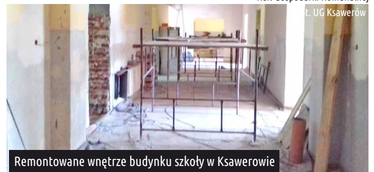
Remontowane wewnątrz budynku szkoły w Ksawerowie