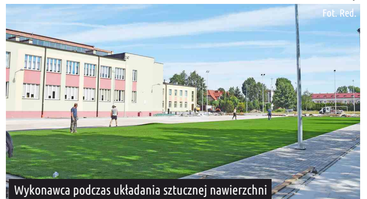
Wykonawca podczas układania sztucznej nawierzchni