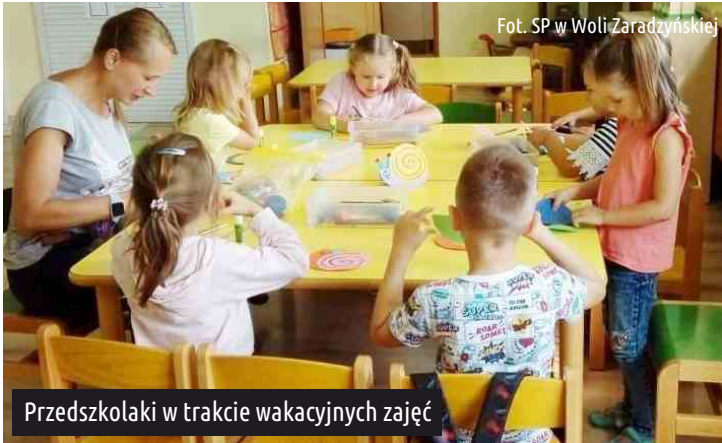
Przedszkolaki w trakcie wakacyjnych zajęć