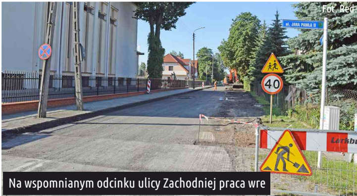
Na wspomnianym odcinku ulicy Zachodniej praca w re