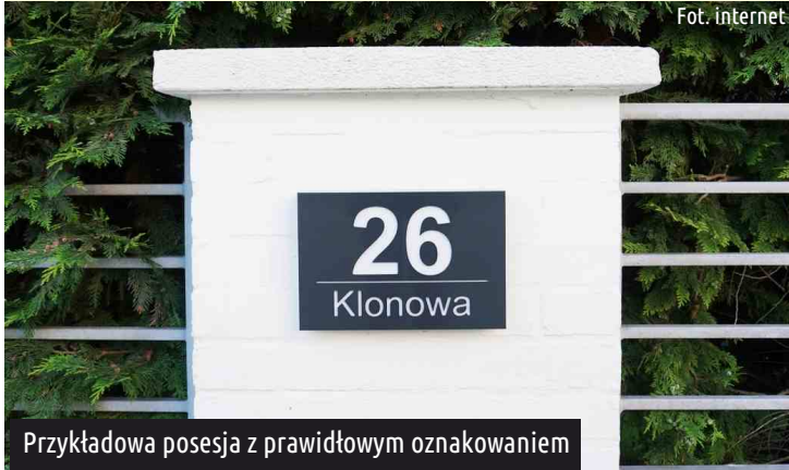
Przykładowa posesja z prawidłowym oznakowaniem

Urząd Gminy w Ksawerowie zwraca się z apelem o prawidłowe i widoczne oznakowanie budynków, polegające na umieszczeniu w widocznym miejscu na ścianie frontowej budynku tabliczki z numerem porządkowym oraz nazwą ulicy.