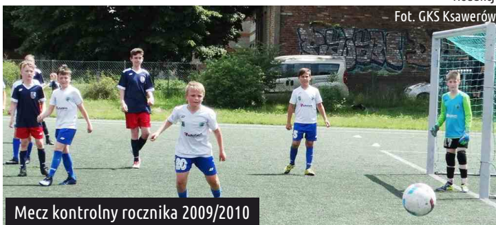
Mecz kontrolny rocznika 2009/2010

Zapraszamy na treningi piłkarskie chętnych chłopców z rocznika 2009/2010. Wszelkich informacji dotyczących zapisów udziela trener Radostaw Znojek pod nr. tel.: 668 385 396