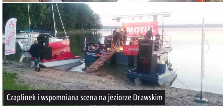
Czaplinek i wspomniana scena na jeziorze Drawskim