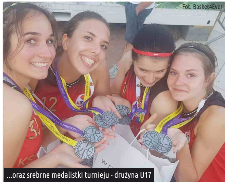
...oraz srebrne medalistki turnieju - drużyna U17