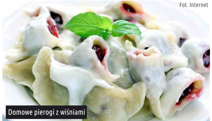
Domowe pierogi z wiśniami