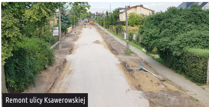
Remont ulicy Ksawerowskiej