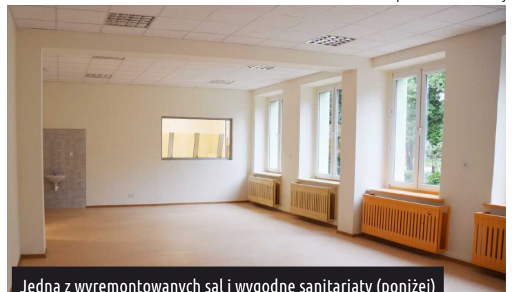
Jedna z wyremontowanych sal i wygodne sanitariaty (poniżej)