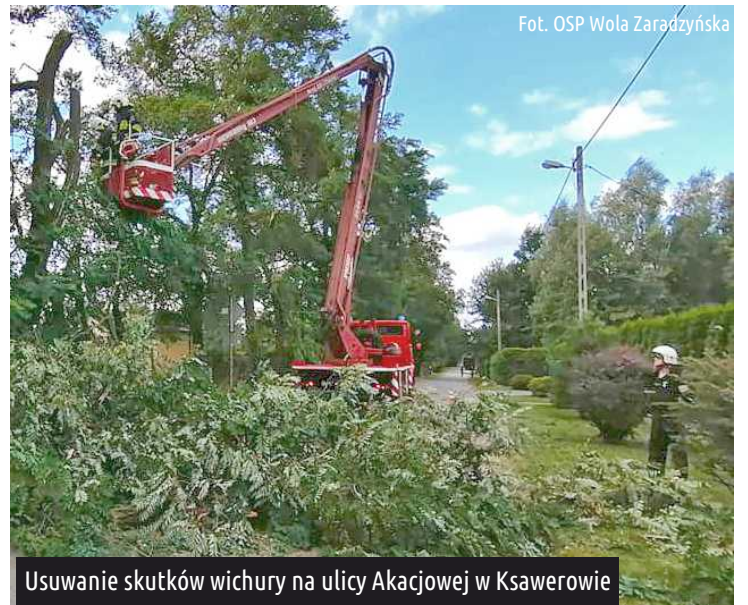
Usuwanie skutków wichury na ulicy Akacyjowej w Ksawerowie