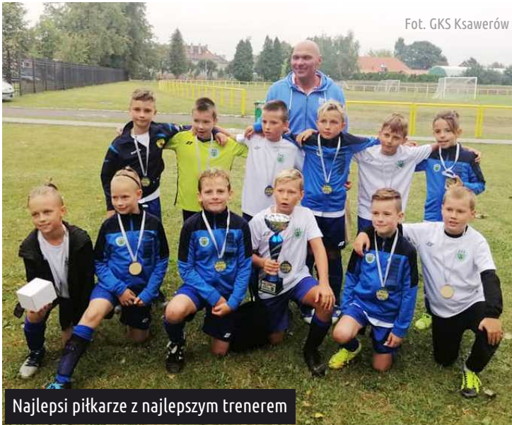
Najlepsi piłkarze z najlepszym trenerem