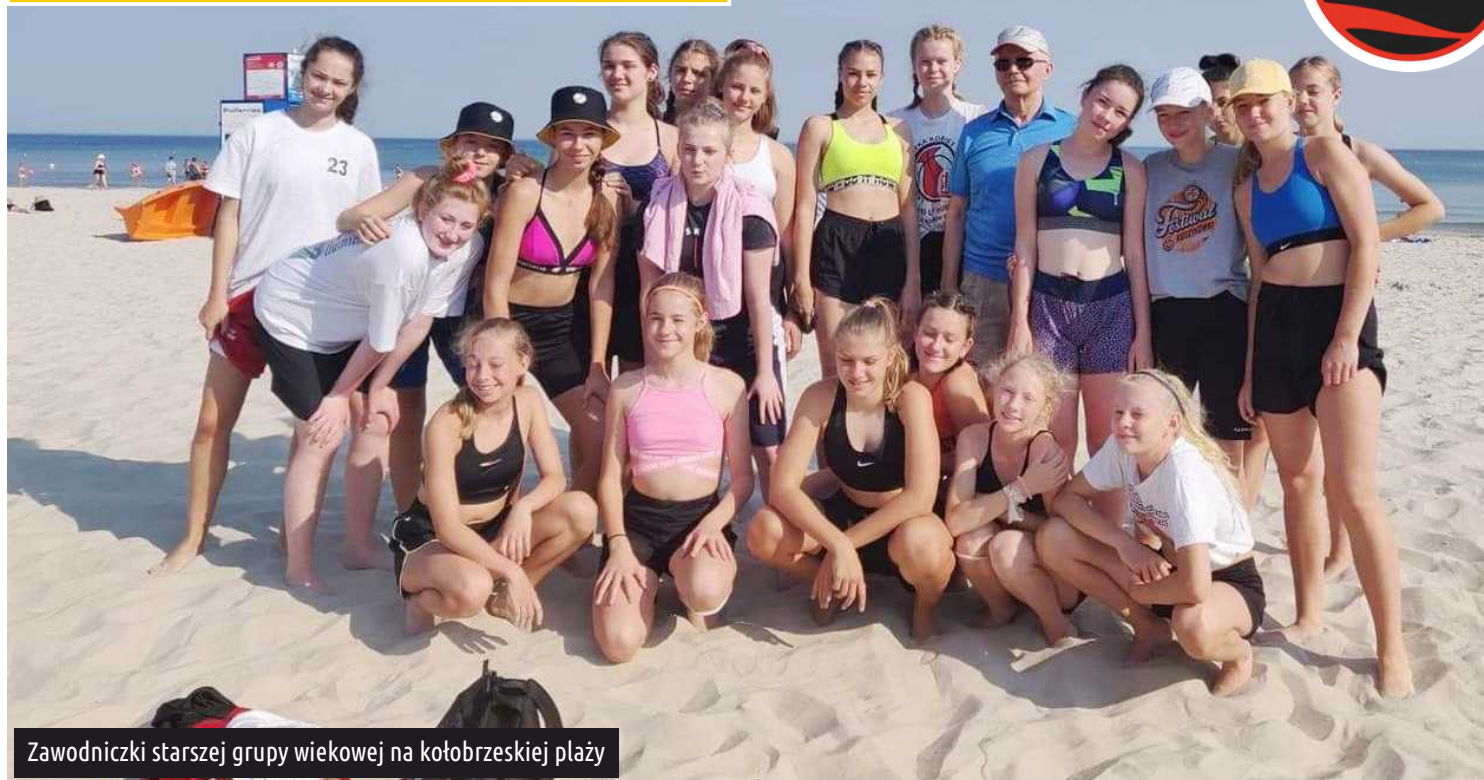
Zawodniczki starszej grupy wiekowej na kołobrzesckiej plaży