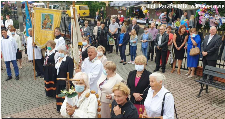
Parafianie i uczestnicy nabożeństwa odpustowego