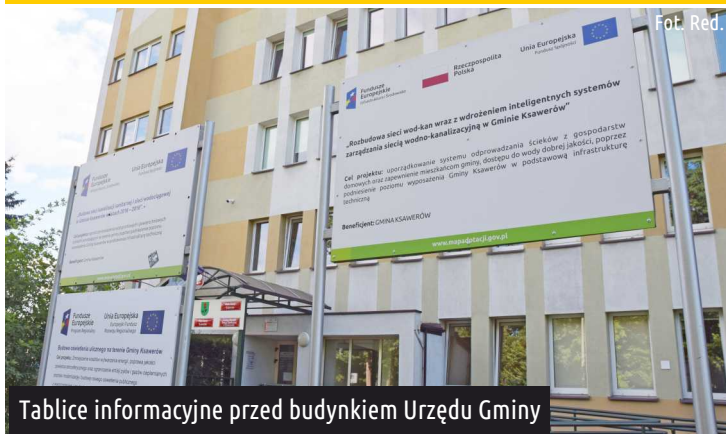
Tablice informacyjne przed budynkiem Urzędu Gminy

W najnowszym rankingu inwestycji unijnych opublikowanym przez Serwis Samorządowy PAP (na podstawie danych GUS) gmina Ksawerów znajduje się na wysokim 422 miejscu z 2477 wszystkich gmin w kraju.