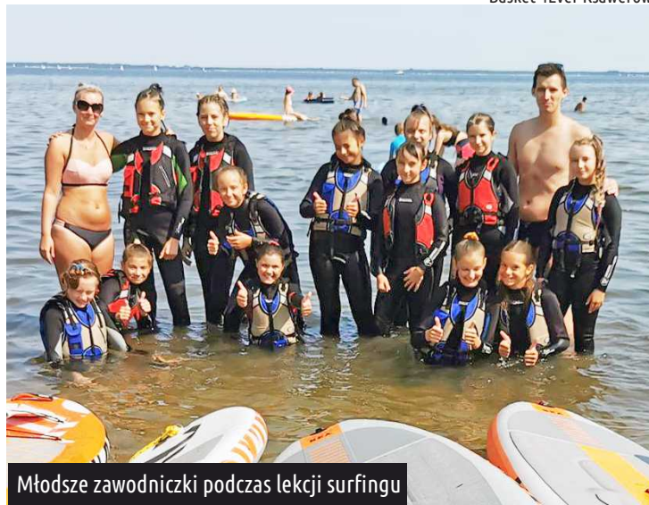
Młodsze zawodniczki podczas lekcji surfingu