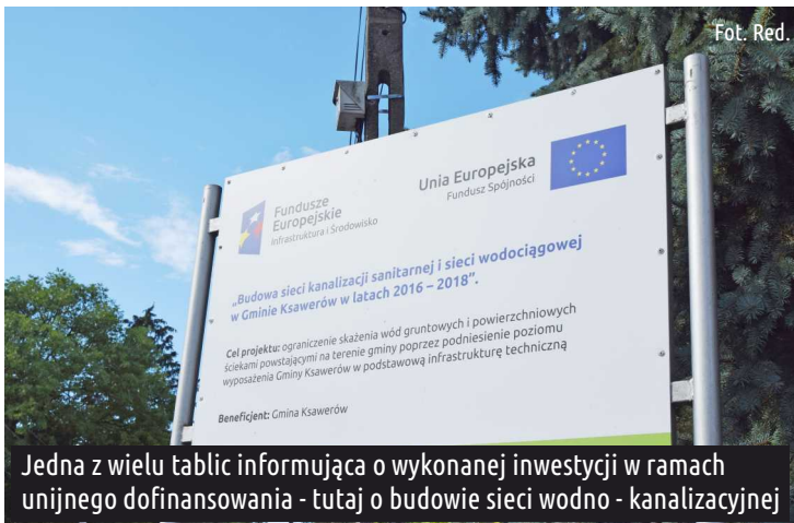
Jedna z wielu tablic informująca o wykonanej inwestycji w ramach unijnego dofinansowania - tutaj o budowie sieci wodno - kanalizacyjnej

Na tle pobliskich gmin nasz wynik również jest bardzo wysoki, np. Rzgów (gmina miejsko-wiejska) pozyskał środki w wysokości 49 262 973,65 zł, Tuszyń (gmina miejsko-wiejska) 29 213 246,34 zł, a Andrespol (gmina wiejska) 22 208 910,66 zł.