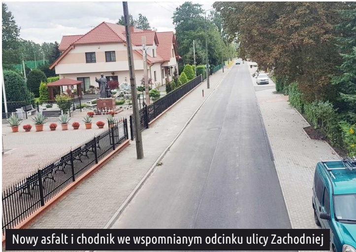
Nowy asfalt i chodnik we wspomnianym odcinku ulicy Zachodniej