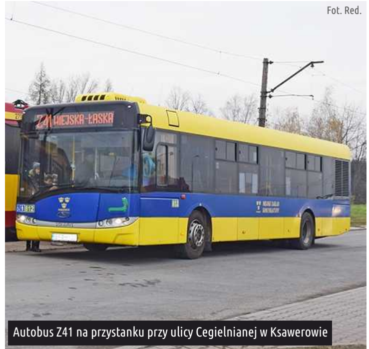
Autobus Z41 na przystanku przy ulicy Cegielnianej w Ksawerowie