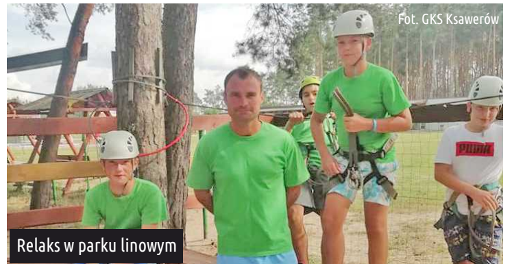
Relaks w parku linowym