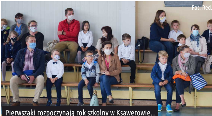
Pierwszaki rozpoczynają rok szkolny w Ksawerowie...