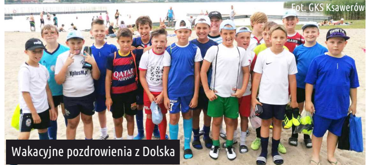
Wakacyjne pozdrowienia z Dolska