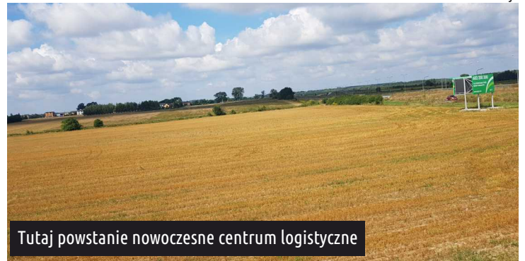
Tutaj powstanie nowoczesne centrum logistyczne