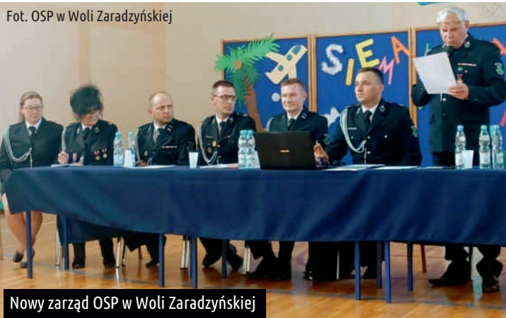
Nowy zarząd OSP w Woli Zaradzyńskiej

Dowiedz się więcej na... www.gmina.ksawerow.com