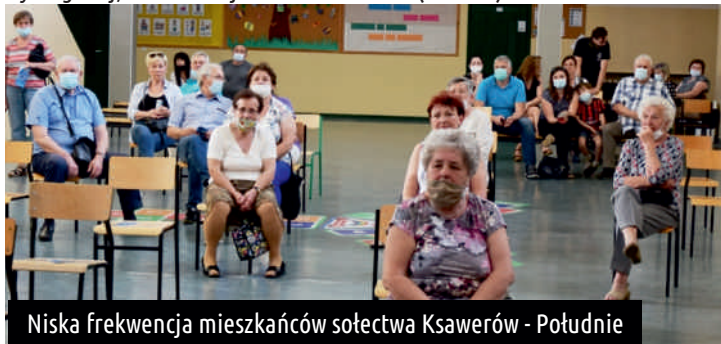
Niska frekwencja mieszkańców sołectwa Ksawerów - Południe