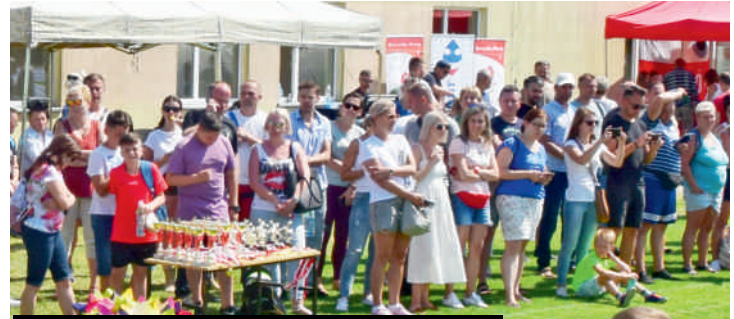
Tłumnie przybyli uczestnicy bawili się doskonale