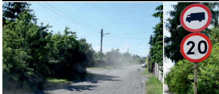
W ulicy obowiązuje zakaz wjazdu samochodów ciężarowych i ograniczenie prędkości do 20 km/h - o czym nie wszyscy pamiętają

Ulica Zaradzyńska należy do dwóch samorządów. W jednej części do gminy Ksawerów, w drugiej do miasta Pabianice. Stąd, na wykonanie ewentualnych inwestycji, muszą się zgodzić dwa samorzady. Niestety Pabianice nie chcą partycypować w remoncie ulicy, ignorując pisma wysyłane od 2007 r. przez radnych gminy Ksawerów. Projekt przebudowy naszej części ulicy został już dawno wykonany i przekazany miastu Pabianice. Uregulowaliśmy też prawa własności gruntów. Niestety, z ostatniej wypowiedzi wiceprezydenta miasta Pabianic Marka Gryglewskiego jednoznacznie wynika, że gmina Ksawerów sama powinna wykonać całą inwestycję.