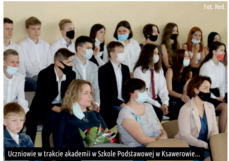
Uczniowie w trakcie akademii w Szkole Podstawowej w Ksawerowie...

Ref. Oświaty, Spraw Społecznych i Promocji