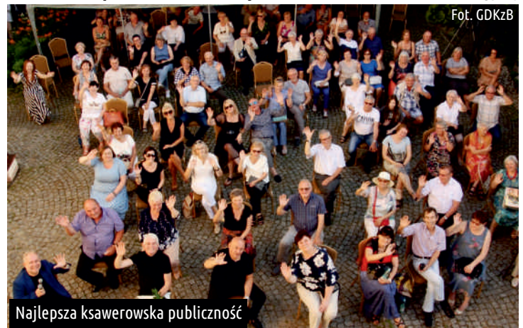
Najlepsza ksawerowska publiczność