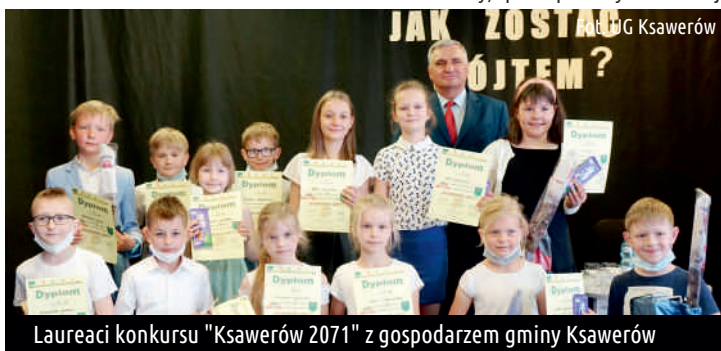
Laureaci konkursu "Ksawerów 2071" z gospodarzem gminy Ksawerów

Ref. Oświaty, Spraw Społecznych i Promocji