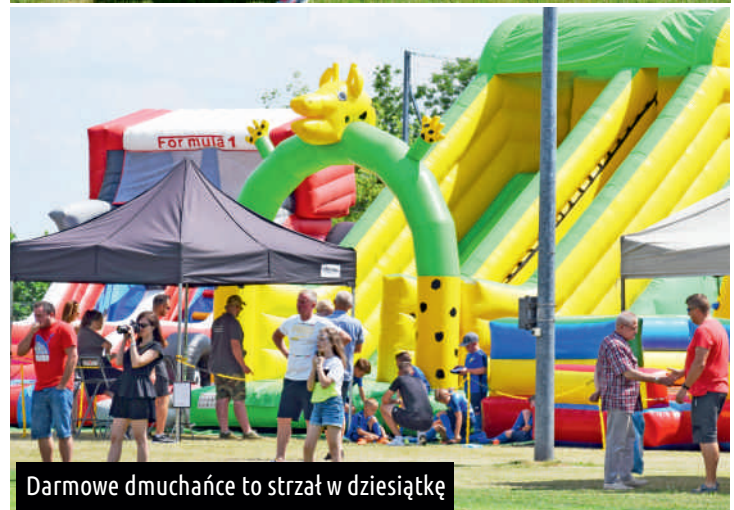
Darmowe dmuchańce to strzał w dziesiątkę