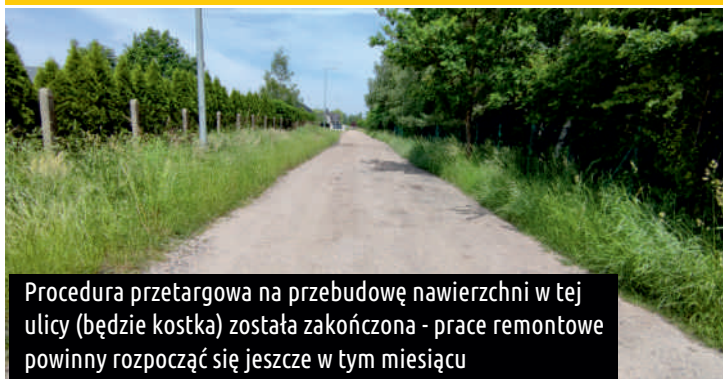
Procedura przetargowa na przebudowę nawierzchni w tej ulicy (będzie kostka) została zakończona - prace remontowe powinny rozpocząć się jeszcze w tym miesiącu