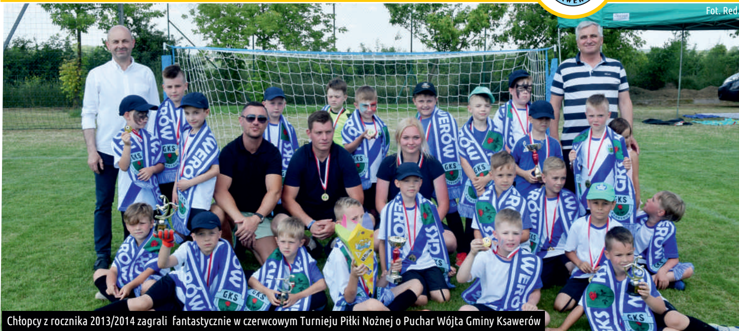
Chłopcy z rocznika 2013/2014 zagraли fantastycznie w czerwcowym Turnieju Piłki Nożnej o Puchar Wójta Gminy Ksawerów

W piłkarskich zawodach rozegranych w niedzielę 27 czerwca br. na Stadionie Sportowym Gminy Ksawerów w Woli Zaradzyńskiej udział wzięło 14 piłkarskich drużyn z woj. łódzkiego. GKS Ksawerów wystawił w swoim roczniku trzy zespoły. Młodzi piłkarze na codzień trenują i grają w strojach, które dostarczyła firma DECATHLON.