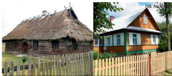
Drewniane, zabytkowe domy są stałym elementem krajobrazu Podlasia

Tak, szczególnie w kontekście jego ochrony, bo ma ono przecież najczęściej nieodnawialny i skończony charakter. To trudne zadanie, dlatego że jako społeczeństwo nie zawsze mamy świadomość wartości posiadanego dziedzictwa kulturowego, nie zawsze chcemy angażować się w jego ochronę.