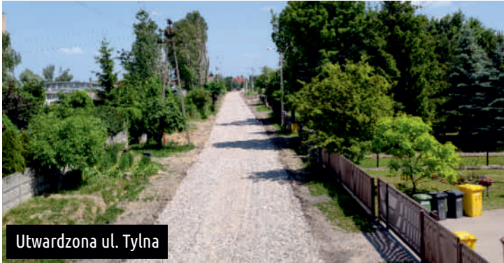
Utwardzona ul. Tylna