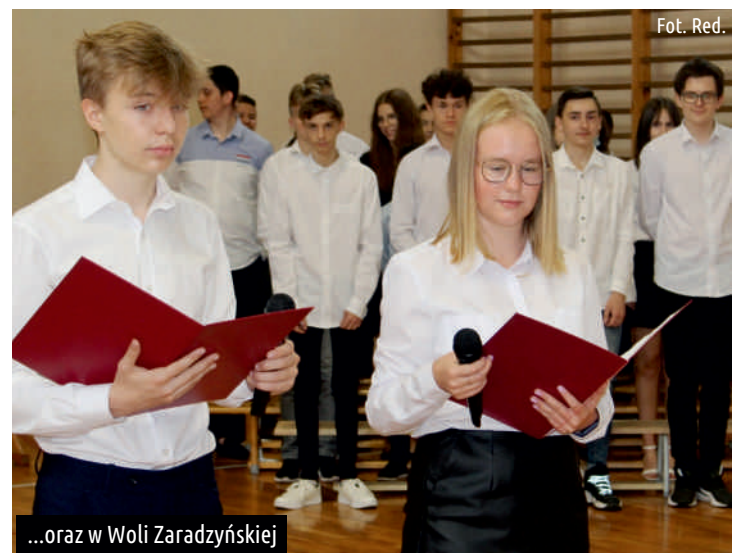
...oraz w Woli Zaradzyńskiej