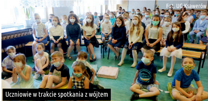
Uczniowie w trakcie spotkania z wójtem