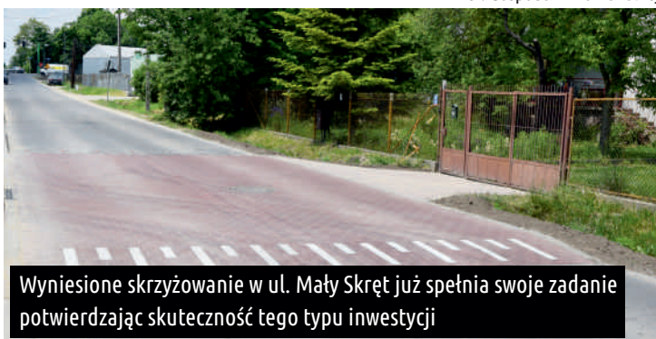
Wyniesione skrzyżowanie w ul. Mały Skręt już spełnia swoje zadanie potwierdzając skuteczność tego typu inwestycji