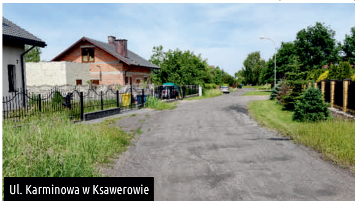
Ul. Karminowa w Ksawerowie