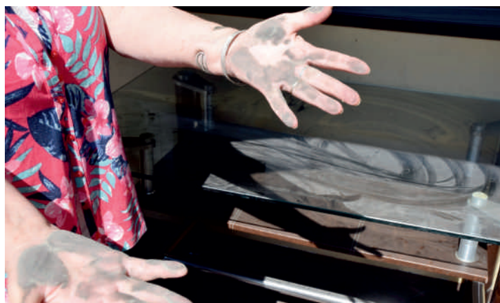
Budny, osiadający wszędzie pył, jest codziennością mieszkańców ulicy

- Nie mamy już słów i cierpliwości. Codziennie, kiedy jest ciepło i sucho, wdychamy wszędoobylski kurz i pył, który unosi się z ulicy. Nie sposób w dzień otworzyć okno czy wywiesić pranie, proszę spojrzeć na ten stolik. Największym problem są ciężarówki, które skracają sobie drogę jeżdżąc przez naszą ulicę. Sytuacja naprawdę jest tragiczna. Od kilkudziesięciu lat wspólnie z sąsiadami walczymy o remont tej ulicy, niestety bez konkretnego odzewu ze strony Pabianic. Jak długo jeszcze musimy czekać? - mówi zirytowana mieszkanka ulicy Zaradzyńskiej.