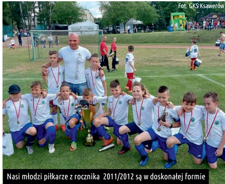
Nasi młodzi piłkarze z rocznika 2011/2012 są w doskonałej formie