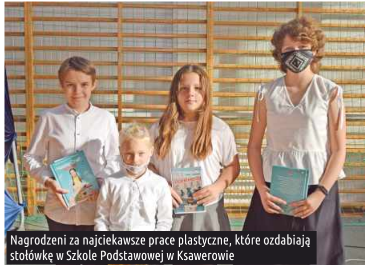
Nagrodzeni za najciekawsze prace plastyczne, które ozdabiają stołówkę w Szkole Podstawowej w Ksawerowie