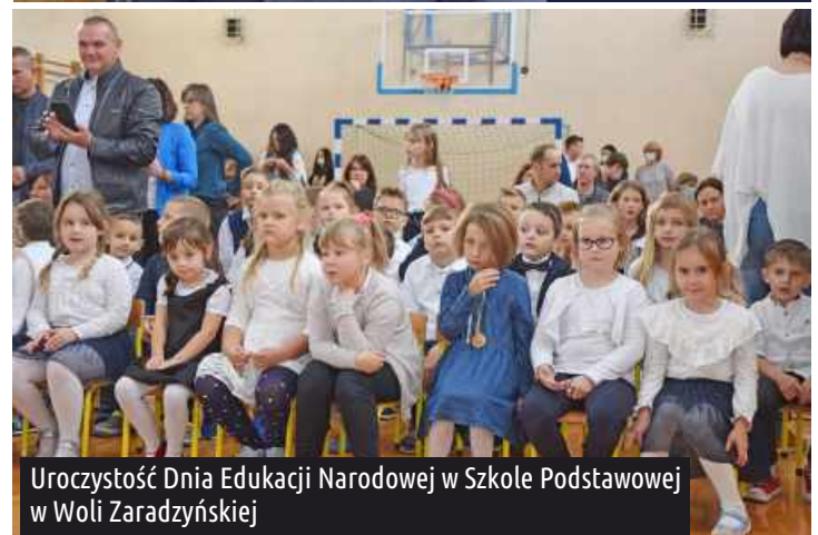
Uroczystość Dnia Edukacji Narodowej w Szkole Podstawowej w Woli Zaradzyńskiej