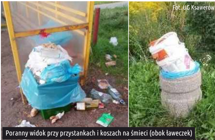
Poranny widok przy przystankach i koszach na śmieci (obok ławeczek)

Nikt nie chce oglądać mało estetycznych widoków w postaci przepełnionych koszy ulicznych, które są wypełnione po brzegi reklamówkami z odpadami, butelkami, opakowaniami zbiorczymi, bądź też pozostawionych przy pojemnikach worków. Niestety, równie często brygada znajduje podrzucone worki z odpadami budowlanymi, a wyjątkowym znaleziskiem były wysypane na poboczu opakowania po stodyczach. Zwracamy uwagę na takie zachowania!