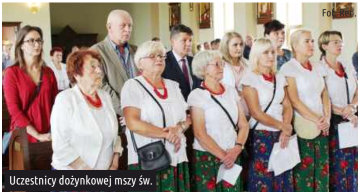
Uczestnicy dożynkowej mszy św.