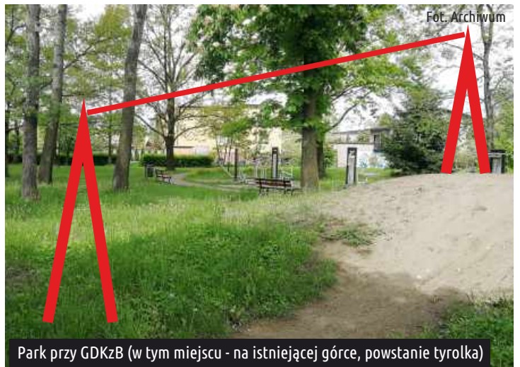
Park przy GDKzB (w tym miejscu - na istniejącej górze, powstanie tyrolka)

Dowiedz się więcej na... www.gmina.ksawerow.com