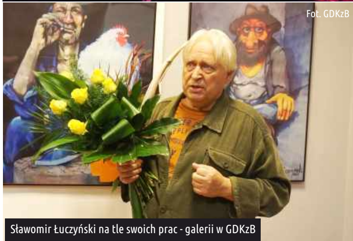
"Drugi Plan" na scenie GDKzB w Ksawerowie