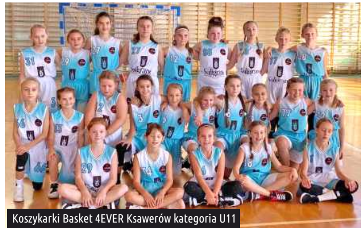
Koszykarki Basket 4EVER Ksawerów kategoria U11