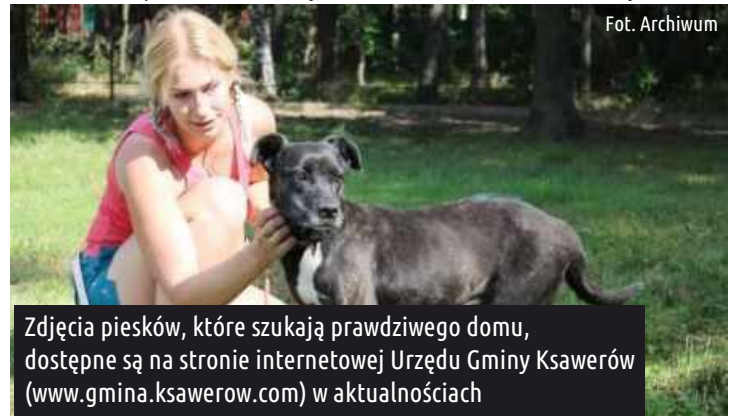
Zdjęcia pieszków, które szukają prawdziwego domu, dostępne są na stronie internetowej Urzędu Gminy Ksawerów ( www.gmina.ksawerow.com ) w aktualnościach