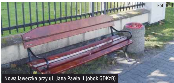
Nowa ławeczka przy ul. Jana Pawła II (obok GDKzB)

Pod koniec września wyrównane zostały gruntowe drogi gminne: Brzegowa, Osiowa, Poprzeczna, Akacyjowa, Świerkowa, Polna, Chmielna, Rzepakowa, Taneczna, Bukowa oraz Dobra. Na ulicy Tylnej zwiększono bezpieczeństwo przez kontrastowe oznaczenie przydrożnych słupów.