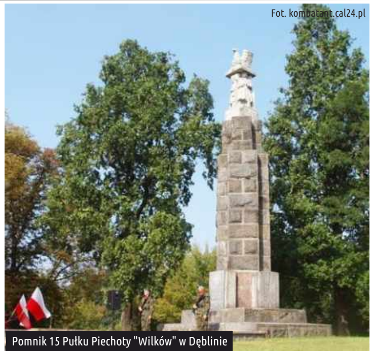
Pomnik 15 Pułku Piechoty "Wilków" w Dęblinie