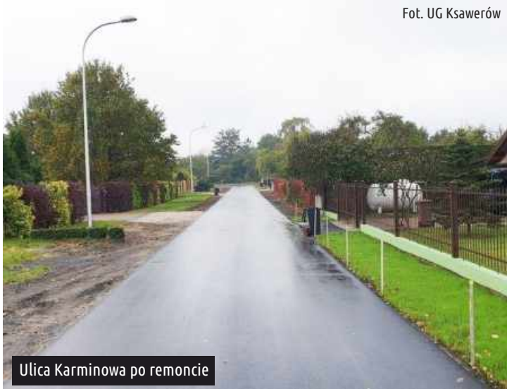
Ulica Karminowa po remoncie