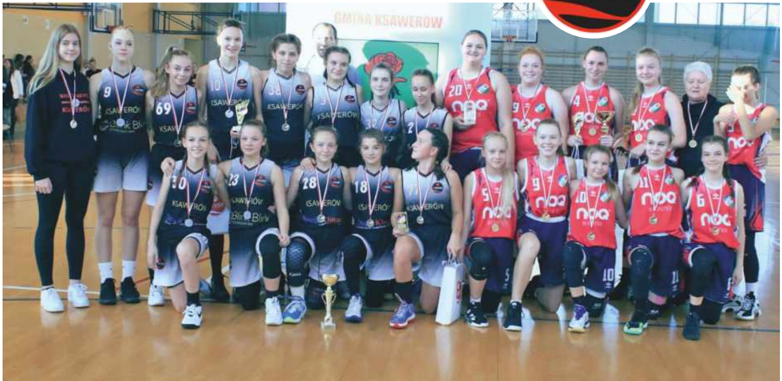
Zawodniczki Basket-u ze srebrnymi medalami i ich koleżanki z Pabianic (w czerwonych strojach) - najlepsze w rozegranym turnieju

Za nami wrześnieowy, dwudniowy Turniej w kategorii U15k o Puchar Wójta Gminy Ksawerów. Pięć mocnych zespołów, dziesięć meczów, solidne granie i mnóstwo sportowego ducha walki!