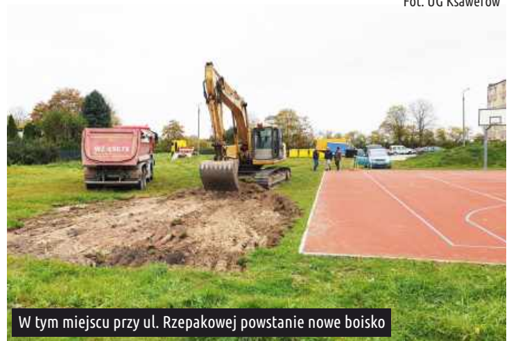
W tym miejscu przy ul. Rzepakowej powstanie nowe boisko