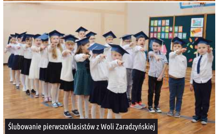
Ślubowanie pierwszoklasistów z Woli Zaradzyńskiej