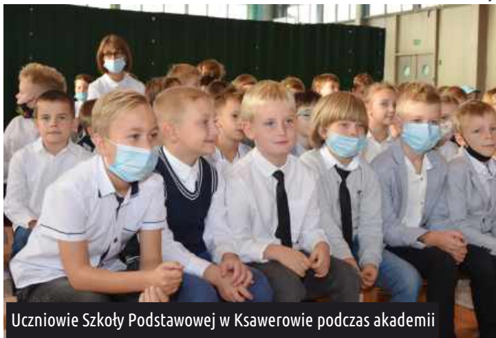
Uczniowie Szkoły Podstawowej w Ksawerowie podczas akademii