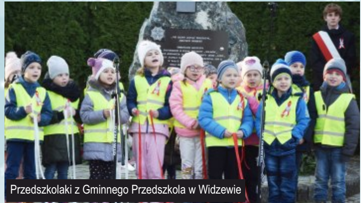
Przedskolaki z Gminnego Przedszkola w Widzewie