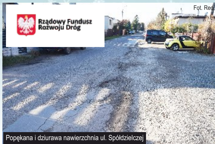
Popękana i dziurawa nawierzchnia ul. Spółdzielczej

Wkrótce, w ramach procedury przetargowej, wyłoniony zostanie wykonawca zadania pn. "Rozbudowa drogi gminnej - ul. Spółdzielczej w Ksawerowie". Zakres rozbudowy tej ulicy będzie obejmował wykonanie nowej nawierzchni asfaltowej, odwodnienia, utwardzenie pobocza z płyt żelbetowych typu JOMB oraz budowę chodnika i wyniesionego przejścia dla pieszych.