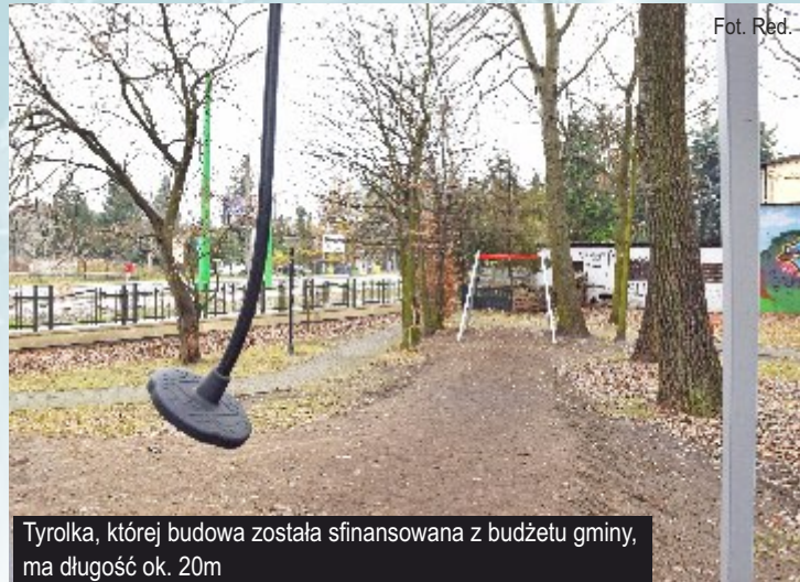
Tyrolka, której budowa została sfinansowana z budżetu gminy, ma długość ok. 20m