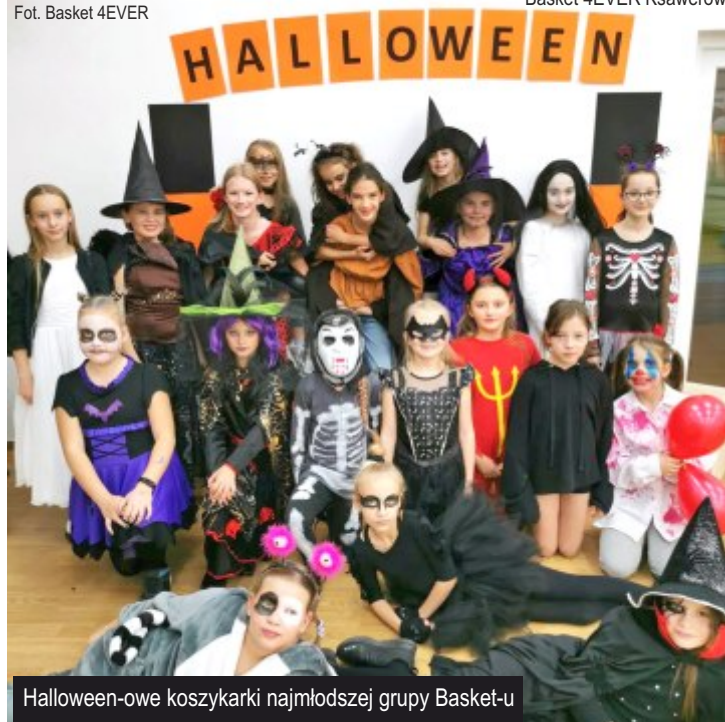
Halloween-owe koszykarki najmłodszej grupy Basket-u