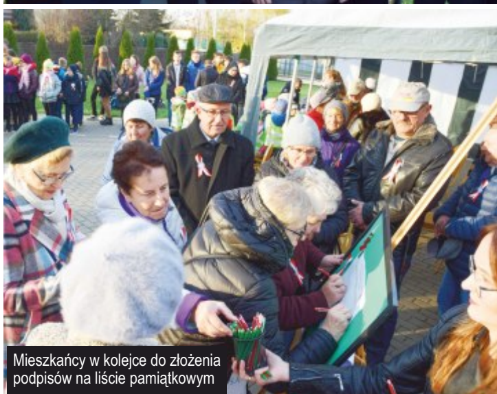
Mieszkańcy w kolejce do złożenia podpisów na liście pamiątkowym