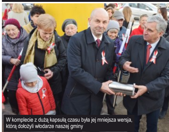
W komplecie z dużą kapsułą czasu była jej mniejsza wersja, którą dołożyli władarze naszej gminy

Dowiedz się więcej na... www.gmina.ksawerow.com