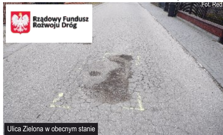
Ulica Zielona w obecnym stanie