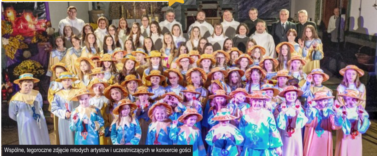
Wspólne, tegoroczne zdjęcie młodych artystów i uczestniczących w koncercie gości

W niedzielę 14 listopada br. w parafii Matki Boskiej Częstochowskiej w Ksawerowie odbył się coroczny koncert ku czci świętej Cecylii - patronki muzyki kościelnej.