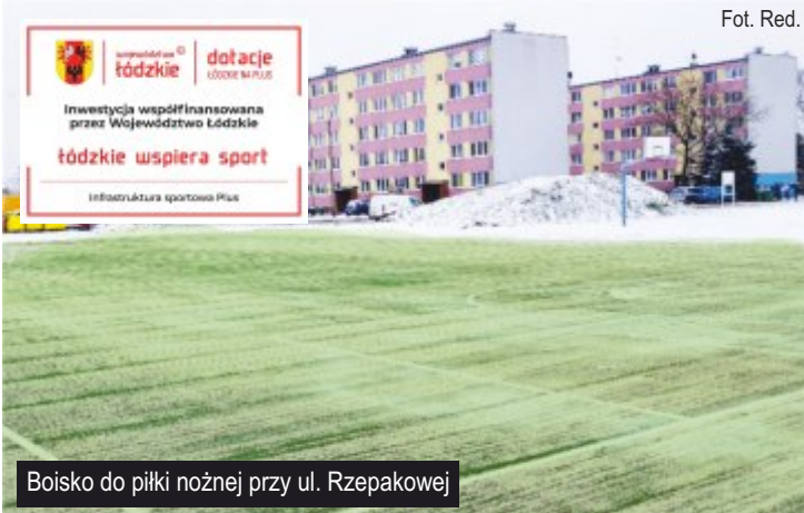
Boisko do piłki nożnej przy ul. Rzepakowej

Dowiedz się więcej na... www.gmina.ksawerow.com