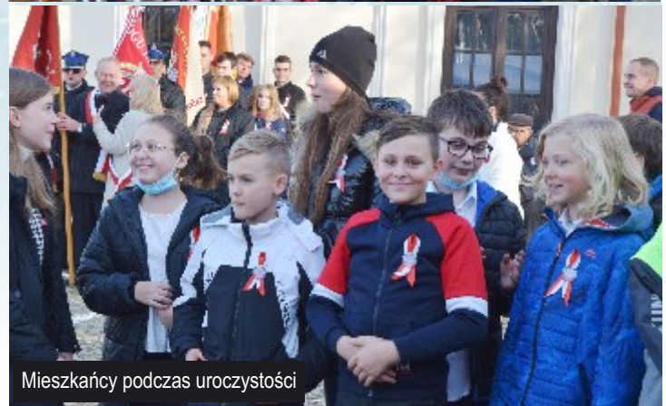
Mieszkańcy podczas uroczystości