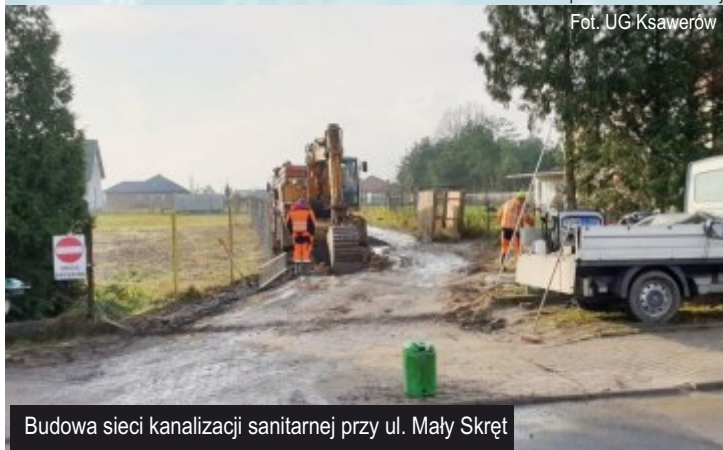
Budowa sieci kanalizacji sanitarnej przy ul. Mały Skręt

Ref. Gospodarki Komunalnej