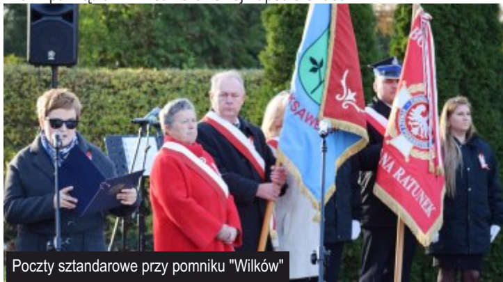
Poczty sztandarowe przy pomniku "Wilków"

Uczniowie przedszkoli i szkół zaprezentowali przygotowane specjalnie na tą okazję występy artystyczne podczas, których wszyscy uczestnicy mogli wpisać się na pamiątkowych kartach, które zostały później umieszczone wraz z pamiątkami w Ksawerowskiej Kapsule Czasu.