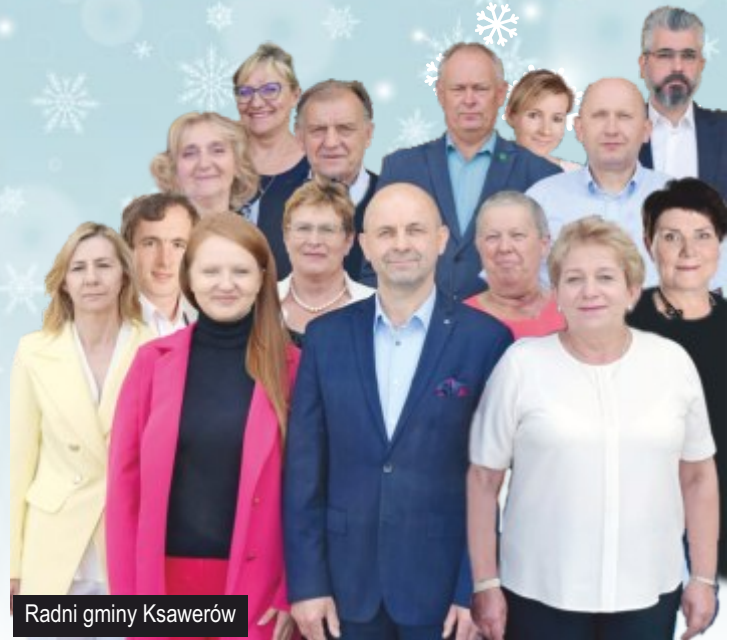
Radni gminy Ksawerów