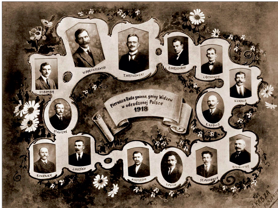
Na zdjęciu pierwsza Rada Gminy w Odrodzonej Polsce.

Redakcja miesięcznika Echo Gminy Ksawerów