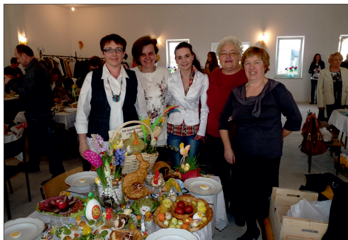
Koło Gospodyń z Nowej Gadki