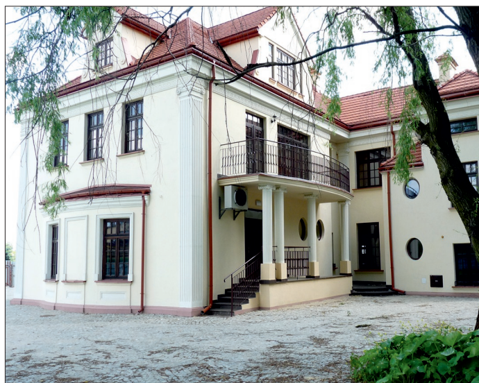
Przeobrażona willa Hoffmana. Poniżej detale z wnętrza

Jeszcze w tym samym roku budynek, który należał do Skarbu Państwa stał się siedzibą Urzędu Gminy. Od 1962 willa pełniła