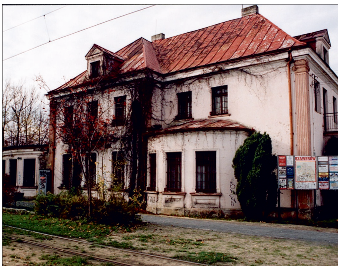
Przed remontem. Widok budynku od strony ul. Łódzkiej

funkcję publicznego ośrodka zdrowia. Jednocześnie w budynku mieściła się poczta. Ośrodek Zdrowia przestał funkcjonować w 2001 r., od tamtej pory budynek stał pusty. Gmina Ksawerów przejęła