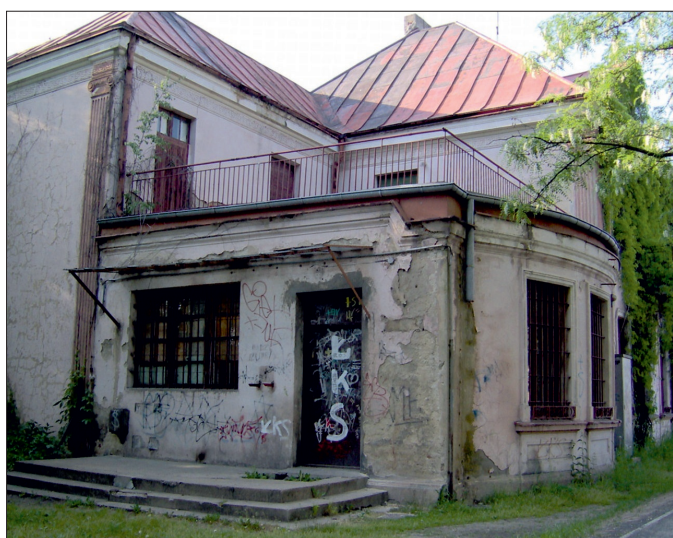
Przed remontem. Widok budynku od strony parku, dawniej wejście do urzędu pocztowego