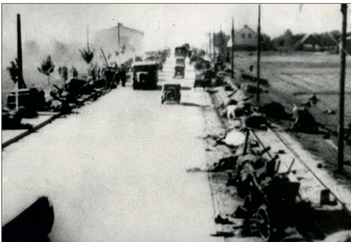
Ranek 8 września 1939 r. po nocnej bitwie w Ksawerowie

7 września 1939 r. rozpoczął się bój o Pabianice. Miasto zaatakowała elitarna jednostka pancerno-motorowa Leibstandarte SS Adolf Hitler. W obronie Pabianic brał udział 15 pułk pie-