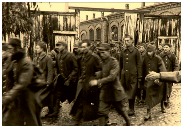
Obóz jeniecki w Pabianicach