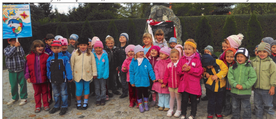
Gromadka uśmiechniętych przedszkolaków z Gminnego Przedszkola w Widzewie

Głównym celem wycieczki było złożenie kwiatów pod pomnikiem 15 Pułków Piechoty „Wilków”. Następnie przedszkolaki zwiedziły Dom Kultury w Ksawerowie i tam czekała na dzieci super niespodzianka w postaci popcornu. Z okazji „Dnia przedszkolaka” dzieci zostały zaopatrzone w odbłaskowe opa-