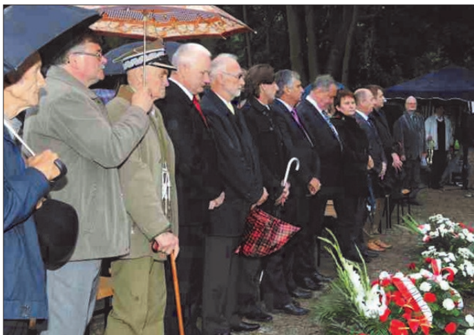
W uroczystości wzięli udział przedstawiciele organizacji kombatanckich, parlamentarzysty, przedstawiciele władz i mieszkańcy

W pierwszych dniach wojny, dokładnie 7 września 1939 r. 15 Pułk Piechoty „Wilków” został zaatakowany w Ksawerowie przez niemieckich dywersantów i żołnierzy. Przewagą wroga był niespodziewany atak, na maszerującą ulicą Łódzką, wojskową kolumnę. W świadomości mieszkańców pozostał obraz ulicy, która spłynęła krwią. W 72 rocznicę wydarzeń został odsłonięty obelisk upamiętniający to wydarzenie i żołnierzy 15 Pułk Piechoty „Wilków”. Podczas uroczystości nastąpiło otwarcie Gminnego Domu Kultury z Biblioteką.