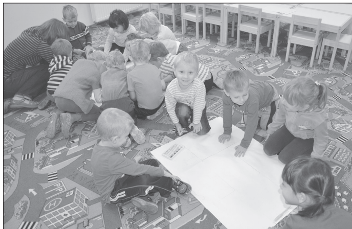
Najmłodszy w Akademii

Akademia to sobotni artystyczny punkt przedszkolny, realizujący autorski program rozwoju i stymulacji umysłu małego dziecka.