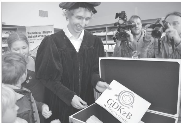
Listy trafiły do kapsuły czasu. Poczekamy 10 lat na ich otwarcie

Listy pisali zarówno uczniowie Szkoły Podstawowej i Gimnazjum w Ksawerowie jak i biznesmeni, nauczyciele, emeryci