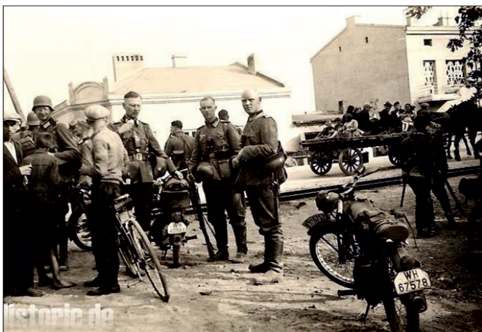
Zdjęcie z portalu historic.de podpisane 13 września 1939 r w Ksawerowie

15 pułk piechoty, znacznie wykrwawiony całonocnymi atakami niemieckimi, musiał się wycofać z Pabianic. Wieczorem, ok. godz. 20.00 na rozkaz mjr. Józefa Ratajczaka zaczął opuszczać stanowiska bojowe. Wycofujący się żołnierze polscy zostali nagle w nocy zaatakowani przez niemieckich dywersantów i żołnierzy w Ksawerowie na trasie Łódź – Pabianice przy