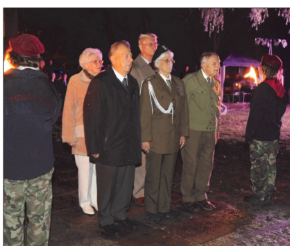
Wiązanki kwiatów pod obeliskiem złożyli między innymi przedstawiciele organizacji kombatanckich

Uroczystości rozpoczęły się Mszą św. i poświęceniem obelisku oraz willi Hoffmana.