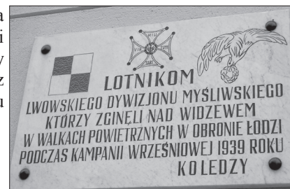
Tablica na budynku ZSCKR w Widzewie