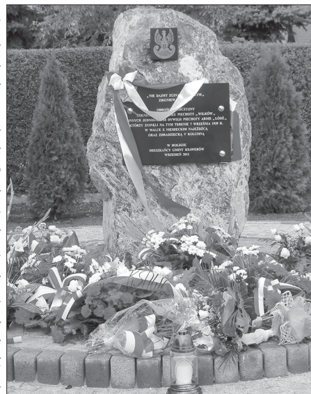
Obelisk zrealizowano w ramach projektu unijnego