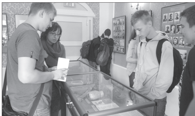
Szczególne zainteresowanie zwiedzających wzbudzały eksponaty związane z 15 pp „Wilków” oraz zdjęcia z września '39 r. w Ksawerowie.