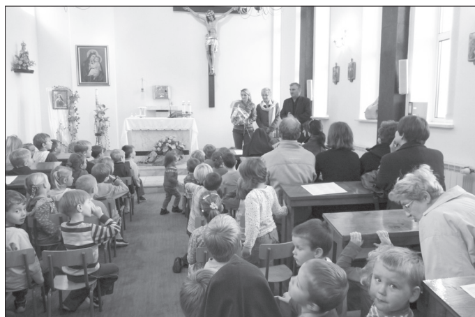
Uroczystości w przedszkolu Zgromadzenia Sióstr Karmelitanek