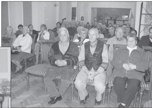
Wybory po raz pierwszy odbyły się w willi Hoffmana