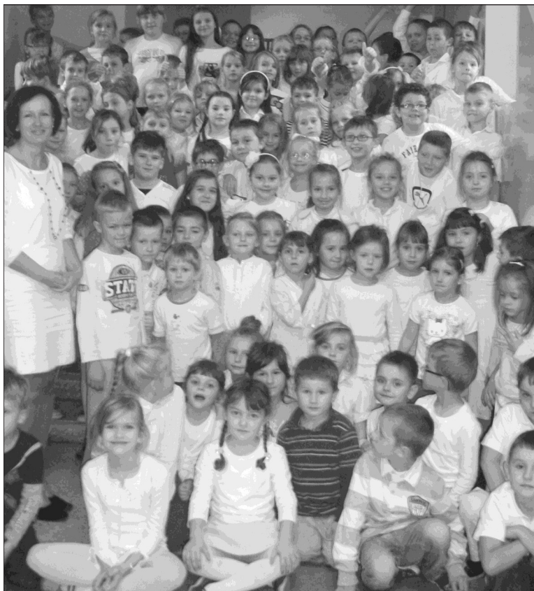
Biały dzień w Szkole Podstawowej w Ksawerowie

Pod koniec września uczniowie klas drugich SP w Ksawerowie uczestniczyli w zajęciach w Muzeum Oświaty w Łodzi, w klasie zaaranżowanej dawnymi sprzętami szkolnymi, w otoczeniu zabytków ze zbiorów archiwalnych, muzealnych i ikonograficznych. Uczniowie mogli zapoznać się z trudną sztuką pisania gęsimi i zwykłymi piórami ze stalówką, wzorem średniowiecznych mniichów kopiować inicjały oraz uczyć się z podręczników naszych babć. 23.10.2012 r. ucz. klasy Ia i Ib podziwiali piękne i tajemnicze ścieżki kopalni soli w Kłodawie. Dzieci odbyły długi spacer Podziemną Trasą Turystyczną, wędrowały korytarzami kopalni i odpoczywały w ogromnych salach po wyrobiskach solnych. Na głębokości 600 m pod powierzchnią ziemi uczniowie podziwiali kryształowe pokłady barwnej soli.