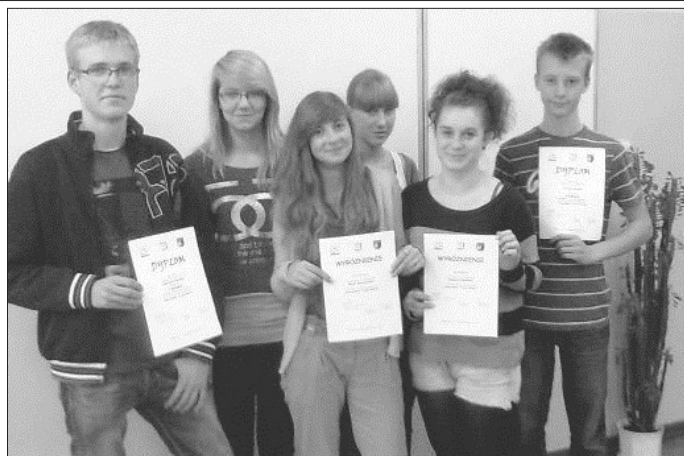
Uczestnicy konkursu z Gimnazjum w Ksawerowie