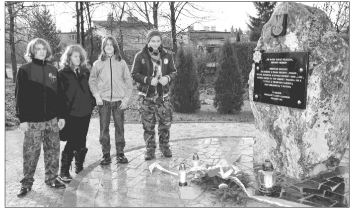
O kwiatach przy obelisku poświęconemu 15 Pułkowi Piechoty „Wilków” pamiętali Harcerze

Święto, jego historyczną wagę akcentowano również w szkołach na terenie gminy Ksawerów.