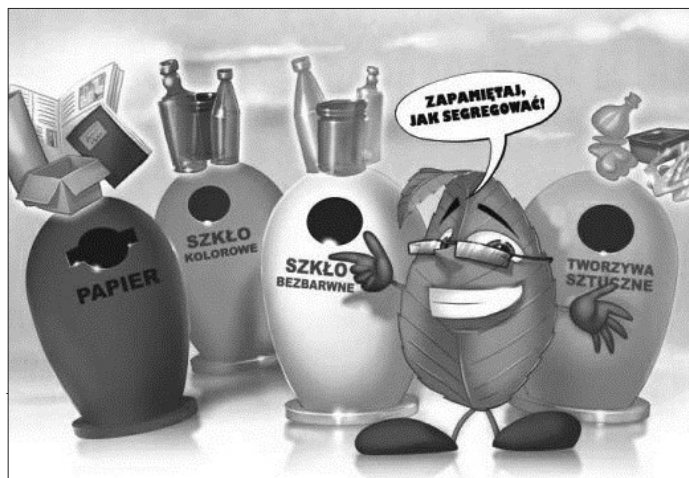
Rysunek z portalu zielonalekcja.pl

ka. Firma odbierająca odpady powiadomi gminę o przypadkach niedopełnienia przez właściciela nieruchomości obowiązku selektywnego zbierania odpadów. Wówczas gmina naliczy wyższe stawki za odbiór odpadów.