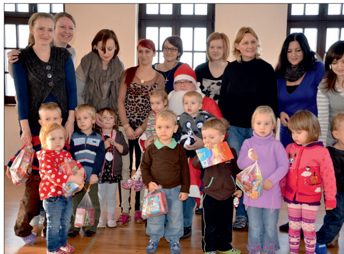
Obdarowani Milusińscy z mamami i Świętym Mikołajem

Dzieci w tym wieku nie mają zbyt wiele propozycji uczestnictwa w zajęciach kulturalnych, a młodzi rodzice poszukują porad, jak można stymulować rozwój młodego człowieka do poznawania ciekawości świata, rozwoju