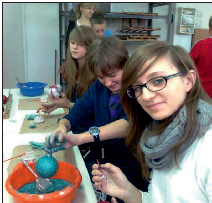
Wyjątkową wyprawę do fabryki bombek gimnazjaliści zakończyli wykonaniem bombki według własnego pomysłu