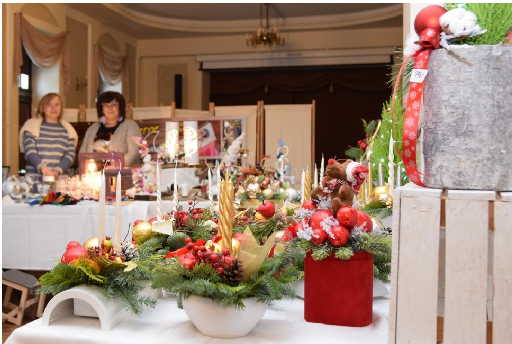
Zdjęcie przedstawia stoisko rękodzielnicze.