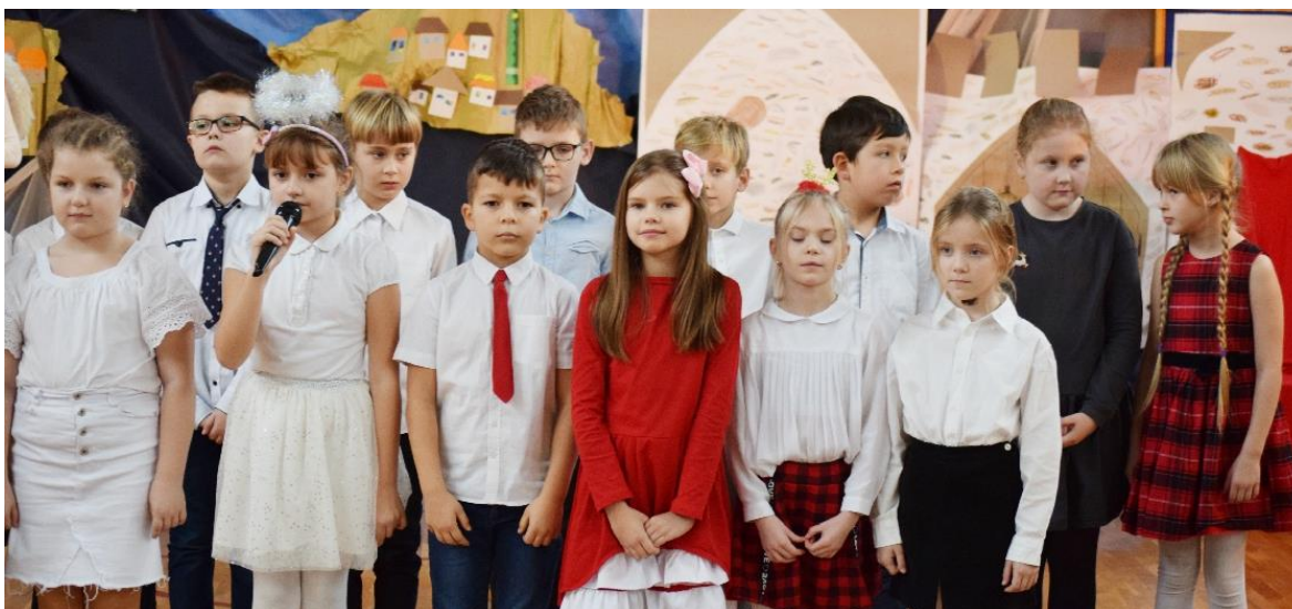
Zdjęcie przedstawia dzieci podczas jasełek w Szkole Podstawowej w Woli Zaradzyńskiej.