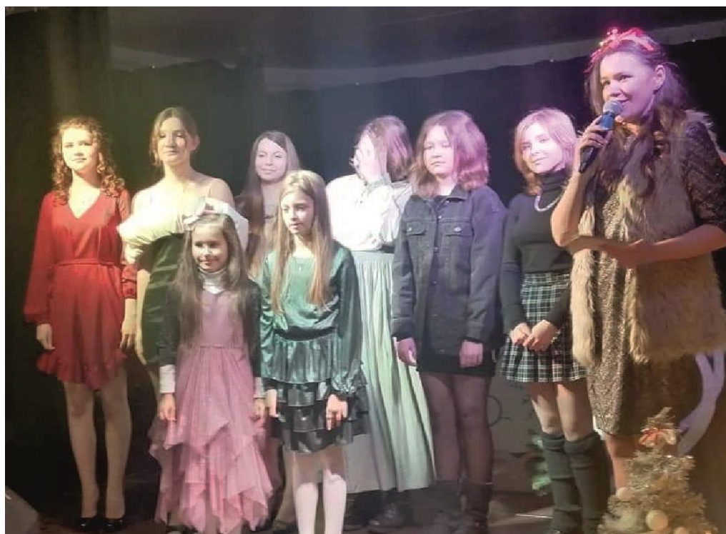
Zdjęcie przedstawia artystki Studia Piosenki Gminnego Domu Kultury z Biblioteką w Ksawerowie. Fotografia jest archiwalna.