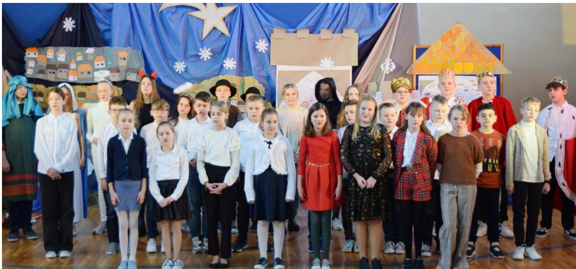
Zdjęcie przedstawia dzieci podczas jasełek w Szkole Podstawowej w Woli Zaradzyńskiej.