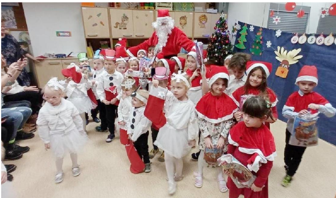
Zdjęcie przedstawia dzieci podczas jasełek w Gminnym Przedszkolu w Widzewie. Fotografia jest archiwalna.