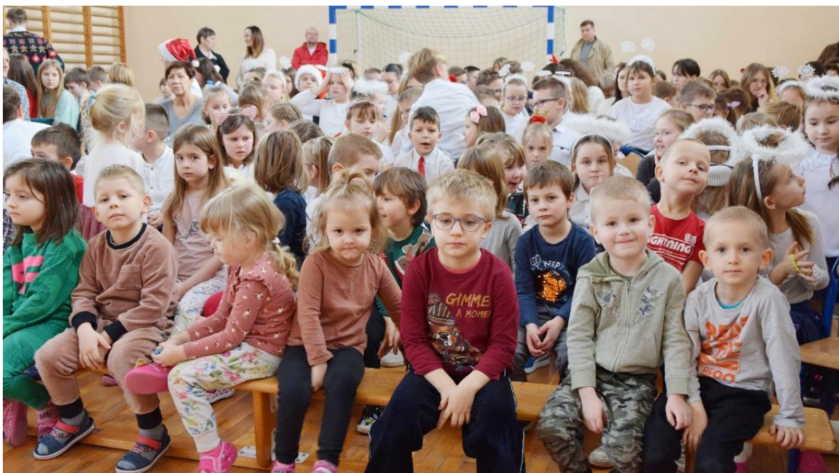
Zdjęcie przedstawia dzieci podczas jasełek w Szkole Podstawowej w Woli Zaradzyńskiej.