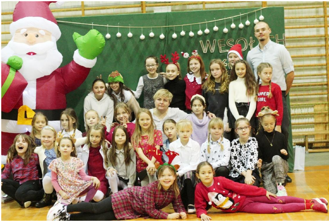
Zdjęcie przedstawia koszykarki drużyny Basket 4EVER Ksawerów.