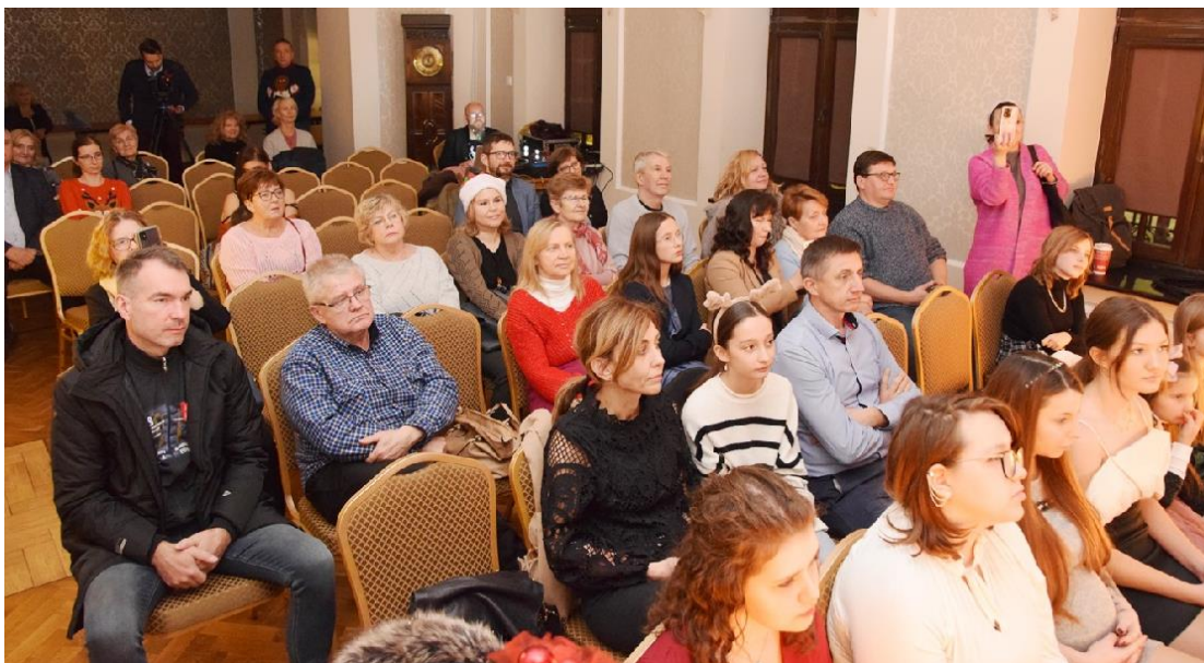
Zdjęcie przedstawia mieszkańców podczas Koncertu Bożonarodzeniowego.