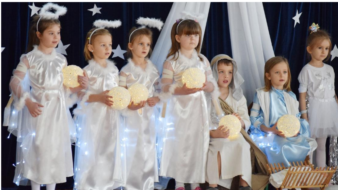
Zdjęcie przedstawia dzieci podczas jasełek w Szkole Podstawowej w Ksawerowie.