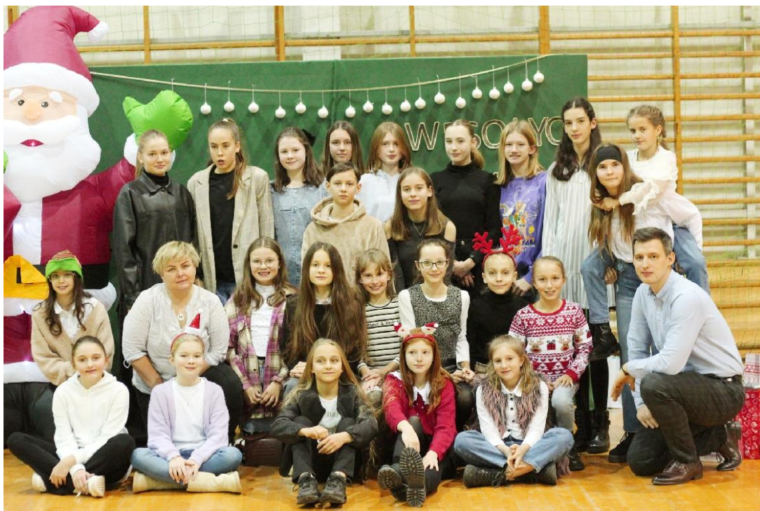
Zdjęcie przedstawia koszykarki drużyny Basket 4EVER Ksawerów. Fotografia jest archiwalna.