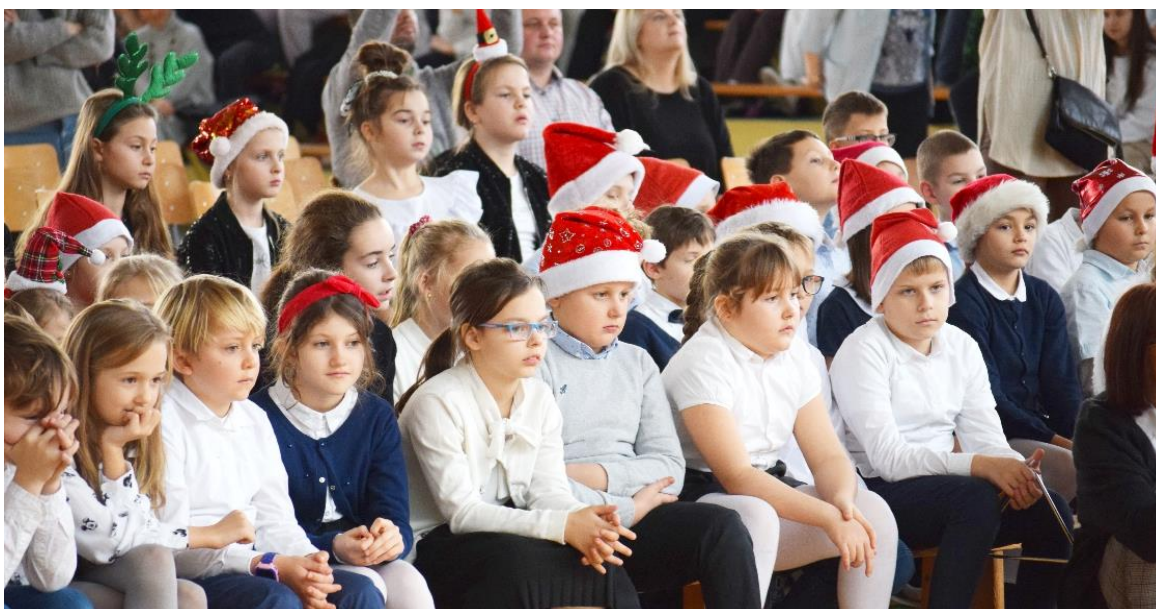
Zdjęcie przedstawia dzieci podczas jasełek w Szkole Podstawowej w Ksawerowie.