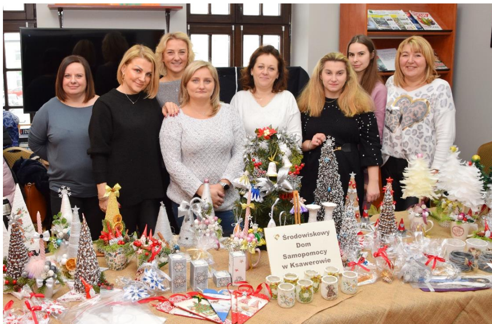
Zdjęcie przedstawia świąteczne stoisko Środowiskowego Domu Samopomocy w Ksawerowie.