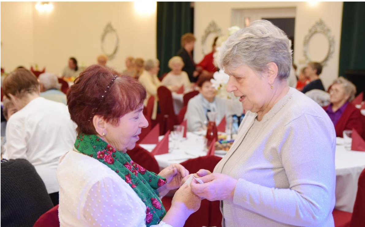
Zdjęcie przedstawia w trakcie spotkania wigilijnego.