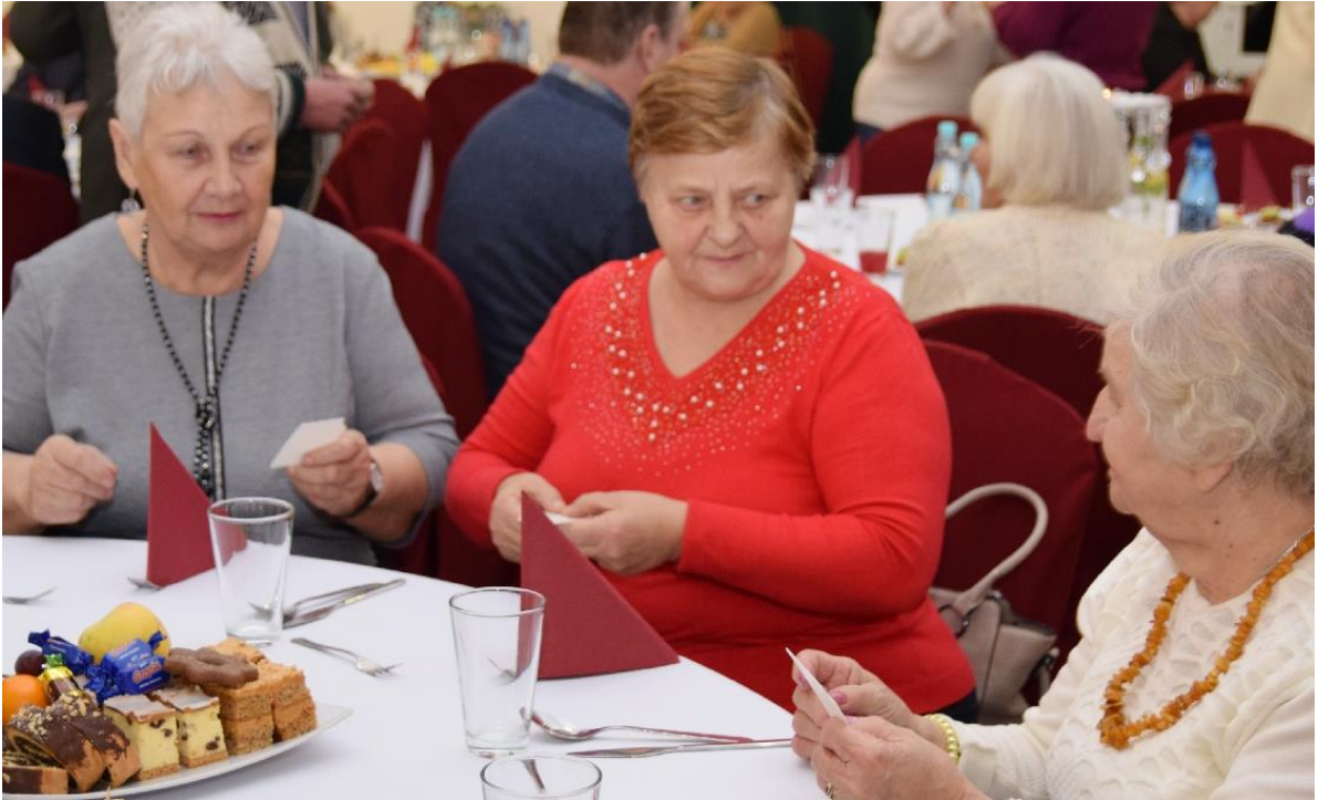
Zdjęcie przedstawia w trakcie spotkania wigilijnego.