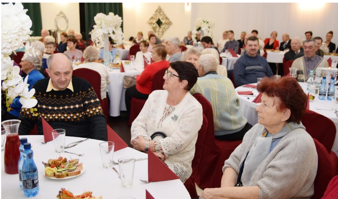
Zdjęcie przedstawia mieszkańców oraz zaproszonych gości w trakcie spotkania wigilijnego.