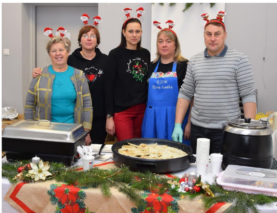
Zdjęcie przedstawia świąteczne stoisko Koła Gospodyń Wiejskich w Nowej Gadce.