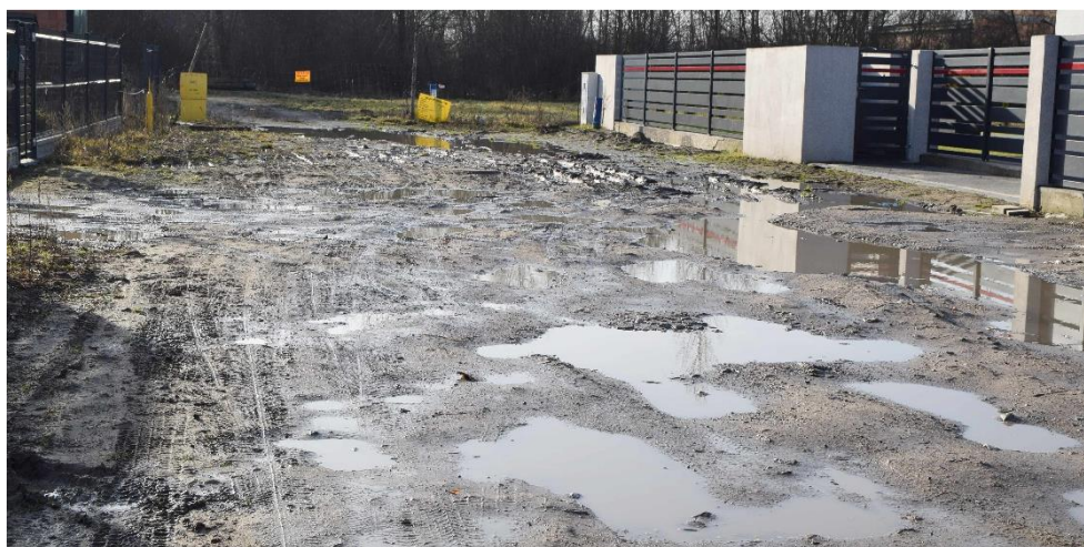
Zdjęcie przedstawia ulicę Spokojną podczas przebudowy. Informację przygotował Referat Infrastruktury.