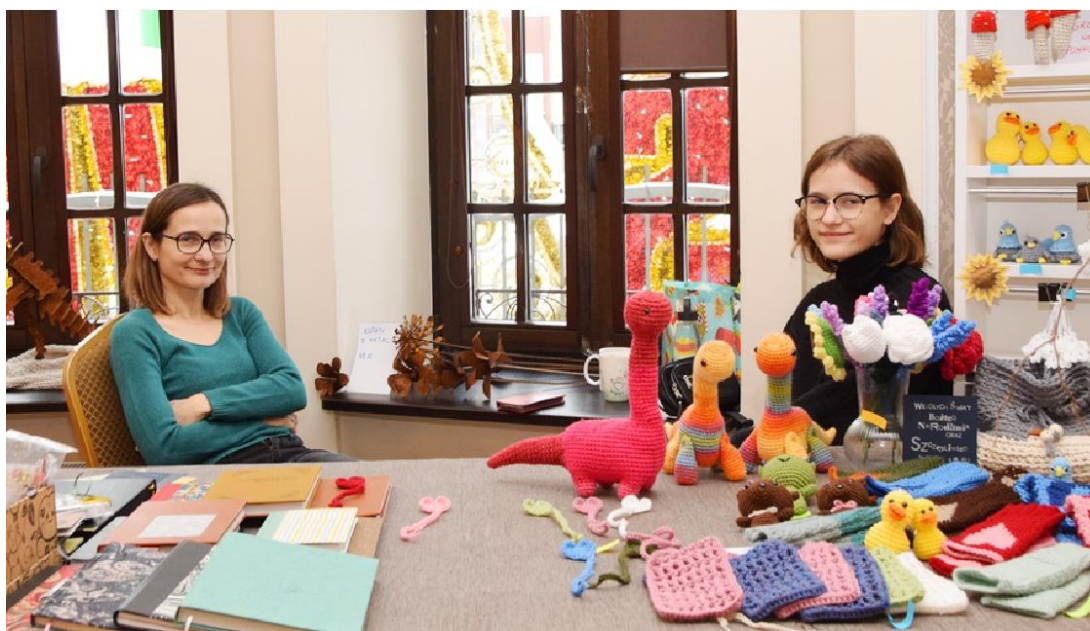
Zdjęcie przedstawia stoisko rękodzielnicze.