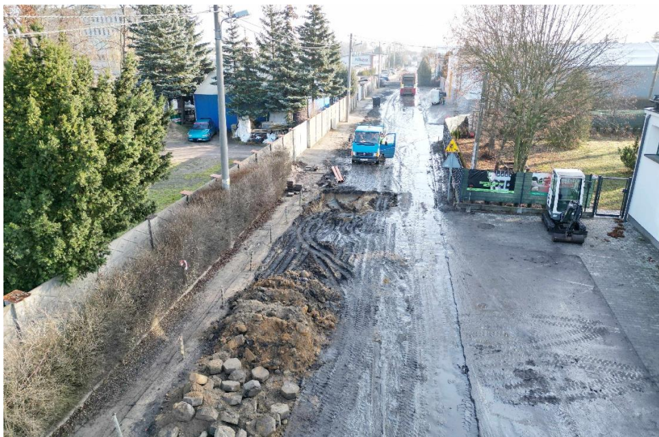
Zdjęcie przedstawia ulicę Tymiankową podczas przebudowy.