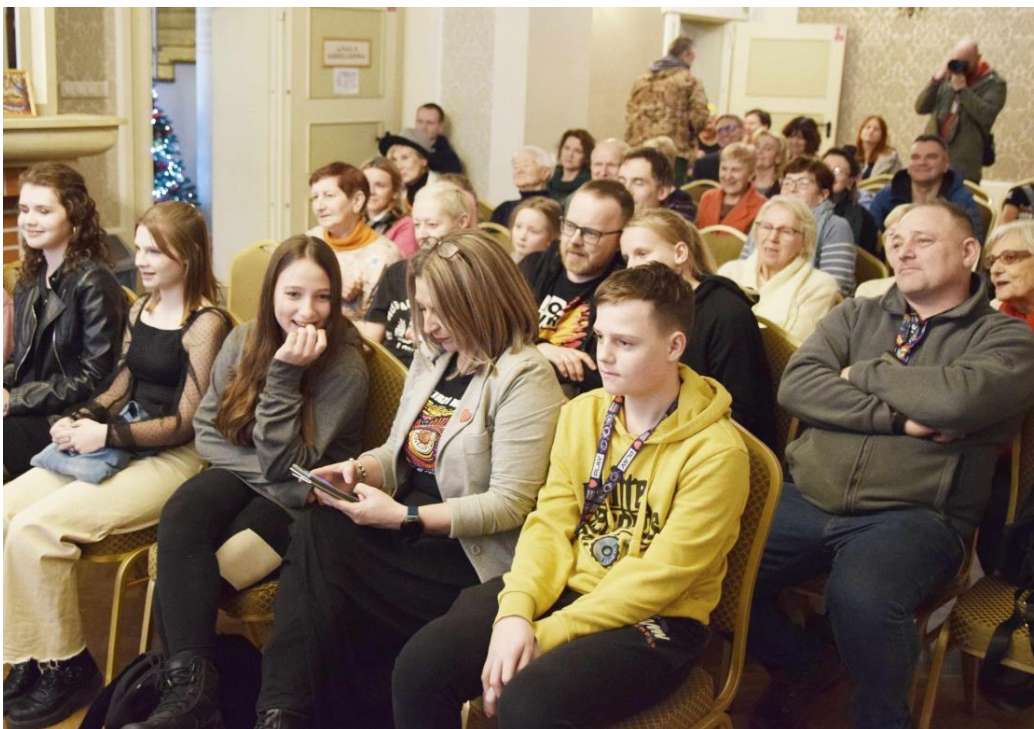
Fotografia przedstawia osoby uczestniczące w licytacjach. Informację przygotowała redakcja.