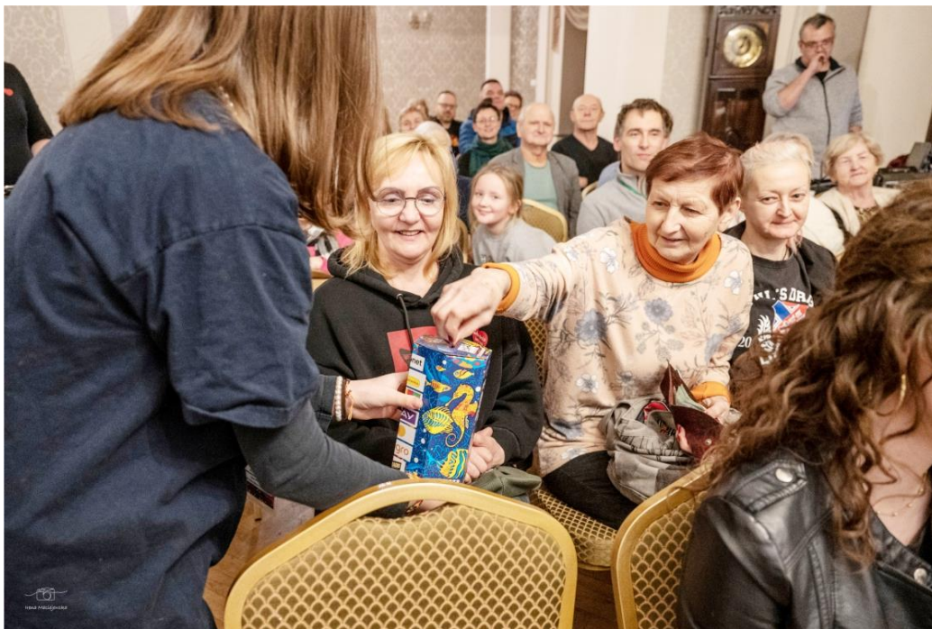
Fotografia przedstawia osoby uczestniczące w licytacjach.