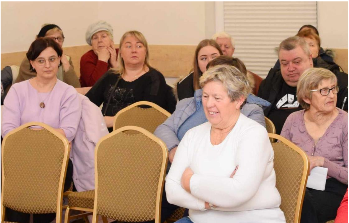
Zdjęcie przedstawia mieszkańców w trakcie zebrania wiejskiego. Informację przygotowała redakcja.