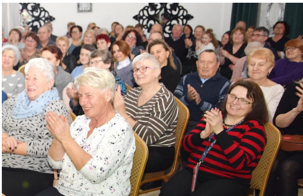
Fotografia przedstawia ksawerowską publiczność, uczestników koncertu.