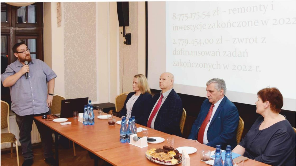
Zdjęcie przedstawia uczestników spotkania z Liderami. Informację przygotowała redakcja.