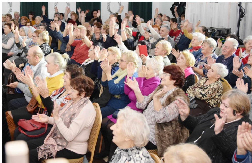
Fotografia przedstawia ksawerowską publiczność, uczestników koncertu.