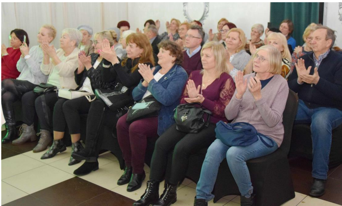
Fotografia przedstawia ksawerowską publiczność, uczestników koncertu.