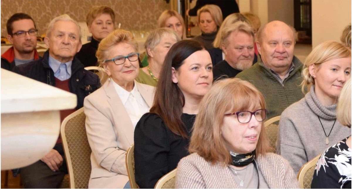
Zdjęcie przedstawia uczestników spotkania z Liderami.