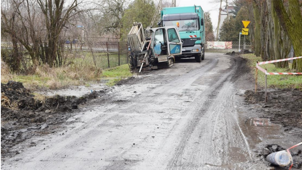
Zdjęcie przedstawia budowę wodociągu w ulicy Łąkowej w Ksawerowie.