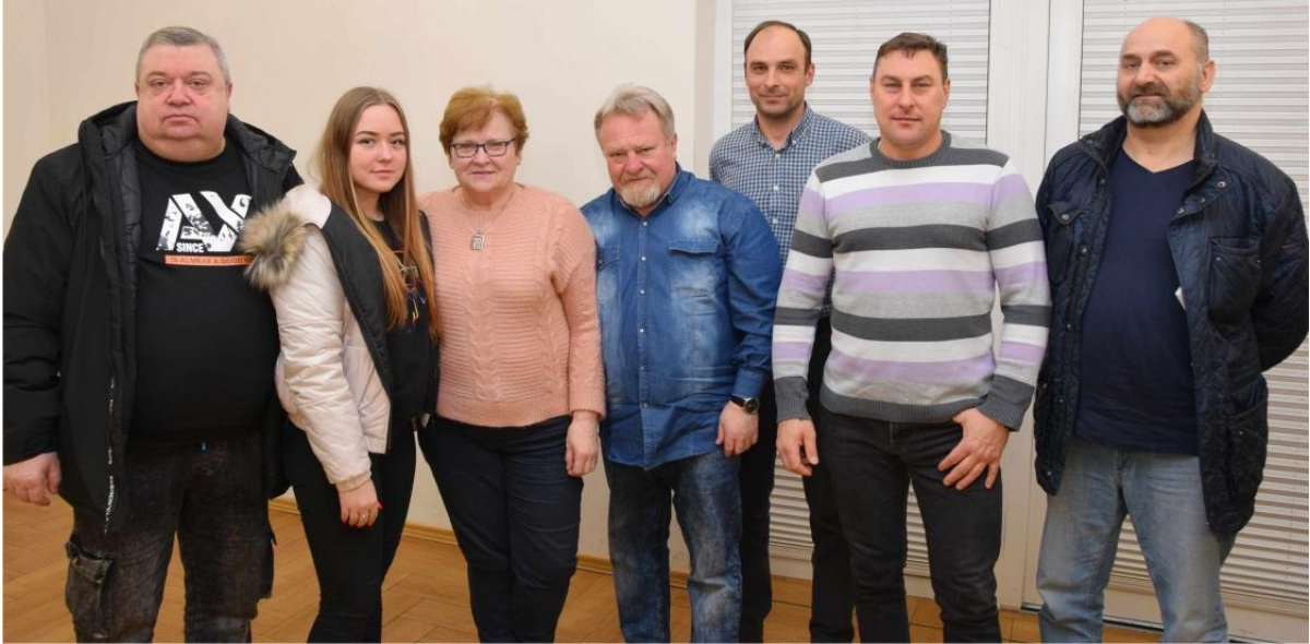
Zdjęcie przedstawia sołtysa z nową radą sołecką.