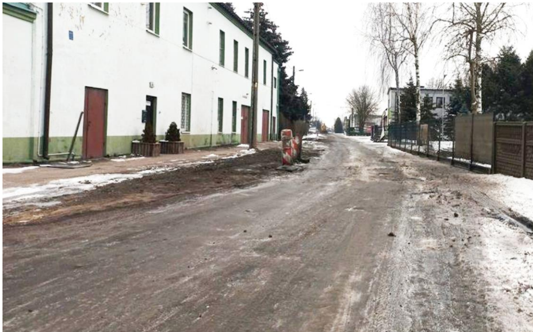
Zdjęcie przedstawia ulicę Tymiankową w Ksawerowie po wybudowaniu sieci kanalizacyjnej. Informację przygotował Referat Infrastruktury.