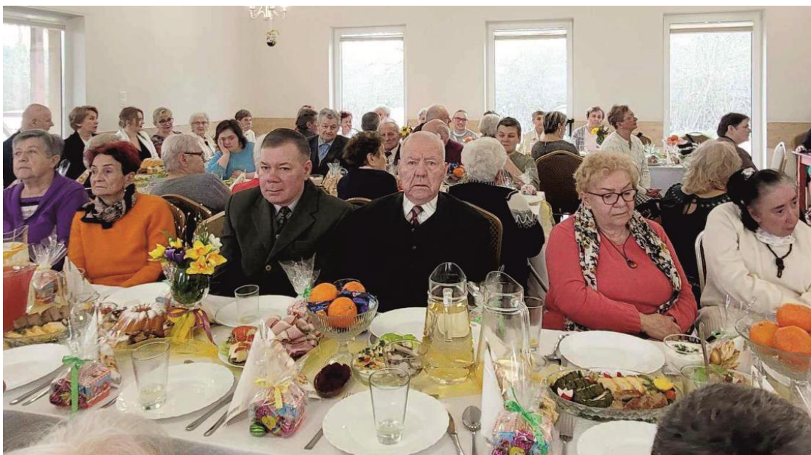
Fotografia przedstawia uczestników ŚDS przy stole świątecznym. Zdjęcie jest archiwalne.