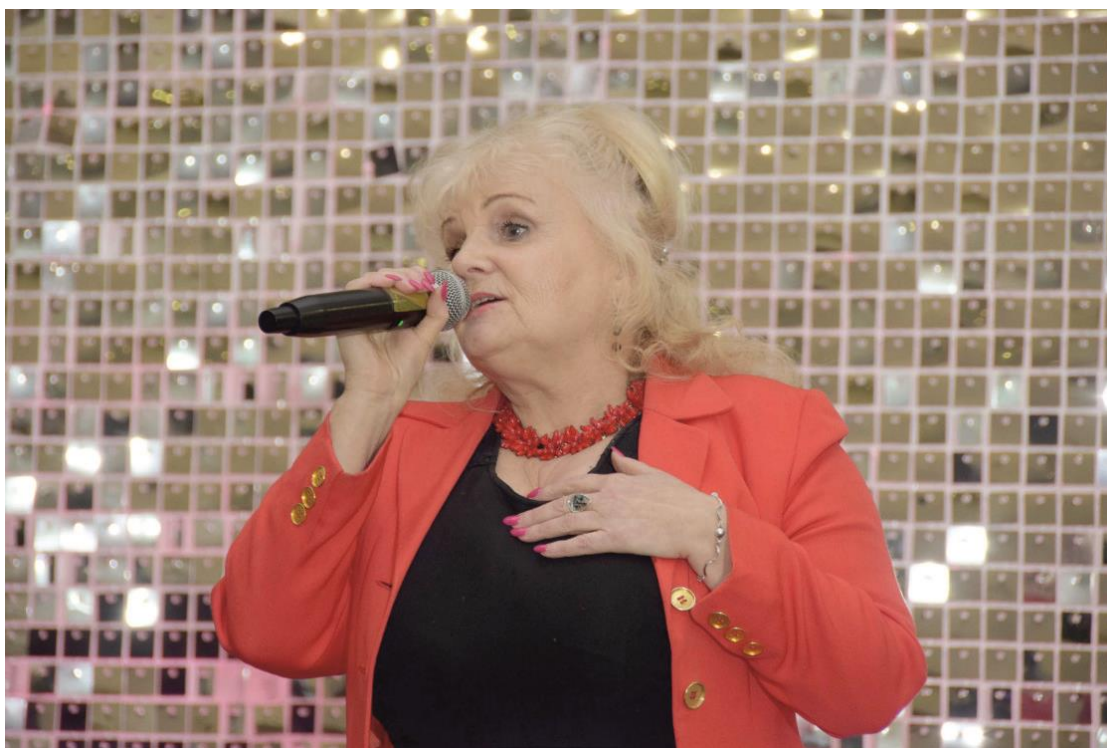
Fotografia przedstawia starszą kobietę – wokalistkę z mikrofonem. Zdjęcie wykonała redakcja.