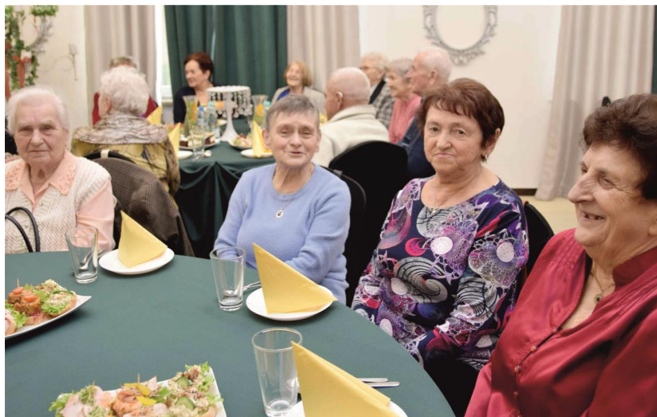
Fotografia grupę osób uczestniczących w spotkaniu świątecznym.