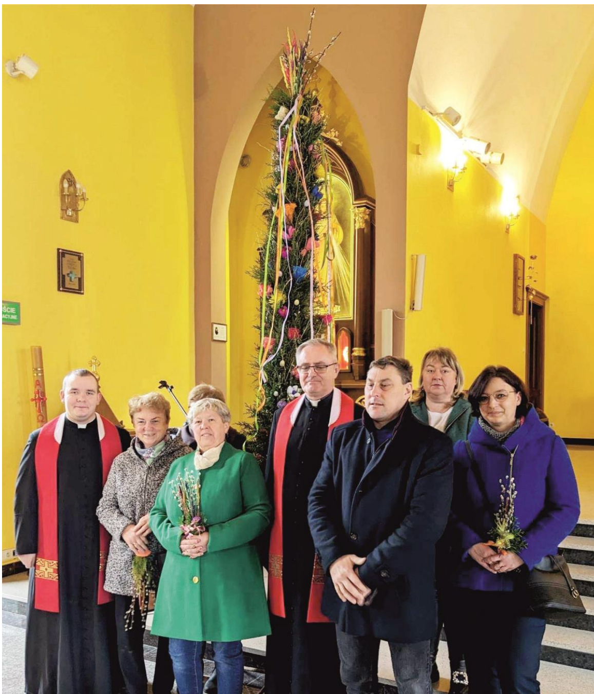
Fotografia przedstawia grupę osób z księżmi i palmą wielkanocną. Zdjęcie jest archiwalne. Informację przygotowała redakcja.