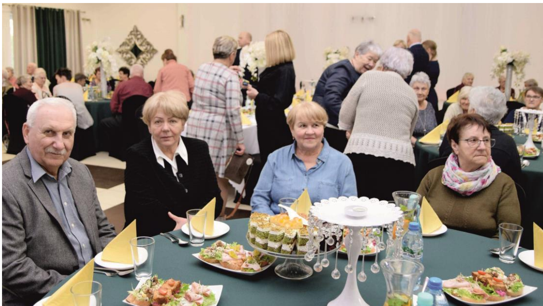
Fotografia grupę osób uczestniczących w spotkaniu świątecznym.