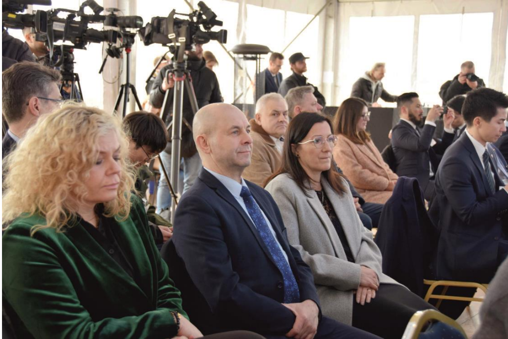
Fotografia przedstawia grupę osób uczestniczących w uroczystości inauguracji budowy fabryki Daikin.