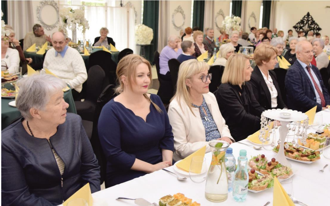
Fotografia grupę osób uczestniczących w spotkaniu świątecznym.