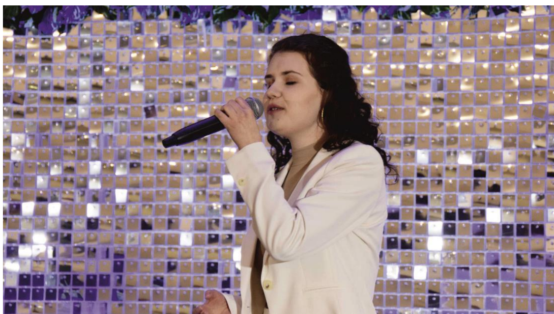
Fotografia przedstawia młodą kobietę – wokalistkę z mikrofonem.