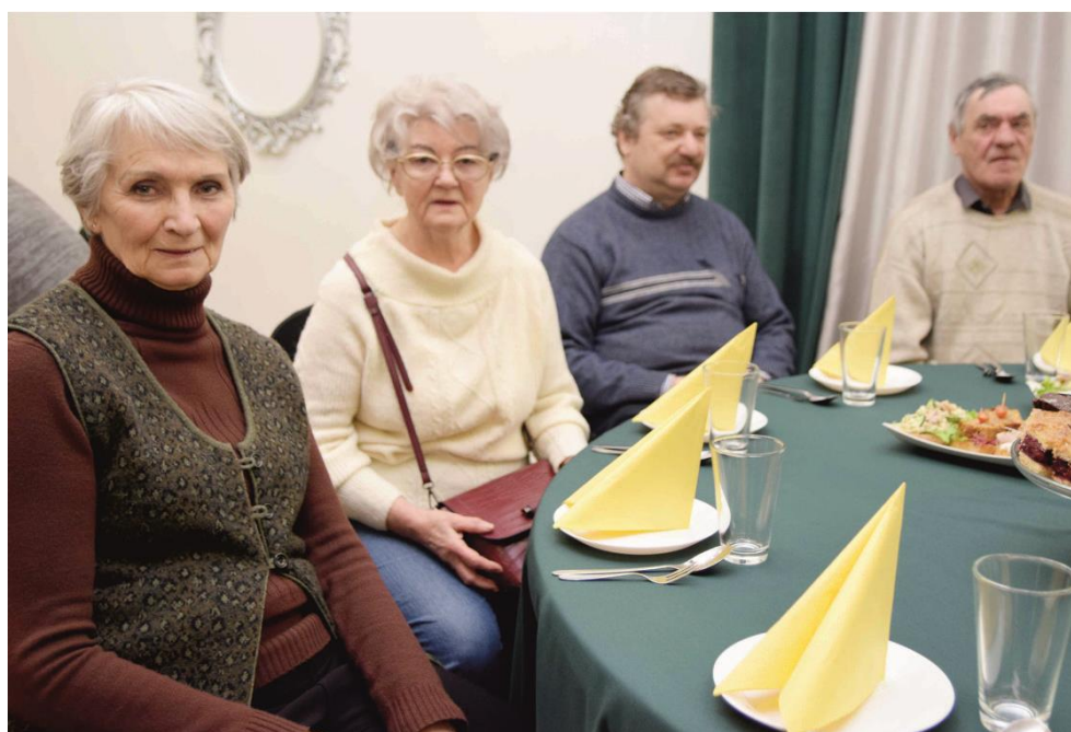
Fotografia grupę osób uczestniczących w spotkaniu świątecznym.