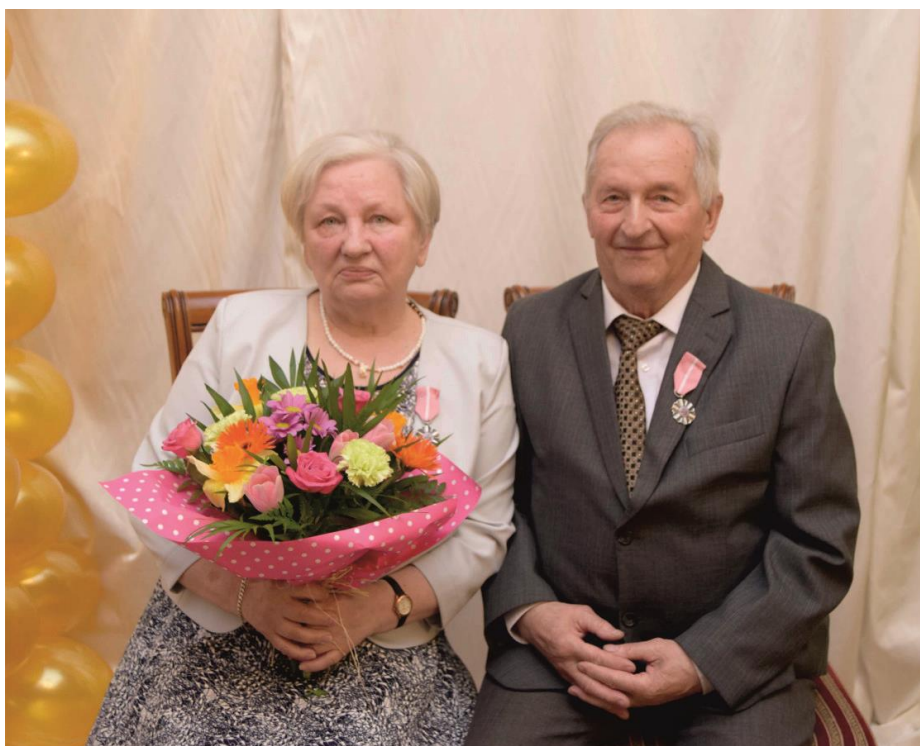
Fotografia przedstawia parę małżeńską – Państwa Maj.