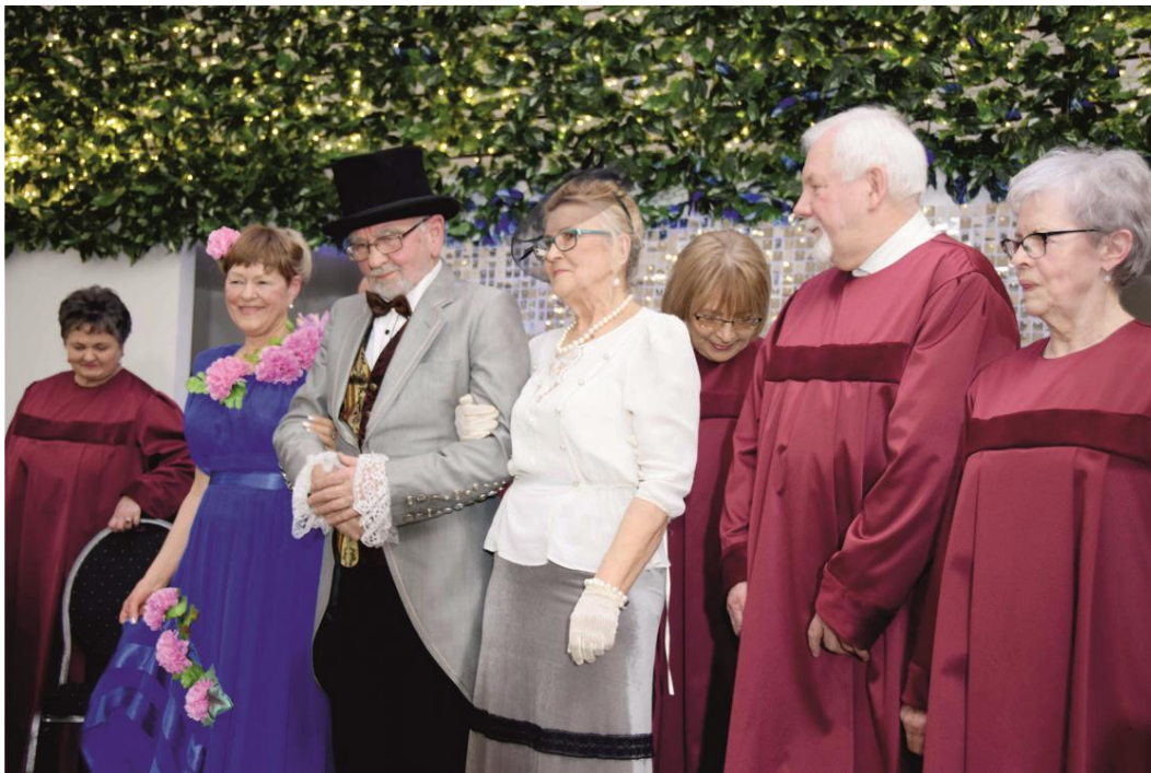
Fotografia grupę osób – seniorów na scenie.