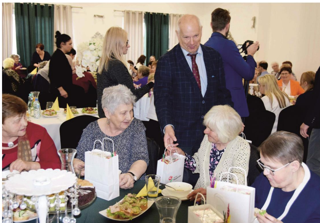
Fotografia grupę osób uczestniczących w spotkaniu świątecznym.