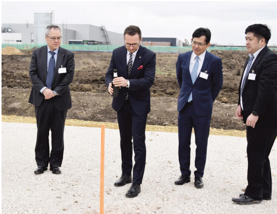
Fotografia przedstawia grupę mężczyzn uczestniczących w uroczystości inauguracji budowy fabryki Daikin . Informację przygotował Referat Oświaty, Spraw Społecznych i Promocji