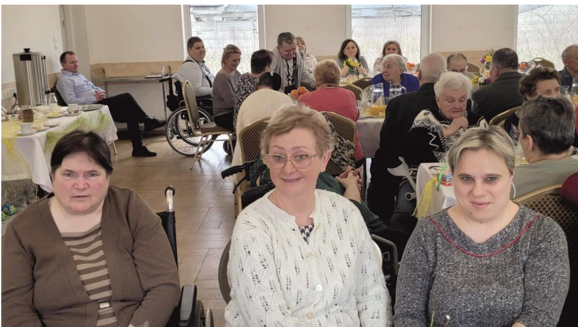
Fotografia przedstawia uczestników ŚDS przy stole świątecznym. Zdjęcie jest archiwalne.