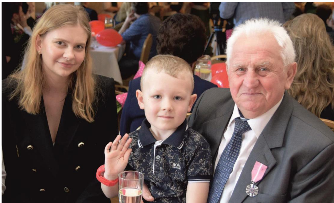
Fotografia przedstawia starszego, uśmiechającego się mężczyznę, obok którego siedzi młoda kobieta i mały chłopiec.