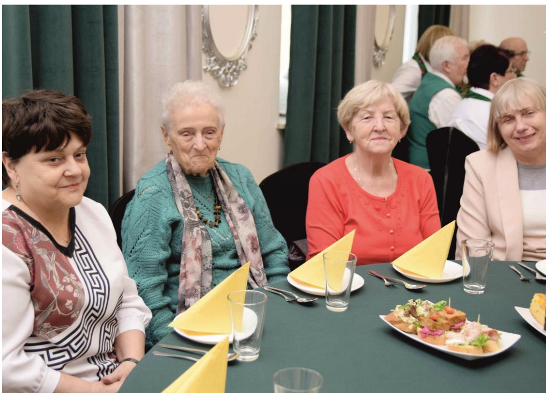
Fotografia grupę osób uczestniczących w spotkaniu świątecznym.