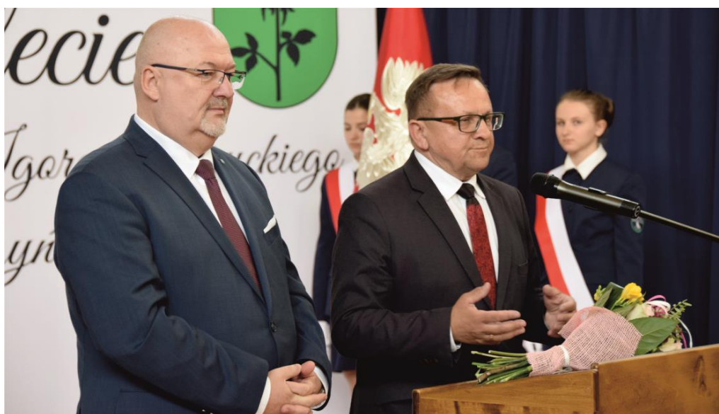
Fotografia przedstawia posła Rzeczypospolitej Polskiej Marka Matuszewskiego (przy mikrofonie) i Krzysztofa Ciebiedę, posła Rzeczypospolitej Polskiej VIII kadencji.