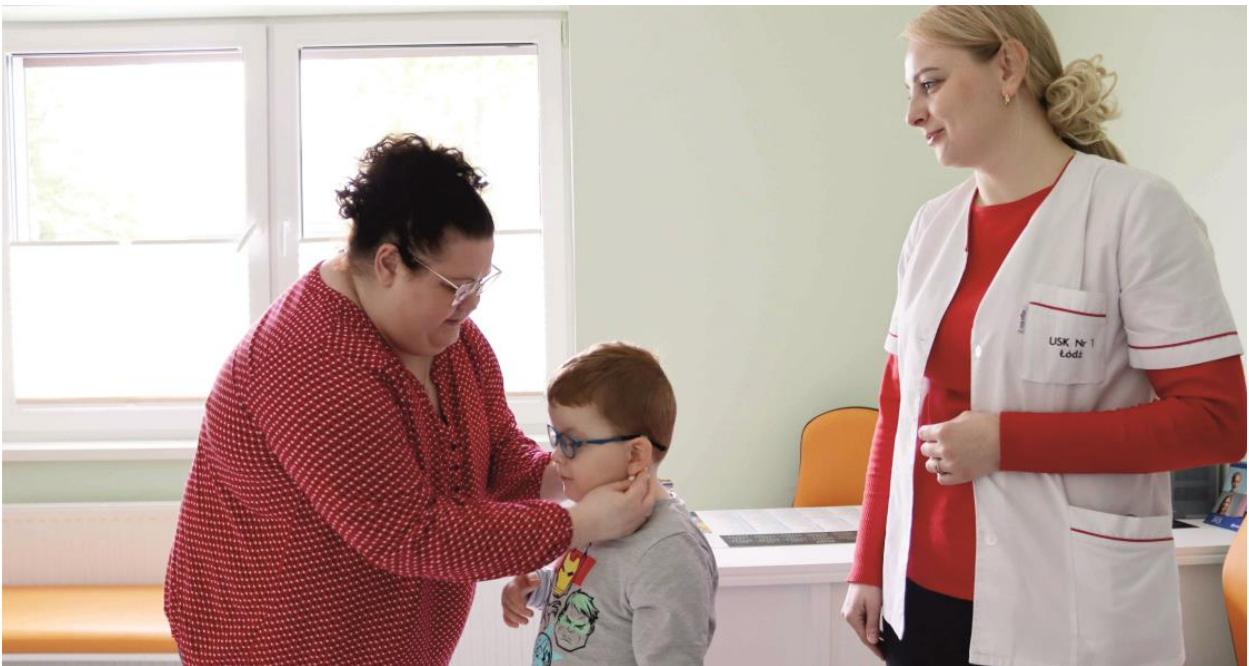
Fotografia przedstawia mieszkańca gminy w trakcie badań specjalistycznych. Informację przygotowała redakcja.