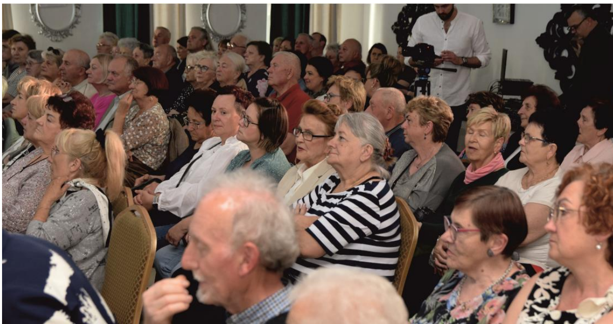
Fotografia przedstawia publiczność podczas koncertu.