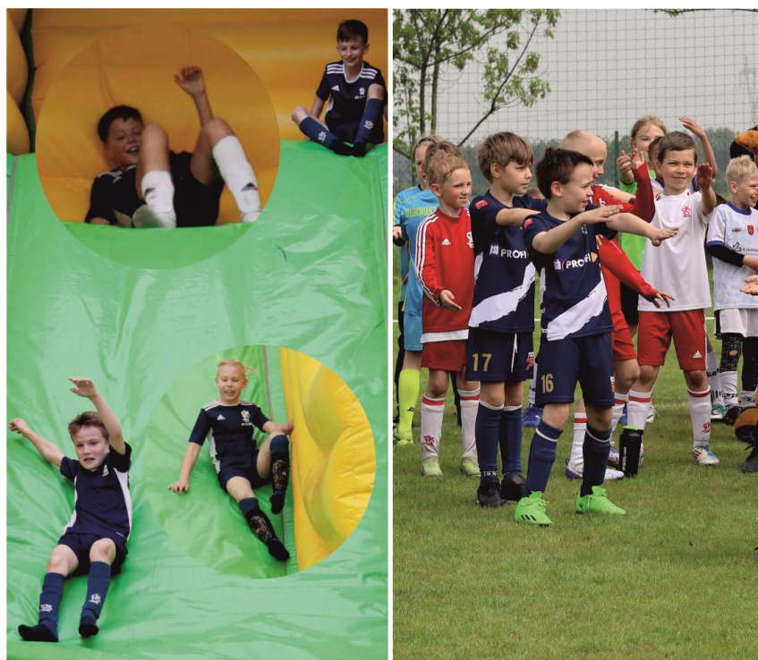
Fotografia przedstawia uczestników festynu podczas zabaw i animacji.