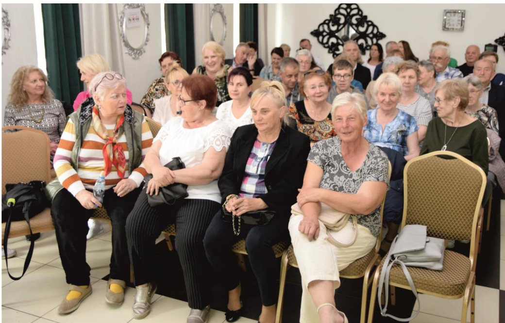
Fotografia przedstawia publiczność podczas koncertu.