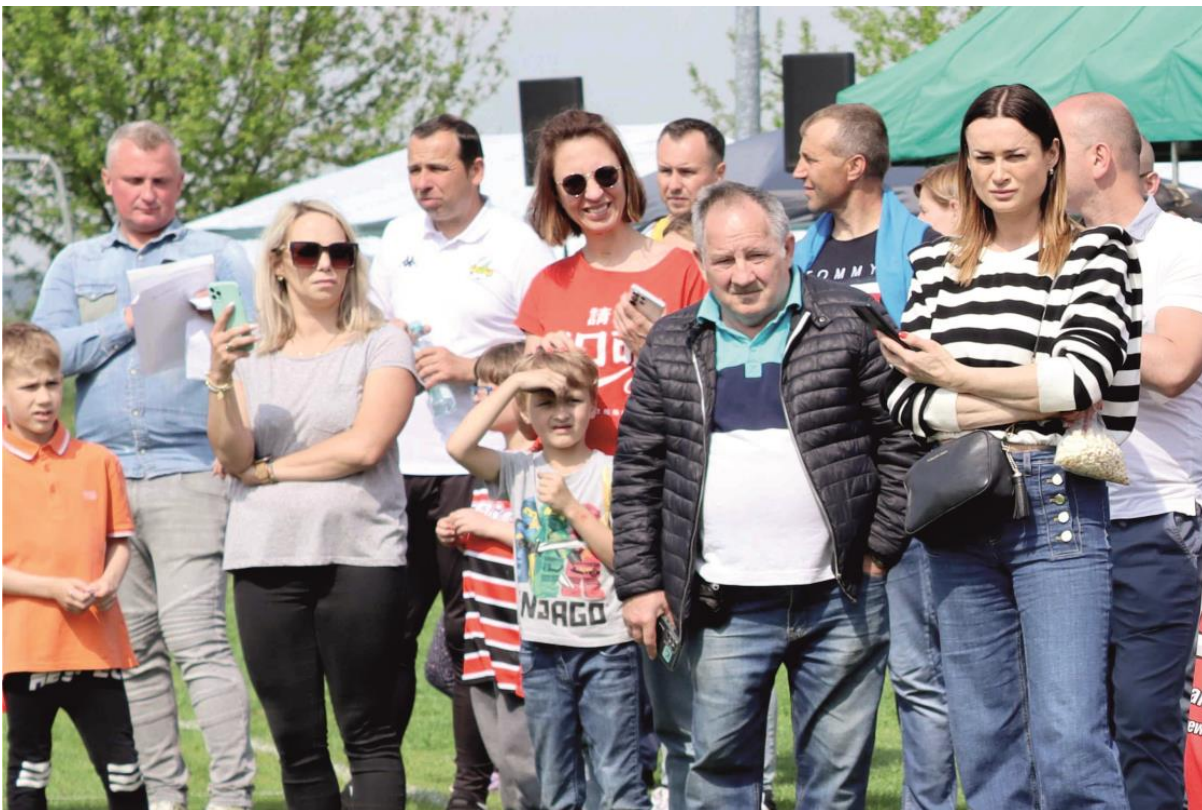
Fotografia przedstawia uczestników festynu.