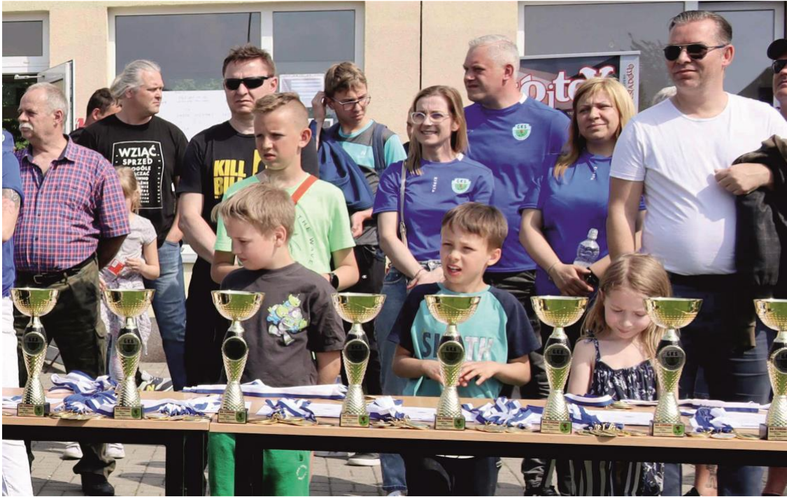
Fotografia przedstawia uczestników festynu.