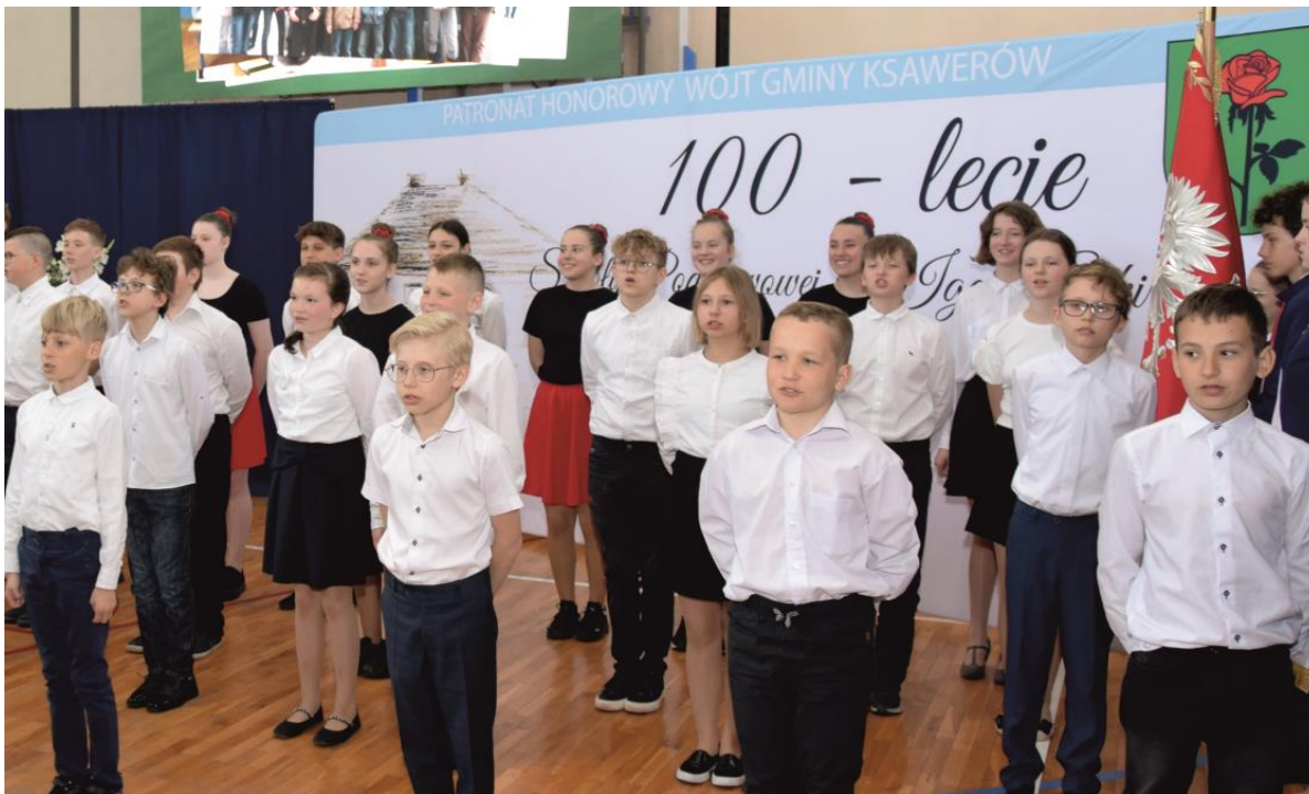
Fotografia przedstawia uczniów w trakcie występu artystycznego.