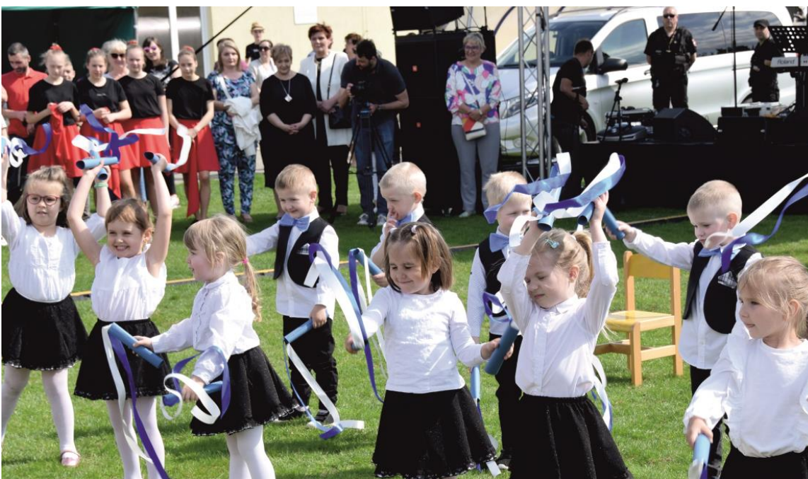
Fotografia przedstawia występ artystyczny przedszkolaków podczas drugiego dnia uroczystości. Fotografie wykonała redakcja.