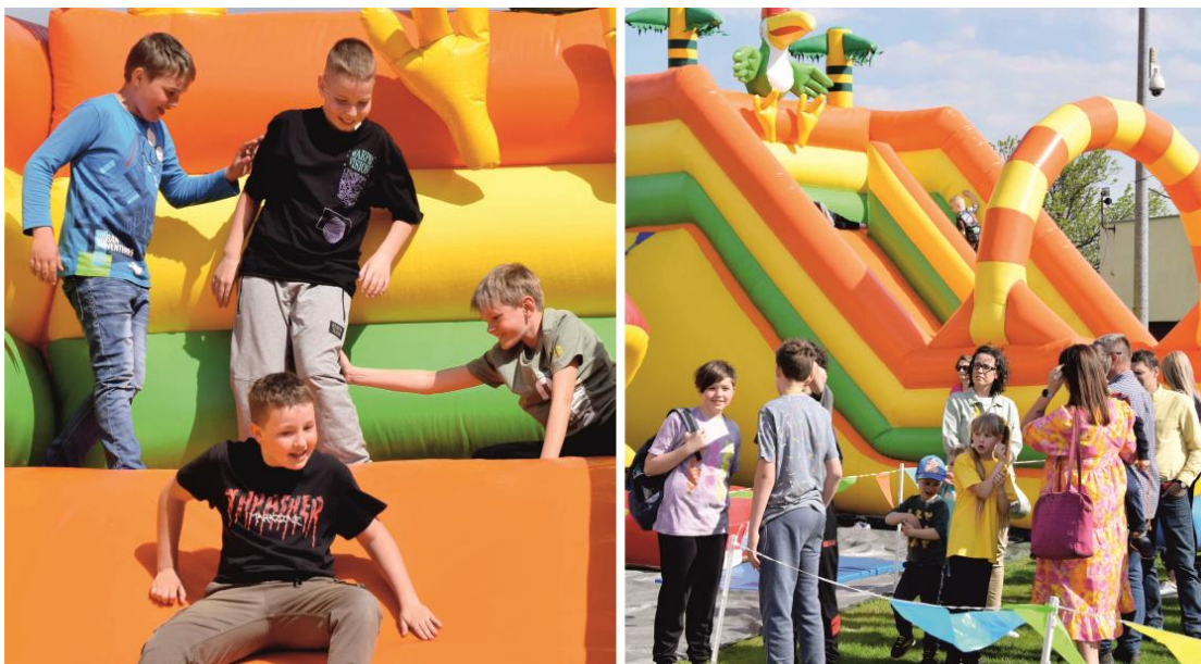
Fotografia przedstawia mieszkańców gminy Ksawerów podczas festynu w drugim dniu obchodów jubileuszu. Fotografie wykonała redakcja.