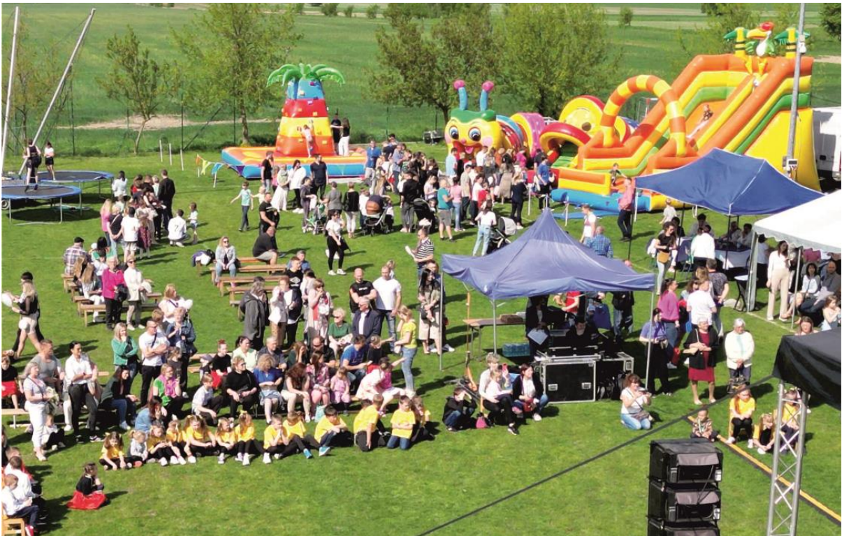
Fotografia przedstawia mieszkańców gminy Ksawerów podczas festynu w drugim dniu obchodów jubileuszu.