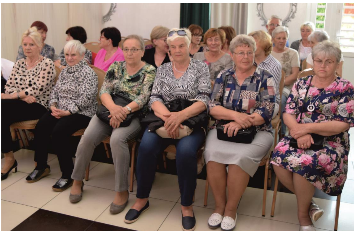
Fotografia przedstawia publiczność podczas koncertu.