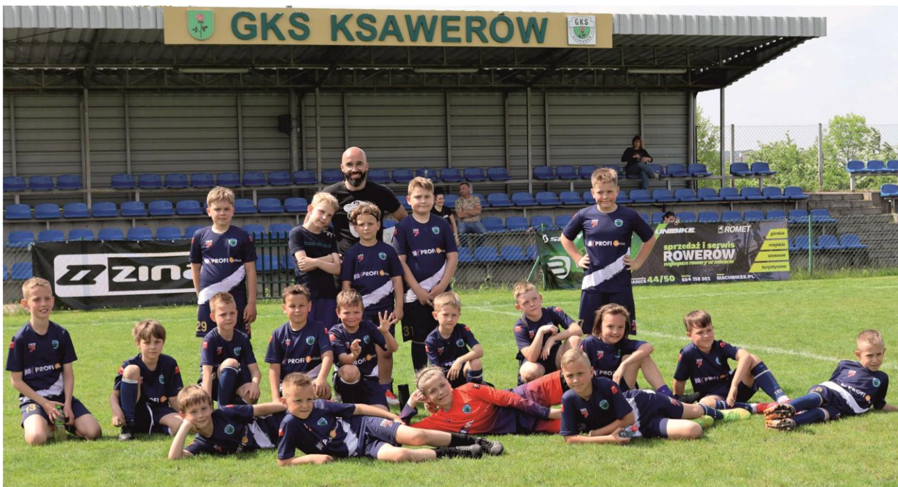
Fotografia przedstawia Drużyną GKS Ksawerów rocznik 2013/2014.