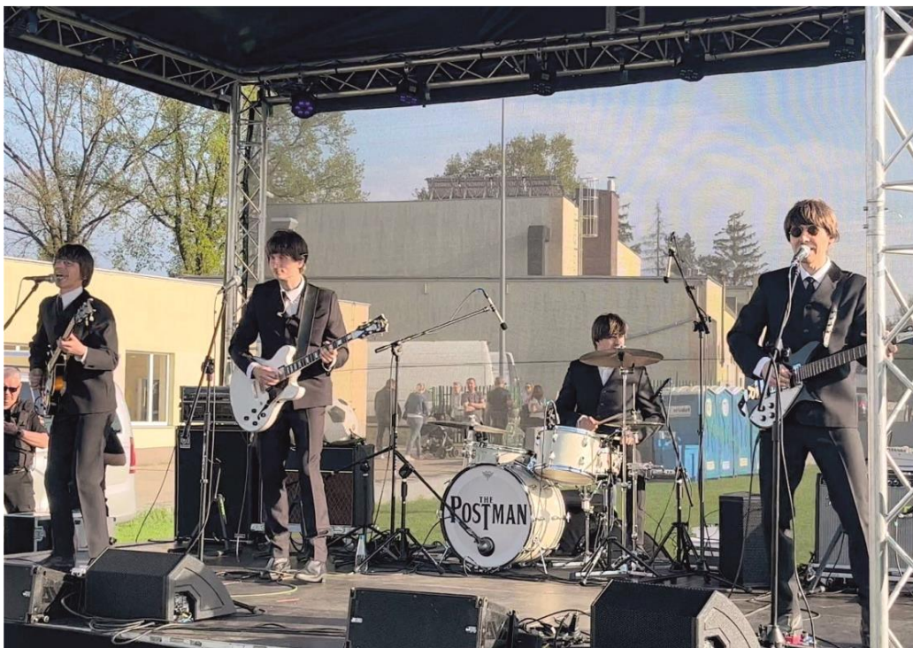
Fotografia przedstawia koncert gwiazdy wieczoru – zespół The Postman.