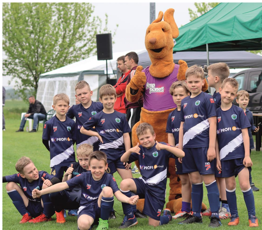
Fotografia przedstawia uczestników festynu.