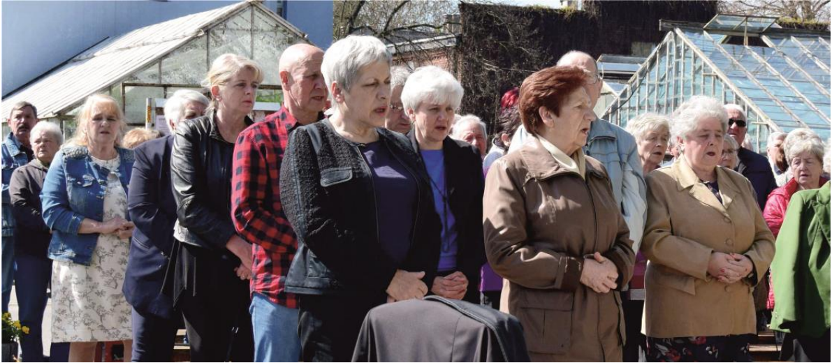
Fotografia przedstawia uczestników majowego nabożeństwa na Żdżarach.