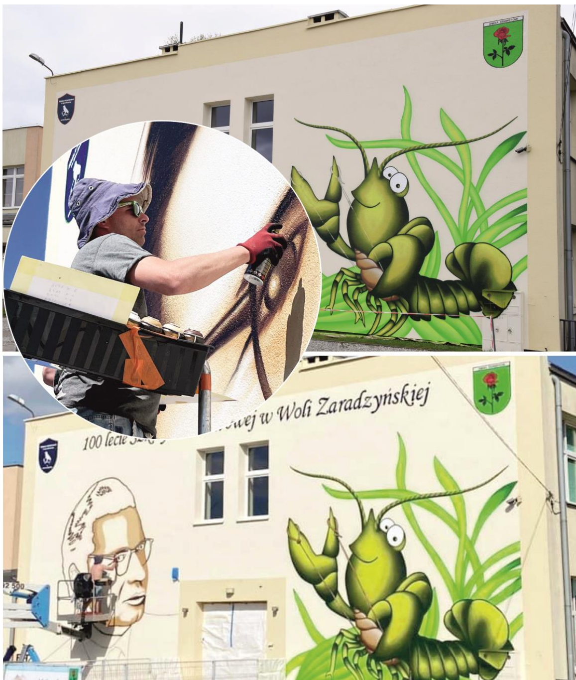
Fotografia przedstawia mural podczas malowania na budynku szkoły.