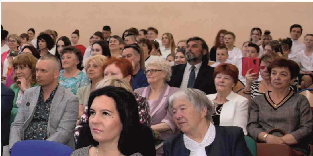
Fotografia przedstawia mieszkańców gminy Ksawerów i zaproszonych gości podczas uroczystości.