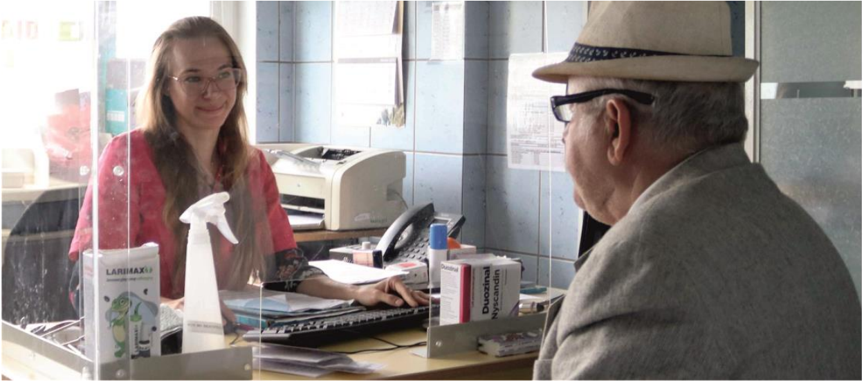
Fotografia przedstawia mieszkańca gminy w trakcie badań specjalistycznych.