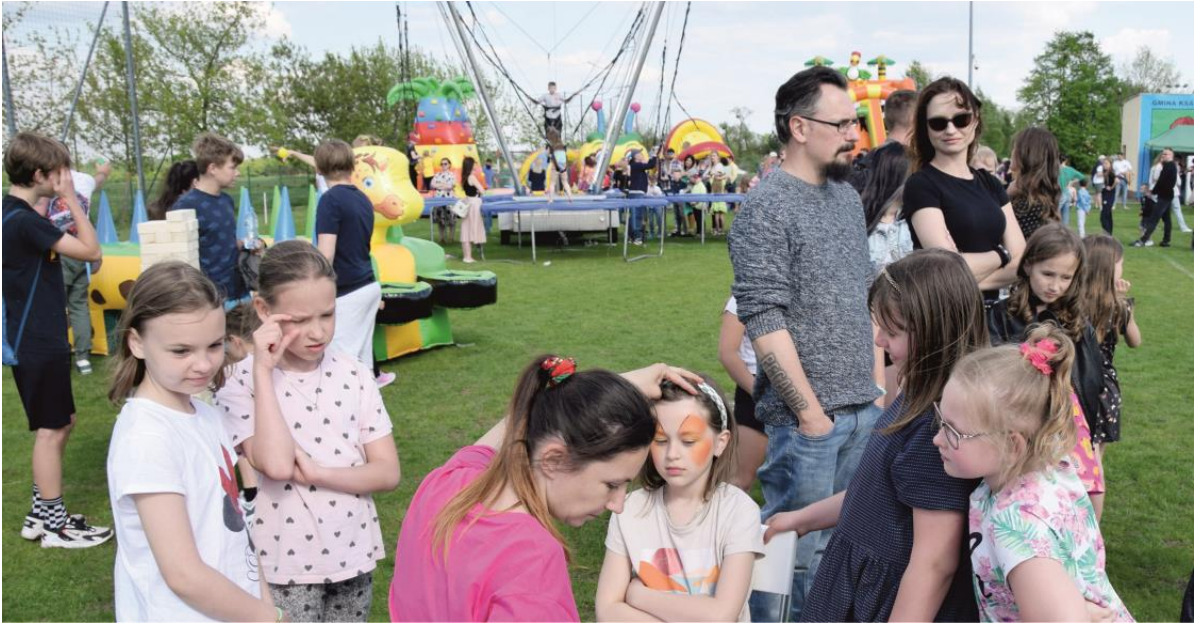
Fotografia przedstawia mieszkańców gminy Ksawerów podczas festynu w drugim dniu obchodów jubileuszu.