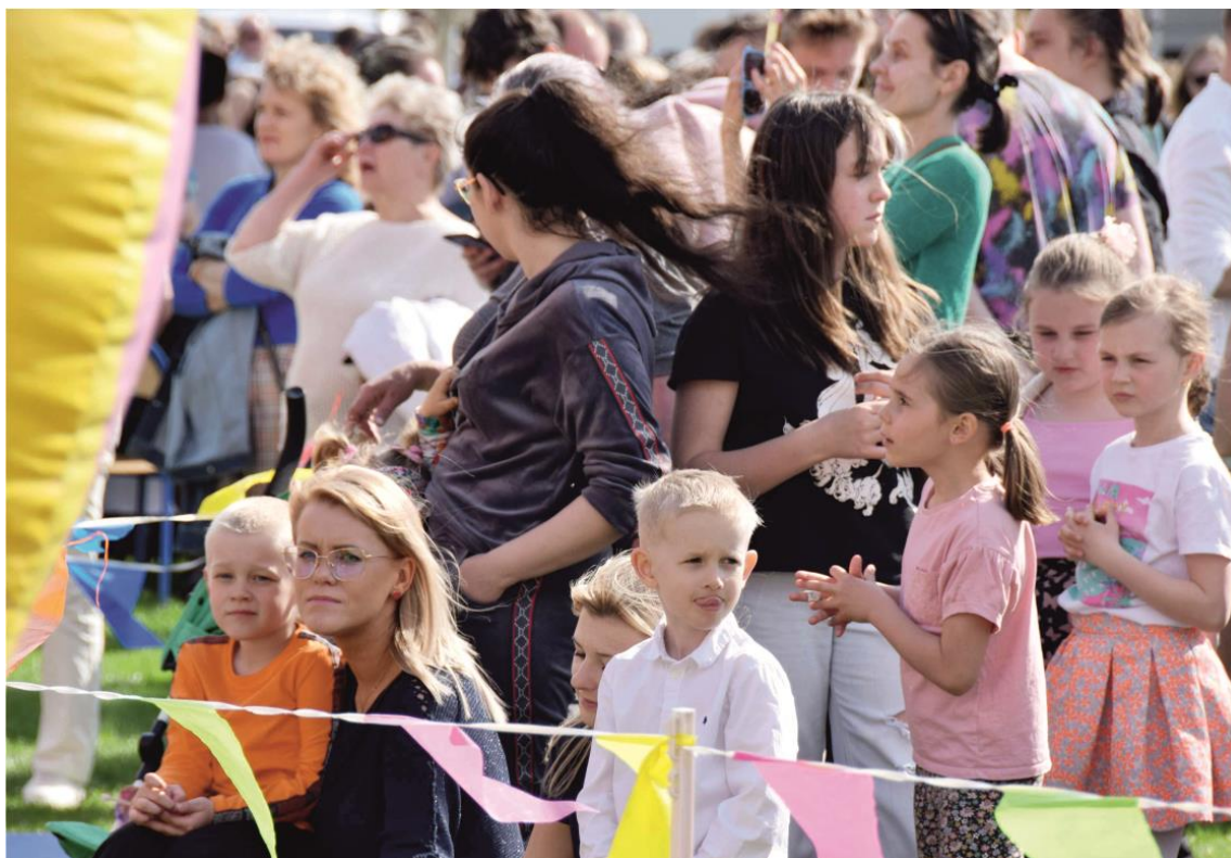
Fotografia przedstawia mieszkańców gminy Ksawerów podczas festynu w drugim dniu obchodów jubileuszu.