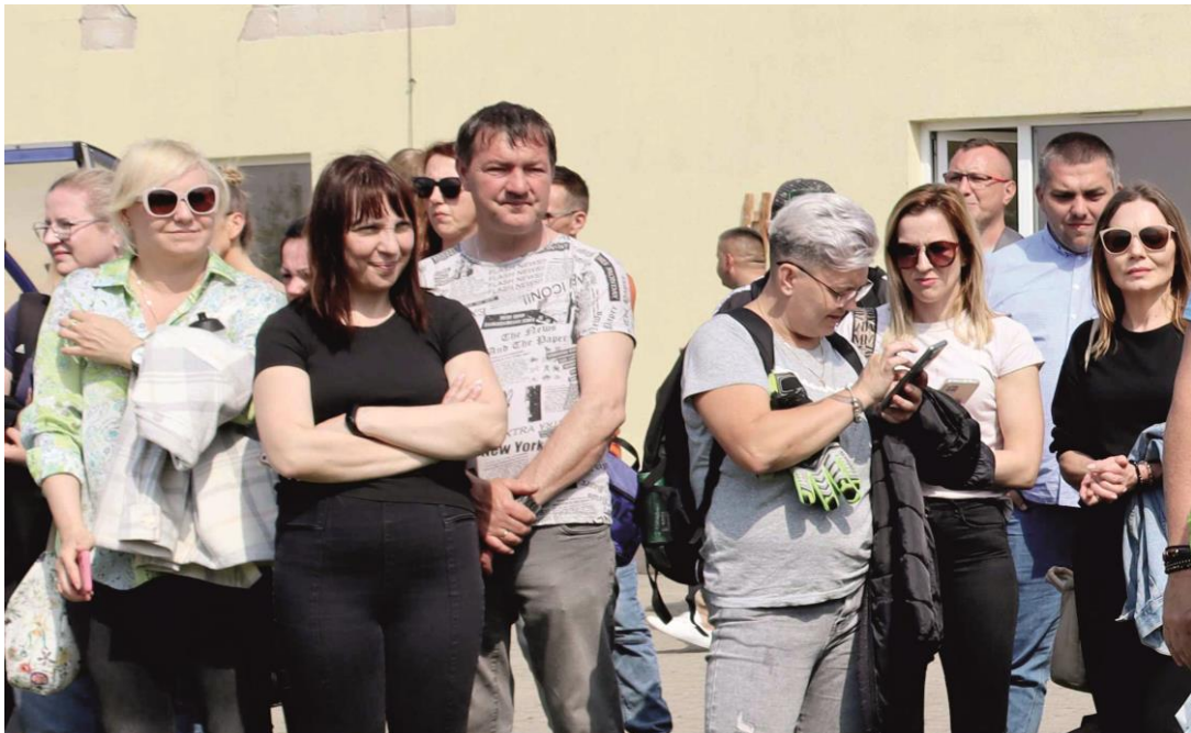
Fotografia przedstawia uczestników festynu. Informację przygotowała redakcja.