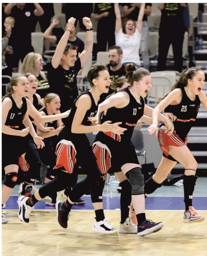
Fotografia obrazuje radość koszykarek Basket 4EVER Ksawerów po ostatnim gwizdkusędziego w meczu o brązowy medal Młodzieżowych Mistrzostw Polski 2023. Fotografia jest archiwalna. Informację przygotował Basket 4EVER Ksawerów.