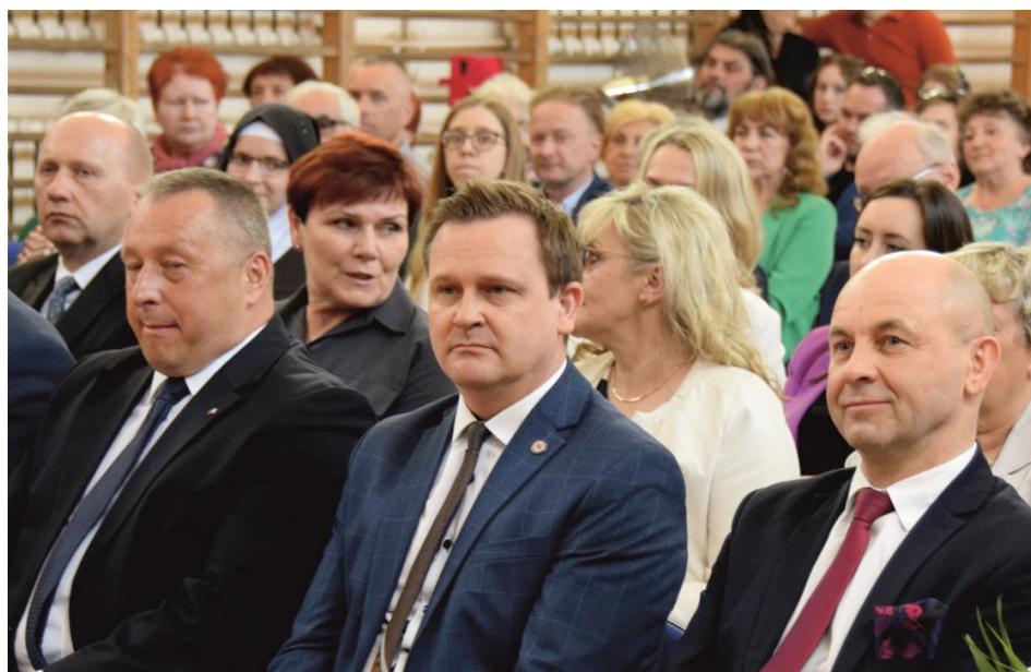
Fotografia przedstawia gości honorowych, mieszkańców gminy Ksawerów podczas oficjalnej części uroczystości w szkole.