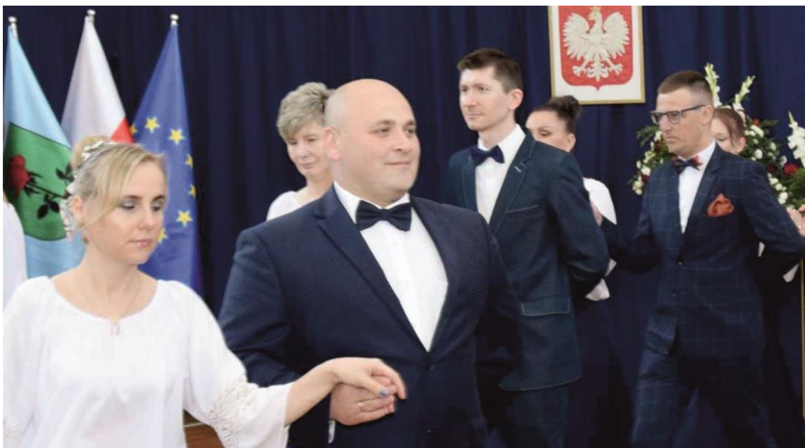
Fotografia przedstawia taniec – uroczystego poloneza, którego wykonali absolwenci szkoły.