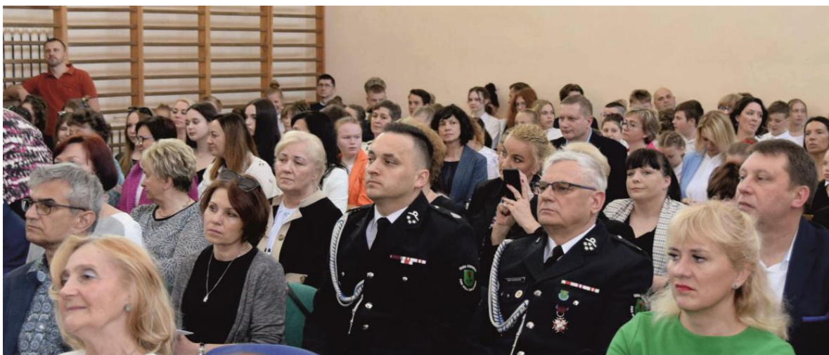
Fotografia przedstawia mieszkańców gminy Ksawerów i zaproszonych gości podczas uroczystości.