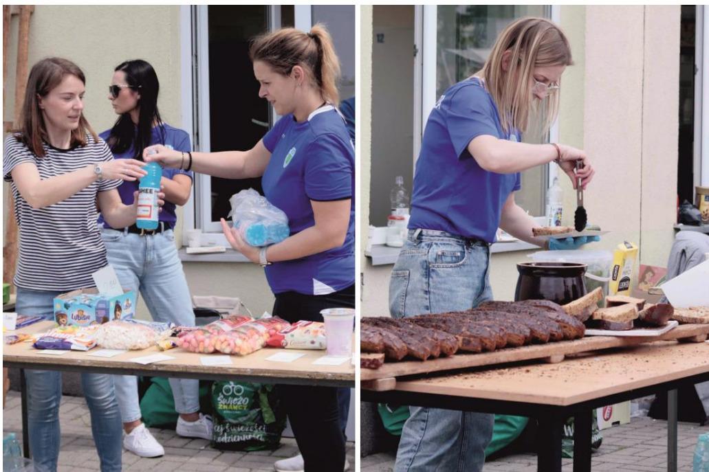
Fotografia przedstawia uczestników strefy gastronomicznej.