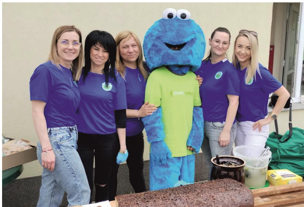
Fotografia przedstawia uczestników festynu. Fotografia jest archiwalna.