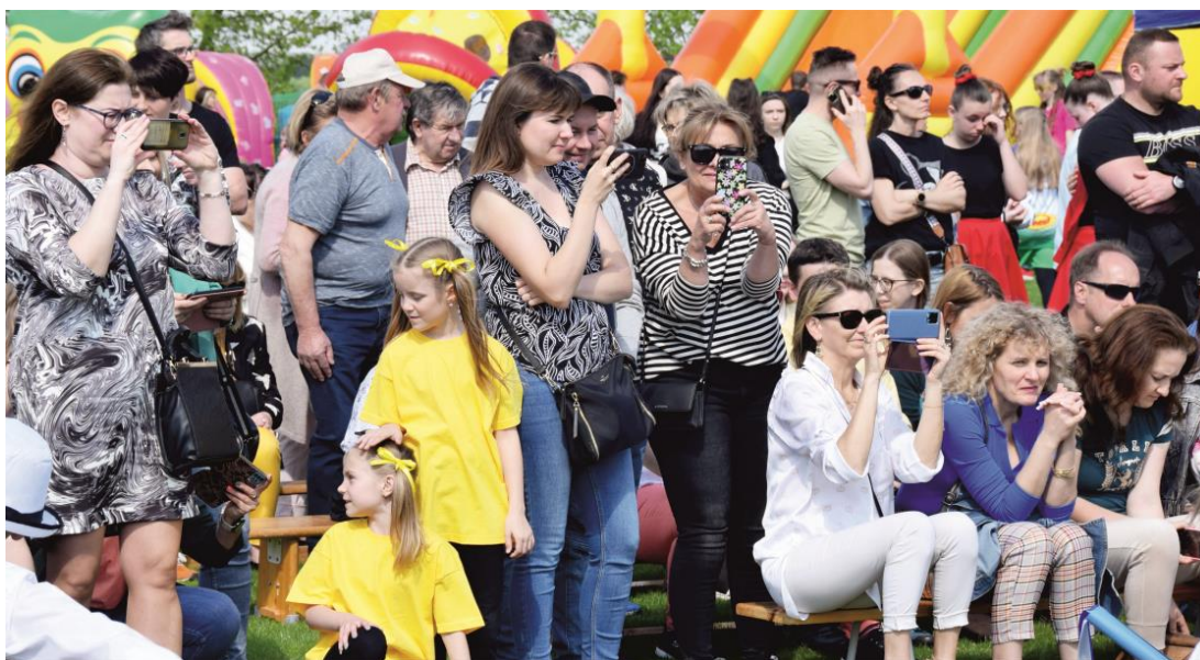
Fotografia przedstawia mieszkańców gminy Ksawerów podczas festynu w drugim dniu obchodów jubileuszu. Fotografie wykonała redakcja.