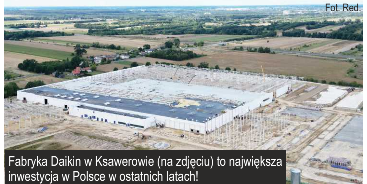
Fabryka Daikin w Ksawerowie (na zdjęciu) to największa inwestycja w Polsce w ostatnich latach!

Fabryka japońskiego producenta pomp ciepła pnie się imponująco w górę. 4 kwietnia br. oficjalnie rozpoczęto budowę, a dzisiaj - po niespełna 5 miesiącach prac budowlanych, widać olbrzymią halę produkcyjną z częściowym zadaszeniem.