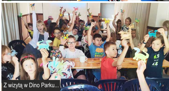
Z wizytą w Dino Parku...