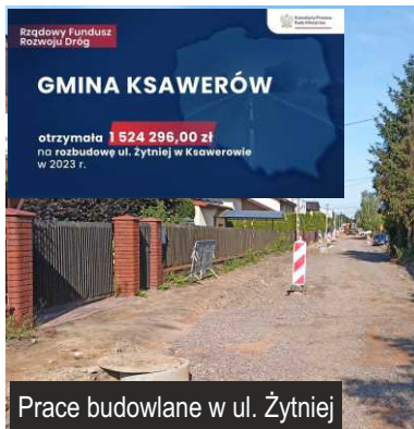
Prace budowlane w ul. Żytniej