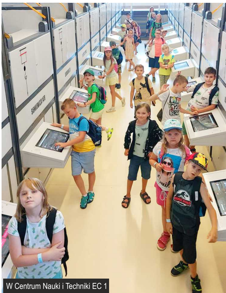
W Centrum Nauki i Techniki EC 1