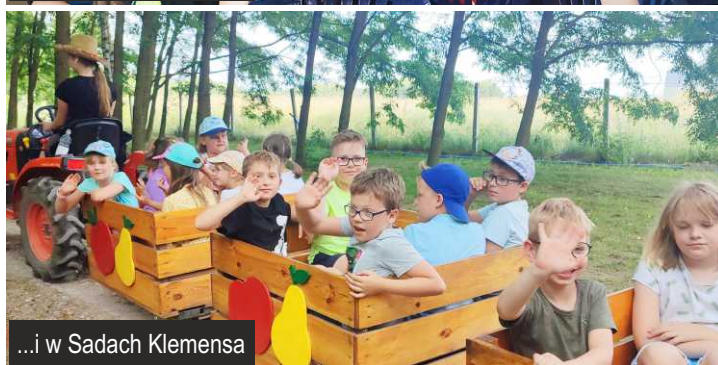
...i w Sadach Klemensa