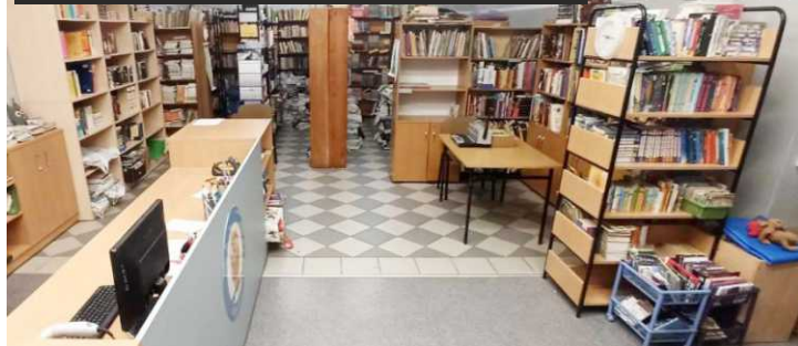
Referat Promocji, Oświaty i Spraw Społecznych