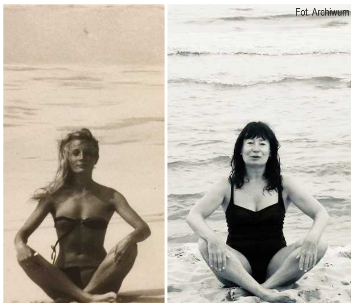
Nad Bałtykiem w Łebie, tuż przed wyjazdem do Kanady w 1989 r. (z lewej) i 34 lata później, podczas wakacji w Ksawerowie