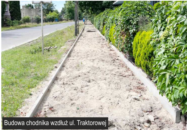
Budowa chodnika wzdłuż ul. Traktorowej