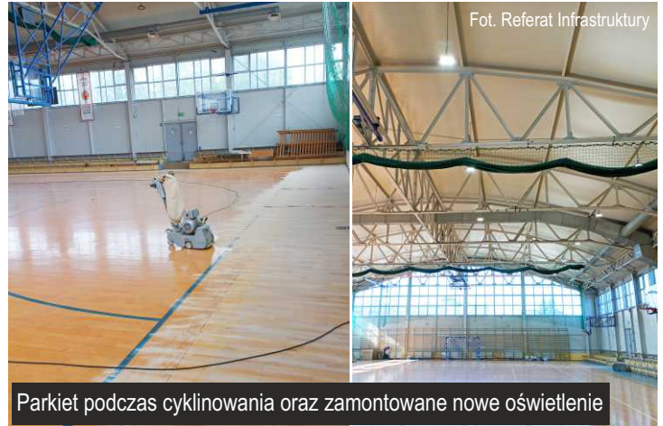
Parkiet podczas cyklinowania oraz zamontowane nowe oświetlenie