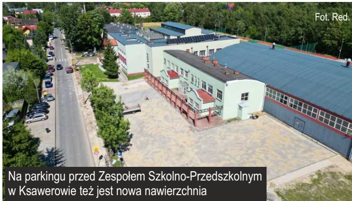
Na parkingu przed Zespołem Szkolno-Przedszkolnym w Ksawerowie też jest nowa nawierzchnia