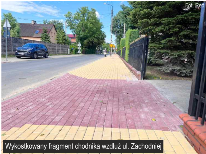
Wykostkowany fragment chodnika wzdłuż ul. Zachodniej