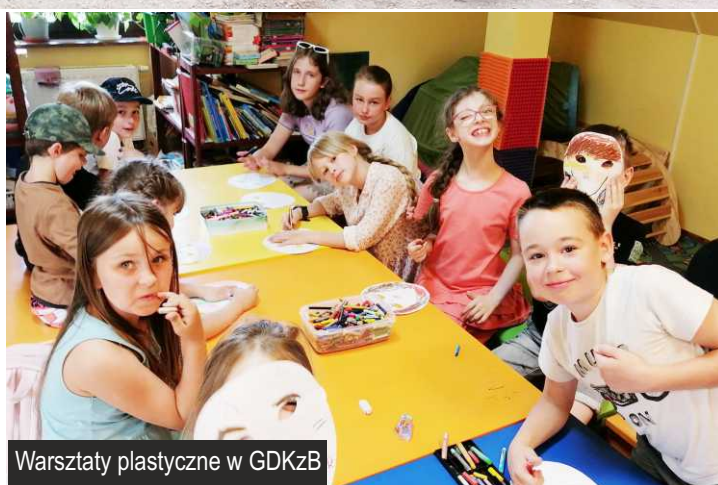
Warsztaty plastyczne w GDKzB