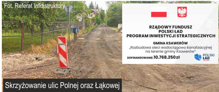
Skrzyżowanie ulic Polnej oraz Łąkowej

Wspomniana realizacja jest częścią rekordowej w historii naszej gminy inwestycji (ponad 15 mln zł w tym ponad 10 mln zł dotacji), dzięki której na terenie gminy Ksawerów powstaną ponad 4 km sieci wodociągowej i ok. 10 km sieci kanalizacji sanitarnej wraz odtworzeniem nawierzchni drogowych.