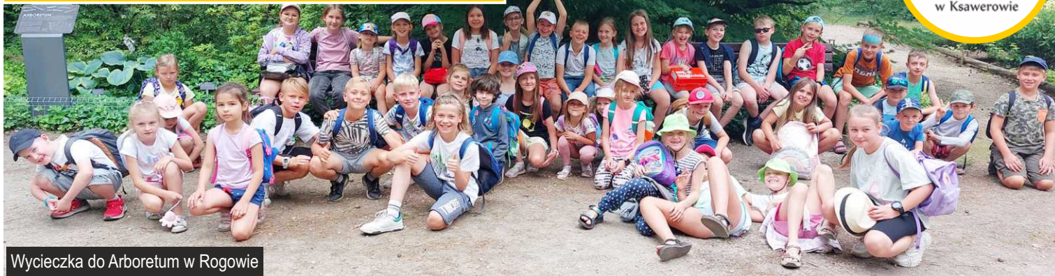
Wycieczka do Arboretum w Rogowie

Dziesięć tygodniowych turnusów i mnóstwo wakacyjnych atrakcji. W GDKzB w Ksawerowie trwają Letnie Warsztaty dla najmłodszych mieszkańców naszej gminy.