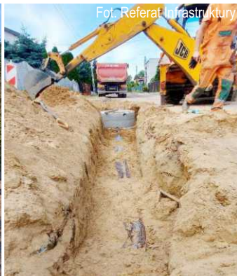
Fot. Referat Infrastruktury